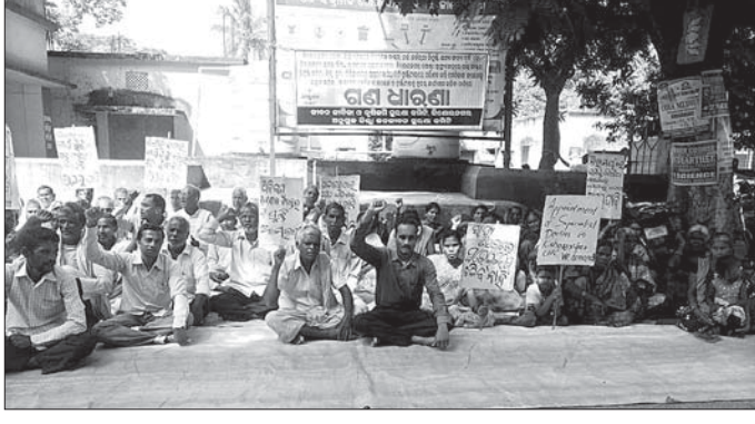
କର୍ମଚାରୀ ପକ୍ଷରୁ ସ୍ୱାସ୍ଥ୍ୟକେନ୍ଦ୍ର ସମ୍ମୁଖରେ ବିକ୍ଷୋଭ କରାଯାଇଛି।

ଅନୁଗୋଳ ଜିଲ୍ଲା କିଶୋରନଗର ଗୋଷ୍ଠୀ ସ୍ୱାସ୍ଥ୍ୟକେନ୍ଦ୍ରରେ ଅନେକ ସମସ୍ୟା ଲାଗି ରହିଛି। ବିଭିନ୍ନ ଦାବି ପୂରଣ ପାଇଁ ବହୁବାର ସ୍ୱାସ୍ଥ୍ୟ ବିଭାଗ ଓ ଜିଲ୍ଲା ପ୍ରଶାସନକୁ ଅବଗତ କରାଯାଇଥିଲେ ମଧ୍ୟ ତାହା ପୂରଣ ହେଉନାହିଁ।