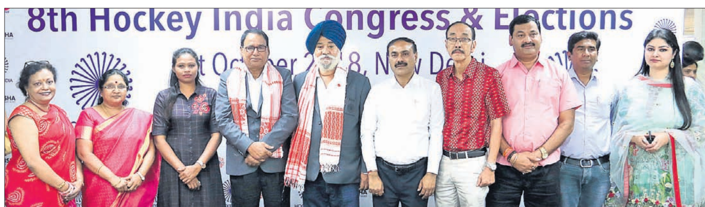
ହକି ଇଣ୍ଡିଆର ନବନିର୍ବାଚିତ କର୍ମକର୍ତ୍ତାବୃନ୍ଦ ।

ହକି ବିଶ୍ୱକପ୍ ପ୍ରତି ଦର୍ଶକଙ୍କ ଅହେତୁକ ଭିକାରୀ ପରିଲକ୍ଷିତ ହୋଇଛି ।