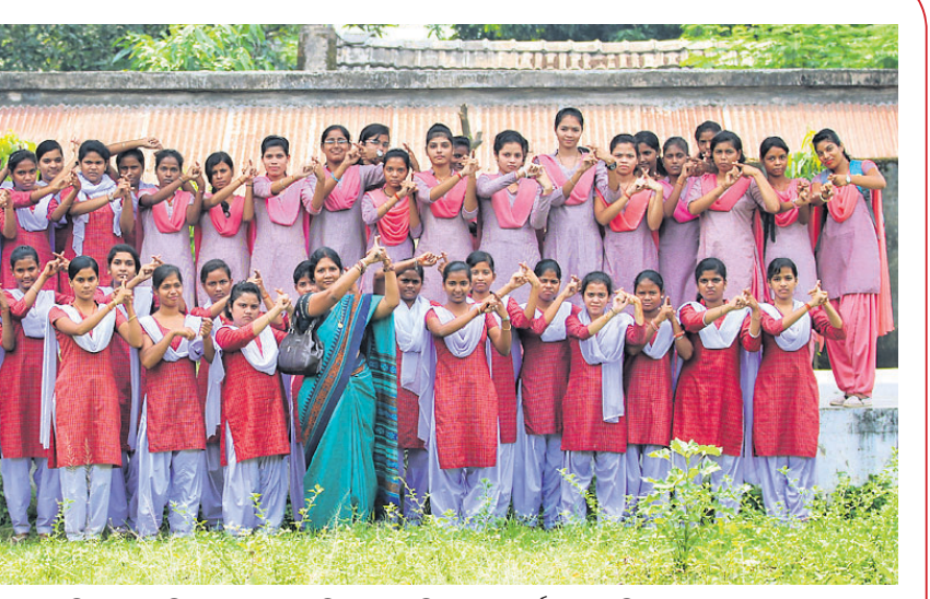
ଅନୁଗୋଳ ମହିଳା ମହାବିଦ୍ୟାଳୟର ଛାତ୍ରୀମାନେ 'ଧରିତ୍ରୀ' ଓ 'ଓଡ଼ିଶା ପୋଷ୍ଟ'ର ପାଠ୍ୟପୁସ୍ତକ ଅଭିଯାନକୁ ସମର୍ଥନ କରୁଛନ୍ତି।

କର୍ମର @ ମାନସ @ ଶିଳ୍ପା ସେଲଫି ଇଠାକୁ ଆମସାଙ୍ଗକୁ ପଠାନ୍ତୁ। dklselfie@gmail.com (ବନ୍ଧା ବନ୍ଧା ସେଲଫି ପ୍ରକାଶ ପାଇବ)