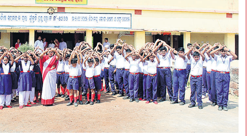
ଦେଢ଼ାମାଲ ସହରସ୍ଥିତ ଭଗବାନପୁର ସୁନ୍ଦରିଖାଲ ନିକଟରେ ଥିବା ସରସ୍ୱତୀ ଶିଶୁ ବିଦ୍ୟାଳୟର ଛାତ୍ରୀଛାତ୍ର ଓ ଗୁରୁମାଗୁରୁଜୀମାନେ ପାଠ୍ୟପୁସ୍ତକ ପରିବେଶ ପାଇଁ ସଚେତନ କରାଉଛନ୍ତି।