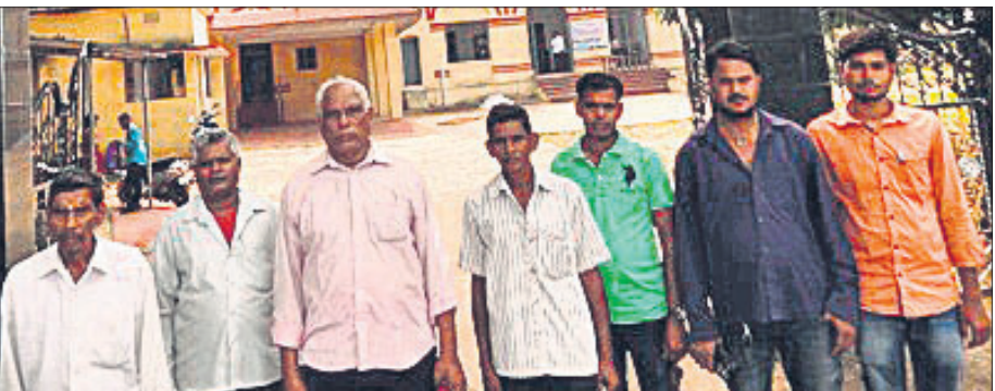
ହିନ୍ଦୋଳ, ୧୧୦ (ଡି.ଏନ.ଏ.)

ଦେଢ଼ାନାଳ ଜିଲା ହିନ୍ଦୋଳ ବ୍ଲକ ଖାତବନ୍ଦରଠାରେ ରୁଜ୍ଜର କମ୍ପାନୀ ଜମିହରା ପ୍ରକଳ୍ପ ଅଣଦେଖା କରୁଛି । ବାରମ୍ବାର ଦାବି ଆପତ୍ତି ସତ୍ତ୍ୱେ କମ୍ପାନୀ କର୍ତ୍ତୃପକ୍ଷ କ୍ଷତିଗ୍ରସ୍ତ ସମସ୍ୟା ଶୁଣୁ ନ ଥିବା ସେମାନେ ଅଭିଯୋଗ କରିଛନ୍ତି । ଏଣୁ ଆସନ୍ତା ୯ ତାରିଖରୁ ଜମିହରାମାନେ କମ୍ପାନୀ କାର୍ଯ୍ୟାଳୟରେ ତାଲା ପକାଇ ଆନ୍ଦୋଳନ କରିବେ ବୋଲି ସୋମବାର ତେତାବନା ଦିଆଯାଇଛି ।