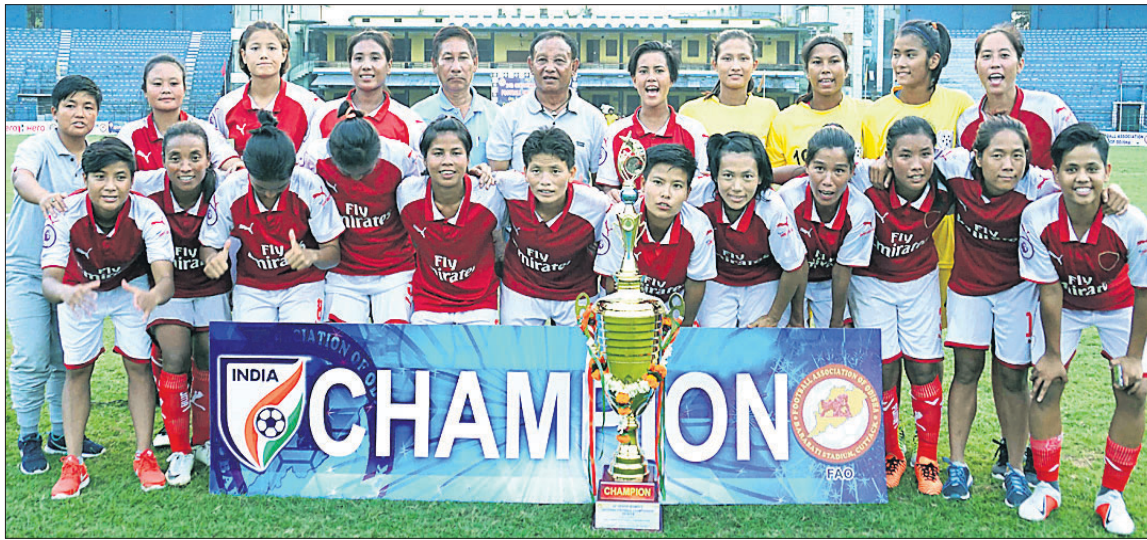
କଟକରେ ଅନୁଷ୍ଠିତ ଜାତୀୟ ସିନିୟର ମହିଳା ଫୁଟବଲରେ ଚାମ୍ପିୟନ୍ ମଣିପୁର ଓ ରନର୍ସଅପ୍ ଓଡ଼ିଶା ଦଳ ।