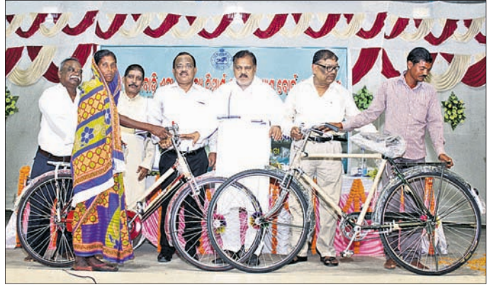
ନିର୍ମାଣ ଶ୍ରମିକଙ୍କୁ ସାଇକେଲ ପ୍ରଦାନ କରାଯାଇଛି।