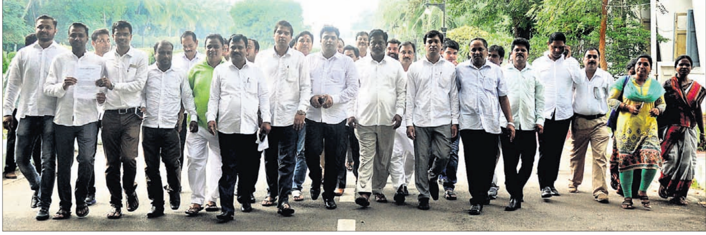
ରାଜଭବନରେ ସୋମବାର ରାଜ୍ୟପାଳଙ୍କୁ ସ୍ମାରକପତ୍ର ଦେଇ ବିଜେଡି ନେତୃତ୍ୱ ଦେଖିଛନ୍ତି।

ପେଟ୍ରୋଲ, ଡିଜେଲ ଏବଂ ରକ୍ଷଣ ଗ୍ୟାସ୍‌ର ମୂଲ୍ୟ ବୃଦ୍ଧି ପ୍ରତିବାଦରେ ରାସ୍ତାକୁ ଓହ୍ଲାଇଛନ୍ତି ବିଜେଡି କର୍ମୀ।