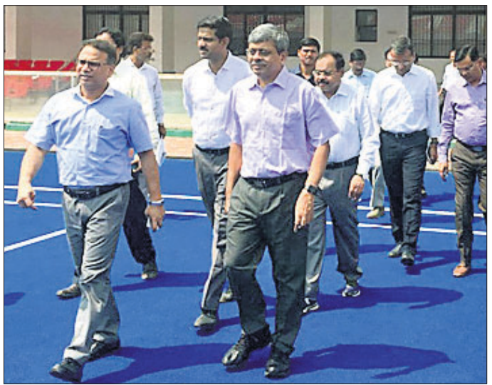
କଳିଙ୍ଗ କ୍ଷୁଦ୍ରମଣ୍ଡଳ ପରିଦର୍ଶନ ଅବସରରେ ମୁଖ୍ୟ ଶାସନ ସଚିବ ଆଦିତ୍ୟ ପ୍ରସାଦ ପାଢ଼ୀ ।