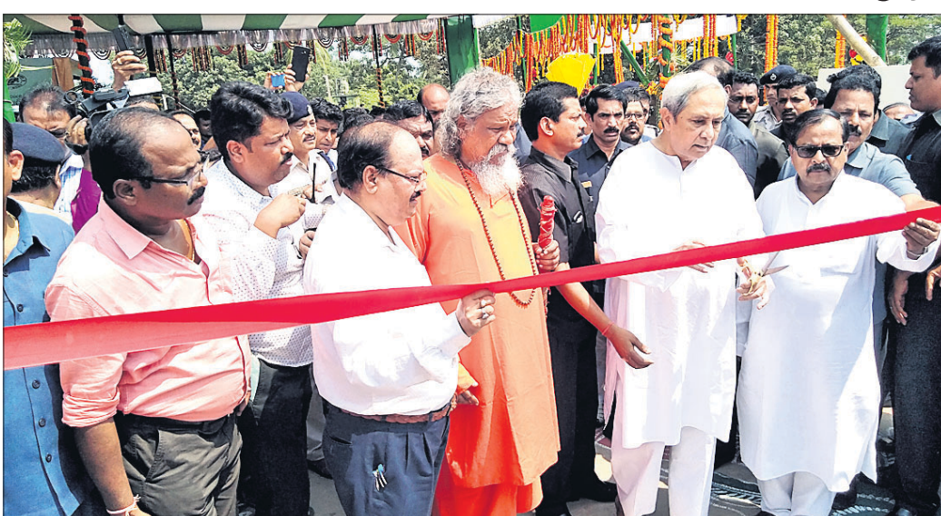
ମୁଖ୍ୟମନ୍ତ୍ରୀ ନବୀନ ପଟ୍ଟନାୟକ 'ମହାତ୍ମା ସେତୁ' ଉଦ୍ଘାଟନ କରୁଛନ୍ତି।