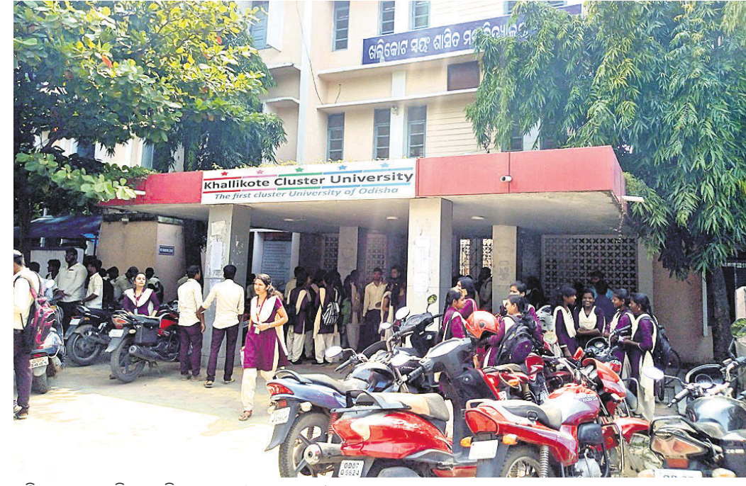
ଖଲ୍ଲିକୋଟ ସ୍ୱୟଂଶାସିତ ମହାବିଦ୍ୟାଳୟ କ୍ୟାମ୍ପସ୍ ରେଳସ୍ଟେସନ ।

ବାଲିଆ ଛାତ୍ର ସଂସଦ ନିର୍ବାଚନ ବିରୁଦ୍ଧ । ଆସନ୍ତା ୧୧ରେ ନିର୍ବାଚନ ହେବା ନେଇ ଯୋଜନା କଲେଜ ପକ୍ଷରୁ ବିଜ୍ଞପ୍ତି ପ୍ରକାଶ ପାଇଛି ।