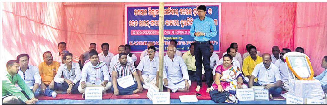
ପିପୁଲସ୍ ଫୋରମ କର୍ମକର୍ତ୍ତା, ବୁଦ୍ଧିବାସୀ ।

କନ୍ଧମାଳ ଜିଲ୍ଲାରେ ମେଡିକାଲ କଲେଜ ଗ୍ଲାପନ ଏବଂ ରେଳ ସଂଯୋଗ ଆନ୍ଦୋଳନ ପୁଣି ଡେଜିଲି । କନ୍ଧମାଳ ପିପୁଲସ୍ ଫୋରମ ପକ୍ଷରୁ ମଙ୍ଗଳବାର ଜିଲ୍ଲାପାଳଙ୍କ କାର୍ଯ୍ୟାଳୟ ସମ୍ମୁଖରେ ଧାରଣା ଦିଆଯାଇଛି । ଉଭୟ କେନ୍ଦ୍ର ଏବଂ ରାଜ୍ୟ ସରକାର ଜିଲ୍ଲାବାସୀଙ୍କ ସ୍ୱାର୍ଥକୁ ଦେଖି ତୁରନ୍ତ ରେଳ ସଂଯୋଗ ଓ ମେଡିକାଲ କଲେଜ ଗ୍ଲାପନ କରିବାକୁ ଆଦିବାସୀ ଅଧିକାର ଅଞ୍ଚଳ । ସ୍ୱାଧୀନତାର ୭୧ ବର୍ଷ ପରେ ବି ଏହି ଜିଲ୍ଲା ଅନ୍ୟ ଜିଲ୍ଲା ତୁଳନାରେ ପଛୁଆ ହୋଇ ରହିଛି । ଏହି ଜିଲ୍ଲାରେ ଏକ ମେଡିକାଲ କଲେଜ ଗ୍ଲାପନ