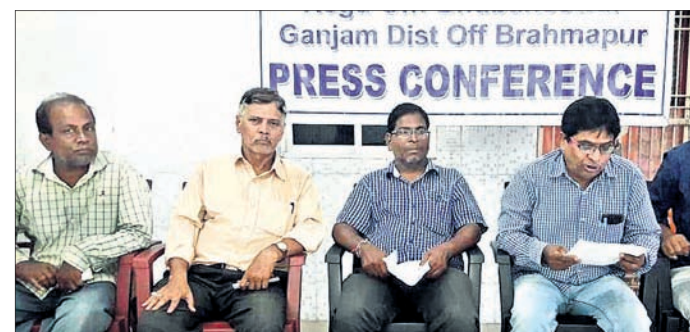
ଖବରଦାତା ସମ୍ମିଳନୀରେ ପରଖିତ କର୍ମକର୍ମୀମାନେ ।

ଦକ୍ଷିଣ ଓଡ଼ିଶାର ପ୍ରମୁଖ ସହର ବ୍ରହ୍ମପୁରକୁ ରେଳ ବିଭାଗ କ୍ରମାଗତ ଅବହେଳା କରୁଛି ବୋଲି ମଙ୍ଗଳବାର ସ୍ଥାନୀୟ ସମାଜସେବୀ