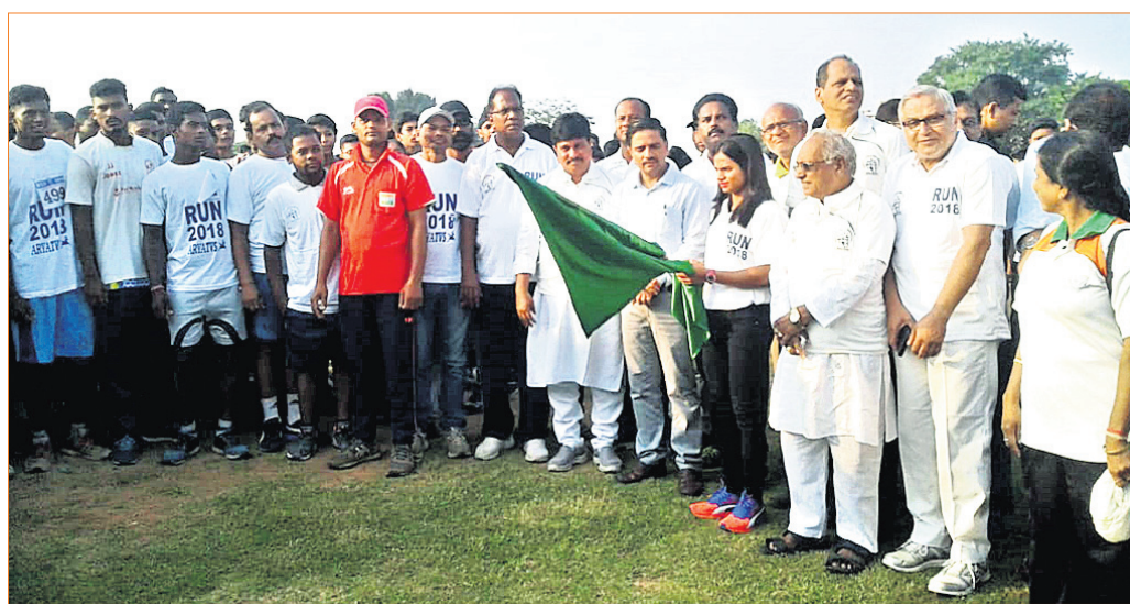
ମିନି ମାରାଥନକୁ ଦୂତୀ ଚାନ୍ଦ ପତାକାଦେଖାଇ ଶୁଭାରମ୍ଭ କରୁଛନ୍ତି।

ମହାନଗରକୁ ପୁସ୍ତକ ଓ ପଲିଥିନ୍ ମୁକ୍ତ ସହରରେ ପରିଣତ କରିବା ଲକ୍ଷ୍ୟ ନେଇ ବ୍ରହ୍ମପୁର ମହାନଗର ନିଗମ ଓ ଜିଲା କ୍ରୀଡ଼ା ପରିଷଦ ପକ୍ଷରୁ ଗାନ୍ଧୀ ଜୟନ୍ତୀ ଅବସରରେ ଏକ ମିନି ମାରାଥନ ମନାଥର ଆୟୋଜିତ ହୋଇଯାଇଛି।