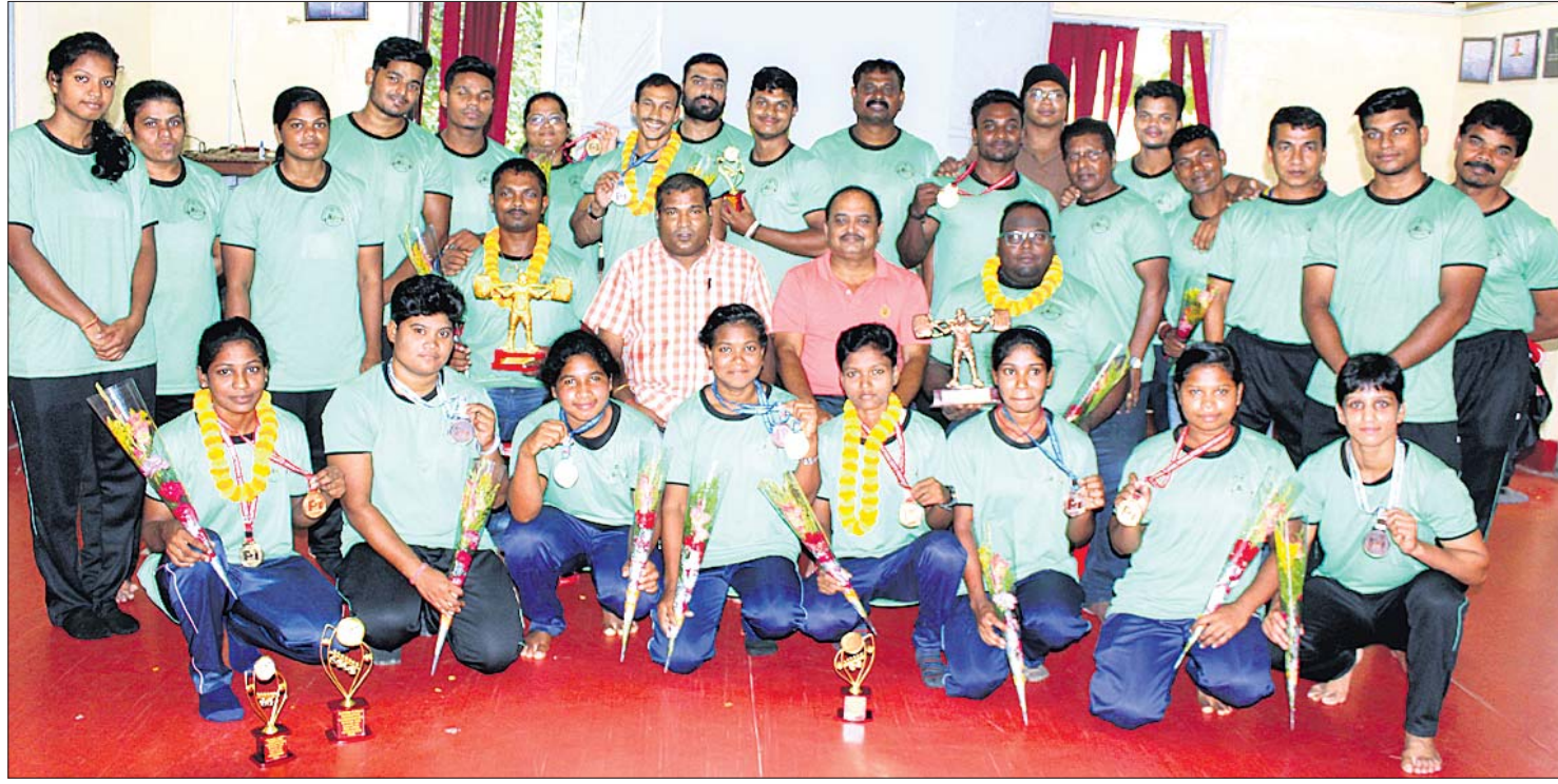
ଲକ୍ଷ୍ମଣେ ଅନୁଷ୍ଠିତ ଜାତୀୟ କ୍ଷତ୍ରିୟ ଶକ୍ତି ଉତ୍ତୋଳନ ପ୍ରତିଯୋଗିତାରେ ଭାଗନେଇ ଭୁବନେଶ୍ୱର ପ୍ରତ୍ୟାବର୍ତ୍ତନ କରିଥିବା ଓଡ଼ିଶା ପ୍ରତିଯୋଗୀମାନଙ୍କୁ ରାଜ୍ୟ ସଂଘ ପକ୍ଷରୁ ମଙ୍ଗଳବାର ଉତ୍ତମ କରାଗେ ସୁଲ ପରିସରରେ ସମ୍ମାନ କରାଯାଇଛି ।

ରାଜକୋଟ, ୨୧୦ (ପି.ଟି.): ଫ୍ରେଣ୍ଡ୍‌ସ୍‌ଓଫ୍ ଦଳର ପ୍ରମୁଖ ସେସର କେମିଟ ରୋଟ ରୋଟ ବିପକ୍ଷରେ ଖେଳାଯିବାକୁ ଥିବା ପ୍ରଥମ ତଥା ରାଜକୋଟ ଟେଣ୍ଟରୁ ବାଉଁ ପ୍ରତିଷ୍ଠିତା ଚାକ୍ଷିକ୍ଷକ ମୁଖ୍ୟ ଖବର ଫ୍ରେଣ୍ଡ୍‌ସ୍‌ଓଫ୍ କ୍ରିକେଟ ଦେବା ପରେ ସେ ସ୍ୱଦେଶ ଫେରିଛନ୍ତି ।