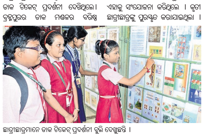
ଛାତ୍ରାଛାତ୍ରୀମାନେ ଡାକ ଟିକେଟ୍ ପ୍ରଦର୍ଶନୀ ବୁଲି ଦେଖୁଛନ୍ତି।

ବ୍ରହ୍ମପୁର ଅଫିସ୍, ୨୧୧୦-ବ୍ରହ୍ମପୁର ରୋଗୀମାନଙ୍କୁ ପକ୍ଷରୁ ଗାନ୍ଧୀ ଜୟନ୍ତୀରେ ପଲିଥିନ୍ ବର୍ଜନ ପାଇଁ ସଚେତନତା କାର୍ଯ୍ୟକ୍ରମ ଅନୁଷ୍ଠିତ ହୋଇଯାଇଛି। ପ୍ରେମ ନଗର କୁବ କାର୍ଯ୍ୟକ୍ରମରୁ ଗାନ୍ଧୀ ଜୟନ୍ତୀ ପାଇଁ ଏକ ରେଜିଷ୍ଟ୍ରେସନ୍ କାର୍ଯ୍ୟକ୍ରମ, ରାମଲିଙ୍ଗମ୍ ଟ୍ୟାକ ରାସ୍ତା, ଅର୍ଦ୍ଧନ ଟ୍ୟାକ ରାସ୍ତା, ପୁରୁଣା ବସଷ୍ଟାଣ୍ଡ, ସୁଭାଗା ଓ ଛକ, ଉତ୍କଳ ଆଶ୍ରମ, ଗେବ ବଜାର, ଆସିକା ରୋଡ, କର୍ପୋରେସନ୍ ରୋଡ, ଗିରି ମାର୍କେଟ୍ ହୋଇ ପୁଣି କୁବ କାର୍ଯ୍ୟକ୍ରମରେ ପହଞ୍ଚିଥିଲା।