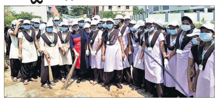
ସଚେତନତା କାର୍ଯ୍ୟକ୍ରମରେ ଛାତ୍ରାଛାତ୍ରୀ ।

ଗାଣ୍ଡାଇକୋଟ ଅବସରରେ ବ୍ରହ୍ମପୁର ଶରଣାଗତ ଲୋକଙ୍କୁ ବେଦବ୍ୟାସ ଆବିଷ୍କାର ମହାବିଦ୍ୟାଳୟ ପକ୍ଷରୁ ସ୍ୱଚ୍ଛଭାରତ ଅଭିଯାନ ମଙ୍ଗଳବାର