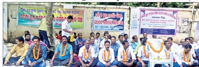
ଶିକ୍ଷକମାନେ ଧାରଣାରେ ବସିଛନ୍ତି ।

ଓଡ଼ିଶା ସ୍କୁଲ କଲେଜ ଶିକ୍ଷକ ଅଧ୍ୟାପକ କର୍ମଚାରୀ ମିଳିତ ମଞ୍ଚ କନ୍ଧମାଳ ଶାଖା ପକ୍ଷରୁ ଗାନ୍ଧୀ କନ୍ଦର୍ପା ଅବସରରେ ଜିଲ୍ଲାପାଳଙ୍କ କାର୍ଯ୍ୟାଳୟ ସମ୍ମୁଖରେ ଧାରଣା ଦିଆଯାଇଛି । ସରକାର ଦାବି ମାନି ନ ନେବା ପର୍ଯ୍ୟନ୍ତ ଅଗାମୀ ଦିନରେ ମଧ୍ୟ ଏହି ଆନ୍ଦୋଳନକୁ ଚାଳୁ କରିବାକୁ ବୋଲି ପର୍ଯ୍ୟନ୍ତ କୌଣସି ସମାଧାନ ବାଟ ବାହାରି ପାରିନା ନାହିଁ । ଫଳରେ ଛାତ୍ରଛାତ୍ରୀମାନେ ଶିକ୍ଷା ସଞ୍ଚିତ ହେଉଛନ୍ତି । ଏହାସହ ନେତୃତ୍ୱରେ ସମସ୍ତେ ଧାରଣାରେ ବସିଥିଲେ ।