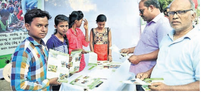
ସହରବାସୀଙ୍କ ମଧ୍ୟରେ ସଚେତନତା ସୃଷ୍ଟି କରାଯାଇଛି।

ଗୋଷ୍ଠୀ ସହଭାଜନକୁ ପ୍ରୋତ୍ସାହନ ଦେବା ଉଦ୍ଦେଶ୍ୟରେ ଗ୍ରାମ୍ ଆକ୍ରମଣ ସମ୍ପ୍ରଦାୟ ମନାଥର ଗାନ୍ଧୀ ଉପଲକ୍ଷେ ଆରମ୍ଭ ହୋଇଯାଇଛି।