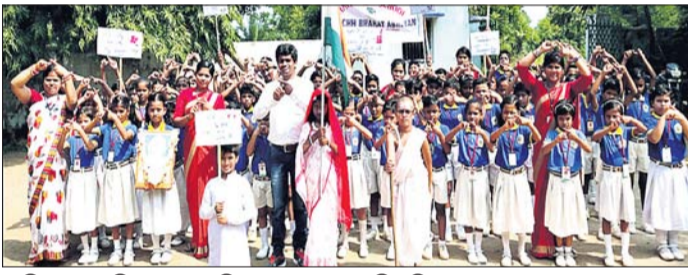
ପ୍ଲାଷ୍ଟିକ ମୁକ୍ତ ଅଭିଯାନରେ ସାମିଲ ହୋଇଥିବା ତନଭି ପବ୍ଲିକ ସ୍କୁଲ ଛାତ୍ରାଛାତ୍ର ।

ଓଡ଼ିଆ ଖବରକାଗଜ ଧରଣୀ ଓ ଇଂଲିଶ ଖବରକାଗଜ ଓଡ଼ିଶା ପୋଷ୍ଟ ପକ୍ଷରୁ ଆୟୋଜିତ ପ୍ଲାଷ୍ଟିକମୁକ୍ତ ଓଡ଼ିଶା କାର୍ଯ୍ୟକ୍ରମରେ ଫୁଲବାଣୀ ଅଫିସରୁ ଉଦ୍ଘାଟନା କରାଯାଇଥିଲା । ଶିକ୍ଷକମାନେ ସାମିଲ ହୋଇଛନ୍ତି । ମଙ୍ଗଳବାର ଗାନ୍ଧୀ କନ୍ଦର୍ପା ଅବସରରେ ଦିବ୍ୟା ଓ କର୍ମଚାରୀମାନେ ଶୋଭାଯାତ୍ରାରେ ପ୍ଲାଷ୍ଟିକ