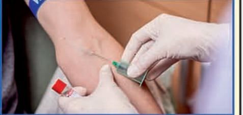
ଆଗରୁ ଆଲର୍ଜି ଚିହ୍ନଟ ପାଇଁ ବାହୁରେ ଛୁଣ୍ଟି ଦ୍ୱାରା ୨୫ ଟିକ୍ସ ଲଗାଯାଇ ଏହା ଜାଣିବାର ଚେଷ୍ଟା କରାଯାଉଥିଲା ଯେ ବ୍ୟକ୍ତିଙ୍କୁ କେଉଁ ଜିନିଷ କାରଣରୁ ଆଲର୍ଜି ହେଉଛି କିନ୍ତୁ ଏବେ କେବଳ ରକ୍ତ ପରୀକ୍ଷା ଦ୍ୱାରା ହିଁ ଆଲର୍ଜିର କାରଣ ଜଣାପଡ଼ିଯାଉଛି ।