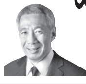
ଲି ହେନ୍ କୁଲି

ଆଜକୁ ଚାରିବର୍ଷ ତଳେ ପ୍ରଧାନମନ୍ତ୍ରୀ ନରେନ୍ଦ୍ର ମୋଦି ୨୦୧୯ ପର୍ଯ୍ୟନ୍ତ 'ସ୍ୱଚ୍ଛ ଭାରତ'ର ପରିକଳ୍ପନାକୁ ସାକାର କରିବା ପାଇଁ ସ୍ୱଚ୍ଛ ଭାରତ ଅଭିଯାନ ଆରମ୍ଭ କରିଥିଲେ। ଏହା ବି ଏକ ସଂଯୋଗ ଯେ, ୨୦୧୯ ଅକ୍ଟୋବର ୨ ହେଉଛି ମହାତ୍ମା ଗାନ୍ଧୀଙ୍କର ୧୫୦ତମ ଜୟନ୍ତୀ, ଯିଏ ସ୍ୱଚ୍ଛତାକୁ ରାଷ୍ଟ୍ରୀୟ ପ୍ରାଥମିକତାର ସଂଜ୍ଞା ଦେଇଥିଲେ। ଗତ ଚାରିବର୍ଷରେ ଭାରତ ୮ କୋଟି ୮୦ ଲକ୍ଷ ଘରେ ଶୈତାଳୟ ନିର୍ମାଣ କରି ଏବଂ ୪ ଲକ୍ଷ ୧୭ ହଜାର ଗାଁକୁ ଖୋଲାରେ ଶୈତ ହେବାରୁ ମୁକ୍ତ ଘୋଷଣା କରି ଏ ଦିଗରେ ଯଥେଷ୍ଟ ଅଗ୍ରଗତି କରିଛି।