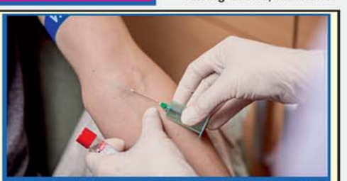
ଆଗରୁ ଆଲର୍ଜି ଚିହ୍ନଟ ପାଇଁ ବାହୁରେ ଛୁଣ୍ଡି ଦ୍ୱାରା ୨୫ ଟିହ୍ନ ଲଗାଯାଇ ଏହା ଜାଣିବାର ଚେଷ୍ଟା କରାଯାଉଥିଲା ଯେ ବ୍ୟକ୍ତିଙ୍କୁ କେଉଁ ଜିନିଷ କାରଣରୁ ଆଲର୍ଜି ହେଉଛି କିନ୍ତୁ ଏବେ କେବଳ ରକ୍ତ ପରୀକ୍ଷା ଦ୍ୱାରା ହିଁ ଆଲର୍ଜିର କାରଣ ଜଣାପଡ଼ିଯାଉଛି ।