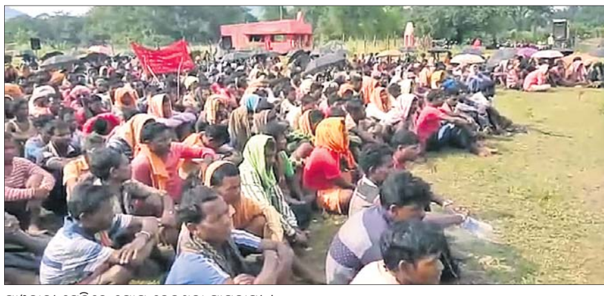
ମାଓବାଦୀ ମେଳିରେ ଯୋଗ ଦେଇଥିବା ଗ୍ରାମବାସୀ ।