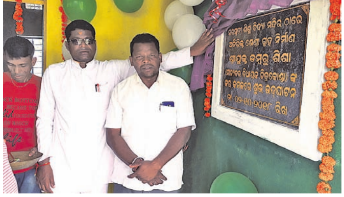
ଶ୍ରେଣୀଗୃହ ଉଦ୍‌ଘାଟନ କରୁଛନ୍ତି ବିଧାୟକ ।