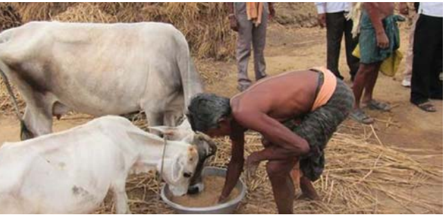
ଶୀତ ଋତୁରେ ଗୋରୁକୁ ଉତ୍ତମ ଶୁଖିଲା ଖାଦ୍ୟ ଦେବାକୁ ପଡ଼ିବ ।

ଗୋରୁକୁ ପାଣି ଜମିଥିବା ସତ୍ତ୍ୱେ ସ୍ଥାନକୁ ଚଳାଇ ପାଇଁ ଛାଡ଼ିବାକୁ ନାହିଁ । ଫାଟୁଆ, ବକବକିଆ, ଆଞ୍ଜୁକୁ ଏବଂ ଗୋମଡ଼କ ବା ଗୋବସନ୍ତରୋଗ ପ୍ରତିରୋଧକ ଚିକା ଦିଅନ୍ତୁ । ବର୍ଷାରେ ଭାଙ୍ଗିଯାଇଥିବା ଗୁଆଳକୁ ସଜାଡ଼ି ଭଲଭାବେ ପରିଷ୍କାର କରିଦିଅନ୍ତୁ । ଗୋରୁକୁ ଗୋଳିଆ ପାଣି ପିଇବା ପାଇଁ ଦିଅନ୍ତୁ ନାହିଁ । ଗୋରୁକୁ ପ୍ରତି ତିନିମାସରେ ଥରେ କୃମିନାଶକ ଔଷଧ ଖୁଆନ୍ତୁ । ପ୍ରତ୍ୟେକ ଦିନ ଗୁଆଳକୁ ବାହାରୁଥିବା ମଳ, ମୂତ୍ର, ବକଳା ଘାସ, କୂଟା ଓ ପାଉଁଶ ଇତ୍ୟାଦିକୁ ଖତଚରାରେ ପକାନ୍ତୁ । ଖତଚରାକୁ ଘରଠାରୁ ଅନ୍ୟତ ୧୦୦ ଫୁଟ ଦୂରରେ କରନ୍ତୁ । ଗୋରୁକୁ ପ୍ରାକୃତିକ ଖାଦ୍ୟପାଇଁ ବରଗୁଡ଼ି, ଓଡ଼, ଲୁହାଁ ଇତ୍ୟାଦି ଚାଷ କରନ୍ତୁ । ଅଧିକ ଥଣ୍ଡା ଓ ଅଧିକ ଦିନ ଶୀତ ରହୁଥିବା