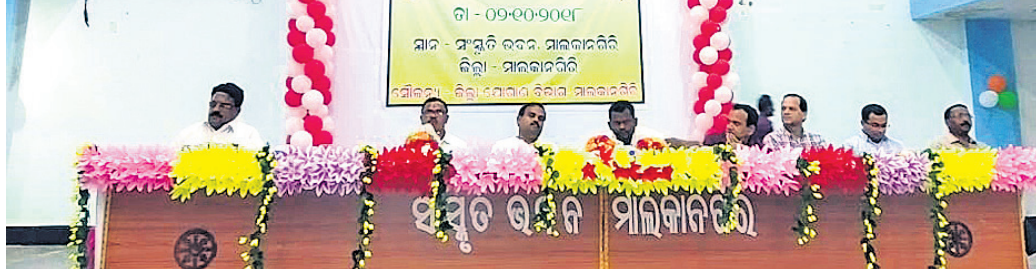
କାର୍ଯ୍ୟକ୍ରମରେ ମଞ୍ଚାସୀନ ଅତିଥି ।

ମାଲକାନଗିରି ଜିଲ୍ଲା ସଦର ମହକୁମାସ୍ଥିତ ସଂସ୍କୃତି ଭବନରେ ରାଜ୍ୟ ଖାଦ୍ୟ ସୁରକ୍ଷା ଯୋଜନା-୨୦୧୮ ଉଦ୍‌ଘାଟିତ ହୋଇଯାଇଛି ।