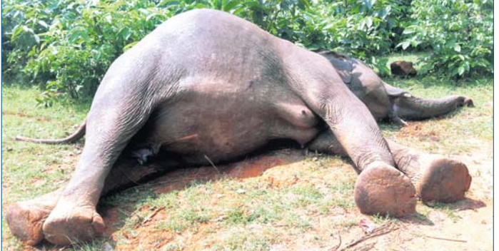
■ ଗ୍ରାମ୍ୟ ଜଙ୍ଗଲରୁ ମୃତଦେହ ଉଦ୍ଧାର ■ ସେସାଗାର ଶିକାରୀଙ୍କ ସମ୍ମୁଖି ସନ୍ଦେହ

ଡେକାନୀୟ ବନଖଣ୍ଡ ମହାବିରୋଧ ରେଖା ଘାଘରାମୁଣ୍ଡା ବିଫଳ ଅଧୀନ ଅଧିକାରୀଙ୍କ ଛୋଟାମକା ମହାଜନତରଳା ଗ୍ରାମ୍ୟ ଜଙ୍ଗଲରୁ ମଙ୍ଗଳବାର ଏକ ଗୁଳିବିଦ୍ଧ ମାଛହାତୀର ମୃତଦେହ ଉଦ୍ଧାର କରାଯାଇଛି । ଉକ୍ତ ହାତୀର ଆଖି ଏବଂ ତାହାଣ ପାର୍ଶ୍ୱ ପେଟରେ ଗୁଳି ବାଜିଛି । ହାତୀର ହତ୍ୟାକାରୀ ପୋସାଦାର ଶିକାରୀ । ବିଦ୍ୟୁତ୍ ତାରରେ ଛଦି ହୋଇପଡ଼ିଥିବା ବେଳେ ଗତ ନିକଟରୁ ଗୁଳିକରି ହାତୀକୁ ହତ୍ୟା କରାଯାଇଥିବା ବନ ବିଭାଗ ଅନୁମାନ କରୁଛି । କିଛିଦିନ ହେଲା ଉକ୍ତ ଅଞ୍ଚଳରେ ୧୫ରୁ ଉର୍ଦ୍ଧ୍ୱ ହାତୀ ବ୍ୟାପକ ଫସଲ ନଷ୍ଟ କରି ଚାଲିଛନ୍ତି । ଏ ସଂକ୍ରାନ୍ତରେ ବନ ବିଭାଗକୁ ଅଧିକାରୀଙ୍କୁ ଅବଗତ କରାଯାଇଥିଲା । ହେଲେ ହାତୀ ଉଦ୍ଧାରକାରୀ ଦିନରେ କୌଣସି ପଦକ୍ଷେପ ନିଆଯାଇ ନ ଥିଲା । ଏଥିରେ ଅତିଷ୍ଠ ହୋଇ ସୋମବାର ରାତିରେ କେହି ହାତୀକୁ ଗୁଳି କରିଥିବା ଚର୍ଚ୍ଚା ହେଉଛି । ସୂଚନାପାଇ ଜିଲ୍ଲା ବନଖଣ୍ଡ ଅଧିକାରୀ ସୁବର୍ଣ୍ଣନ ପାତ୍ର, ରେଖର ସୁରେଶ