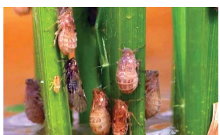
ହୋଇ ସାରିଛି ।

ଏହି ପୋକର ବଂଶବୃଦ୍ଧି ପାଇଁ ଅନୁକୂଳ ହୋଇଥିବା ଯୋଗୁ ଆଗାମୀ ଦିନରେ ଏହାର ପ୍ରାକୃତିକ ଯତ୍ନେ ବୃଦ୍ଧି ବ୍ୟାପକ କ୍ଷତି ହେବା ଅନୁମାନ କରାଯାଉଛି । ଏହି ପରିସ୍ଥିତିରେ ରାଜ୍ୟର ଚାଷୀଙ୍କୁ ଅବଗତ କରିବାକୁ ଏହି ମାଗାମୂଳକ କୀଟର ସଫଳ ନିୟନ୍ତ୍ରଣ ପାଇଁ ଉପଯୁକ୍ତ ସମସ୍ତ ନିୟନ୍ତ୍ରଣ ପ୍ରଣାଳୀ ବିଷୟରେ ସୂଚିତ କରାଯାଉଛି । -ବର୍ତ୍ତମାନ ଓଡ଼ିଶାରେ ଅଧିକ ଆକ୍ରମଣାତ୍ମକ ବଂଶ, ବହୁରୁ ଯାତ୍ରା କରିବାର କ୍ଷମତା, ବ୍ୟବହୃତ କୀଟନାଶକ ସହିଷ୍ଣୁ ପୋକଗୋଷ୍ଠୀର ଉପସ୍ଥିତି ରହିଛି ଓ ଅଧିକ ତେଣାଧାରୀ ପୋକର ଉତ୍ପତ୍ତିର ସୂଚନା ମିଳୁଛି । ସେଥିପାଇଁ ଶେଷ ସପ୍ତାହକୁ ନିୟନ୍ତ୍ରଣ ଦ୍ୱିତୀୟ ସପ୍ତାହ ମଧ୍ୟରେ ଅପେକ୍ଷାକୃତ ପାଣିପାଗ ଓ ଧାନଫସଲକୁ ନିୟନ୍ତ୍ରଣ ଖାଦ୍ୟ ଏହାର ପ୍ରକଳନ ଓ ବଂଶବୃଦ୍ଧି ପାଇଁ ଅନୁକୂଳ । -ଅଧିକ ଅମଳ ଆଣିବା ପାଇଁ ଅଧିକ ରାଜ୍ୟର କେତେକ ଅଞ୍ଚଳରେ ଉତ୍ତମ ଅଧିକ ଧ୍ୟାନ ଦେବାକୁ ପଡ଼ିବ । -ଅଧିକ ଅମଳ ଆଣିବା ପାଇଁ ଅଧିକ ରାଜ୍ୟର କେତେକ ଅଞ୍ଚଳରେ ଉତ୍ତମ ଅଧିକ ଧ୍ୟାନ ଦେବାକୁ ପଡ଼ିବ ।