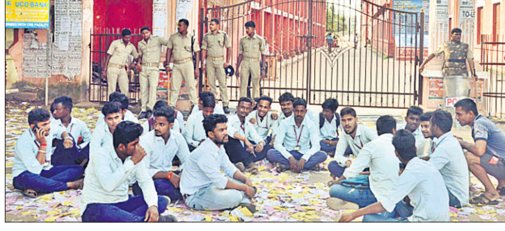
ଏସ୍‌ସିଏସ୍ କଲେଜ ଗେର୍ ସମ୍ମୁଖରେ ଛାତ୍ରମାନେ ଧାରଣା ଦେଇଛନ୍ତି।

ଏସ୍‌ସିଏସ୍ କଲେଜ ଗେର୍ ସମ୍ମୁଖରେ ଛାତ୍ରମାନେ ଧାରଣା ଦେଇଛନ୍ତି। ଏହି ସଂସଦ ନିର୍ବାଚନ ଲାଗି ଦୁଇଦିନ ନାମାଙ୍କନପତ୍ର ଦାଖଲ ହୋଇଥିଲା। ଗୁରୁବାର ନାମାଙ୍କନପତ୍ର ଦୂତାସ ପ୍ରାଥୀ ତାଲିକା ପ୍ରକାଶ ପାଇଥିଲା। ଦୂତାସ ତାଲିକାକୁ ବାଦ ପଡ଼ିଥିବା ପ୍ରାଥୀମାନେ ତୀବ୍ର ବିରୋଧ କରିଥିଲେ। ସାମନ୍ତ ଚନ୍ଦ୍ରଶେଖର (ଏସ୍‌ସିଏସ୍) କଲେଜ ଛାତ୍ର ସଂସଦ ନିର୍ବାଚନକୁ ବାଦ ପଡ଼ିଥିବା ଛାତ୍ରମାନେ କଲେଜ ଫାଟକ ଆଗରେ ଦୀର୍ଘସମୟ ଧାରଣା ଦେବା ସହ କଲେଜ କର୍ତ୍ତୃପକ୍ଷଙ୍କ ବିରୋଧରେ ନାମାଙ୍କନପତ୍ର ଦାଖଲ ହୋଇଥିଲା। ଗୁରୁବାର ନାମାଙ୍କନପତ୍ର ଦୂତାସ ପ୍ରାଥୀ ତାଲିକା ପ୍ରକାଶ ପାଇଥିଲା। ଦୂତାସ ତାଲିକାକୁ ବାଦ ପଡ଼ିଥିବା ପ୍ରାଥୀମାନେ ତୀବ୍ର ବିରୋଧ କରିଥିଲେ। ସାମନ୍ତ ଚନ୍ଦ୍ରଶେଖର (ଏସ୍‌ସିଏସ୍) କଲେଜ ଛାତ୍ର ସଂସଦ ନିର୍ବାଚନକୁ ବାଦ ପଡ଼ିଥିବା ଛାତ୍ରମାନେ କଲେଜ ଫାଟକ ଆଗରେ ଦୀର୍ଘସମୟ ଧାରଣା ଦେବା ସହ କଲେଜ କର୍ତ୍ତୃପକ୍ଷଙ୍କ ବିରୋଧରେ ନାମାଙ୍କନପତ୍ର ଦାଖଲ ହୋଇଥିଲା।