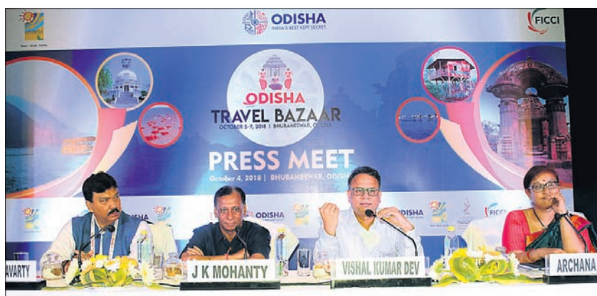
ଭୁବନେଶ୍ୱର, ୪।୧୦ (ବୁଧବୋ)