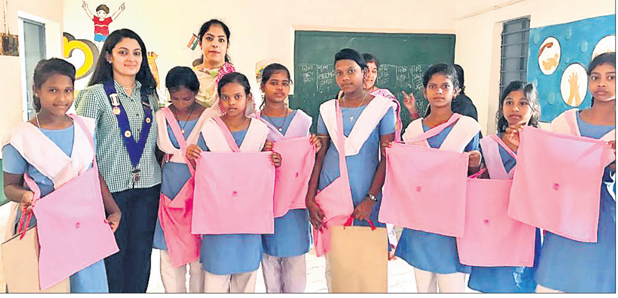
ଭୁବନେଶ୍ୱର, ୪।୧୦ (ବୁଧବୋ)