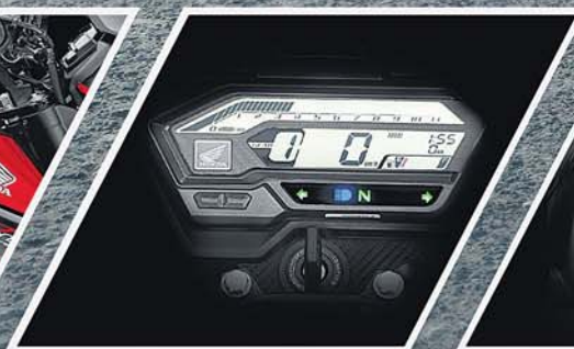
STREET-TECH DIGITAL METER