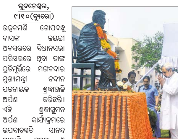
ପୁଖ୍ୟମନ୍ତ୍ରୀ ନବୀନ ପଟ୍ଟନାୟକ ଶ୍ରଦ୍ଧାସୁମନ ଅର୍ପଣ କରୁଛନ୍ତି।