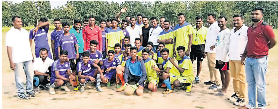
ଅତିଥିଙ୍କ ଗହଣରେ ଖେଳାଳିମାନେ ।