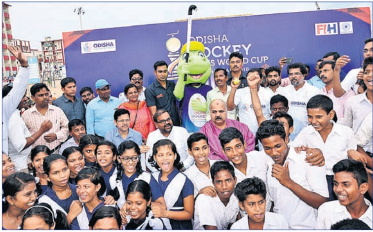
ମାଷ୍ଟର୍ ଓଲି ଉନ୍ମୋଚନ ଅବସରରେ ଅତିଥି ଓ ଛାତ୍ରଛାତ୍ରୀମାନେ ।