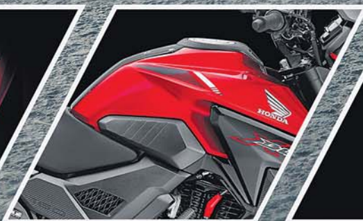
AGGRESSIVE-SCULPTED TANK DESIGN