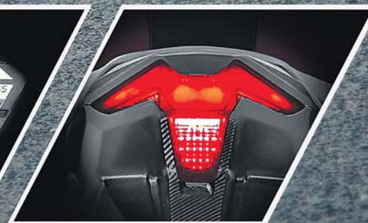
RAZOR EDGED LED TAIL LAMP