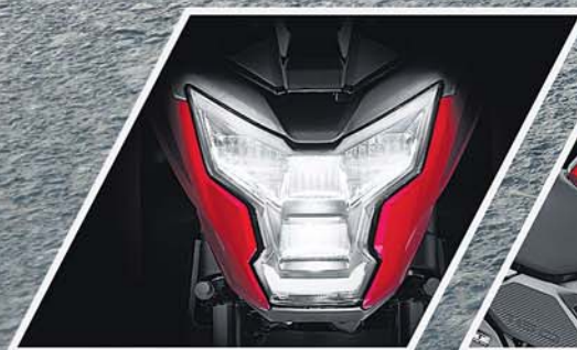
ROBO-FACE LED HEADLAMP