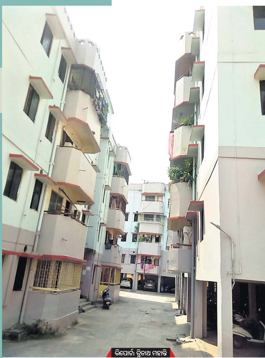
ରିପୋର୍ଟ: ତ୍ରିନାଥ ମହାନ୍ତି

ଆପାର୍ଟମେଣ୍ଟ ପରିସରରେ ଥିବା ଉତ୍ତରୋତ୍ତର ଶିବ ମନ୍ଦିରରେ ପ୍ରତିବର୍ଷ ଜାଗର ଉତ୍ସବ ଧୁମଧାମରେ ପାଳନ କରାଯାଏ । ପ୍ରଭୁ ଶ୍ରୀଲିଙ୍ଗରାଜଙ୍କ ନାତିକାନ୍ତି ଅନୁସାରେ ଉତ୍ତରୋତ୍ତରଙ୍କ ପୂଜାର୍ଚ୍ଚନା କରାଯାଏ । ମନ୍ଦିର ଏବଂ ଆପାର୍ଟମେଣ୍ଟ ପ୍ରତିଷ୍ଠା ଦିବସରେ ଭୋଜିଭାତ ହେବା ସହିତ ଅନ୍ତେବାସୀ ମିଳିମିଶି ଏହାକୁ ପାଳନ କରନ୍ତି । ଏହାବ୍ୟତୀତ ଅଗଷ୍ଟ ୧୫, ଜାନୁୟାରୀ ୨୬, ଗଣେଶ ପୂଜା, ସରସ୍ୱତୀ ପୂଜା, ବିଶ୍ୱକର୍ମା ପୂଜା, ଦୀପାବଳି, ହୋଲି ଆଦି ଉତ୍ସବ ପାଳନ କରାଯାଉଛି । ନୂଆବର୍ଷରେ ସମସ୍ତେ ଏଠାକି ହୋଇ ଜିରୋ ନାଇଟ ଉତ୍ସବ ପାଳନ କରନ୍ତି । ସେହିଦିନ ଛୋଟ ପିଲାଙ୍କୁ ନେଇ ବିଭିନ୍ନ ପ୍ରତିଯୋଗିତା ହୋଇଥାଏ ।