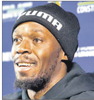
ସିଡ୍ନୀ, ୧୦।୧୦ (ଏଏଫ୍‌ପି)

ଷ୍ଟ୍ରିକ୍ ସୁପର ଷ୍ଟାର ଉଷେନ ବୋଲ୍ଡ୍ ଶୁକ୍ରବାର ଜଣେ ପ୍ରଦେଶନାଳୀ ପୁରୁଷ ଖେଳାଳି ହିସାବରେ ନିଜକୁ ପରଖିବେ । ସିଡ୍ନୀ ଠାରେ ମାକାର୍ଥର ସାଥୀ ଡେ଼ସ୍ ଯୁଦ୍ଧରେ ଭାରତୀୟ ଖେଳାଳିଙ୍କୁ ଥିବା ଏହି ମ୍ୟାଚରେ ସେଣ୍ଟ୍ରାଲ୍ ଷ୍ଟ୍ରିକ୍ ମାରିନର୍ସ ଚରଫ୍‌କୁ ପ୍ରତିନିଧିତ୍ୱ କରିବେ ବୋଲି । ଷ୍ଟ୍ରିକ୍ ସୁପର ଷ୍ଟାର ଏହି ମ୍ୟାଚର ଷ୍ଟାର୍ଟ ଲାଇନ୍ ଅପରେ ଘୁମି ପାଇଥିବା କୋଚ୍ ମାଲକ୍ ମଲଭେ ପୂର୍ବନା ଦେଇଛନ୍ତି । ବୋଲ୍ଡ୍ କହିଛନ୍ତି, ମୋ ଫିଟ୍‌ନେସ୍ ଉପରେ କୋଚ୍ ଭରସା ରଖିଥିବାରୁ ମୁଁ ଆନନ୍ଦିତ । ମୁଁ ଶ୍ରେଷ୍ଠ ପ୍ରଦର୍ଶନ କରିବାକୁ ଚେଷ୍ଟା କରିବି । ମ୍ୟାଚ ଅଲିମ୍ପିକ୍ ଚାମ୍ପିୟନ ଅରଣ୍ଡ୍ ମାସ ଶେଷଭାଗରେ ପୁରୁଷଙ୍କରେ ପ୍ରଥମ ପଦାର୍ପଣ କରିଥିଲେ । ଜଣେ ବଦଳ ଖେଳାଳି ହିସାବରେ ଲେଫ୍ଟ୍ ଉଇଙ୍ଗରେ ୨୦ ମିନିଟ୍ ଖେଳିବାକୁ ପଡ଼ିଥିଲା । ସେ ମ୍ୟାଚରେ ଗୋଲ ଖୋର କରିବା ସୁଯୋଗ ସୃଷ୍ଟି କରିଥିଲେ । ମାତ୍ର ସେ ଶୀଘ୍ର କ୍ଲାନ୍ ହୋଇପଡ଼ିଥିଲେ । ବୋଲ୍ଡ୍ କହିଛନ୍ତି, ସେ ତାଙ୍କ ଫିଟ୍‌ନେସ୍‌ରେ ଭଲଟି ଆଣିପାରିଛନ୍ତି । ପ୍ରଥମେ ଅଧିକ ସମୟ ଖେଳିବାକୁ ଚେଷ୍ଟା କରିବେ ବୋଲି ସେ କହିଛନ୍ତି । ମ୍ୟାଚରେ ପ୍ରଦର୍ଶନକୁ ଦେଖି ସେ ପୁରୁଷଙ୍କରେ ତାଙ୍କ ଭବିଷ୍ୟତ ସମ୍ପର୍କରେ ଚିନ୍ତା କରିବେ ।