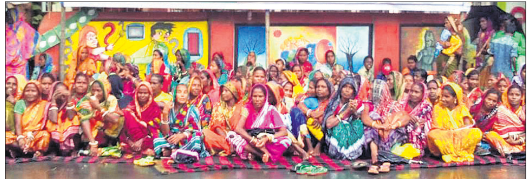
ଜିଲାପାଳଙ୍କ କାର୍ଯ୍ୟକ୍ରମ ସମ୍ମୁଖରେ ଧାରଣାରତ ବଗାଳ ସମ୍ପ୍ରଦାୟର ମହିଳାମାନେ ।