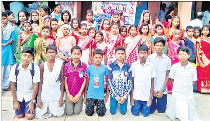
'ସୁରଭି'ରେ ଅଂଶଗ୍ରହଣ କରିଥିବା କୁନି କଳାକାର ।