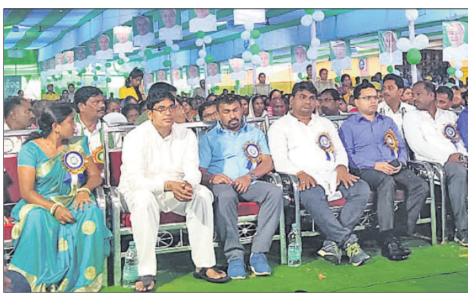
କାର୍ଯ୍ୟକ୍ରମରେ ଉପସ୍ଥିତ ପ୍ରଶାସନିକ ଅଧିକାରୀ, ରାଜନେତାମାନେ ।