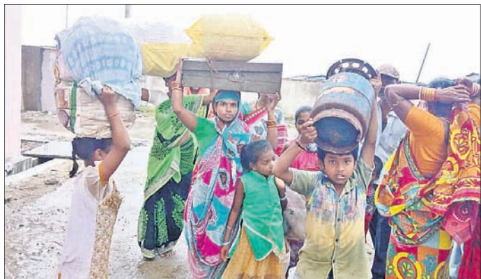
ଗଞ୍ଜାମ ଜିଲ୍ଲା ରଙ୍ଗେଇଲୁଣ୍ଡା ବ୍ଲକ୍‌ର ଉତ୍ତରାପୁରୀ ଅଞ୍ଚଳରେ ଥିବା ବସ୍ତିବାସିନ୍ଦାଙ୍କୁ ନିକଟସ୍ଥ ରାଜୀବ ଆବାସ ଗୃହକୁ ସ୍ଥାନାନ୍ତର କରାଯାଇଛି ।