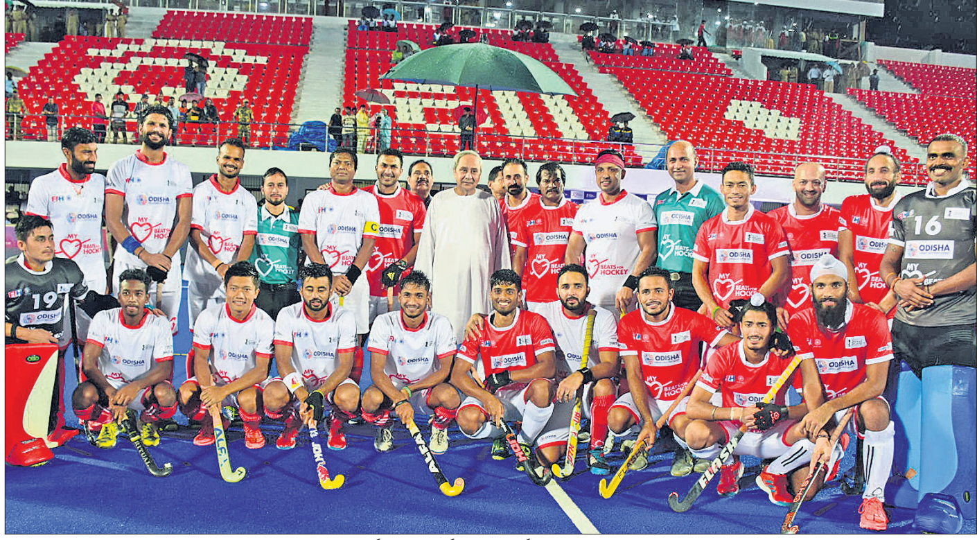
କଳିଙ୍ଗ ଷ୍ଟାଡିୟମ ହକି କମ୍ପ୍ଲେକ୍ସ ଉଦ୍ଘାଟନ ଅବସରରେ ଆୟୋଜିତ ପ୍ରଦର୍ଶନୀ ମ୍ୟାଚ୍ ପୂର୍ବରୁ ଦିଲୀପ ତିର୍କୀ ଓ ଧନରାଜ ପିଲେକ ଦଳର ଖେଳାଳିମାନଙ୍କ ସହ ପୂଷ୍ୟମନ୍ତ୍ରୀ ନବୀନ ପଟ୍ଟନାୟକ ।

ହକି ବିଶ୍ୱକପର ୧୪ତମ ସଂସ୍କରଣ ଆରମ୍ଭ ହେବାକୁ ଆଉ ମାତ୍ର କିଛି ସପ୍ତାହ ବାକିଥିବାବେଳେ ରାଜଧାନୀ ଭୁବନେଶ୍ୱର ଏହି ମେଗା ଇଭେଣ୍ଟକୁ ଆୟୋଜନ କରିବା ଲାଗି ପୂରା ପ୍ରସ୍ତୁତ ହୋଇଛି । ଏକ ନୂଆ ତଥା ଉନ୍ନତ କଳିଙ୍ଗ ଷ୍ଟାଡିୟମର ଉଦ୍ଘାଟନ ହୋଇଛି ।