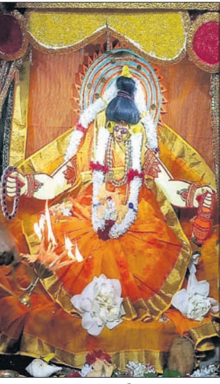
ନବରାତ୍ରୀ ଉପଲକ୍ଷେ ବାରିପଦା ମା' ଅଧିକା ମନ୍ଦିରରେ ବୁଧବାର ମା'ଙ୍କ ବ୍ରହ୍ମଚାରଣୀ ବେଶା