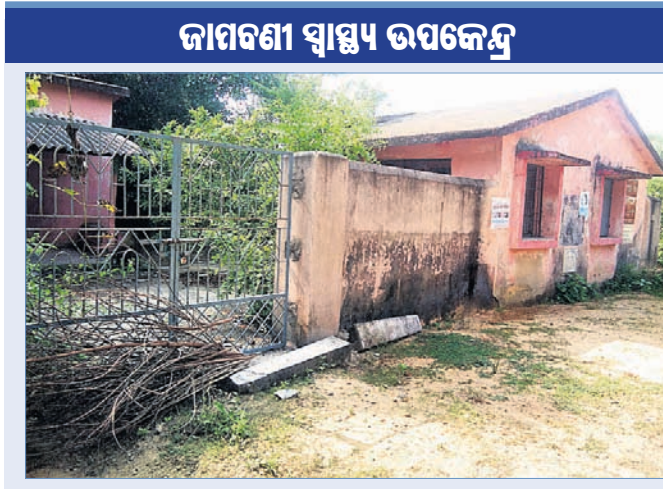
ଦୁଇବର୍ଷ ଧରି ସ୍ୱାସ୍ଥ୍ୟ ଉପକେନ୍ଦ୍ରରେ ତାଲା ।

କସ୍ତିପଦା ବ୍ଲକରେ ସ୍ୱାସ୍ଥ୍ୟସେବା ସମ୍ପୂର୍ଣ୍ଣ ଛୁଟି ପଡିଛି । ତାଲୁକର ସମସ୍ୟା ସହ ମହିଳା ସ୍ୱାସ୍ଥ୍ୟକର୍ମୀଙ୍କ ଅଭାବ ଗ୍ରାମାଞ୍ଚଳ ସ୍ୱାସ୍ଥ୍ୟସେବାକୁ ପଲ୍ଲୁ କରିଦେଇଛି ।