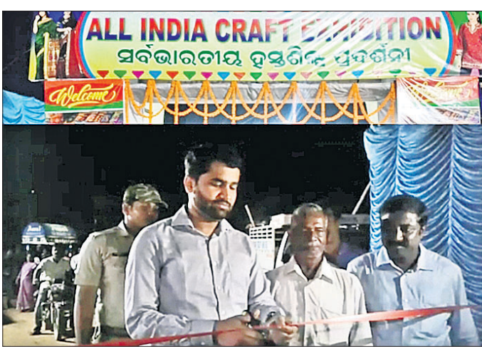
ବାରିପଦା ଉପଜିଲାପାଳ ହସ୍ତଶିଳ୍ପ ପ୍ରଦର୍ଶନୀକୁ ଉଦ୍ଘାଟନ କରୁଛନ୍ତି ।

ଆଜି କ'ଣ କେନ୍ଦ୍ରୀୟ ସ୍ତରରେ କୌଣସି କାର୍ଯ୍ୟକ୍ରମ ଘାଟିତ କରିବାକୁ ଚାହୁଁଥିଲେ ସମ୍ପୂର୍ଣ୍ଣ ବିବରଣୀ ସହ ଧରିତ୍ରୀ ମୁଖ୍ୟ କାର୍ଯ୍ୟକ୍ରମ ବିଧି ନିକଟସ୍ଥ ପ୍ରତିନିଧିଙ୍କ ସହ ଯୋଗାଯୋଗ କରନ୍ତୁ ।