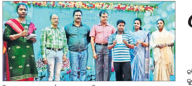
ହିତାଧିକାରୀଙ୍କୁ ରାଶନ କାର୍ଡ ପ୍ରଦାନ କରାଯାଇଛି ।