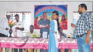
ବଡ଼ସାହି, ୧୦।୧୦(ସ.ପ୍ର.) ବଡ଼ସାହି ବ୍ଲକ ଅଧୀନ ବଳଭଦ୍ରପୁର, ମାଣଡ଼ା ଓ ମାନଗୋବିନ୍ଦପୁର କୃଷ୍ଣଚନ୍ଦ୍ର ଶିଶୁ ମହୋତ୍ସବ ସୁରଭି କାର୍ଯ୍ୟକ୍ରମ ଅନୁଷ୍ଠିତ ହୋଇଯାଇଛି ।