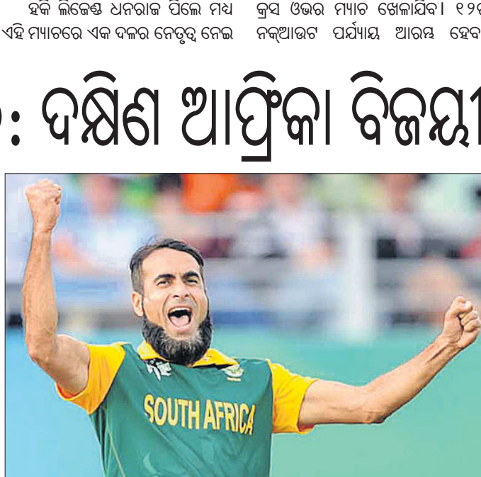
୫ ଭଲକେଟ୍ ଅକ୍ତିଆର କରିଥିବା ଇମ୍ରାନ ତାହିର ।

ଲେଗ୍ ସିନର ଇମ୍ରାନ ତାହିରଙ୍କ ବମ୍ବର ପ୍ରଦର୍ଶନ ବଳରେ ଦକ୍ଷିଣ ଆଫ୍ରିକା ପ୍ରଥମ ଟି୨୦ ମ୍ୟାଚ୍ରେ ୩୪ ରନରେ ଜିୟାଫ୍ରେସ୍ ପରାସ୍ତ କରିଛି । ଫଳରେ ୩ ମ୍ୟାଚ୍ ବିଶିଷ୍ଟ ଏହି ସିରିଜରେ ୧-୦ରେ ଅଗ୍ରଣୀ ହାସଲ କରିଛି ।