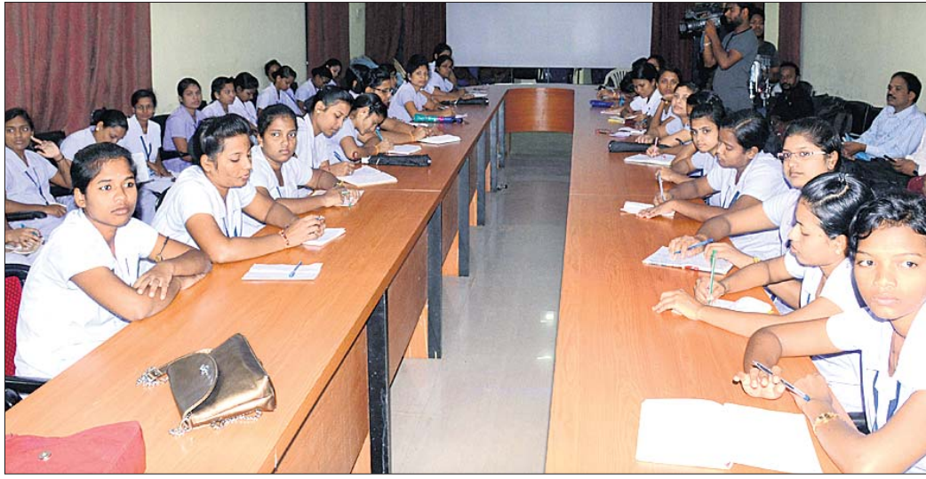
ଉପସ୍ଥିତ ଏବଂ ଏମ୍ ସମ୍ମାନମାନେ ।