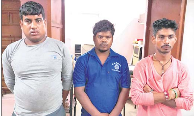
ଗିରଫ ତିନି ଲୁଚେରା ।