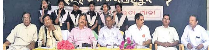
ବକ୍ତୃତାମାଳାରେ ମଞ୍ଚାସୀନ ଅତିଥି ଏବଂ ବକ୍ତ୍ରାମାନେ ।