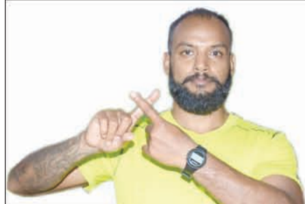
Srikant Sekhar Sports Personality