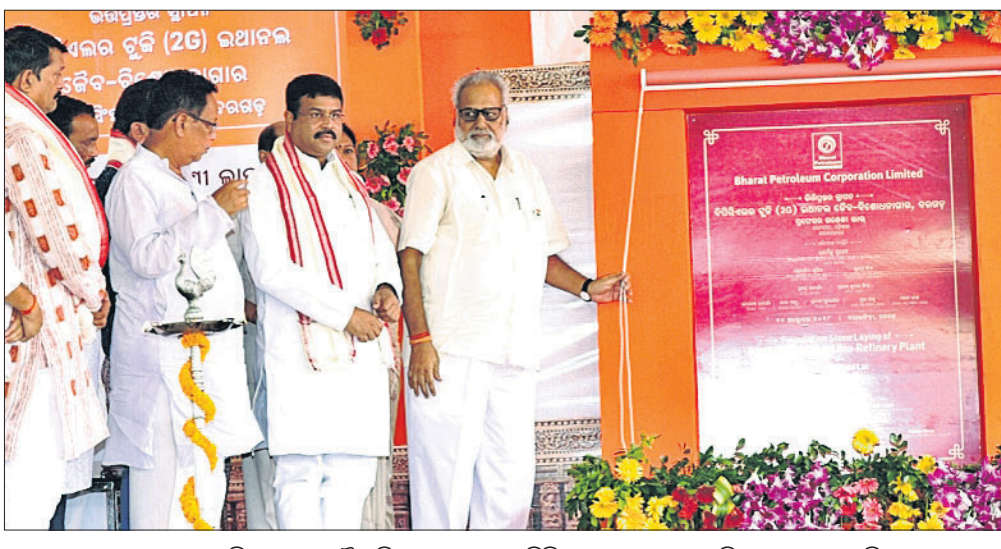
ରାଜ୍ୟପାଳ ଗଣେଶୀ ଲାଲ୍ ୨ଜି ଇଥାନଲ ଜୈବ ବିଶୋଧନାଗାରର ଭିଡିପ୍ରସ୍ତର ଘାଟପ କରୁଛନ୍ତି।

ରାଜ୍ୟପାଳ ଗଣେଶୀ ଲାଲ୍ ୨ଜି ଇଥାନଲ ଜୈବ ବିଶୋଧନାଗାର ଭିଡିପ୍ରସ୍ତର ଘାଟପ କରୁଛନ୍ତି।