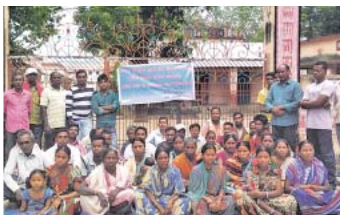
ଗ୍ରାମବାସୀ ତାଲା ପକାଇ ସ୍କୁଲ ଗେଟ ଆଗରେ ଧାରଣାରେ ବସିଛନ୍ତି ।