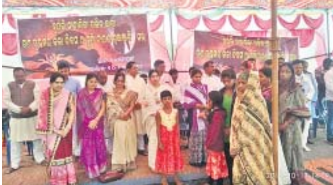
ପୁଣ୍ୟଗୁଡ଼ା ଗ୍ରାମରେ ଭାଜପା ଓ କଂଗ୍ରେସ ପକ୍ଷରୁ କଳାପତିରା ପାଳନ