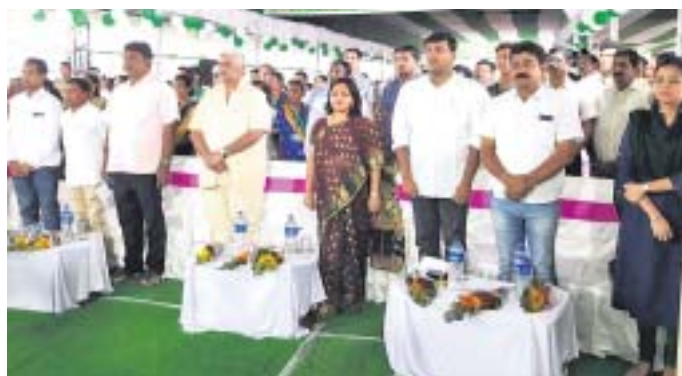
କାର୍ଯ୍ୟକ୍ରମରେ ଉପସ୍ଥିତ ଲୋକ ପ୍ରତିନିଧି ଓ ସାଧାରଣ ଲୋକେ ।

ରାୟଗଡ଼ା ଅଫିସ୍/କେନ୍ଦ୍ରପୁର/କୋଲନରା, ୧୦୧୦(ଡି.ଏନ୍.ଏ)