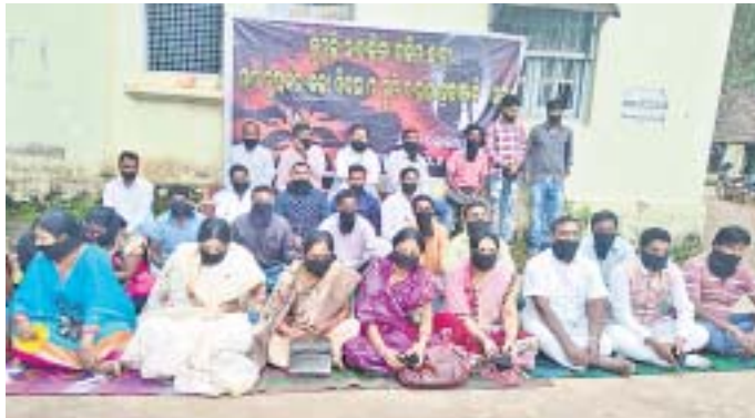
କୋରାପୁଟ ଜିଲାପାଳଙ୍କ କାର୍ଯ୍ୟାଳୟ ଆଗରେ ପୁଅରେ କଳାପତି ବାହି କଂଗ୍ରେସର ଧାରଣା