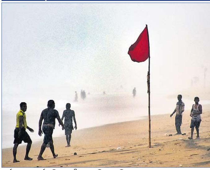
ପର୍ଯ୍ୟଟକଙ୍କୁ ସତର୍କ କରିବା ପାଇଁ ବେଳାଭୂମିରେ ଲାଗିଥିବା ରେଡ୍ ଫ୍ଲାଗ୍।

ବେଳେ ଏହା ବୃଦ୍ଧି ପାଇ ୪ରୁ ୫ ମିଟର ହେବ ବୋଲି କୁହାଯାଇଛି। ଅର୍ଥାତ୍ ସମୁଦ୍ର କୂଳ ଲ୍ୟାଣ୍ଡିଂ ସମ୍ପର୍କରେ ରହିଛି। ସମୁଦ୍ର ଅଧିକାରୀଙ୍କୁ ସତର୍କ କରିବା ପାଇଁ ବେଳାଭୂମିରେ ରେଡ୍ ଫ୍ଲାଗ (ନାଲି ପତାକା) ଲାଗାଯାଇଛି। ମଧ୍ୟ ବିଭାଗ ପକ୍ଷରୁ ପେଶକରା ଅଶାନ୍ତ ଥିବାରୁ ସମୁଦ୍ର ସୁରକ୍ଷା ବିପଦପୂର୍ଣ୍ଣ ବୋଧହୁଏ।