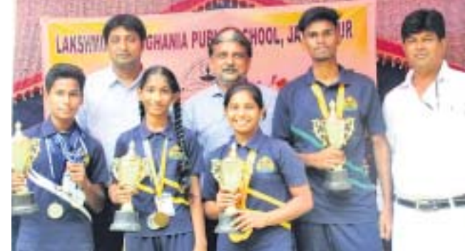
ଅତିଥିଙ୍କୁ ଗହଣରେ ଚାମିୟନ ଖେଳାଳିମାନେ ।