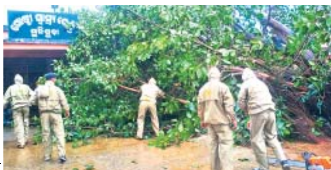
ରାୟଗଡ଼ା ମୁନିସିପାଲିଟି ଗୋଷ୍ଠୀ ସାମ୍ବଲକେନ୍ଦ୍ର ପରିସରରେ ଉପୁଡ଼ି ପଡ଼ିଥିବା ଗଛ ।