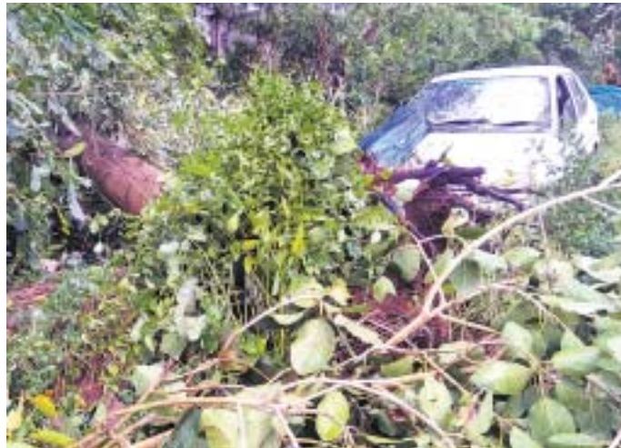
ଗୋପାଳପୁର କରାପଲି ଗ୍ରାମରେ ଗୋଟିଏ କାର ଉପରେ ଗଛ ପଡ଼ିଯାଇଛି ।