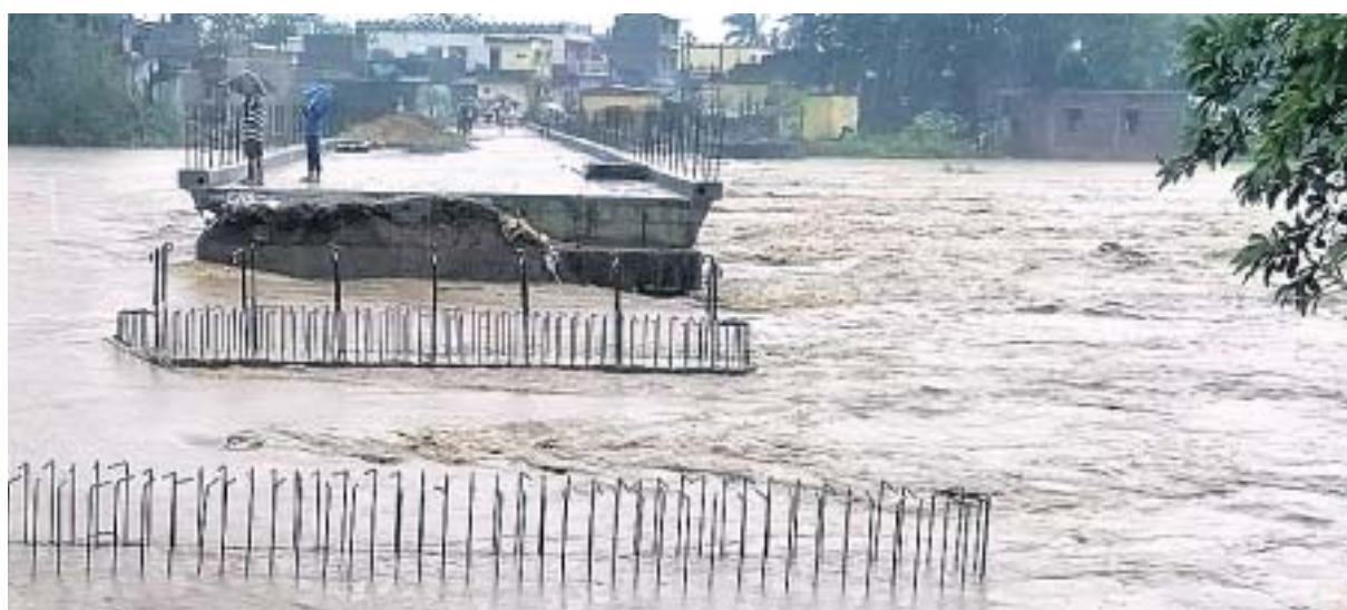
ଗଞ୍ଜାମ ଜିଲା ଚିକିଟି ନିକଟସ୍ଥ ବାହୁବା ନଦୀ ଉପରେ ନିର୍ମାଣାଧୀନ ପୋଲ ତଳେ ପାଣି ଚାଲୁଛି ।

ସମେତ ମୋହନା - ଅନ୍ତରାଳ ଓ ପାରଳାଖେମୁଣ୍ଡି ମଧ୍ୟରେ ଯୋଗାଯୋଗ ବାଧାପ୍ରାପ୍ତ ହୋଇଛି । ସେହିପରି ବ୍ରହ୍ମପୁର- ରାୟଗଡ଼ା ରାସ୍ତାରେ ମାଟୁରେ ପାଣି ଚାଲିବା ସହ ଗଛ ପଡ଼ିଥିବାରୁ ଯାନବାହନ ଚଳାଚଳ ବନ୍ଦ ରହିଛି । ଗୁମ୍ଫା-ପାରଳାଖେମୁଣ୍ଡି ରାସ୍ତା କଡ଼ରେ ଥିବା ୧୫ରୁ ଉର୍ଦ୍ଧ୍ୱ ପୁରୁଣା ବିରାଟ ଗଛ ଉପୁଡ଼ିପଡ଼ିଛି । ତରଭା ପଞ୍ଚାୟତର ଆଶ୍ରୟଗଡ଼ ଗ୍ରାମରେ ବର୍ଷାଜଳ ପ୍ରବେଶ କରିବାରୁ ଗ୍ରାମବାସୀ ପଲିଥିନ୍ ପାଇଁ ପ୍ରଶାସନର ସହାୟତା ଲୋଡ଼ିଥିଲେ । ମାତ୍ର କୌଣସି ସହାୟତା ନ ମିଳିବାରୁ ସେମାନେ ଉଦ୍ଧେଷ୍ଟ ହୋଇ ଗୁମ୍ଫାର କୁଳ କାର୍ଯ୍ୟାଳୟକୁ ଆସି ପାଟିଚୁଷ୍ଟ କରିବା ସହ କିଛି ଆସବାବ ପତ୍ର ଫିଙ୍ଗାଫିଙ୍ଗି କରିଥିଲେ । କ୍ଷେତ୍ର ଅନୁଧ୍ୟାନ ପାଇଁ ବିଡିଓ ଯାଇଥିବା ବେଳେ କର୍ମଚାରୀମାନେ ସେମାନଙ୍କୁ ବୁଝାଶୁଣା କରିଥିଲେ । ଗୋଷାଣୀ ବୁକର ଯାକପୁର ଗ୍ରାମରେ ବର୍ଷାଜଳ ପ୍ରବେଶ କରିଛି । କାଶୀନଗରର ହରିଜନ ସାହି, ଚାଟା କଲୋନୀ, ଲକ୍ଷ୍ମୀପୁର ଆଦି ଗ୍ରାମରେ ଘରଘାର ଭାଙ୍ଗିବା ସହ ଛପର ଉଡ଼ିଯାଇଛି । ନିକଟସ୍ଥ ବଂଶଧାରା ନଦୀରେ ବନ୍ୟା ଆଶଙ୍କା ସୃଷ୍ଟି ହୋଇଛି । ଅପରାହ୍ନ ୫ଟା ପୁଣ୍ୟ ଜଳପତନ ସତର୍କ ସଙ୍କେତ ତଳେ ଅର୍ଥାତ ୫୩.୨୬ମିନିଟରେ ପ୍ରବାହିତ ହେଉଛି । ରାତିରେ ଜଳସ୍ତର ବଢ଼ି ସତର୍କ ସଙ୍କେତ ଚପିପାରେ ବୋଲି କେନ୍ଦ୍ରୀୟ ଜଳ ଆୟୋଗଙ୍କ କାର୍ଯ୍ୟାଳୟ ସୂତ୍ରରୁ ସୂଚନା ମିଳିଛି ।