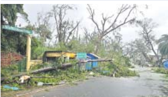
ପାରଳାଖେମୁଣ୍ଡି ଫରେଷ୍ଟ ଅଫିସ ନିକଟରେ ଗଛ ଉପୁଡ଼ି ପଡ଼ିଛି ।

ସମେତ ମୋହନା - ଅନ୍ତରାଳ ଓ ପାରଳାଖେମୁଣ୍ଡି ମଧ୍ୟରେ ଯୋଗାଯୋଗ ବାଧାପ୍ରାପ୍ତ ହୋଇଛି । ସେହିପରି ବ୍ରହ୍ମପୁର- ରାୟଗଡ଼ା ରାସ୍ତାରେ ମାଟୁରେ ପାଣି ଚାଲିବା ସହ ଗଛ ପଡ଼ିଥିବାରୁ ଯାନବାହନ ଚଳାଚଳ ବନ୍ଦ ରହିଛି । ଗୁମ୍ଫା-ପାରଳାଖେମୁଣ୍ଡି ରାସ୍ତା କଡ଼ରେ ଥିବା ୧୫ରୁ ଉର୍ଦ୍ଧ୍ୱ ପୁରୁଣା ବିରାଟ ଗଛ ଉପୁଡ଼ିପଡ଼ିଛି । ତରଭା ପଞ୍ଚାୟତର ଆଶ୍ରୟଗଡ଼ ଗ୍ରାମରେ ବର୍ଷାଜଳ ପ୍ରବେଶ କରିବାରୁ ଗ୍ରାମବାସୀ ପଲିଥିନ୍ ପାଇଁ ପ୍ରଶାସନର ସହାୟତା ଲୋଡ଼ିଥିଲେ । ମାତ୍ର କୌଣସି ସହାୟତା ନ ମିଳିବାରୁ ସେମାନେ ଉଦ୍ଧେଷ୍ଟ ହୋଇ ଗୁମ୍ଫାର କୁଳ କାର୍ଯ୍ୟାଳୟକୁ ଆସି ପାଟିଚୁଷ୍ଟ କରିବା ସହ କିଛି ଆସବାବ ପତ୍ର ଫିଙ୍ଗାଫିଙ୍ଗି କରିଥିଲେ । କ୍ଷେତ୍ର ଅନୁଧ୍ୟାନ ପାଇଁ ବିଡିଓ ଯାଇଥିବା ବେଳେ କର୍ମଚାରୀମାନେ ସେମାନଙ୍କୁ ବୁଝାଶୁଣା କରିଥିଲେ । ଗୋଷାଣୀ ବୁକର ଯାକପୁର ଗ୍ରାମରେ ବର୍ଷାଜଳ ପ୍ରବେଶ କରିଛି । କାଶୀନଗରର ହରିଜନ ସାହି, ଚାଟା କଲୋନୀ, ଲକ୍ଷ୍ମୀପୁର ଆଦି ଗ୍ରାମରେ ଘରଘାର ଭାଙ୍ଗିବା ସହ ଛପର ଉଡ଼ିଯାଇଛି । ନିକଟସ୍ଥ ବଂଶଧାରା ନଦୀରେ ବନ୍ୟା ଆଶଙ୍କା ସୃଷ୍ଟି ହୋଇଛି । ଅପରାହ୍ନ ୫ଟା ପୁଣ୍ୟ ଜଳପତନ ସତର୍କ ସଙ୍କେତ ତଳେ ଅର୍ଥାତ ୫୩.୨୬ମିନିଟରେ ପ୍ରବାହିତ ହେଉଛି । ରାତିରେ ଜଳସ୍ତର ବଢ଼ି ସତର୍କ ସଙ୍କେତ ଚପିପାରେ ବୋଲି କେନ୍ଦ୍ରୀୟ ଜଳ ଆୟୋଗଙ୍କ କାର୍ଯ୍ୟାଳୟ ସୂତ୍ରରୁ ସୂଚନା ମିଳିଛି ।