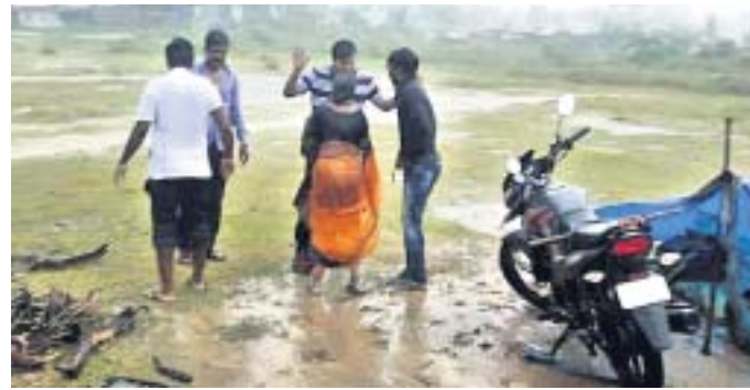
ଗୁଣାପୁର ଜଗନ୍ନାଥନଗରରେ ରହୁଥିବା ଲୋକଙ୍କୁ ଉପକିଳାପାଳ ଉଦ୍ଧାର କରୁଛନ୍ତି ।