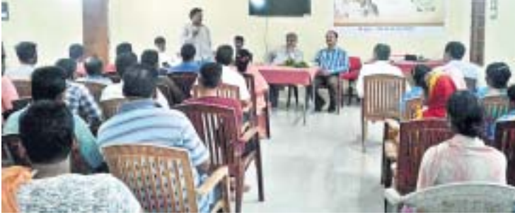
ସମୀକ୍ଷା ବୈଠକରେ ନୀତି ଆୟୋଗ ଷ୍ଟାଣ୍ଡି କମିଟିର ସଦସ୍ୟଙ୍କ ସହ ଅନ୍ୟମାନେ।