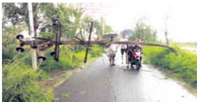
କାଶୀନଗରଠାରେ ବିଦ୍ୟୁତ୍ ଖୁଣ୍ଟ ଉପରୁ ଚାପାରେ ପଡ଼ିଛି ।