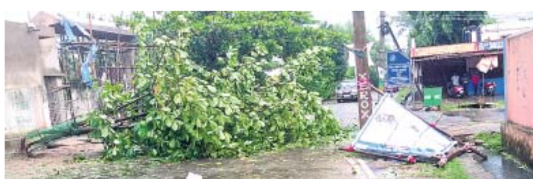
ରାୟଗଡ଼ା ଜିଲାପାଳଙ୍କ କାର୍ଯ୍ୟାଳୟ ସମ୍ମୁଖ ରାସ୍ତାରେ ଭାଙ୍ଗିପଡ଼ିଥିବା ହୋଟିଂ ଓ ଗଛ ।