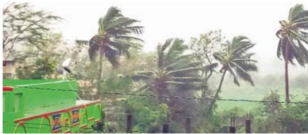
କାଶୀନଗରଠାରେ ଝଡ଼ବର୍ଷାର ଏକ ଦୃଶ୍ୟ ।