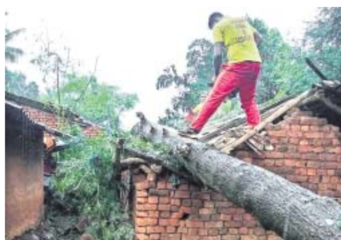
ଦଶମହରୀରୁ କୁଳ ଶୁକ୍ରାପୁରରେ ଘର ଉପରେ ଭାଙ୍ଗିପଡ଼ିଥିବା ଗଛକୁ ଓଡ଼ାଏଁ ଚିମ୍ପି ହଟାଇଛନ୍ତି ।