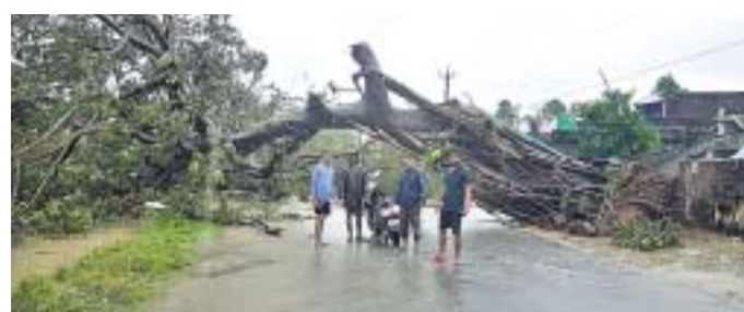
ପାରଳାଖେମୁଣ୍ଡି ସହରର ମୁଖ୍ୟ ରାସ୍ତାରେ ଏକ ଗଛ ଉପୁଡ଼ି ପଡ଼ି ରାସ୍ତା ଅବରୋଧ କରିଛି ।