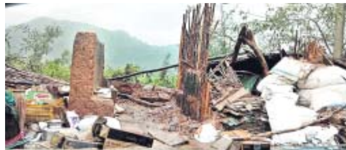
ଗୁଣାପୁରରେ ଭାଙ୍ଗିପଡ଼ିଥିବା ଘର ।