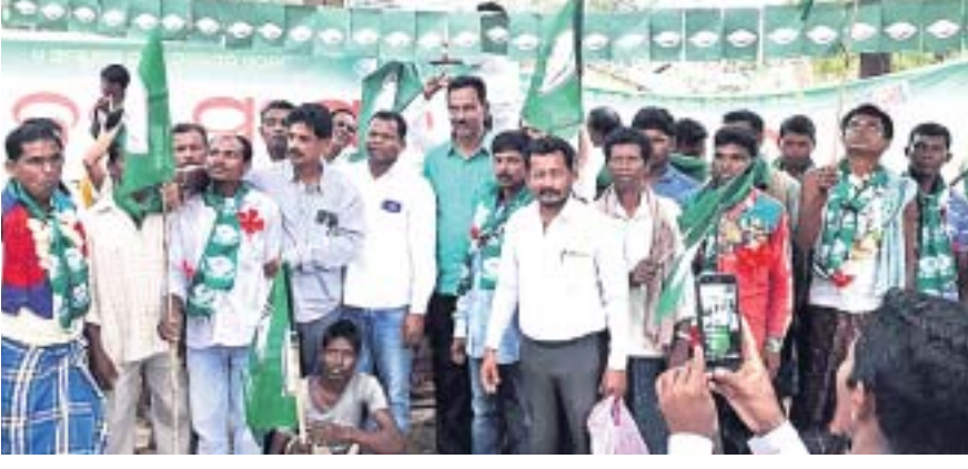
ପଦଯାତ୍ରାରେ ସାମିଲ ହୋଇଥିବା ଦଳୀୟ କର୍ମୀ।