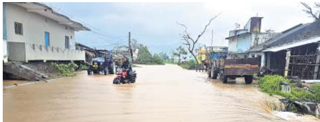
ଗଜପତି ଜିଲା ଗୋଷାଣୀ ବୁକର ଯାକପୁର ଗ୍ରାମ ଜଳମଗ୍ନ ହୋଇପଡ଼ିଛି ।