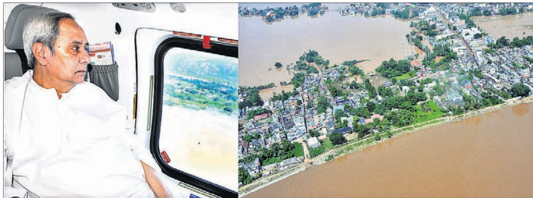
ମୁଖ୍ୟମନ୍ତ୍ରୀ ନବୀନ ପଟ୍ଟନାୟକ ଆକାଶମାର୍ଗରୁ ଗଞ୍ଜାମ ଜିଲ୍ଲାର ବନ୍ୟାଞ୍ଚଳ ପରିଦର୍ଶନ କରୁଛନ୍ତି।