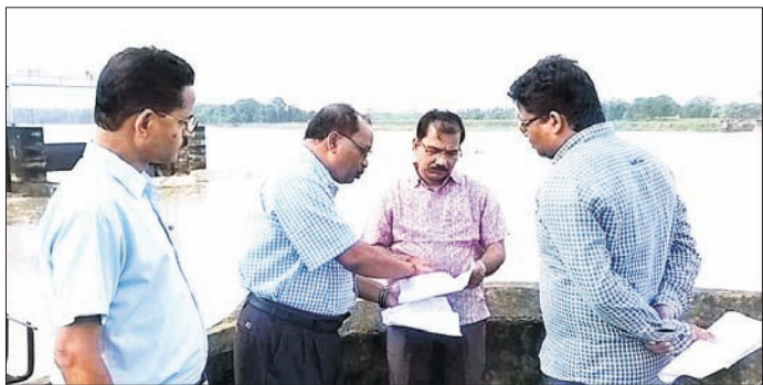
ଜିଲାପାଳ ଜ୍ଞାନରଞ୍ଜନ ଦାସ ଆଖୁଆପଦା ନିକଟରେ ବନ୍ୟା ସ୍ଥିତି ଅନୁଧ୍ୟାନ କରୁଛନ୍ତି ।