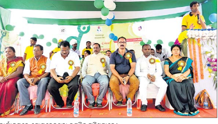
କାର୍ଯ୍ୟକ୍ରମରେ ଯୋଗଦେଇଥିବା ଉପସ୍ଥିତ ଅତିଥିମାନେ ।