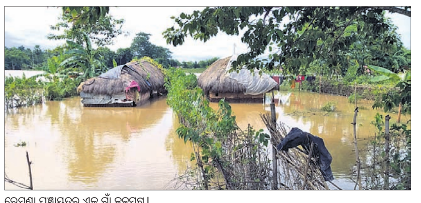
ରେମୁଣା ପଞ୍ଚାୟତର ଏକ ଗାଁ କଳମଗ୍ନ।

ଯାଇଥିବା ଫୁଲୁଡ଼ି ରାସ୍ତାରେ ୩ ଫୁଟ ଉଚ୍ଚରେ ବନ୍ୟା ଜଳ ପ୍ରବାହିତ ହେଉଥିବାରୁ ଯାତାୟତ ବାଧାପ୍ରାପ୍ତ ହୋଇଛି। ନିଧୁପଣା-ପରିକ୍ଷା ରାସ୍ତାର ନିଧୁପଣା ରେଳଷ୍ଟର ଠାରେ ଓ ପରିକ୍ଷା-ବାହାଁଳ ପଞ୍ଚାୟତ ମଧ୍ୟ ପାଣି ଘେରରେ ରହିଛି। ବାଲେଶ୍ୱର ରାସ୍ତାର ବାଲିଘାଟଠାରେ ବନ୍ୟାଜଳ ପ୍ରବାହିତ ହେଉଥିବାରୁ ଯାତାୟତ ବିଚ୍ଛିନ୍ନ ରହିଛି। ରାଉତପଡ଼ା ବିନ୍ୟାଧର ପୋଖରୀଠାରେ ଥିବା ଭରଡ଼ାପାଇ ସେତୁ ବନ୍ୟାଜଳରେ ବୁଡ଼ି ଯାଇଥିବାରୁ ଗମନାଗମନ ବନ୍ଦ ରହିଛି। ଗଡ଼ପଦା, ରାଉତପଡ଼ା, ନଗ୍ରମ, ଓଡ଼କା, ଫୁଲୁଡ଼ି, ମଥାନା ପଞ୍ଚାୟତରେ ବନ୍ୟା ଜଳରେ ଚାଷଜମି ବୁଡ଼ି ରହିଛି।