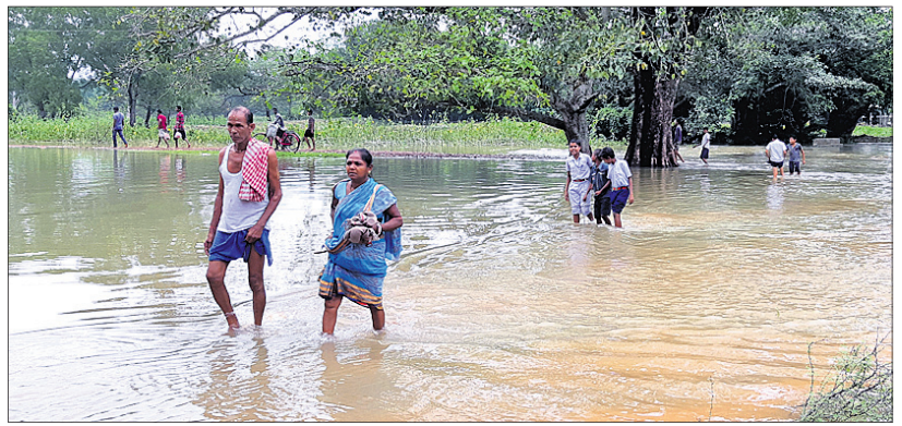
ବିପୁଲିଆ ଅଞ୍ଚଳରେ ବନ୍ୟା ଜଳରେ ପଶି ଲୋକେ ଯାତାୟତ କରୁଛନ୍ତି।

ସୋର/ବିପୁଲିଆ, ୧୩୧୦ (ଡି.ଏନ.ଏ.) ୩ ଦିନ ଧରି ଲଗାଶ ବର୍ଷା ଯୋଗୁଁ କାଂଶବାଂଶ ଓ ପିତାକାହିଆ ନଦୀରେ ବନ୍ୟାଜଳ ଆସି ବହୁ ଅଞ୍ଚଳକୁ ଜଳମଗ୍ନ କରିଛି। ଏଥିଯୋଗୁଁ ବାଲେଶ୍ୱର ଜିଲ୍ଲା ସୋର ଧ୍ୟାନସିପାଳିଟି ସମେତ କୁଳ ଅଞ୍ଚଳରେ ବ୍ୟାପକ କ୍ଷୟକ୍ଷତି ଘଟିଛି। ଦେହଶହରୁ ଅଧିକ ମାଟିଘର ବର୍ଷା ଓ ବନ୍ୟା ପ୍ରଭାବରେ ଛୁଟି ପଡ଼ିଛି। ଗ୍ରାମ୍ୟରାସ୍ତା ଓ ଚାଷ ଜମିରେ ପାଣିରେ ବୁଡ଼ି ରହିଛି। ସୋର ଧ୍ୟାନସିପାଳିଟି ଅନ୍ତର୍ଗତ କମରପୁର, ରାଇପୁର, ବରଫକଳ ଛକ, ଖରିଦା, ଡ୍ରେଜେରୀ କଲୋନୀ, ପଠାଶମହଲ ରାସ୍ତାରେ ଯାତାୟତ ବାଧାପ୍ରାପ୍ତ ହୋଇଛି। ସ୍ଥାନୀୟ ଧ୍ୟାନସିପାଳିଟିର ବିଭିନ୍ନ ଖର୍ଚ୍ଚରେ ଡ୍ରେନେଜ ବ୍ୟବସ୍ଥା ଠିକ୍ ନ ଥିବାରୁ ପରିସ୍ଥିତି ଗମ୍ଭୀର ରୁପ ନେଇଛି। ୧୬ ନମ୍ବର କାଟାୟାରକପଅରେ ସକ୍ଷ୍ମ ପୋଲ ଥିବାରୁ ଉଦ୍‌ବୃତ୍ତ ବର୍ଷାପାଣି ନିକ୍ଷାପିତ ହୋଇ ନ ପାରି ଉତ୍ତରରେଶ୍ୱର, ଆଳସଫ୍ୟାକ୍ଟି ଛକ, ଛଣ୍ଡରପୁର, ବଡ଼ଖୁରା, ଦହପଡ଼ା ଆଦି ଗ୍ରାମ୍ୟ ରାସ୍ତାରେ ପାଣି ଜମିରହିଛି। ସେହିପରି ତଳନଗର, ସବିରା, ସାଜନପୁର ଆଦି ପଞ୍ଚାୟତର ରାସ୍ତା ପାଣିରେ ବୁଡ଼ି ରହିଥିବା ବେଳେ କେତେକ ଅଞ୍ଚଳର ଲୋକଙ୍କ ଘରେ ପାଣି