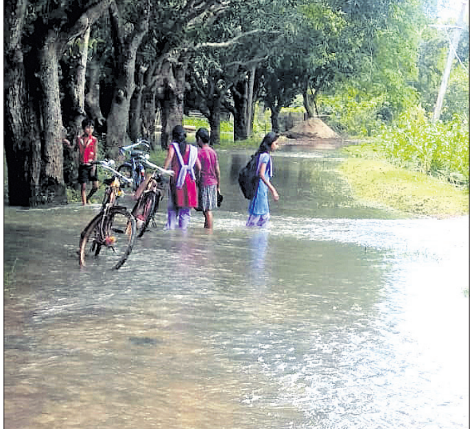
ବାକଟିରା-ସରମରା ରାସ୍ତାରେ ବର୍ଷାପାଣି ।

ଉପରେ ପାଣି ସୁଅ ବାଲିଛି । ଫଳରେ ଏହି ରାସ୍ତାରେ ଯାତାୟତ ଏକ ପ୍ରକାର ଠପ୍ ହୋଇଯାଇଛି । ଦୀର୍ଘବର୍ଷ ଧରି ମରାମତି ଅଭାବରୁ ରାସ୍ତା ଅବସ୍ଥା ଶୋଚନୀୟ ହୋଇପଡ଼ିଛି । ଲୋକେ ଯାତାୟତ କରିବାରେ ହଇରାଣ ହେଉଛନ୍ତି । ଏନେଇ ବାରସର ପଞ୍ଚାୟତରୁ ଜିଲା ପ୍ରଶାସନ ପର୍ଯ୍ୟନ୍ତ ରୁହାରି କଲେ ମଧ୍ୟ ରାସ୍ତାର ଭାଗ୍ୟ ବଦଳୁ ନ ଥିବା କୁହାଯାଇଛି । ଏହି ରାସ୍ତା ବାକଟିରା ପାଖ କାବରୋଳ ଓ ସରମରା ପାଖ ଓଡ଼ିଶା ପଞ୍ଚାୟତ ଅଧୀନରେ ରହିଛି । ଦୁଇ ପଞ୍ଚାୟତକୁ ଏହି ରାସ୍ତା ସଂଯୋଗ ହୋଇଥିଲେ ମଧ୍ୟ କୌଣସି ପଞ୍ଚାୟତ ପକ୍ଷରୁ ରାସ୍ତା ତିଆରି ପାଇଁ ପଦକ୍ଷେପ ନିଆଯାଇ ନ ଥିବା ଗୁମ୍ଫା ନୋକେ ଅଭିଯୋଗ କରିଛନ୍ତି । ସ୍କୁଲ କଲେଜ ଛାତ୍ରଛାତ୍ରୀ ଆଶୁଏ ପାଣିରେ ଯିବା ଆସିବା କରନ୍ତି । ସେହିପରି ବଡ଼ ବର୍ଦ୍ଧକର୍ଯ୍ୟ ଗ୍ରାମରୁ ଆଗରପଡ଼ା-ବରପଦା ରାସ୍ତାକୁ ସଂଯୋଗ କରୁଥିବା ମୁଖ୍ୟରାସ୍ତା ପାଣିରେ ବୁଡ଼ି ରହିଛି ।