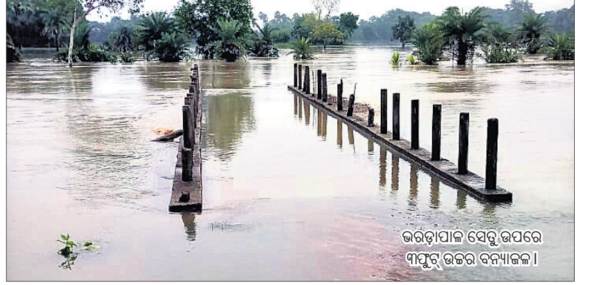
ଭରଡ଼ାପାଇ ସେତୁ ଉପରେ ମାୟୁରଭଞ୍ଜର ବନ୍ୟାଜଳ।