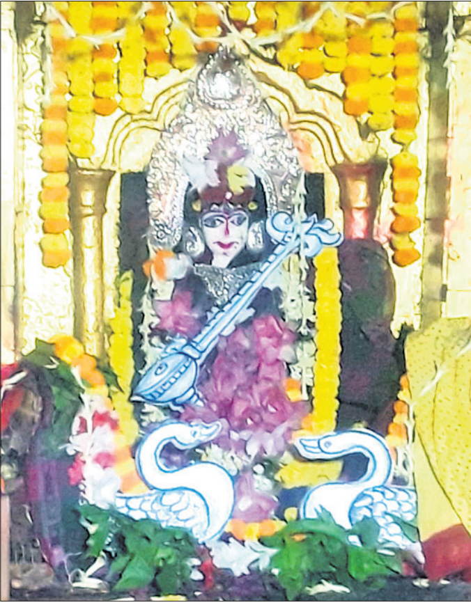
ଆରତି ଆଖଣ୍ଡଳମଣି ପୀଠରେ ଶନିବାର ମା' ତୁରୀଙ୍କ ସମ୍ବନ୍ଧେ ବେଶ ।

ହ୍ରାସ ପାଇଛି । ଫଳରେ ବନ୍ୟା ସ୍ଥିତିରେ ସୁଧାର ଆସୁଛି । ଭପରମୁଣ୍ଡରେ ହୋଇଥିବା ବର୍ଷାଜଳ ସମୁଦ୍ରକୁ ନିଷ୍ଠାସିତ ହୋଇଗଲେ ଆଉ ବନ୍ୟା ସ୍ଥିତି ରହିବ ନାହିଁ । ଗତ ୨୪ ଘଣ୍ଟା ମଧ୍ୟରେ ଆଖୁଆପଦାରେ ୨୭.୮ ମିମି, ଆନନ୍ଦପୁରରେ ୭୭.୭, ସାମପାଟଣାରେ ୭୨.୨, କେନ୍ଦୁଝରରେ ୪୩.୮, ଠାକୁରମୁଣ୍ଡାରେ ୯୩.୦, ଚମ୍ପୁଆରେ ୧୯.୮ ଓ ଯାଜପୁରରେ ୮୪.୦ ମିମି ବର୍ଷା ହୋଇଥିବା ରେକର୍ଡ କରାଯାଇଛି ।