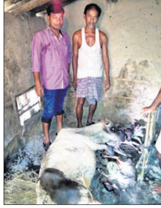
ଗାଈ ନିକଟରେ ଶୋଇଥିବା ୩ ବାହୁରି।