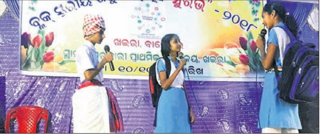
ସୁରଭି କାର୍ଯ୍ୟକ୍ରମରେ ଭାଗ ନେଇଥିବା କଣ୍ଟାପତା ସ୍କୁଲ ଛାତ୍ରାଛାତ୍ରୀ।