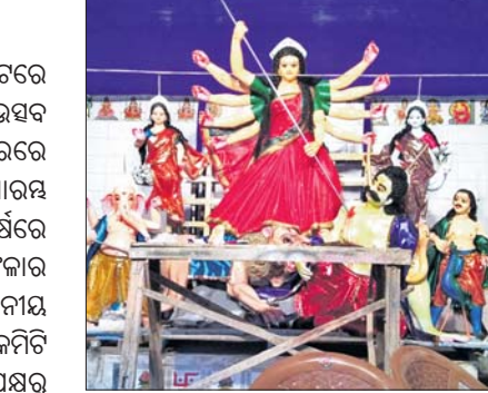
ଶେଷ ପର୍ଯ୍ୟାୟରେ ଦୁର୍ଗାମେଡ଼ ପ୍ରସ୍ତୁତି ।

କେନ୍ଦ୍ରରେ ସହର ତେଲି ମାର୍କେଟରେ ଦୁର୍ଗାପୂଜା କର୍ମିତ ପକ୍ଷରୁ ଭାଇତାରୀର ଉତ୍ସବ ଦୁର୍ଗାପୂଜା ପାଇଁ ପ୍ରସ୍ତୁତି କୋରସୋରେ ଚାଲିଛି । ୧୯୬୪ ମସିହାରେ ଆରମ୍ଭ ହୋଇଥିବା ଏହି ପୂଜା ୫୪ ବର୍ଷରେ ପହଞ୍ଚିଥିବା ବେଳେ ଏହାକୁ ଶାନ୍ତିଶୃଙ୍ଖଳାର ସହ ପାଳନ କରିବା ପାଇଁ ସ୍ଥାନୀୟ ବର୍ଗିକ ସଂଘ ତଥା ଅନ୍ୟାନ୍ୟ ପୂଜା କର୍ମିତ ସହଯୋଗରେ ଦୁର୍ଗା ପୂଜା କର୍ମିତ ପକ୍ଷରୁ ଉଦ୍ୟମ କରାଯାଇଛି । ମୂର୍ତ୍ତିକାର ଚିକିତ୍ସା ତତ୍ଵାବଧାନରେ ମୂର୍ତ୍ତିଗଠା କାମ ଶେଷ ହେବାକୁ ବସିଛି । ସେ ତିନି ବର୍ଷ ହେଲା ଏହି ମୂର୍ତ୍ତି ନିର୍ମାଣ କରିଆସୁଛନ୍ତି । ଏଣୁ ଏହାକୁ ଆକର୍ଷଣୀୟ କରିବା ପାଇଁ ସେ ପ୍ରୟୋଗ ରଚାଉଛନ୍ତି ।