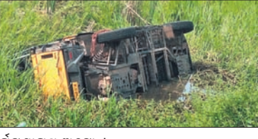
ଘଟଣାସ୍ଥଳରେ ଅଟୋ ।