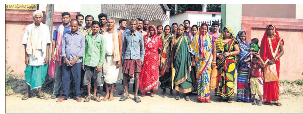
ଶୌଚାଳୟ ଦାବିରେ ହିତାଧିକାରୀମାନେ ପଞ୍ଚାୟତ ଅଧିକାରୀଙ୍କୁ ପ୍ରତିବାଦ କରୁଛନ୍ତି।

କସ୍ତିପଦା ବ୍ଲକ୍ ପ୍ରଶାସନ ପିଛା ଛାଡ଼ୁନି ବିବାଦ। ବିଭିନ୍ନ ବିବାଦରେ ବ୍ଲକ୍ ପ୍ରଶାସନ ଉନ୍ନତ ହେଉଥିବା ବେଳେ ପୁଣି ସ୍ୱଚ୍ଛ ଭାରତ ଅଭିଯାନର ଶୌଚାଳୟ ନିର୍ମାଣରେ ଆଉ ଏକ ଫର୍ଦ୍ଦ ଯୋଡି ହୋଇଯାଇଛି। ସ୍ୱଚ୍ଛତା ଓ ମଳମୁକ୍ତ ପଞ୍ଚାୟତ ଗଠନ ଉଦ୍ଦେଶ୍ୟରେ ଆରମ୍ଭ ହୋଇଥିବା ଏହି ଯୋଜନା କସ୍ତିପଦା ବ୍ଲକ୍ରେ ସମ୍ପୂର୍ଣ୍ଣ ଫେଲ୍ ମାରିଥିବା ଅଭିଯୋଗ ହେଉଛି। ବ୍ଲକ୍ ଅଧୀନ କାମବଣୀ ପଞ୍ଚାୟତକୁ ୨୦୧୫ ମସିହାରେ ପରିମଳମୁକ୍ତ ପଞ୍ଚାୟତ ଭାବେ ଘୋଷଣା କରାଯାଇଥିଲା। ହେଲେ ଏହାର ୩ ବର୍ଷ ପରେ ବି ବହୁ ପଞ୍ଚାୟତବାସୀଙ୍କ ଘରେ ଶୌଚାଳୟ ନିର୍ମାଣ ହୋଇ ନ ଥିବା ଅଭିଯୋଗ ହୋଇଛି। ଶତାଧିକ ଗ୍ରାମବାସୀଙ୍କ ଘରେ ଶୌଚାଳୟ ନ ଥିବାବେଳେ ଏହି ପଞ୍ଚାୟତକୁ କିଏ କିପରି ମଳମୁକ୍ତ ପଞ୍ଚାୟତ ଘୋଷଣା କଲେ ଏହାର ଉଚ୍ଚ ସ୍ତରୀୟ ତଦନ୍ତ ଦାବି କରିଛନ୍ତି ଗ୍ରାମବାସୀ।