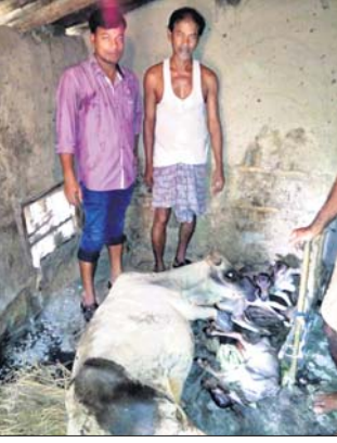
ଗାଈ ନିକଟରେ ଶୋଇଥିବା ୩ ବାଛୁରୀ ।