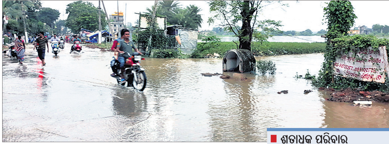
ଭୁବ୍ଵାବଳଙ୍କରେ ରାସ୍ତାରେ ସହରକୁ ପ୍ରବେଶ କରୁଥିବା ଭୁବ୍ଵାବଳଙ୍କର ବନ୍ୟା ଜଳ।