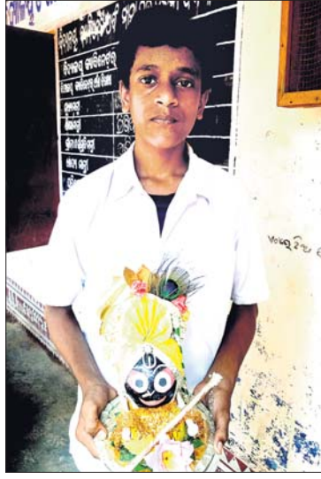
ଜଗନ୍ନାଥ କଳାକୃତିରେ ନିମଗ୍ନ ଶିଶୁ ଚିତ୍ରକର

ବର୍ତ୍ତମାନ ପର୍ଯ୍ୟନ୍ତ ସଂଗୃହୀତ ଉପାଦାନକୁ ନେଇ ହସ୍ତକଳା ସାମଗ୍ରୀ ପ୍ରସ୍ତୁତ କରାଯାଇଛି। ଏହି ପ୍ରସ୍ତୁତ କରାଯାଇଥିବା ସମସ୍ତ ଶିଶୁ ଚିତ୍ରକର ଦ୍ଵାରା ପ୍ରସ୍ତୁତ କରାଯାଇଥିବା ଚିତ୍ର ପ୍ରସ୍ତୁତ କରାଯାଇଛି।