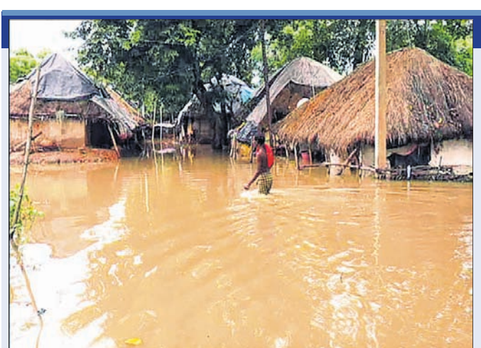
ଜଳବନ୍ୟାରେ ଥିବା କୁଣ୍ଡସାହି ବାସିନ୍ଦା।

ସାମୁଦ୍ରିକ ଝଡ଼ ତିରଲି ପ୍ରଭାବରେ ଭୁଲ ଦିନ ଧରି ଲାଗିରହିଥିବା ଜଳାଣ ବର୍ଷା ମୟୂରଭଞ୍ଜ ଜିଲ୍ଲା ବଡ଼ସାହି ବ୍ଲକରେ ଥିବା ଯାଇଛି। ହେଲେ ବନ୍ୟା ପରବର୍ତ୍ତୀ ଦୁର୍ଭିକା କମିବା ନାଁ ଧଳୁନି। ବର୍ଷା କମିବାରୁ ପ୍ରଭାବକଳ ଓ ଗଜାହାର ନଦୀର ଜଳ ପତନ ହୁଏ ହେବାରେ ଲାଗିଛି।