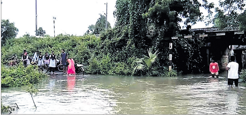
ସୋର ସବିରା ଗଳାପୋଲ ରାସ୍ତାରେ ପାଣି।