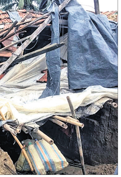
ବାଲିଆପାଇ କୁକରେ ଭାଙ୍ଗି ପଡ଼ିଥିବା ଏକ ମାଟି ଘର।