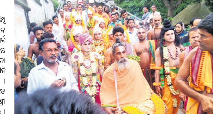
ଅଷ୍ଟସଖୀମାନେ ନାଳମାଧବଙ୍କୁ ପୂଜାର୍ଚ୍ଚନା କରି ବ୍ରତ ପାଇଁ ଆସୁଛନ୍ତି ।

ଆଶ୍ୱିନ ମାସ ନୃତ୍ୟ ପଞ୍ଚମୀ ତିଥି ଶନିବାରରେ କଟିଲୋ ନାଳମାଧବ ଜାଉଜ ଶରଦ ରାସୋହର ପ୍ରଥମ ପର୍ବ ନୃତ୍ୟ ବ୍ରତ ମହାସମାରୋହରେ ଆରମ୍ଭ ହୋଇଛି । ପାରମ୍ପରିକ ଉତ୍ସାହ ଉଦ୍‌ଘାଟନା ମଧ୍ୟରେ ସ୍ଥାନୀୟ ମହାନଦୀ ଶଯ୍ୟା ଏହି ଉତ୍ସବ ପାଇଁ ମୁଖ୍ୟତ ହୋଇ ଉଠିଛି । ଶ୍ରୀରାଧା ଓ ଅଷ୍ଟସଖୀ ବେଶରେ ସଜ୍ଜିତ କୁନି କୁନି ପିଲାମାନେ ଅପରାହ୍ଣରେ ଶ୍ରୀ ନାଳମାଧବଙ୍କୁ ପୂଜାର୍ଚ୍ଚନା କରିଥିଲେ । ପୂଜାର୍ଚ୍ଚନା କରି ମନ୍ଦିରରୁ ଅଷ୍ଟସଖୀଙ୍କ ସହିତ ଶ୍ରୀରାଧା ଫେରିବା ପରେ ଅପେକ୍ଷାକୃତ ମହିଳାମାନେ ସେମାନଙ୍କୁ ବନ୍ଦାପନା କରିଥିଲେ । ଅପରାହ୍ଣ ପ୍ରାୟ ୫ଟାରେ ପ୍ରଥମ ଗୋପାଳନା ଶ୍ରୀରାଧାଙ୍କ ସହିତ ଏକ ଶୋଭାଯାତ୍ରାରେ ଗ୍ରାମ ପରିକ୍ରମା କରି ସ୍ଥାନୀୟ ମାନ୍ଦମୋକା ପଡ଼ିଆକୁ ଆସିଥିଲେ । ଗ୍ରାମ ପରିକ୍ରମା କରିବା ସମୟରେ ବୁଦ୍ଧିଶୀଳ, ଗୁହସ୍ତମାନେ ନିଜ ନିଜ ବ୍ୱାରେ ପୂର୍ଣ୍ଣ କୁମ୍ଭ ଓ କଳସ ରଖି ଶ୍ରୀରାଧା ଏବଂ ଅଷ୍ଟସଖୀମାନଙ୍କୁ ସ୍ୱାଗତ କରିଥିଲେ । ଏହି