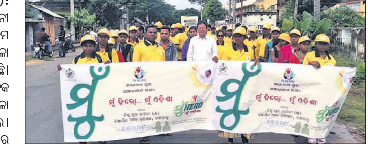
ବିଜୁ ମୁଦ୍ରାସିନୀ ଚରଫତୁ ଅନୁଷ୍ଠିତ ରାଲି ।