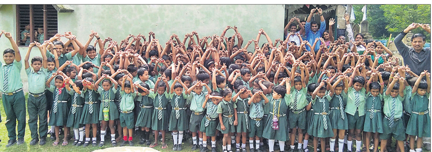
ତିର୍ତ୍ତୋଲ ବ୍ଲକ ନାଉସିରାସ୍ଥିତ ରଘୁପତି ଆଇଡିଆଲ ସ୍କୁଲର ଛାତ୍ରାଛାତ୍ରୀ ଓ ଶିକ୍ଷୟିତ୍ରୀଶିକ୍ଷକ 'ପ୍ଲାଷ୍ଟିକ ଫ୍ରି ଓଡ଼ିଶା' ଅଭିଯାନକୁ ସମର୍ଥନ ଜଣାଉଛନ୍ତି।

ଏରସମା, ୧୩।୧୦(ସ.ପ୍ର.): ଏରସମା ବ୍ଲକ ଅନ୍ତର୍ଗତ କୃଷ୍ଣଚନ୍ଦ୍ରପୁର ପଞ୍ଚାୟତସ୍ଥିତ ଅରତା ଗ୍ରାମର ଗ୍ରାହ୍ୟମାନଙ୍କୁ ଯୋଗାଣକରି ଏ ସମ୍ପର୍କରେ ବାରମ୍ବାର ଅଭିଯୋଗ କଲେ ମଧ୍ୟ କୌଣସି ସୁଫଳ ମିଳୁନାହିଁ। ଏହି ଗ୍ରାମରେ ୧୦୦ ପରିବାର ବସବାସ କରନ୍ତି। ଗାଁ ପାଖରେ ବସିଥିବା ଗ୍ରାହ୍ୟମାନଙ୍କ ଗତ ୭ ଦିନରୁ ଦିନ ପୋଡିଯାଇଥିଲା। ଫଳରେ ୭ ଦିନ ହେଲା ଲୋକେ ଅନ୍ଧାରରେ କାଳାତିପାତ କରୁଛନ୍ତି। କେନ୍ଦ୍ରୀୟ ଯୁକ୍ତପାର୍ଟି ଅଧିକ କଷ୍ଟରେ ଗଲଣି। ପିଲାମାନେ ପାଠ ପଢ଼ି ପାରୁ ନାହାନ୍ତି। ସେଠାରେ ଏକ ନୂତନ ଗ୍ରାହ୍ୟମାନଙ୍କ ବସାଭବା ପାଇଁ ଗ୍ରାମବାସୀ ଦାବି କରୁଥିଲେ ମଧ୍ୟ ସୁଫଳ ମିଳୁନାହିଁ। ବିଭାଗୀୟ ଅଧିକାରୀ ଏଥିପ୍ରତି ଦୃଷ୍ଟି ଦେବାକୁ ଦାବି ହେଉଛି।