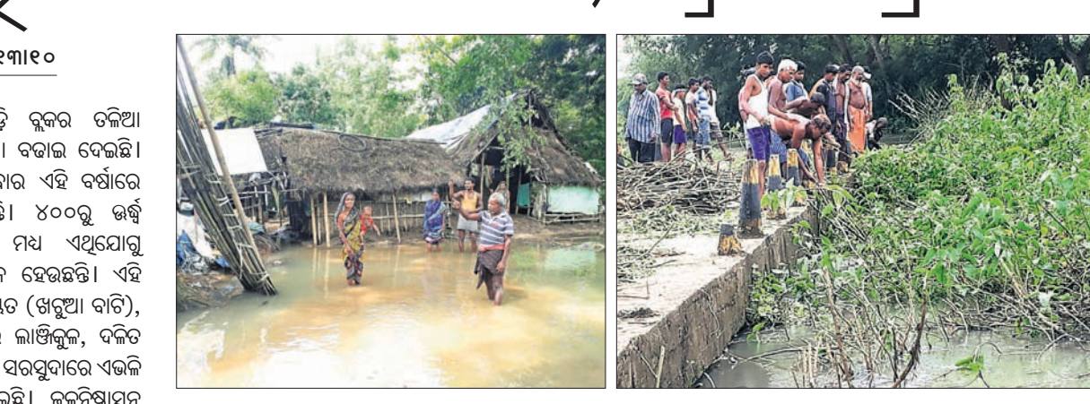
ବିଚ୍ଛିନ୍ନ ଅଞ୍ଚଳରେ ଜଳବନ୍ଧା ହୋଇ ରହିଥିବା ଲୋକମାନେ। ହଂସୁଆ ଗୋର ସଫେଇ ହୋଇ ନ ଥିବାରୁ ଜଳ ନିଷାଧିତ ବାଧାପ୍ରାପ୍ତ ହେଉଛି।