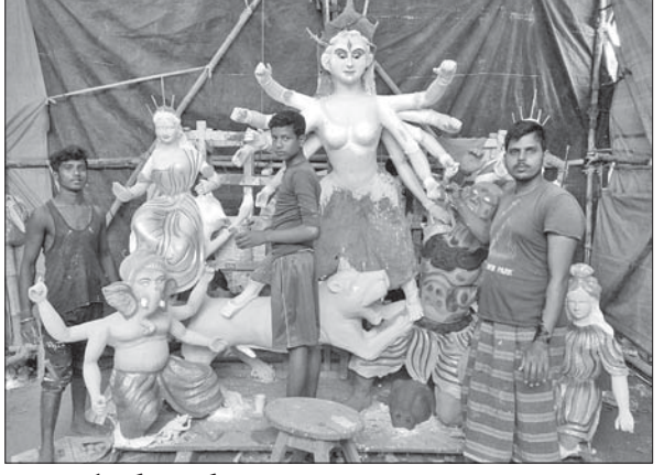
ମା'ଙ୍କ ମୂର୍ତ୍ତି ନିର୍ମାଣ କାର୍ଯ୍ୟ ଆଗେଇ ଚାଲିଛି। ମୁଖ୍ୟା ମୂର୍ତ୍ତିରେ ରଙ୍ଗ ଦେବା କାର୍ଯ୍ୟ ଚାଲିଥିବା ବେଳେ ନିଆଳ ହାଟପୁର ଦୁର୍ଗାମେଡ଼ର ପ୍ରସ୍ତୁତି ପର୍ବ ଶେଷ ପର୍ଯ୍ୟାୟରେ ପହଞ୍ଚିଛି। ଚଳିତ ବର୍ଷ ଆଜିର ମେଡ଼ିକାଲ ରୋଡ଼ରେ

ଆଜି ରୁକରେ ଦୁର୍ଗାପୂଜା ପାଇଁ ପ୍ରସ୍ତୁତି ପର୍ବ ଶେଷ ପର୍ଯ୍ୟାୟରେ ପହଞ୍ଚିଛି। ଏଥିପାଇଁ ରୁକର ସମସ୍ତ ପୂଜାକର୍ମି ପକ୍ଷରୁ ସାଧୁସାଧୁ ଆରମ୍ଭ ହୋଇଯାଇଛି। ଚଳିତ ବର୍ଷ ଆଜିରେ ପ୍ରାୟ ୧୨୦୦ ଉର୍ଗାମେଡ଼ ନିର୍ମାଣ କରାଯାଇଛି। ଆଉ ମାତ୍ର ଗୋଟି ଦିନ ପରେ ଦୁର୍ଗାପୂଜାର ମାହୋଳ ଆରମ୍ଭ ହୋଇଯିବ। କେତୋଟି ପୂଜାମଣ୍ଡପରେ ଏବେ ଦୁର୍ଗାମେଡ଼ର ରଙ୍ଗ ଦେବା କାର୍ଯ୍ୟ ଚାଲିଥିଲା କେଳୁ ଆଉ କେତୋଟି ସ୍ଥାନରେ ମେଡ଼ କାର୍ଯ୍ୟ ଆରମ୍ଭ ହେଉଛି। ଆଜି ରାଜବାଟିର ଦୁର୍ଗାମେଡ଼ ରୁକର ସର୍ବପୂରାତନ ହୋଇଥିବା ବେଳେ ଏହାକୁ ଦେଖିବାକୁ ବହୁ ଲୋକଙ୍କ ଭିଡ଼ ହୋଇଥାଏ। ଏଠାରେ ମା'ଙ୍କ