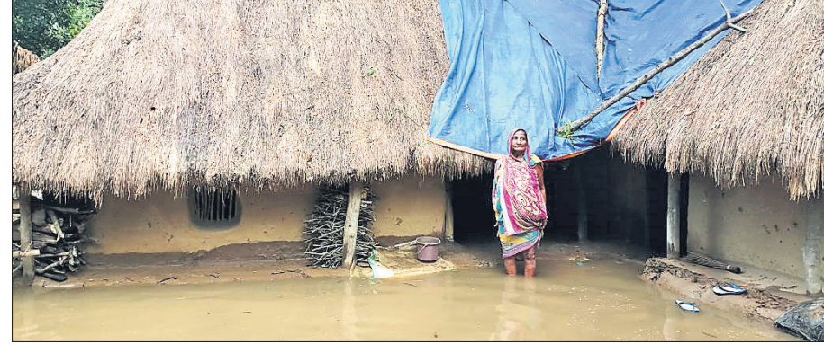
ପାଣି ଘେରରେ ଥିବା ଏକ ପରିବାର ।

ପାରାଦୀପ ଲକ୍ଷ ଆନା ଅନ୍ତର୍ଗତ ଗଡ଼ ବଜାରରେ ଥିବା ପଞ୍ଚାବ ନ୍ୟାଶନାଲ ବ୍ୟାଙ୍କରେ ଶନିବାର ଅଗ୍ନିକାଣ୍ଡ ଘଟିଛି । ଏଥିରେ ବ୍ୟାଙ୍କର ବହୁ ଆସବାବପତ୍ର ପୋଡ଼ିଯାଇଛି । ଏସି, ଟେକ୍ସ, ଟେୟାର, କାଗଜପତ୍ର, କ୍ୟାବିନ ଆଦି ଜଳିଯାଇଛି । ଅଗ୍ନିକାଣ୍ଡର କାରଣ ସ୍ପଷ୍ଟ ହୋଇ ନ ଥିଲେ ମଧ୍ୟ ଶବ୍ଦ ସମ୍ବନ୍ଧରେ ଏପରି ଘଟଣା କୁହାଯାଉଛି । ମାସର ଦ୍ୱିତୀୟ ଶନିବାର ଥିବାରୁ ବ୍ୟାଙ୍କ ବନ୍ଦ ଥିଲା । ସନ୍ଧ୍ୟାରେ ଅଗ୍ନିକାଣ୍ଡ ଦେଖି ସ୍ଥାନୀୟ ଲୋକେ ବ୍ୟାଙ୍କ କର୍ମଚାରୀ ଓ ଦମକଳ ବାହିନୀକୁ ଖବର ଦେଇଥିଲେ । କୁଳଜ ଓ ପାରଦୀପ ବନ୍ଦର ଦମକଳ ବାହିନୀ ପହଞ୍ଚି ନିଆଁକୁ ଆୟତ୍ତ କରିଥିଲେ । ପୋଲିସ, ବ୍ୟାଙ୍କ କର୍ମଚାରୀ ପହଞ୍ଚି ଟଙ୍କା ସୁରକ୍ଷିତ ରଖିବାକୁ ବ୍ୟବସ୍ଥା କରିଥିଲେ । ଗତ ଶୁକ୍ରବାର ସନ୍ଧ୍ୟାରେ ବ୍ୟାଙ୍କକୁ ସଂଯୋଗ ହୋଇଥିବା ବିଦ୍ୟୁତ୍ ତାରରୁ ଶବ୍ଦ ସମ୍ବନ୍ଧରେ ନିଆଁ ବାହାରିଥିବା ସ୍ଥାନୀୟ ଲୋକେ ଦେଖିଥିଲେ ବୋଲି କହିଛନ୍ତି ।