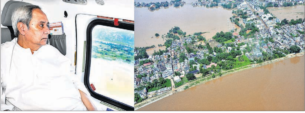
ମୁଖ୍ୟମନ୍ତ୍ରୀ ନବୀନ ପଟ୍ଟନାୟକ ଆକାଶମାର୍ଗରୁ ଗଞ୍ଜାମ ଜିଲ୍ଲାର ବନ୍ୟାଞ୍ଚଳ ପରିଦର୍ଶନ କରୁଛନ୍ତି।