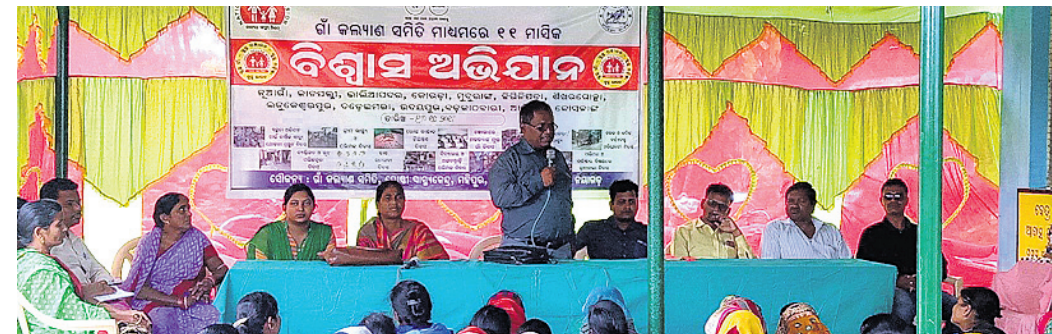
ବିଶ୍ୱାସ ଅଭିଯାନ କାର୍ଯ୍ୟକ୍ରମରେ ଅତିଥିବୃନ୍ଦ ।

ନୟାଗଡ଼ ଜିଲ୍ଲା ନୂଆଗାଁ କୁଳ ଉଦୟପୁର ପଞ୍ଚାୟତ ପରିସରରେ ଶନିବାର ଗାଁ କଲ୍ୟାଣ ସମିତି ମାଧ୍ୟମରେ ୧୧ ମାସିକ ବିଶ୍ୱାସ ଅଭିଯାନ ଅନୁଷ୍ଠିତ ହୋଇଯାଇଛି । ଉଦୟପୁର ସରପଞ୍ଚ ଅଧିକ କୁମାର ଗୋଷ୍ଠୀ ସ୍ୱାସ୍ଥ୍ୟ କେନ୍ଦ୍ର ତଥା ଗାଁ କଲ୍ୟାଣ ସମିତି ସୌକର୍ଯ୍ୟଗରେ ଅନୁଷ୍ଠିତ ଏହି ସଭାରେ ସ୍ୱାସ୍ଥ୍ୟ ସଚେତନତା ବିଷୟରେ ଲୋକମାନଙ୍କୁ ବୁଝାଯାଇଥିଲା । ସ୍ୱଳ୍ପ ଭାରତ ଯୋଜନାର ଏକ ଅଂଶ ଭାବେ ଏହି ବିଶ୍ୱାସ ଅଭିଯାନ ମାଧ୍ୟମରେ ୧୧ ମାସ ମଧ୍ୟରେ କିଛି ଜନସାଧାରଣ ସ୍ତରୁ ନିରୋଗ ରହିବା ସହିତ ସ୍ତରୁ ପରିବେଶ ଗଠନ କରିପାରିବେ ବେ ବିଷୟରେ ଅତିଥିମାନେ ମତ ପ୍ରକାଶ କରିଥିଲେ । କିଛି ଭାବେ ଲୋକମାନଙ୍କ ମଧ୍ୟରେ ସଚେତନତା ସୃଷ୍ଟି କରାଯାଇ ଅତି ସହଜ ଉପାୟରେ ଏକ ସ୍ତରୁ ପରିବେଶ