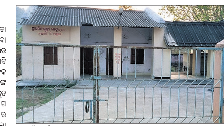
ନୂଆଗାଁ ପ୍ରାଥମିକ ସ୍ୱାସ୍ଥ୍ୟକେନ୍ଦ୍ର ।

ସରକାର ଶିକ୍ଷା ଓ ସ୍ୱାସ୍ଥ୍ୟକୁ ଗୁରୁତ୍ୱ ଦେବା ସହ ସମସ୍ତେ କିପରି ଉତ୍ତମ ସ୍ୱାସ୍ଥ୍ୟ ସେବା ଓ ଶିକ୍ଷା ପାଇ ପାରିବେ ସେଥିପାଇଁ ବିଭିନ୍ନ ଯୋଜନା ମାଧ୍ୟମରେ କୋଟି କୋଟି ଟଙ୍କା ଖର୍ଚ୍ଚ କରୁଛନ୍ତି । କିନ୍ତୁ କେତେକ ସ୍ଥାନରେ ବିଭାଗୀୟ ଅଧିକାରୀମାନଙ୍କ ପରିଚାଳନାଗତ ତ୍ରୁଟି ଯୋଗୁ ପ୍ରକୃତ ହିତାଧିକାରୀ ସେ ସୁବିଧା ସୁଯୋଗ ପାଇବାକୁ ବଞ୍ଚିତ ହେଉଛନ୍ତି । ଯାହାର କୁଳତ ଉଦାହରଣ ନୟାଗଡ଼ ଜିଲ୍ଲା ପୁଖ୍ୟାଳୟ ଠାରୁ ମାତ୍ର ୨୨ କିଲୋମିଟର ଦୂର ନୂଆଗାଁ କୁଳର ନୂଆଗାଁ ଗ୍ରାମ । ଦୀର୍ଘ ବର୍ଷ ହେଲା ଉକ୍ତ ଗ୍ରାମରେ ସ୍ୱାସ୍ଥ୍ୟ ଓ ଶିକ୍ଷା ଦ୍ୟବସ୍ଥା ବିପର୍ଯ୍ୟୟ ହୋଇ ପଡ଼ିଥିବା ନେଇ ଅଭିଯୋଗ ହୋଇ ଆସୁଥିଲେ ମଧ୍ୟ ଅଦ୍ୟାବଧି ସେସବୁ ସମସ୍ୟା ଦୂର ହୋଇ ପାରିନା ନାହିଁ । ନୂଆଗାଁ ଆଖପାଖ କୋରଡା, ଉଦୟପୁର, ଯୋରଡା, କାକେଡା, ନୂଆଗାଁ ଆଦି ପଞ୍ଚାୟତର ଲୋକମାନଙ୍କୁ ସ୍ୱାସ୍ଥ୍ୟ ସେବା ଯୋଗାଇ ଦେବା ପାଇଁ ନୂଆଗାଁଠାରେ ୧୯୮୨ ମସିହାରେ ୧୦ଶଯ୍ୟା ବିଶିଷ୍ଟ ଏକ ଡାକ୍ତରଖାନା ସ୍ଥାପନ କରାଯାଇଥିଲା । ଏଥିରେ ଜଣେ ଡାକ୍ତର, ଜଣେ ଫାର୍ମାସିଷ୍ଟ ସମେତ ଅନ୍ୟାନ୍ୟ କର୍ମଚାରୀ ରହିବାର ଦ୍ୟବସ୍ଥା