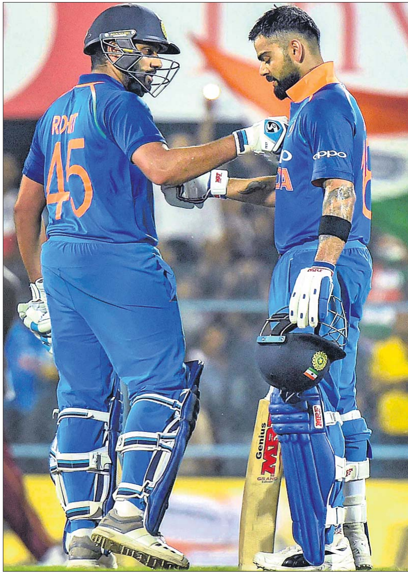
ଶତକ ହାସଲ ପରେ ବିରାଟ କୋହଲିଙ୍କୁ ବଧାଇ ଜଣାଉଛନ୍ତି ରୋହିତ ଶର୍ମା।

ଗୁଆହାଟୀର ବର୍ଷାପରା କ୍ରିକେଟ ଷ୍ଟାଡ଼ିୟମରେ ରବିବାର ବିରାଟ କୋହଲି ଓ ରୋହିତ ଶର୍ମାଙ୍କ ରାଜ୍ ଦେଖିବାକୁ ମିଳିଛି। ବିରାଟ ଓ ରୋହିତଙ୍କ ଶତକୀୟ ଇନିଂସ୍ ଏବଂ ଦ୍ୱିତୀୟ ଉଇକେଟରେ ୨୪୬ ରନର ଭାଗାଦାରି ବଳରେ ଭାରତ ପ୍ରଥମ ଦିନିକିଆ କ୍ରିକେଟ ମ୍ୟାଚରେ ଫ୍ରେଣ୍ଡ୍‌ସ୍‌ହିଜକୁ ୮ ଉଇକେଟରେ ପରାସ୍ତ କରିଛି। ଫ୍ରେଣ୍ଡ୍‌ସ୍‌ହିଜ ପକ୍ଷରୁ ଧାର୍ଯ୍ୟ ୩୨୩ ରନର ବିଜୟ ଲକ୍ଷ୍ୟକୁ ୪୨.୨ ଓଭରରେ ମାତ୍ର ୨ ଉଇକେଟ ହରାଇ ଅତିକ୍ରମ କରିଛି ଟିମ୍ ଇଣ୍ଡିଆ। ବିରାଟ ୧୪୦ ରନ କରି ଆଉଟ ହୋଇଥିବାବେଳେ ରୋହିତ ୧୫୨ ରନରେ ଅପରାଜିତ ରହି ଦଳକୁ ବିଜୟ ନିଶ୍ଚିତ କରାଇଛନ୍ତି। ୧୦୭ ବଲ୍‌ର ସମ୍ମୁଖୀନ ହୋଇଥିବା କୋହଲି ନିଜ ଇନିଂସ୍ ମଧ୍ୟରେ ୨୧ ଚୋକା ଓ ୨ ଛକା ଏବଂ ରୋହିତ ୧୧୭ଟି ବଲ୍ ଖେଳି ୧୫ ଚୋକା ଓ ୮ ଛକା ମାରିଛନ୍ତି। ଏଥିସହ ୫ ମ୍ୟାଚ ବିଶିଷ୍ଟ ସିରିଜରେ ଭାରତ ୧-୦ରେ ଅଗ୍ରଣୀଭାବେ ରହିଛି।