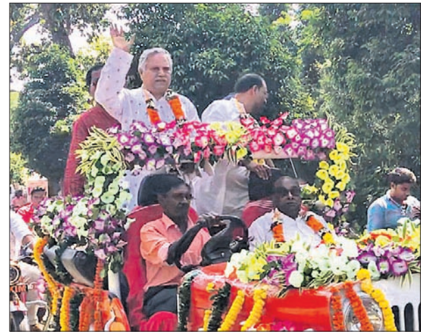
ପୂର୍ବତନ ମନ୍ତ୍ରୀ ଦାମୋଦର ରାଉତ ଓ ଯଜ୍ଞେଶ୍ୱର ବାବୁଙ୍କୁ ରାଲିରେ ସଭାସ୍ଥଳକୁ ପାଞ୍ଚୋଟି ନିଆଯାଇଛି।