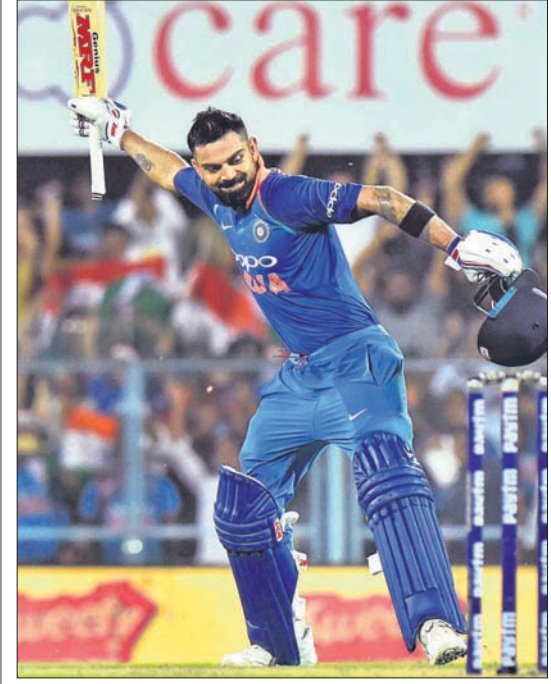
ଗୁଆହାଟୀରେ ରବିବାର ଅନୁଷ୍ଠିତ ଫ୍ରେଣ୍ଡ୍‌ସ୍‌ଫିଟ୍ ବିପକ୍ଷ ଦିନକିଆ କ୍ରିକେଟ ମ୍ୟାଚରେ ଶତକ ହାସଲପରେ ଚିନ୍ମିତ ଅଧିନାୟକ ବିରାଟ କୋହଲି। ଭାରତ ଏହି ମ୍ୟାଚରେ ୮ ଉଇକେଟରେ ବିଜୟୀ ହୋଇଛି। (ବିପୋର୍ଟ୍ ସେକ ପୃଷ୍ଠାରେ)