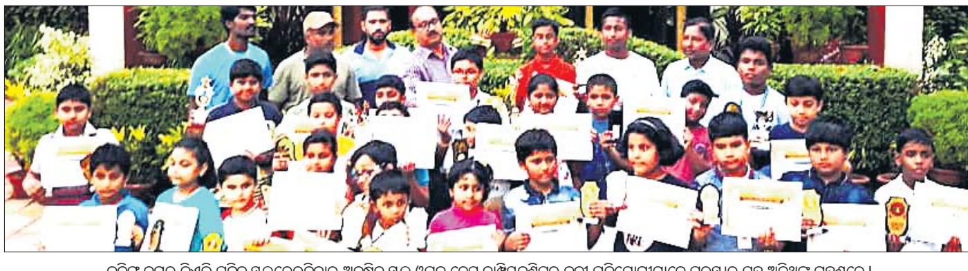
କଲିଙ୍ଗ ନଗର ଡିଏଲି ପବ୍ଲିକ୍ ସ୍କୁଲରେ ବିବାର ଅନୁଷ୍ଠିତ ସ୍କୁଲ ଓପନ ଟେସ୍ଟ ଚାମ୍ପିୟନଶିପର କୃତୀ ପ୍ରତିଯୋଗୀମାନେ ପୁରସ୍କାର ସହ ଅତିଥିଙ୍କୁ ଗହଣରେ।