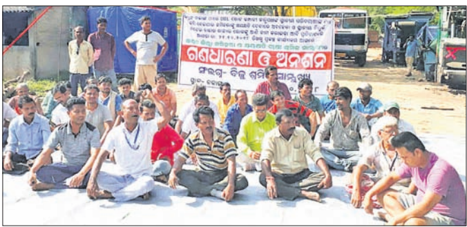
ଚରଣା ମହାବିଦ୍ୟାଳୟରେ ବିରୋଧ

ଚରଣା ମହାବିଦ୍ୟାଳୟ ପକ୍ଷରୁ ଯୋଷଣା କରାଯାଇଥିବା ସାଲନ-୧-୩୧ ପ୍ରତ୍ୟାହତ କରିନିଆଯାଇଛି। ଶାରଦ୍ୟ ପୂଜା ହୁଏ ପରେ ଆସନ୍ତା ୨୫ ତାରିଖ ଗୁରୁବାରରୁ ମହାବିଦ୍ୟାଳୟ ଖୋଲାଯିବ ବୋଲି ଅଧ୍ୟକ୍ଷ ଯୋଗେଶ୍ଵର କୁମାରଙ୍କ ପ୍ରତ୍ୟାଶା ରଖାଯାଇଛି।