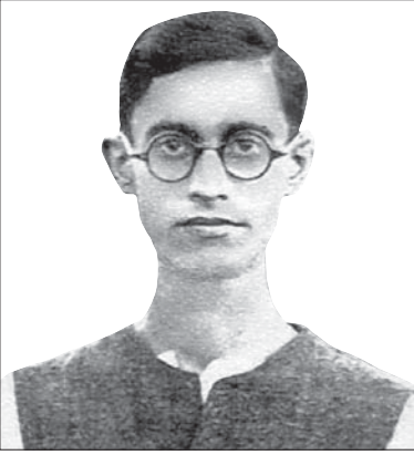
ଭଗବତୀ ଚରଣ ପାଣିଗ୍ରାହୀଙ୍କ ଚିରୋଧାନ ଦିବସ ଉପଲକ୍ଷେ