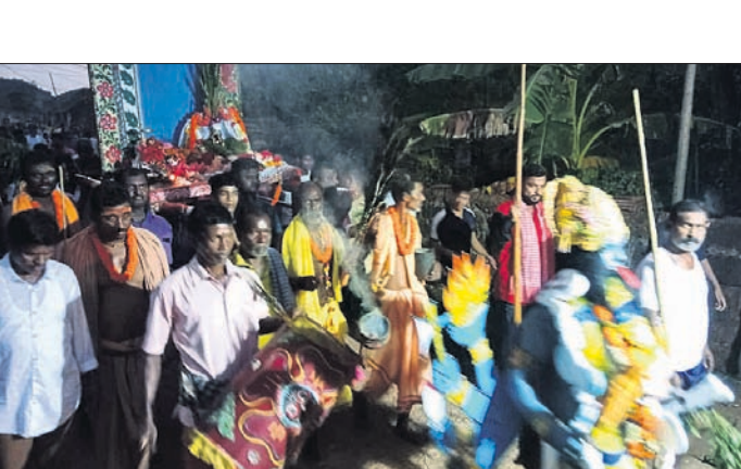
ମା' ଗୌରୀଙ୍କୁ ଶୋଭାଯାତ୍ରାରେ ନିଆଯାଉଛି।