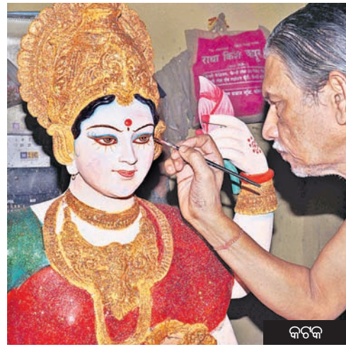
ଭୁବନେଶ୍ୱର ରୁପବାର ଗଜଲକ୍ଷ୍ମୀ ପୂଜା। ଏହି ଉପଲକ୍ଷେ ଶିଳ୍ପୀମାନେ ମା'ଙ୍କ ମୁଖରୁ ପୂର୍ଣ୍ଣରେ ଶେଷ ଧର୍ମ ଦେଉଛନ୍ତି।