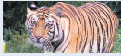
ଅଭୟାରଣ୍ୟରେ ଥିବା ପ୍ରମୁଖ ଅନୁଭବ କରିଛି। ତେଣୁ ପରିସ୍ଥିତି ଦେଖି ଅପେକ୍ଷାତ ଘଟି ଟିମ୍ ମଙ୍ଗଳବାର ଅଭୟାରଣ୍ୟ ମଧ୍ୟକୁ ଯିବ ବୋଲି ବନ