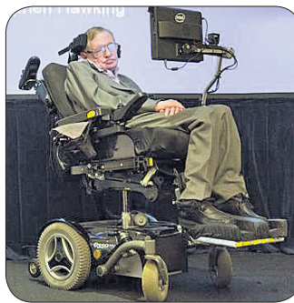
ମଧ୍ୟରେ ବ୍ୟବହାର କରିଥିଲେ। କିନ୍ତୁ ସୁଇଚ୍‌ଲ୍ ଚେୟାର ଚଳାଇବାକୁ ହାତ ଅଟକ ହୋଇଯିବା ପରେ ତାଙ୍କ ପାଇଁ କେବଳ ଆଶା କରାଯାଏ।

ଲକ୍ଷ୍ମଣ: ବ୍ରିଟିଶ୍ ପଦାର୍ଥ ବିଜ୍ଞାନୀ ଷ୍ଟିଫେନ୍ ହଜିଲ୍‌ଙ୍କ ମୋଟରଚାଳିତ ସୁଇଚ୍‌ଲ୍ ଚେୟାର, ମୋଟର ଓ ଆଡ୍ରାଲ୍ ଏବଂ ତାଙ୍କ ପିଏଚ୍‌ଡି ଥେସିସ୍‌ର ଏକ ସାକ୍ଷରତା କପି ନିଲାମ ହେବାରୁ ଯାଉଛି।