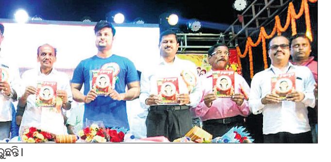
ସମାରୋହରେ ଅତିଥିମାନେ ମୁଖପତ୍ର ଉନ୍ମୋଚନ କରୁଛନ୍ତି।

ପାରିବାରିକ ସ୍ଥିତିକୁ ଜଣାପଡ଼ୁଥିଲା ଯେ କେହି ତାଙ୍କୁ ହତ୍ୟା କରି ନଦାରେ ପକାଇ ଦେଇଛି। ଏ ଘଟଣାରେ ମଧ୍ୟ ପୋଲିସ୍ ଅପମୃତ୍ୟୁ ମାମଲା ରୁଜୁ କରି ହାତବାନ୍ଧି ବସିଛି। ମୃତକ ଜଣକ କିଏ ତାହା ଏ ଯାଏ ଜଣାପଡ଼ିଲା ନାହିଁ। ସେହିପରି ଗତ ୬ ତାରିଖରେ ମଙ୍ଗଳାବାଗ ଥାନା ପୋଲିସ୍ ରାଣୀହାଟ ଅଞ୍ଚଳକୁ ଜଣେ ବୃଦ୍ଧଙ୍କ ମୃତଦେହ ଜବତ କରିଥିଲା। ରାଣୀହାଟ ଅଞ୍ଚଳରେ ଥିବା ଏକ ହୋଟେଲ ନିକଟରେ ବୁଦ୍ଧ ଜଣକ ତଳେ ପଡ଼ିଥିବା ସ୍ଥାନୀୟ ଲୋକ ବେଶ୍ୟାକୁ ପାଇଥିଲେ। ଖବର ପାଇ ପୋଲିସ୍ ପହଞ୍ଚି ସେଠାରୁ ତାଙ୍କୁ ଉଦ୍ଧାର କରି ଏସ୍‌ସିବି କେମ୍ପରେ ରଖାଯାଇଥିଲା। ପୋଲିସ୍ ଶବ ବ୍ୟବଚ୍ଛେଦ କରି ମାମଲାର ତଦନ୍ତ କରୁଥିଲେ ମଧ୍ୟ ଏପର୍ଯ୍ୟନ୍ତ ନା ମୃତକଙ୍କ ପରିଚୟ ପାଇଛି ନା ଦିଆଯାଇଥିବା ସ୍ଥାନୀୟ ଲୋକଙ୍କଠାରୁ ଶୁଣିବାକୁ ମିଳୁଛି। ହେଲେ ପୋଲିସ୍ ଏକ ଅପମୃତ୍ୟୁ ମାମଲା ରୁଜୁ କରି ତଦନ୍ତ କରୁଥିଲେ ମଧ୍ୟ ଏପର୍ଯ୍ୟନ୍ତ ଉକ୍ତ ମୃତକ