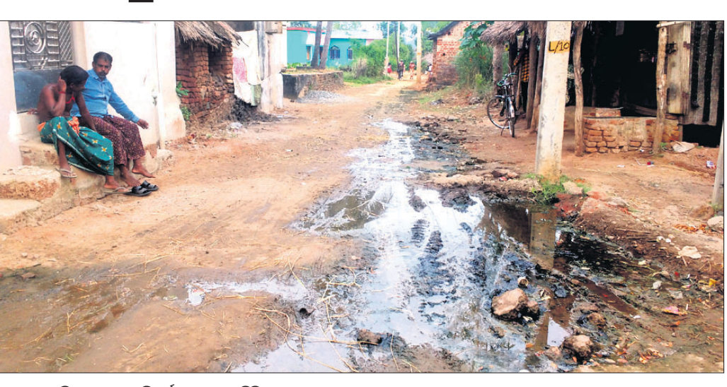
ଗ୍ରାମରେ ପରିମଳ ବ୍ୟବସ୍ଥା ବିପର୍ଯ୍ୟୟ ହୋଇପଡ଼ିଛି।