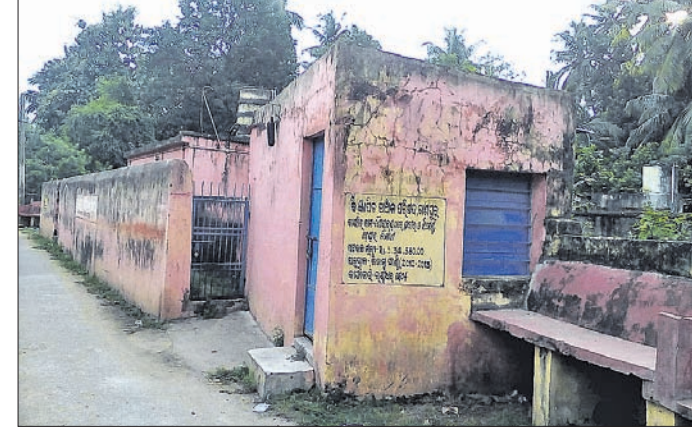
ଭଗବତୀଙ୍କ ପାଠର ଶୈବାଳୟରେ ତାଲା ପଡ଼ିରହିଛି।

ହେକ୍ଟର, ବୋଲଗଡ଼ରେ ୧୫, ୬୨୯ ହେକ୍ଟର, ଗାଙ୍ଗାରେ ୧୨, ୨୧୦ ହେକ୍ଟର, ଚିଲିକାରେ ୧୧, ୫୦୦, ବାଣପୁରରେ ୧୨, ୩୪୭ ହେକ୍ଟର, ଭୁବନେଶ୍ୱରରେ ୮, ୮୧୭ ହେକ୍ଟର, ଜଗତରେ ୬, ୨୫୭ ହେକ୍ଟର, ବାଲିପାଟଣାରେ ୯, ୯୨୮ ହେକ୍ଟର, ବାଲିପାଟଣା ବ୍ଲକରେ ୧୦, ୬୦୪ ହେକ୍ଟର ଏପରି ମୋଟରେ ୧ଲକ୍ଷ ୧୯ ହଜାର ୮୫ ହେକ୍ଟର ଜମିରେ ଅଣଧାନ ଫସଲ ହୋଇଥିଲା। ଏଥିରୁ ଚିଲିକା ବ୍ଲକରେ ୧୫୦ ହେକ୍ଟର, ବାଣପୁରରେ ୫୩ ହେକ୍ଟର ଓ ଭୁବନେଶ୍ୱର ୩୪ ହେକ୍ଟର ଏପରିମୋଟରେ ୨୩୭ ହେକ୍ଟର ଫସଲ ଉଚ୍ଛ୍ୱିତ। ଏହି କ୍ଷତି ୦.୬୬୩ ପ୍ରତିଶତ ଭିତରେ ରହିଛି।