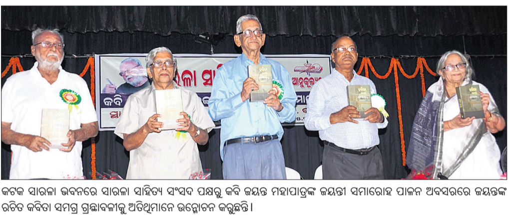
କଟକ ସାରଳା ଭବନରେ ସାରଳା ସାହିତ୍ୟ ସଂସଦ ପକ୍ଷରୁ କବି ଜୟନ୍ତ ମହାପାତ୍ରଙ୍କ ଜୟନ୍ତୀ ସମାରୋହ ପାଇଁ ଅବସରରେ ଜୟନ୍ତକ ରଚିତ କବିତା ସମଗ୍ର ଗ୍ରନ୍ଥକାଳକୁ ଅତିଥିମାନେ ଉନ୍ମୋଚନ କରୁଛନ୍ତି।

ଏସ୍କାଭେଟରକୁ ନେଇଯିବାରେ କିଛି ସମସ୍ୟା ହେବ ନାହିଁ। ଗଭୀର ବନ୍ଦୁ ପାଖେ ଲୋଡ଼ ଲିଭାଇ ଥିବା ଯୋଗୁଁ ଚାଳକଙ୍କୁ ବେଶି ସମୟ କାମ କଲେ ମଧ୍ୟ ଥକା ଲାଗିବ ନାହିଁ। ଭୁବନେଶ୍ୱର ମହାଶ୍ୱରକୁ ଏକ କମ୍ପାନୀ ଏହି ମେଶିନ ଡିଲିଭରୀ କରିବା ପାଇଁ ଚିନ୍ତିତାରେ ସିଏମ୍‌ସି ମେଶିନ କିଣିଛି। ଏକ ବର୍ଷ ଯାଏ ତାହାର ମୋଡେଲ୍‌ସ୍ ଅପ୍ଡେଟ୍ କମ୍ପାନୀ କରିବ ବୋଲି ଜଣାପଡ଼ିଛି। ବର୍ଷାଦିନ ପୂର୍ବରୁ ସହରରେ ଯେଉଁ ଠିକାଦାରମାନଙ୍କୁ ଡ୍ରେନ ସଫେଇ ଦାୟିତ୍ୱ ଦିଆଯାଏ ସେମାନଙ୍କ ପାଖେ ଛୋଟ ଏସ୍କାଭେଟର ମେଶିନ ନ ଥିବା ଯୋଗୁଁ ସେମାନେ ଲୋକ ଲାଗାଇ ସମାପ୍ତ କରନ୍ତି। କିନ୍ତୁ ତାହା ସମୟସାପେକ୍ଷ ସାଙ୍ଗକୁ ଠିକ୍