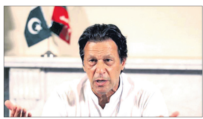
ପାକିସ୍ତାନର ଦୋଷ୍ଟା ନୀତି

ସାମାରେ ପାକିସ୍ତାନୀ ସୈନ୍ୟ ଓ ଆତଙ୍କବାଦୀଙ୍କ ଔଷ୍ଣ୍ୟ କମି ନାହିଁ । ଭାରତୀୟ ସୁରକ୍ଷାକର୍ମୀ ଓ ଯବାନଙ୍କୁ ଚାର୍ଜେଡ଼ କରି ପଡ଼ୋଶୀ ରାଷ୍ଟ୍ର ବାରମ୍ବାର ବିବାଦକୁ ଘନାଭୁତ କରୁଛି । କଟ୍ଟି-କଟ୍ଟିରେ ହାତୀରୁ ପ୍ରତିଫଳିତ ପ୍ରତିଦିନ ଦେଖିବାକୁ ମିଳୁଥିଲେ ହୁଏତ ପାକିସ୍ତାନ ଅନ୍ତର୍ଜାତୀୟ ସମ୍ପର୍କରେ ଧ୍ୟାନ ହରାଇବା ପାଇଁ ଉତ୍ତରାଚଳ ପ୍ରଦେଶର କଟ୍ଟି ।