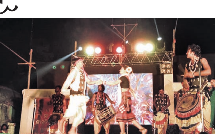
ମା' ଗୌରୀ ମହୋତ୍ସବ ଅବସରରେ ଅନୁଷ୍ଠିତ ସାଂସ୍କୃତିକ କାର୍ଯ୍ୟକ୍ରମ।