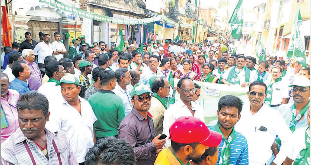
ବିଜେଡି ପକ୍ଷରୁ ବାହାରିଥିବା ଜନସମ୍ପର୍କ ପଦଯାତ୍ରା।

ଖୋର୍ଦ୍ଧା ଅଫିସ, ୨୨୧୧୦ ବିଜେଡିର ବାଣପୁର ବ୍ଲକ ଏବଂ ଅଣଧାନ ଫସଲରେ ଖୋର୍ଦ୍ଧା ଜିଲାର ଧାନ ଓ ଅଣଧାନ ଫସଲ ବେଶି କ୍ଷତିଗ୍ରସ୍ତ ହୋଇଛି। ଏହାର ପ୍ରଭାବରେ ଖୋର୍ଦ୍ଧା ଜିଲାରେ ୬୯୩୦.୬୪ ହେକ୍ଟର ଧାନ ଓ ୨୩୭ ହେକ୍ଟର ଅଣଧାନ ଫସଲ ଉଚ୍ଛ୍ୱିତ ହୋଇଛି। ଜିଲାର ୧୯୦ ପଞ୍ଚାୟତରୁ ୧୧୭ ପଞ୍ଚାୟତ ଓ ୫ ସହରାଞ୍ଚଳର ୫୨୫ ଗାଁ ଜମିର ଫସଲ କ୍ଷତି ହୋଇଛି। ତେବେ ଧାନରେ ବାଣପୁର ବ୍ଲକ ଓ ଅଣଧାନରେ ଚିଲିକା ବ୍ଲକର ଫସଲ ବେଶି କ୍ଷତିଗ୍ରସ୍ତ ହୋଇଛି। ଏପରିପରେ ବାଲିଆ ଓ ବାଲିପାଟଣା ବ୍ଲକରେ ଫସଲ କ୍ଷୟକ୍ଷତି ହୋଇ ନ ଥିବା ରାଜ୍ୟ ସରକାରଙ୍କୁ ଜିଲା ପ୍ରଶାସନ ତିନୋଟି ପ୍ରଦାନ କରିଛି। ଚଳିତ ଖିର୍ଦି ଋତୁରେ ଜିଲାର ଖୋର୍ଦ୍ଧା