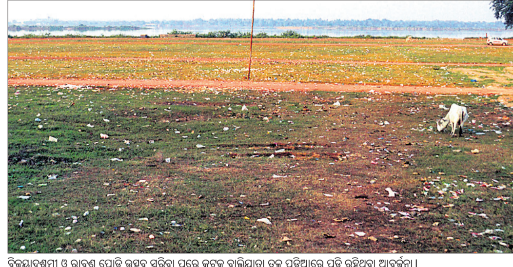
ବିକ୍ରମାବଶ୍ୟକ ଓ ରାବଣ ପୋଡ଼ି ଉତ୍ସବ ସମିତି ପରେ କଟକ ବାଲିଯାତ୍ରା ତଳ ପଡ଼ିଆରେ ପଡ଼ି ରହିଥିବା ଆବର୍ଜନା।

ପ୍ରଥମିକ ସ୍କୁଲ ନିକଟ କେନାଲରେ ଘରେ କେହି ନ ଥିବା ସମୟରେ ତତ୍କାଳୀନ ବାହାରକୁ ଚାଲିଯିଥିଲେ। ତେବେ ବହୁ ସମୟ ପର୍ଯ୍ୟନ୍ତ ଘରକୁ ନ ଫେରିବାକୁ ଘରଲୋକ ଖୋଜାଖୋଜି କରିଥିଲେ। ପରେ କମାରସାହି