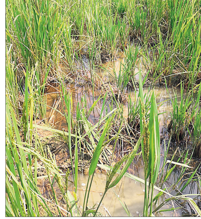
ହାଟା ଓ ବାରହା ବିଲରେ ପଶି ଧାନ ଫସଲ କ୍ଷତି ଘଟାଇଛନ୍ତି।