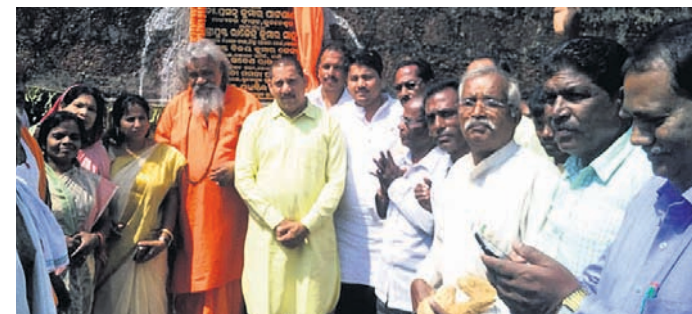
ଏମ୍ପି ଓ ବିଧାୟକଙ୍କ ଦ୍ୱାରା ସୁନ୍ଦରପୁରରେ ମୁକ୍ତିମଣ୍ଡପର ଭିତ୍ତିପ୍ରସ୍ତର ସ୍ଥାପନ କରାଯାଇଛି।