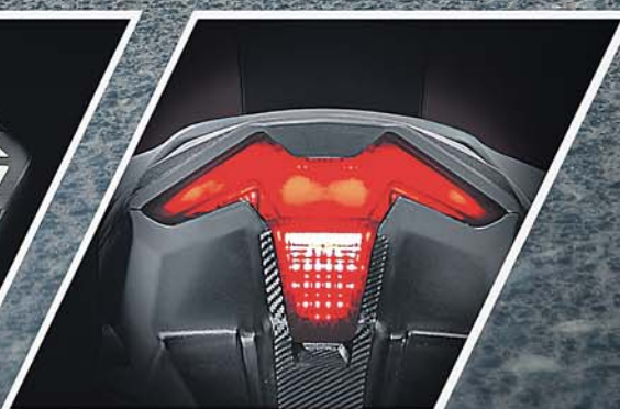
RAZOR EDGED LED TAIL LAMP