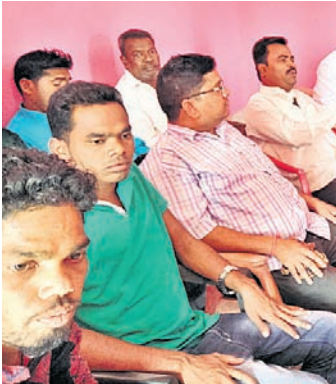
ବୈଠକରେ ଉପସ୍ଥିତ କମିଟିର ସଦସ୍ୟ ଏବଂ ଅନ୍ୟମାନେ ।

ନବରଙ୍ଗପୁର ଜିଲ୍ଲା ରତନାଶି ବ୍ଲକ୍ ଦଣ୍ଡାପୁଣ୍ଡା ଗଦାଧର ସ୍ମୃତିମନ୍ଦିର ଆନ୍ଧ୍ରରାଜ୍ୟ ଯାଦବ ମାଝି ସ୍ମାରକୀ କ୍ରିକେଟ ପ୍ରତିଯୋଗିତାର ଏକ