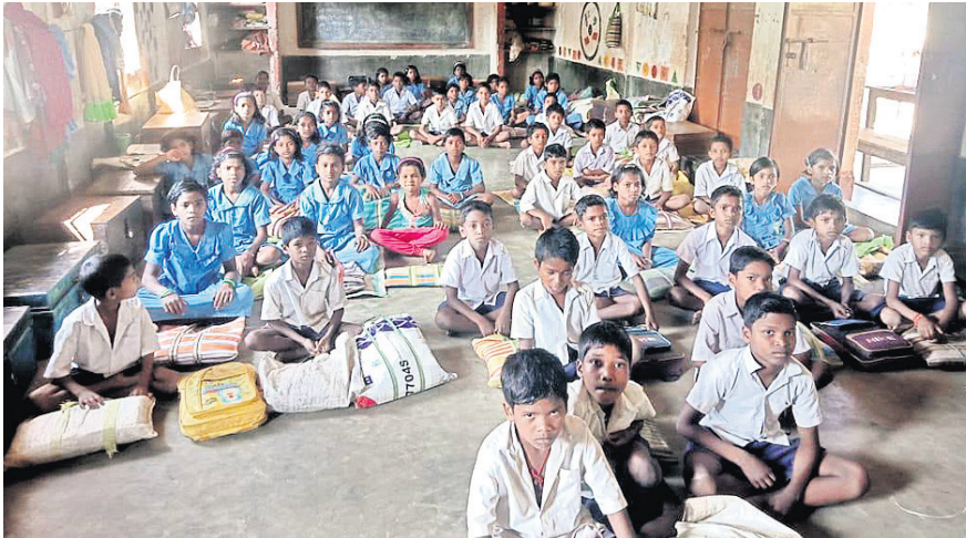
ଗୋଟିଏ କୋଠରିରେ ବିଭିନ୍ନ ଶ୍ରେଣୀର ପିଲାମାନେ ବସି ପାଠ ପଢ଼ୁଛନ୍ତି ।

ରାଜନୀତି, ୨୩।୧୦(ଡି.ଏନ.ଏ.) ଅଭିବାଦ୍ୟା ଅଧିକାର ଅଞ୍ଚଳର ପିଲାମାନେ ଶିକ୍ଷାକ୍ଷେତ୍ରରେ କଠିନ ଅବସ୍ଥାରେ କେତେକ ସେଥିମଧ୍ୟରେ ସରକାର ବିଭିନ୍ନ ଯୋଜନା ମାଧ୍ୟମରେ କୋଟି କୋଟି ଟଙ୍କା ଖର୍ଚ୍ଚ କରୁଛନ୍ତି । କିନ୍ତୁ ବିଭାଗୀୟ ଅଧିକାରୀଙ୍କ କାର୍ଯ୍ୟର ତଦାରଖ ଅଭାବରୁ ଯୋଜନା ପଦ୍ଧତିରେ କୋଟି କୋଟି ଟଙ୍କା ଖର୍ଚ୍ଚ ହେଉଛି । ଏପରି ସମସ୍ୟା ଭିତରେ ଚାଲିଛି ପିଲାମାନଙ୍କୁ ଶିକ୍ଷା ଦାନ । ପିଲାମାନଙ୍କ ଭବିଷ୍ୟତକୁ ଅନ୍ଧାରକୁ ଠେଲି ଦିଆଯାଇଛି ଏପରିକି ଯେଉଁ ଗୃହରେ ପିଲାମାନଙ୍କୁ ପାଠ ପଢ଼ା ହେଉଛି ସେହି ଗୃହରେ ହଷ୍ଟେଲ ମଧ୍ୟ ଚାଲୁଛି । ନବରଙ୍ଗପୁର ଜିଲ୍ଲା ରାଜନୀତିରୁ କୁଳ କଟରାପାଠା ପ୍ରକଳ୍ପ ଉଚ୍ଚ ପ୍ରାଥମିକ ବିଦ୍ୟାଳୟରେ ଏହା ଦେଖିବାକୁ ମିଳିଛି । କଟରାପାଠା ବିଦ୍ୟାଳୟରେ ପ୍ରଥମରୁ ଅଷ୍ଟମ ଶ୍ରେଣୀ ପର୍ଯ୍ୟନ୍ତ ରହିଛି । ୧୧୫ ଛାତ୍ରଛାତ୍ରୀ ପଢ଼ୁଛନ୍ତି । ଶିକ୍ଷାଦାନ ପାଇଁ ୬ ଜଣ ଶିକ୍ଷକ ଅଛନ୍ତି । ପ୍ରଥମରୁ ଅଷ୍ଟମ ଶ୍ରେଣୀ