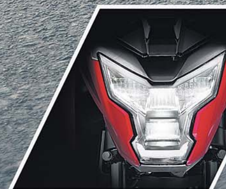
ROBO-FACE LED HEADLAMP