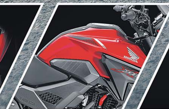
AGGRESSIVE-SCULPTED TANK DESIGN