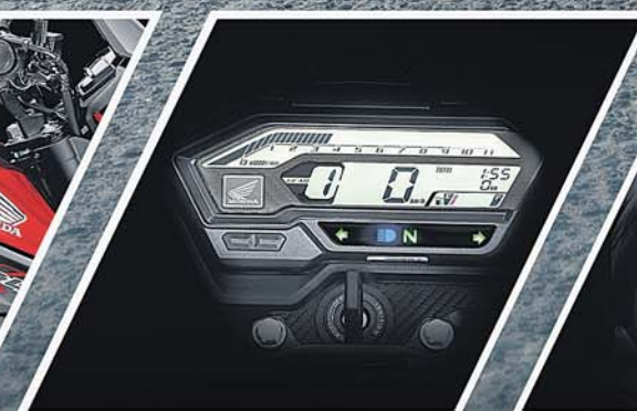
STREET-TECH DIGITAL METER