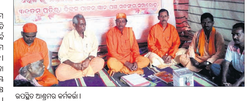
ଭପସ୍ଥିତ ଆଶ୍ରମର କର୍ମକର୍ତ୍ତା।