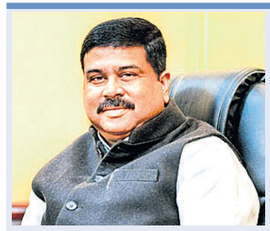
ପିପିସି ସଭାପତିଙ୍କ ସମାଲୋଚନା ପ୍ରତିକ୍ରିୟା ରଖିଲା ବିଜେଡି

ବ୍ୟାପାର, ସାମାଜ୍ୟ ଘଟଣାରେ ଜାମିନ ଲାଗିବାର ପ୍ରସଙ୍ଗ ର ସମାଧାନ ସମ୍ଭବ ହୋଇ ପାରୁନାହିଁ। ପ୍ରସଙ୍ଗଟି ହାଲକୋର୍ଟ, ସୁପ୍ରିମକୋର୍ଟ ପର୍ଯ୍ୟନ୍ତ ଯାଇଛି, ହେଲେ ସମାଧାନ ହୋଇପାରିନାହିଁ।