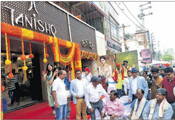
'ତନିଷ୍ଠ'ର ନୂଆ ଷ୍ଟୋର ଉଦ୍ଘାଟନ ଅବସରରେ ଉପସ୍ଥିତ ଅତିଥି ଓ ଅନ୍ୟମାନେ ।