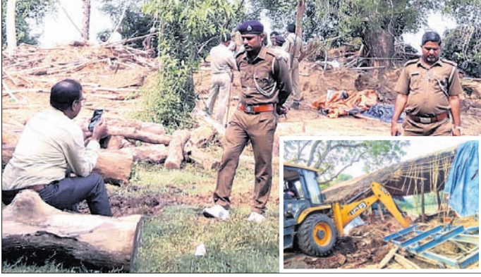
ବନ ବିଭାଗର ଚଢ଼ାଉ । ତୋକର ଲଗାଇ କଳସର ଭଙ୍ଗାଯାଉଛି (ଉର୍ଦ୍ଧ୍ୱସେଂ) ।

ଭଞ୍ଜାରିପୋଖରୀ, ୨୪।୧୦ (ଡି.ଏନ.ଏ.) ଭଦ୍ରକ ଜିଲ୍ଲା ଭଞ୍ଜାରିପୋଖରୀ ବ୍ଲକ୍ ଷୋଳମାଳ ପଞ୍ଚାୟତ ମୁହାଁପଦା ନିକଟରେ ବେଆଇନ ଭାବେ ଚାଲୁଥିବା ଏକ କରତକଳ ଉପରେ ରୁଧିରାଚରଣ କରାଯାଇଛି ।