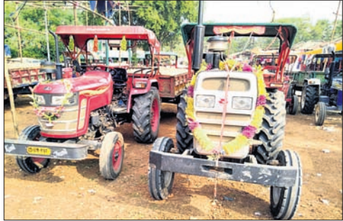
ଜବତ ବାଲିବୋଝେଇ ଟ୍ରାକ୍ଟର ।

ଆସିଛି । ଜଳେଶ୍ୱର ବ୍ଲକ୍ ରାଜବଣିଆ ଥାନା ଓଲମାରା ରାଜସ୍ୱ ସକଳ ଅଧୀନ ସୁବର୍ଣ୍ଣରେଖା ନଦୀର କୂଅରେ ବାଲିଖୟାଳୁ ବେଆଇନ ଭାବେ ବାଲି ଉତ୍ତୋଳନ କରି ମାଟିଆମାନେ ୧୨ଟି ଟ୍ରାକ୍ଟରରେ ବୋଝେଇ କରି ପଶ୍ଚିମବଙ୍ଗ ଚାଲାଇ କରୁଥିଲେ ।