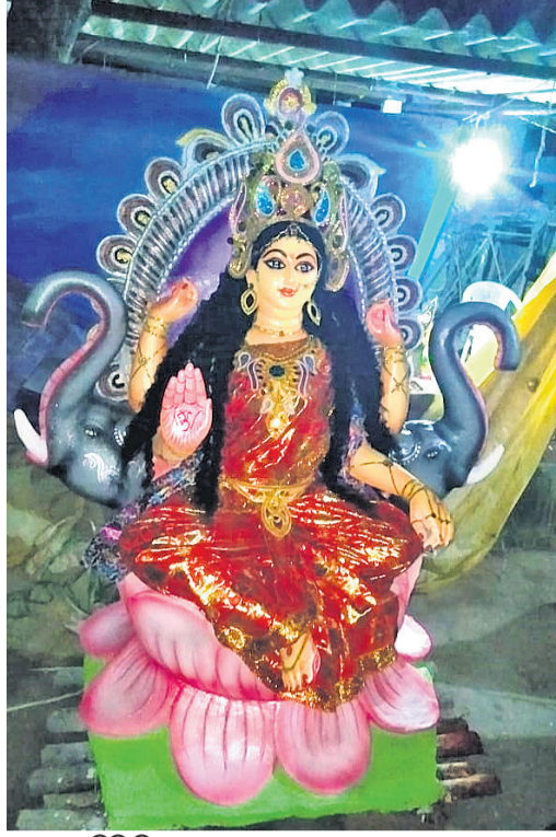
ମାଳକାନଗରୀ ତିଏନକେ ଛକରେ ହୋଇଥିବା ପୂଜାମଣ୍ଡପ ।