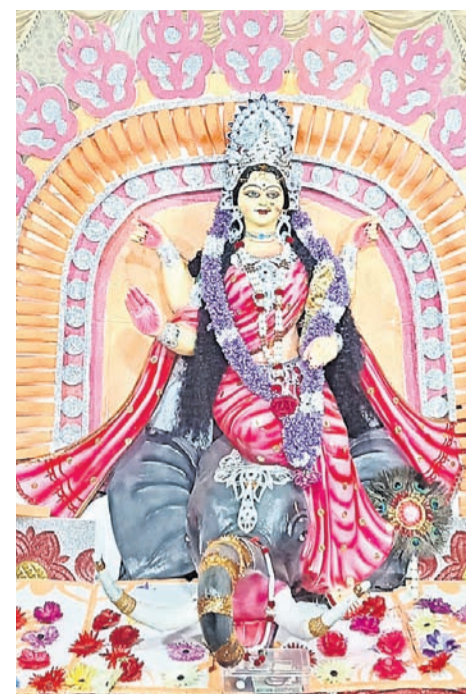
ଝରିଗାଁ ସଦର ମହକୁମା ପୂଜାମଣ୍ଡପ ।