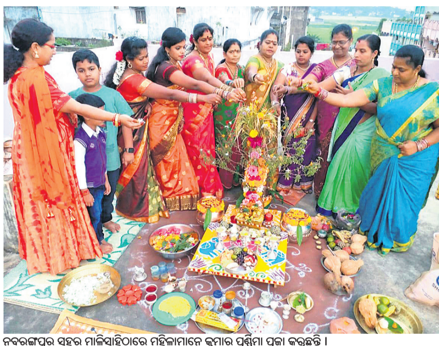
ନବରଙ୍ଗପୁର ସହର ମାଳିସାହିଠାରେ ମହିଳାମାନେ କୁମାର ପୂର୍ଣ୍ଣିମା ପୂଜା କରୁଛନ୍ତି ।