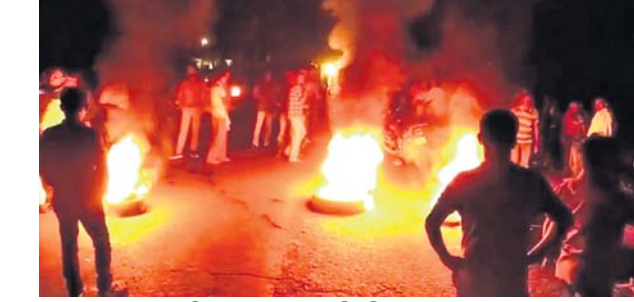
ଲୋକେ ଚାନ୍ଦାଉ ଜାଳି ରାସ୍ତାଗୋଡ଼େଇ କରିଛନ୍ତି।

କେନ୍ଦୁଝର ଜିଲ୍ଲାର ବୁଧବାର ଅପରାହ୍ଣ ୫ଟା ସମୟରେ ଏକ ମର୍ମତୁହ ସଡ଼କ ଦୁର୍ଘଟଣା ଘଟିଛି। ପାଟଣା ବ୍ଲକ୍ ଦେଇ ଯାଇଥିବା ମୁଖ୍ୟ କଲିକତା ୪୯ ନମ୍ବର ଗାଡ଼ି, ରାଜପଥର ଟେମ୍ପୋ ଶାଳକଣ ନିକଟରେ ଏକ ପିଲସିପ ଓ ବାଇ ମୁହଁ ମୁହଁ ଧକ୍କା ହୋଇଛି।