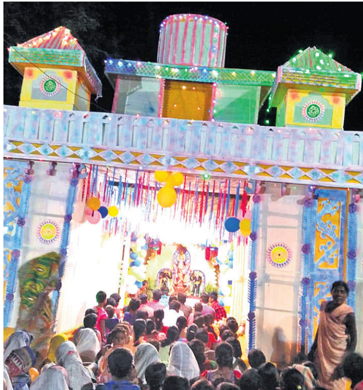
ଡାକୁଗାଁ ବୁକ ସରାଗୁଡ଼ା ଗାଁ ପୂଜା ମଣ୍ଡପ ।