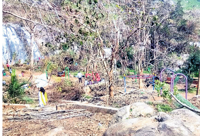
ବାତ୍ୟାରେ କ୍ଷତିଗ୍ରସ୍ତ ହୋଇଥିବା ପାର୍ଲ।

ଡିଜିଟାଲ ବାତ୍ୟାରେ ଗଜପତି ଜିଲ୍ଲା ରାୟଗଡ଼ ବ୍ଲକର 'ଗଣହାତୀ' ପର୍ଯ୍ୟଟନ ସ୍ଥଳୀ ଉପରେ ବାତ୍ୟା ପ୍ରଭାବ ପଡ଼ିଛି। ଏଠାରେ ଥିବା ଅନେକ ଗଛ ଭାଙ୍ଗିପଡ଼ିଥିବା ବେଳେ ଆମେଦ ପ୍ରମୋଦ ଲାଗି ଉଦ୍ଦିଷ୍ଟ ଭିତ୍ତିଭୂମି ନଷ୍ଟ ହୋଇଯାଇଛି। ଗଣହାତୀ ଲକ୍ଷ୍ୟପ୍ରାପ୍ତ ରାଜ୍ୟର ଅନ୍ୟତମ ପ୍ରମୁଖ ପର୍ଯ୍ୟଟନ କ୍ଷେତ୍ର ଭାବେ କଣାଶୁଣା। ଏଠାକାର ମନୋରମ ଦୃଶ୍ୟ ଉପଭୋଗ କରିବା ସହ ପିକନିକ୍ ମଜା ନେବା ପାଇଁ ବର୍ଷର ଅଧିକାଂଶ ସମୟରେ ରାଜ୍ୟ ଓ ରାଜ୍ୟ ବାହାରୁ ପର୍ଯ୍ୟଟକମାନେ ଆସିଥାନ୍ତି। ତେବେ ବାତ୍ୟାରେ ଏବେ ଏହି ପର୍ଯ୍ୟଟନ ସ୍ଥଳୀ ଶ୍ରୀହୀନ ହୋଇପଡ଼ିଛି। ଏଠାରେ ୩୦ ଲକ୍ଷ ଟଙ୍କା ବ୍ୟୟରେ