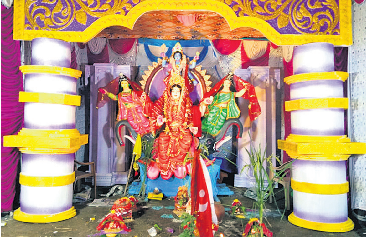
କୋରକୋଣ୍ଡା ବୃକ୍ଷ ନୀଳାଦ୍ରିନଗରରେ ହୋଇଥିବା ଗଜଲକ୍ଷ୍ମୀଙ୍କ ପୂଜା ମଣ୍ଡପ ।