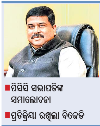
ଯିପିସି ସଭାପତିଙ୍କ ସମାଲୋଚନା ପ୍ରତିକ୍ରିୟା ରଖିଲା ବିଜେଡି

ମୁଖ୍ୟମନ୍ତ୍ରୀ ନବୀନ ପଟ୍ଟନାୟକ ରାଜ୍ୟରେ ଦେଖାଦେଇଥିବା ଆଇନଜୀବୀ-ପୋଲିସ ବିବାଦର ସମାଧାନ ପାଇଁ ରାଷ୍ଟ୍ର ବାହାରି କରିଛନ୍ତି।