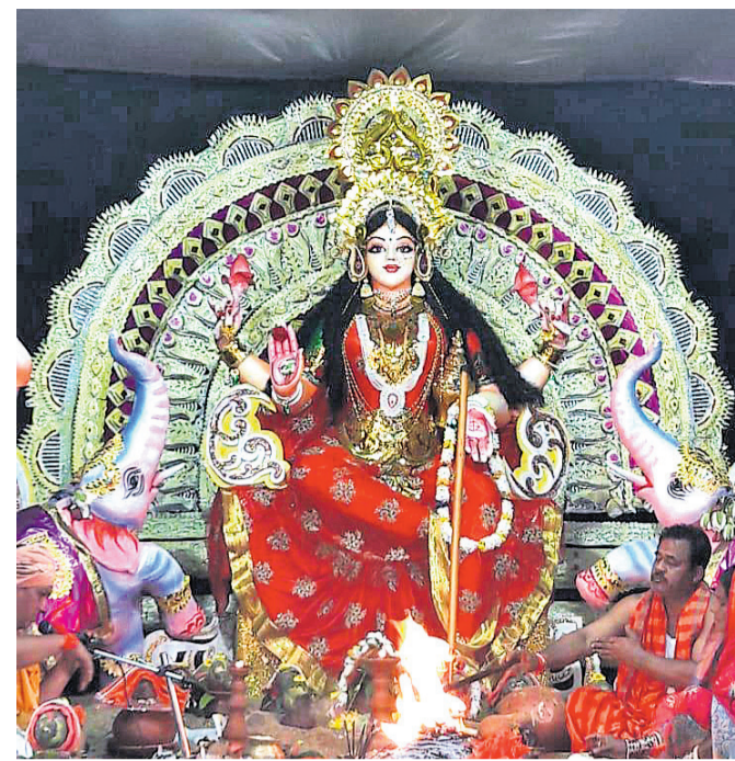
ଡେକୁଳିଖୁଣ୍ଟି ବୁକ ଖାତିଗୁଡ଼ା ପୂଜାମଣ୍ଡପ ।