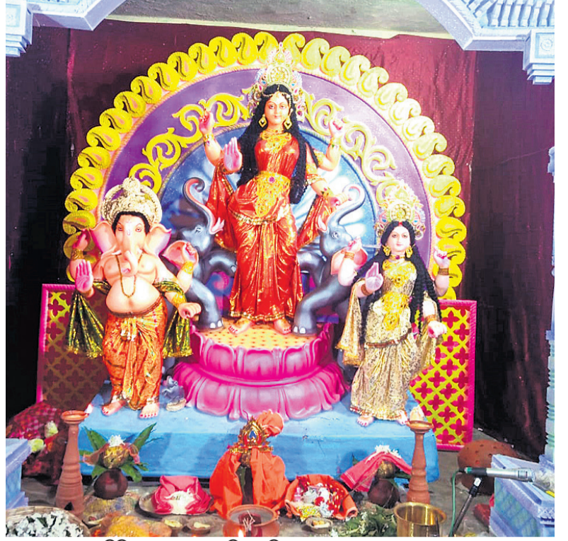
ମାଳକାନଗରୀ ଓଲଟ ପୋଷ୍ଟ ଅଧିକାରିଙ୍କ ପୂଜାମଣ୍ଡପ ।