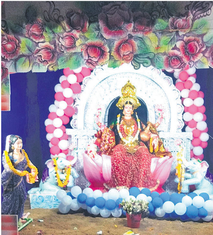
ଡେକୁଳିଖୁଣ୍ଟି ଫଟାଗୁଡ଼ା ପୂଜାମଣ୍ଡପ ।