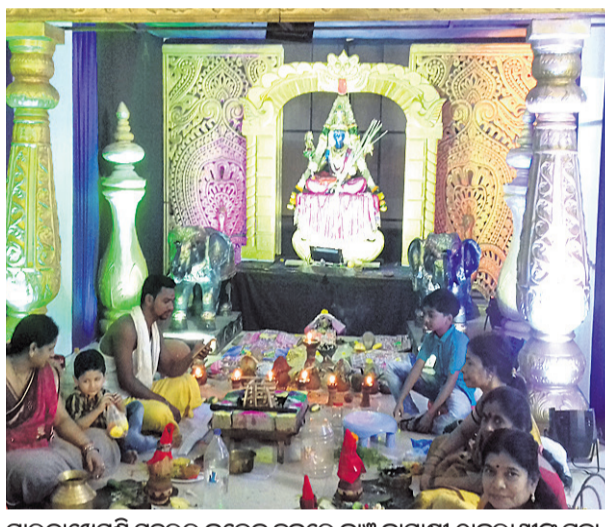
ପାରଳାଖେମୁଣ୍ଡି ସହରର କଲେଜ ଛକରେ ବାହୁ କାମାକ୍ଷୀ ଠାକୁରାଣୀଙ୍କ ପୂଜା।