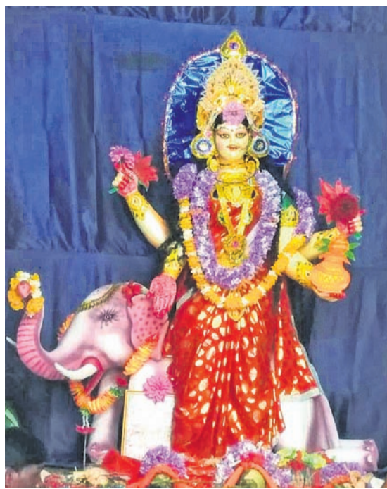
ଡେକୁଳିଖୁଣ୍ଟି ଦିଗି ପୂଜାମଣ୍ଡପ ।