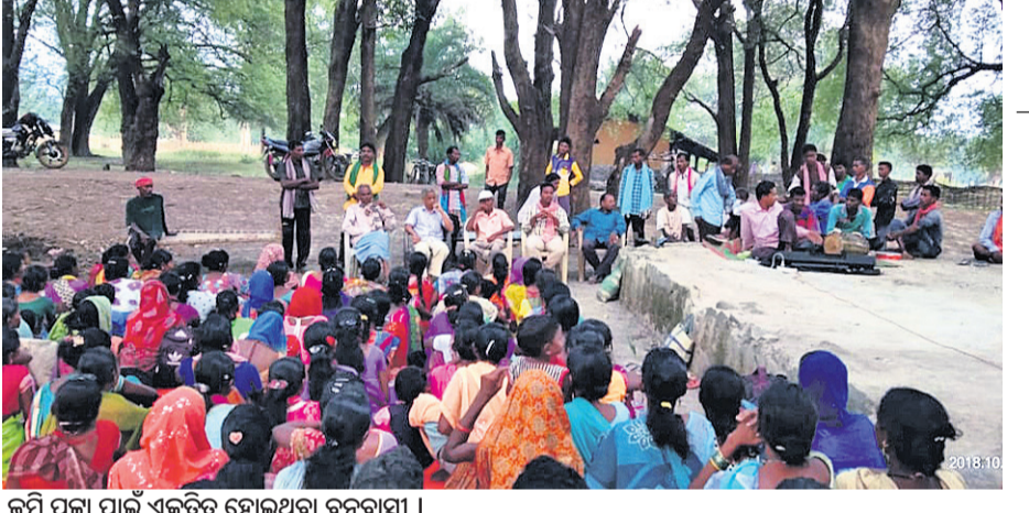
ଜମି ପଞ୍ଚା ପାଇଁ ଏକତ୍ର ହୋଇଥିବା ବନବାସୀ ।

ମାଳକାନଗରୀ, ୨୫୧୦ (ଡି.ଏନ.ଏ.) ମାଳକାନଗରୀ ଜିଲ୍ଲାରେ ବିଭିନ୍ନ ଅଞ୍ଚଳରେ ରହୁଥିବା ଆଦିବାସୀ ଏବଂ ବନବାସୀମାନେ ସେମାନଙ୍କୁ ପାରମ୍ପରିକ ଜଙ୍ଗଲ ଜମି ପଞ୍ଚା ପ୍ରଦାନ ଦାବି କରି ବିଭିନ୍ନ ଗ୍ରାମରେ ଶୋଭାଯାତ୍ରା ଏବଂ ବିରୋଧ ପ୍ରଦର୍ଶନ କରିଛନ୍ତି । ଜାତୀୟ ଜଙ୍ଗଲ ନୀତି ଓ କାମ୍ପା ଆଇନ ପ୍ରତ୍ୟାହାର, ଜଙ୍ଗଲ ଅଧିକାର ଆଇନ-୨୦୦୬କୁ ଚ୍ୟୁତ କରିବା ଆଦିବାରା ଅଞ୍ଚଳରେ ବିଭିନ୍ନ ଅଭ୍ୟାସରେ ବନବାସୀ କହିବା, ରାଜ୍ୟରେ ବିଭିନ୍ନ ଅଭ୍ୟାସରେ ବନବାସୀ ମାନଙ୍କୁ ଛାଡ଼ି ନ ଦେବା ସେମାନଙ୍କୁ ଚିହ୍ନଟ କରି ଜଙ୍ଗଲ ଜମି ପଞ୍ଚା ପ୍ରଦାନ କରିବା ପାଇଁ ଦାବି କରିଛନ୍ତି । ରୁଧ୍ରବାର ମାଧୁଲି ଧାନ ଅଞ୍ଚଳ ଚେଲୁଗୁପାଳି, କମାରପାଳି, ସାଲିମ୍, କଟାପାଳି, କମାରଗୁଡ଼ା, ନାତି ଓ କାମ୍ପା ଆଇନ ପ୍ରତ୍ୟାହାର, ଜଙ୍ଗଲ ଅଧିକାର ଆଇନ-୨୦୦୬କୁ ଚ୍ୟୁତ କରିବା ଆଦିବାରା ଅଞ୍ଚଳରେ ବିଭିନ୍ନ ଅଭ୍ୟାସରେ ବନବାସୀ କହିବା, ରାଜ୍ୟରେ ବିଭିନ୍ନ ଅଭ୍ୟାସରେ ବନବାସୀ ମାନଙ୍କୁ ଛାଡ଼ି ନ ଦେବା ସେମାନଙ୍କୁ ଚିହ୍ନଟ କରି ଜଙ୍ଗଲ ଜମି ପଞ୍ଚା ପ୍ରଦାନ କରିବା ପାଇଁ ଦାବି କରିଛନ୍ତି । ରୁଧ୍ରବାର ମାଧୁଲି ଧାନ ଅଞ୍ଚଳ ଚେଲୁଗୁପାଳି, କମାରପାଳି, ସାଲିମ୍, କଟାପାଳି, କମାରଗୁଡ଼ା, ନାତି ଓ କାମ୍ପା ଆଇନ ପ୍ରତ୍ୟାହାର, ଜଙ୍ଗଲ ଅଧିକାର ଆଇନ-୨୦୦୬କୁ ଚ୍ୟୁତ କରିବା ଆଦିବାରା ଅଞ୍ଚଳରେ ବିଭିନ୍ନ ଅଭ୍ୟାସରେ ବନବାସୀ କହିବା, ରାଜ୍ୟରେ ବିଭିନ୍ନ ଅଭ୍ୟାସରେ ବନବାସୀ ମାନଙ୍କୁ ଛାଡ଼ି ନ ଦେବା ସେମାନଙ୍କୁ ଚିହ୍ନଟ କରି ଜଙ୍ଗଲ ଜମି ପଞ୍ଚା ପ୍ରଦାନ କରିବା ପାଇଁ ଦାବି କରିଛନ୍ତି । ରୁଧ୍ରବାର ମାଧୁଲି ଧାନ ଅଞ୍ଚଳ ଚେଲୁଗୁପାଳି, କମାରପାଳି, ସାଲିମ୍, କଟାପାଳି, କମାରଗୁଡ଼ା, ନାତି ଓ କାମ୍ପା ଆଇନ ପ୍ରତ୍ୟାହାର, ଜଙ୍ଗଲ ଅଧିକାର ଆଇନ-୨୦୦୬କୁ ଚ୍ୟୁତ କରିବା ଆଦିବାରା ଅଞ୍ଚଳରେ ବିଭିନ୍ନ ଅଭ୍ୟାସରେ ବନବାସୀ କହିବା, ରାଜ୍ୟରେ ବିଭିନ୍ନ ଅଭ୍ୟାସରେ ବନବାସୀ ମାନଙ୍କୁ ଛାଡ଼ି ନ ଦେବା ସେମାନଙ୍କୁ ଚିହ୍ନଟ କରି ଜଙ୍ଗଲ ଜମି ପଞ୍ଚା ପ୍ରଦାନ କରିବା ପାଇଁ ଦାବି କରିଛନ୍ତି ।