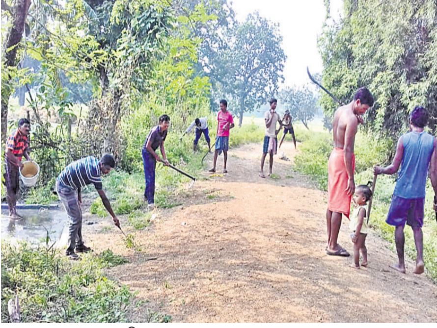
ଗ୍ରାମବାସୀ ରାସ୍ତା ସଫାକରିବା କରୁଛନ୍ତି ।