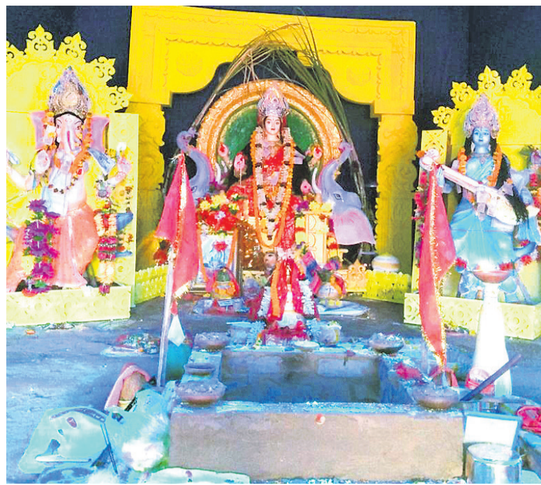
ଡାକୁଗାଁ ଲେଲିସାହି ପୂଜାମଣ୍ଡପରେ ।