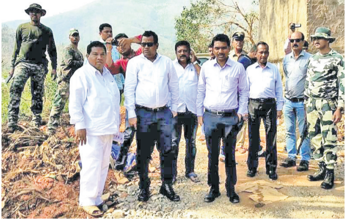
ସ୍ୱତନ୍ତ୍ର ରିଲିଫ କମିଶନର ସେଠା କର୍ତ୍ତୃପୁର ବାତ୍ୟାଞ୍ଚଳ ପରିବର୍ତ୍ତନ କରୁଛନ୍ତି। ଅନ୍ୟ ବରିଷ୍ଠ ଅଧିକାରୀମାନେ ଏକ ହେଲିକପ୍ଟର ଯୋଗେ ଆସି ପୂର୍ବଦ୍ୱାରା ପହଞ୍ଚିଥିବା ପାରଳାଖେମୁଣ୍ଡିର ଖୁଲିଆପାଳିକାଙ୍କ ସହିତ ଯୋଗାଯୋଗ କରିବା ପାଇଁ ଚେଷ୍ଟା କରିଥିଲେ ।

ଅଞ୍ଚଳ ଯାଇ ସେଠାରେ ଚାଲିଥିବା ବାତ୍ୟାଞ୍ଚଳ ପରିବର୍ତ୍ତନ କରିଥିଲେ। ରିଲିଫ, ଗମନାଗମନ ଓ ପାନୀୟଜଳ ବ୍ୟବସ୍ଥା କ୍ଷତିଗ୍ରସ୍ତ ହୋଇଥିବା ସ୍ଥାନରେ ଅନୁଧ୍ୟାନ କରିଥିଲେ। ସେଠାରେ କେତେକ ଲିମ୍ବାୟା ଯୁକ୍ତ ଅଧିକାରୀଙ୍କୁ ନେଇ ଗଠିତ ଏକ ଟିମ୍ ସହ ଶକ୍ତି ସୂଚକ ମାଟ୍ରିକାଲ, ଲାବଣ୍ୟଗତ, ସେବା, ଗରାବନ୍ଧ, ପୁରାଣି ଇତ୍ୟାଦି ଅଞ୍ଚଳ ଗ୍ରହଣେ ଯାଇ ବିଭିନ୍ନ କାର୍ଯ୍ୟକ୍ରମ ଅନୁଧ୍ୟାନ କରିଥିଲେ। ଗୁରୁ ଓ ନଗର ଉନ୍ନୟନ ସୂଚକ ଅନ୍ୟ ଏକ ଟିମ୍ ସହ ଗୋଷ୍ଠୀ କୁଳ ଡୋକ୍ଟରାଲ୍, ଭୁବନେଶ୍ୱର, ଚାଟିପତା, ଗୋଷାଣୀ, ରମ୍ପା ଇତ୍ୟାଦି ଗ୍ରାମ ବୁଲି ସ୍କୁଲ ଓ ଅଞ୍ଚଳକୁ ଗୁରୁ ମରାମତି, ରାସ୍ତା ନିର୍ମାଣ ଇତ୍ୟାଦି କାର୍ଯ୍ୟ ଅନୁଧ୍ୟାନ କରିଥିଲେ। ସ୍ୱତନ୍ତ୍ର ପ୍ରକଳ୍ପ ନିର୍ଦ୍ଦେଶକ ଅନ୍ୟ ଏକ ଟିମ୍‌କୁ ନେଇ ଓଡ଼ିଆ, କୋରାଠି, ରାୟଗଡ଼ ଇତ୍ୟାଦି ପଞ୍ଚାୟତର ଅଧିକାରୀଙ୍କୁ ଗୋଟାଏ ଟିମ୍ ଭାବେ ଗଠନ କରିଥିଲେ।