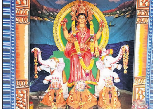
ପକାଶପୁର ଗଜଲକ୍ଷ୍ମୀ ପୂଜା ମଣ୍ଡପ।