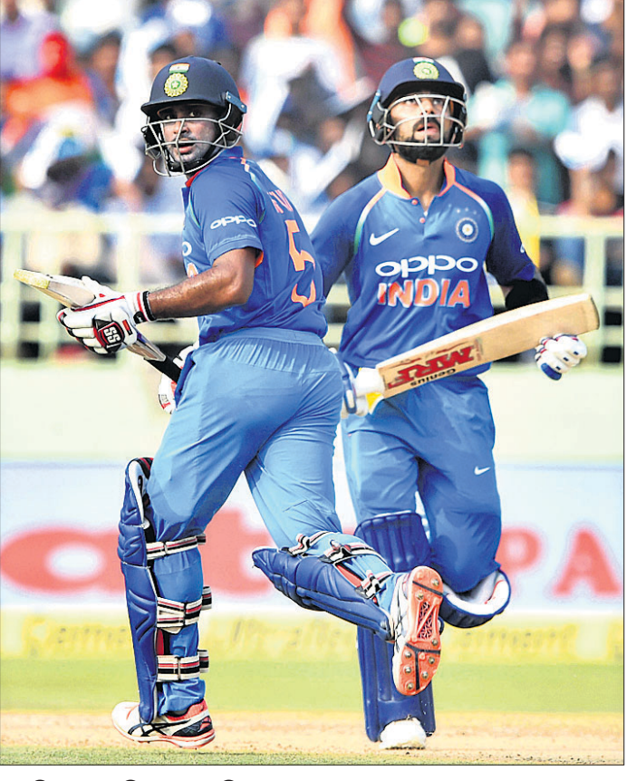
ଅଧିନାୟକ ସାଲ ହୋପ୍ ଓ ବିରାଟ କୋହଲି ।

ବିଶାଖାପାଟଣା, ୨୪।୧୦(ପି.ଟି.): ୩, ମହମ୍ମଦ ସାମି, ଉପେଶ ଯାଦବ ଓ ସୁଭକ୍ଷ୍ମ ରହଲ ଗୋଟିଏ ଲେଖାଏ ଉତ୍ତମକେତ ହାସଲ କରିଥିଲେ। ପୂର୍ବରୁ ପ୍ରଥମେ ବ୍ୟାଟ୍ କରିଥିବା ଭାରତ ଆରମ୍ଭକୁ ଜର୍ଜର୍ଟି ଓପନର ରୋହିତ ଶର୍ମାଙ୍କୁ ହରାଇ ପ୍ରାରମ୍ଭିକ ଝଟକା ଖାଇଥିଲା। ମାତ୍ର ୪ ରନ କରି ରୋହିତ କେମାର ରୋହ୍‌ଙ୍କ ବଳରେ ହେଟମେୟରକୁ କ୍ୟାଚ୍ କେଇ ପ୍ୟାଟିଲିୟନ ଫେରିଥିଲେ। ଏହା ପରେ ଶର୍ମା ଧାଢ଼ନ ୨୯ ରନ କରିଥିବା ବେଳେ ଆଶଲେ ନର୍ସଙ୍କ ଦ୍ୱାରା ଏଲବିଡବ୍ଲ୍ୟୁ ହୋଇ ଆଉଟ ହୋଇଥିଲେ। ତେବେ ତୃତୀୟ ଦିନିକିଆର ଭାରତ ତା'ର ୧-୦ ଅଗ୍ରଣୀକୁ ବଢାଉ ରଖିଛି। କୋହଲି ଫ୍ଲୋୟାର ଅଫ୍‌ଦି ମ୍ୟାଚ୍ ବିବେଚିତ ହୋଇଥିଲେ। ୩୨୨ ରନ ବିଜୟ ଲକ୍ଷ୍ୟର ପିଛା କରି ଷ୍ଟେସ୍‌ଭଲ୍‌ସ୍‌ କେବେ ଲକ୍ଷ୍ୟ ଖେଳ ପ୍ରଦର୍ଶନ କରିଥିଲା। ଉତ୍ତମକେତ କିପର ବ୍ୟାଟ୍‌ସମ୍ୟାନ ସାଲ ହୋପ୍ ୨୫ଟି ବଲ ଖେଳି ୧୦ ଟୋକା ଓ ୩ ଛକା ସହ ୧୨୩ ରନ କରି ଅପରାଜିତ ରହିଥିଲେ ମଧ୍ୟ ଦଳକୁ ଜିତାଇପାରି ନ ଥିଲେ। ସେହିପରି ଶିମରନ ହେଟମେୟର ୬୪ଟି ବଲ ଖେଳି ୪ ଟୋକା ଓ ୭ ଛକା ସହ ବୁଟ ୯୪ ରନ ସଂଗ୍ରହ କରି ଦଳର ଛିତି ବୁଟ କରିଥିଲେ। ଅନନ୍ତମ୍‌ପେ ମଧ୍ୟରେ ତଦରପଲ ଅହମଦ୍ ୩୨, କିରନ ପାଢେଲ ୧୮, ମାର୍କନ ସାୟୁବଲ୍ ୧୩, ରୋଜମାନ ପାଢେଲ ୧୮, ଅଧିନାୟକ ଜାସନ ହୋଲ୍‌ଡର ୧୨ ଓ ଆଶଲେ ନର୍ସ ୫ ରନ କରି ଆଉଟ ହୋଇଥିଲେ। ବୋଲିଂରେ ଭାରତ ତରଫରୁ କୁଲଦୀପ ଯାଦବ