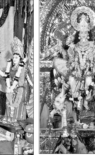
ବିରିଡି ପାଣ୍ଡିଆ ପୂଜା ମଞ୍ଚପ।