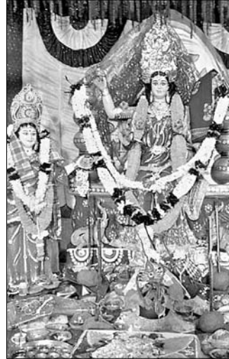
ବିରିଡି କୁଜଙ୍ଗରୁକ୍ ନାୟକ ସାହି ପୂଜା ମଞ୍ଚପ।