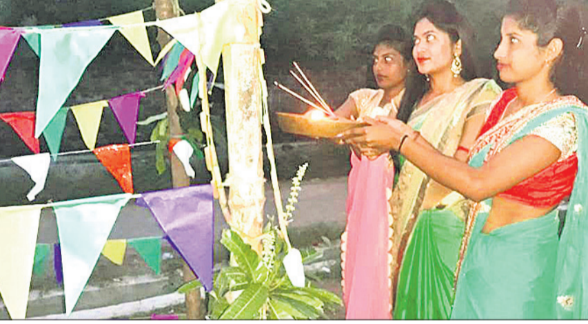
କୁମାରୀମାନେ ବୃନ୍ଦାବତୀ ମୂଳେ ବନ୍ଦାପନା କରୁଛନ୍ତି।