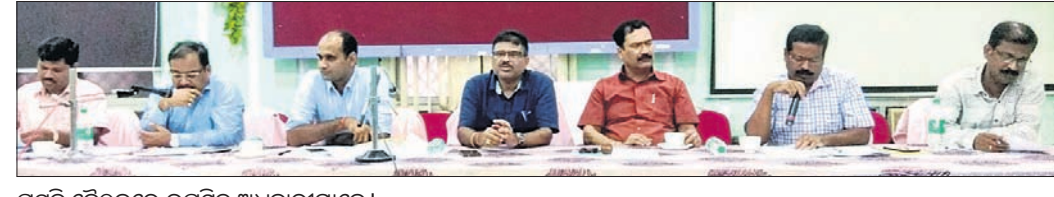
ପ୍ରସ୍ତୁତି ବୈଠକରେ ଉପସ୍ଥିତ ଅଧିକାରୀମାନେ।