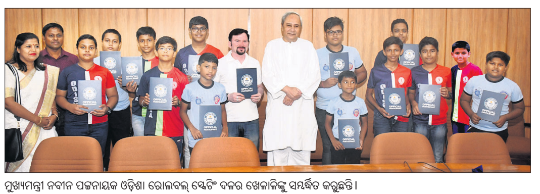
ମୁଖ୍ୟମନ୍ତ୍ରୀ ନବୀନ ପଟ୍ଟନାୟକ ଓଡ଼ିଶା ରୋଲ୍ ଟ୍ରେନିଂ ଦଳର ଖେଳାଳିଙ୍କୁ ସମର୍ଥନ କରୁଛନ୍ତି।

ଥୁଲା । ଏହାକୁ ଏବେ ଅଫିସିଆଲ୍ ସ୍ୱୀକୃତି ମିଳିଛି। ଫଳରେ ଓଡ଼ିଶା ରୋଲ୍ ଟ୍ରେନିଂ ଟିମ୍ ସ୍ୱାଭାବିକଭାବେ ଏହି ରେକର୍ଡ୍‌ରେ ସାମିଲ ହୋଇଯାଇଛି।