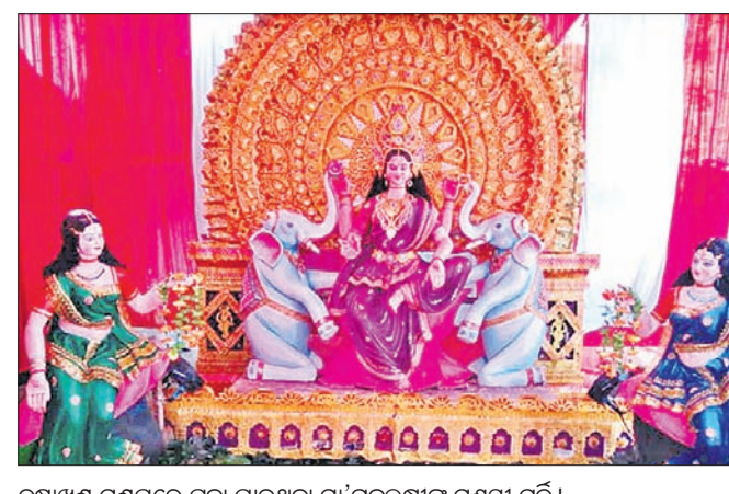
ବିଶାଖଣ୍ଡ ମଞ୍ଚପରେ ପୂଜା ପାଉଥିବା ମା'ଗଜଲକ୍ଷ୍ମୀଙ୍କ ମୁଖ୍ୟାୟା ମୂର୍ତ୍ତି।