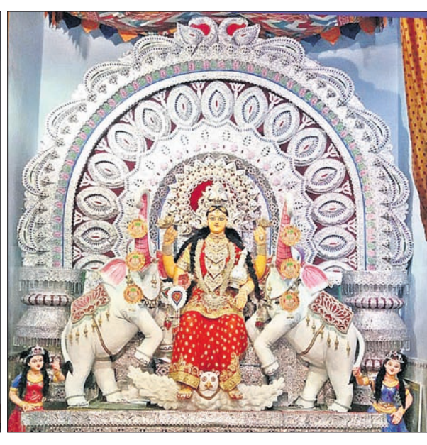
ପୁରୁଣା ବସଷ୍ଟାଣ୍ଡ ଥାନପତି