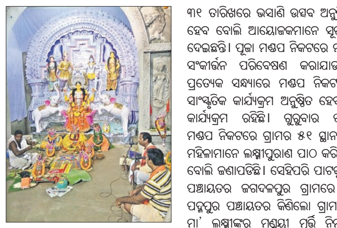
ବେଡ଼ାରେ ମା'ଗଜଲକ୍ଷ୍ମୀଙ୍କ ପୂଜା।

ପାଟକୁରା ଗା, ୨୫୧୦ (ଡି.ଏନ୍.ଏ.) କୁମାରପୁରୀଠାରୁ ପବିତ୍ର ଗଜଲକ୍ଷ୍ମୀ ପୂଜା ଗରବପୁର କୁକର ବିଭିନ୍ନ ସ୍ଥାନରେ ଆରମ୍ଭ ହେଉଛି।