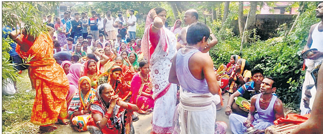
ଶୋଭାଯାତ୍ରାରେ ବାହାରିଥିବା ମହିଳାମାନେ ରାସ୍ତାରେ ବସି ରହିଛନ୍ତି।

କୁଳଙ୍ଗ ଥାନା ଅଧୀନ ଫତେପୁର ଗ୍ରାମରେ ପୂର୍ବ ବିବାହରୁ ଦୁଇ ଗୋଷ୍ଠୀ ମଧ୍ୟରେ ଶତ୍ରୁତା ଲାଗି ରହିଥିଲା। ରୁପବାର ଗଜଲକ୍ଷ୍ମୀ ପୂଜା ପାଇଁ ହୋଇଥିବା କଳସ ଶୋଭାଯାତ୍ରାକୁ ଗ୍ରାମ ରାସ୍ତାରେ ଅନ୍ୟ ଏକ ଗୋଷ୍ଠୀ ଛାଡ଼ି ନ ଥିଲା। ଫଳରେ ଦୀର୍ଘ ସମୟ ଧରି ରାସ୍ତାରେ କଳସ ଶୋଭାଯାତ୍ରା ଅଟକି ରହିଥିଲା। ଖବର ପାଇ ଗ୍ରାମବାସୀ ପୋଲିସ ପହଞ୍ଚି ବିବାହର ସମାଧାନ କରିଥିଲା।