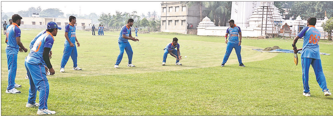
ନିମପୁର ଗ୍ରାଉଣ୍ଡରେ ରୁଧିରା ଅଭ୍ୟାସ ସେସର୍ ଅବସରରେ ଭାରତୀୟ ଦୃଷ୍ଟିହୀନ କ୍ରିକେଟ ଦଳର ଖେଳାଳିମାନେ ।