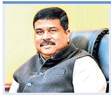
ଧର୍ମେନ୍ଦ୍ର ସଭାପତିଙ୍କ ସମାଲୋଚନା ପ୍ରତିକ୍ରିୟା ରଖିଲା ବିଜେଡି

ବ୍ୟାପାର, ସାମାଜ୍ୟ ଘଟଣାରେ ଜାମିନ ଲତ୍ୟାଦି ପ୍ରସଙ୍ଗ ର ସମାଧାନ ସମ୍ଭବ ହୋଇ ପାରୁନାହିଁ। ପୋଲିସ୍ ବ୍ୟାପାର ଗୃହ ବିଭାଗ ସମ୍ଭାଷଣ ବିଷୟ, ଯାହା ମୁଖ୍ୟମନ୍ତ୍ରୀଙ୍କ ନିକଟ