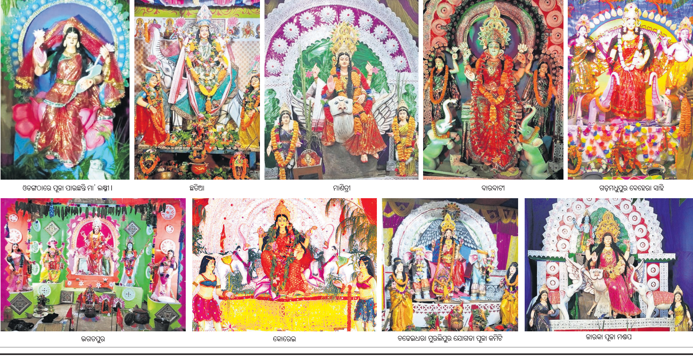
ଓଡ଼ିଶାରେ ପୂଜା ପାଉଛନ୍ତି ମା' ଲକ୍ଷ୍ମୀ। ଛତିଆ ମାଣିପୁରା ବାରବାଟୀ ଗଡ଼ମଧୁରୁ ବେହେରା ସାହି ଗଗନପୁର କୋରେଇ ଚଢ଼େଇଧରା ମୁରଲିଧର ଯୋଗତା ପୂଜା କମିଟି ଗାରକା ପୂଜା ମଣ୍ଡପ