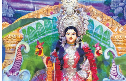
ବିଭିନ୍ନ ଗଜଲକ୍ଷ୍ମୀ ପୂଜା ମଣ୍ଡପ।