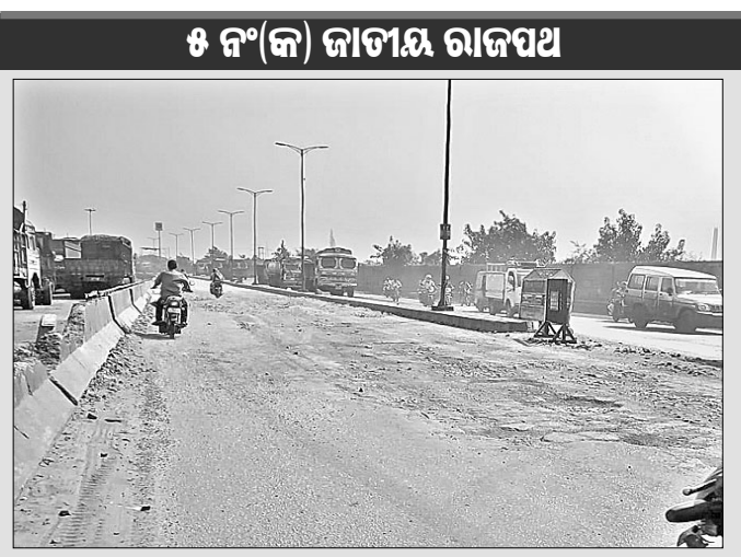
ରାସ୍ତାରେ ସୃଷ୍ଟି ହୋଇଥିବା ଖାଲଖମା।

ବନ୍ଦର ଭିତର ଶିଳ୍ପ ନଗରୀ ପାରାଦୀପକୁ ପୁଖ୍ୟ ରାସ୍ତା ହେଉଛି ୫ନଂକ ଜାତୀୟ ରାଜପଥ। ଚଢ଼ିଖୋଲରୁ ପାରାଦୀପକୁ ସଂଯୋଗ କରୁଥିବା ଏହି ୪ କିଲୋ ରାସ୍ତାରେ ଏବେ ଦୁର୍ଘଟଣା ସଂଖ୍ୟା ବଢ଼ିବାରେ ଲାଗିଛି। କାରଣ ଏହି ରାସ୍ତାର ବିଭିନ୍ନ ସ୍ଥାନ ଖାଲଖାମାରେ ଭର୍ତ୍ତି ହୋଇଛି। ଏଥିପାଇଁ ବାଲକ୍ଷ୍ମୀ ଆରମ୍ଭ କରି ଭାରିଯାନ ପର୍ଯ୍ୟନ୍ତ ଯାତାୟାତରେ ବହୁ ଅସୁବିଧା ହେଉଛି। ଅଧିକାଂଶ ଖାଲ ସ୍ଥାନରେ ଦୁର୍ଘଟଣା ଘଟୁଛି। ଖାଲଦେଇ ପଶ୍ୟ ବୋହେଇ ଗାଡ଼ି ଯାତାୟାତ କରିବା ସମୟରେ ଧକଡ଼ ଚକଡ଼ ହୋଇ ସେଥିରୁ କୋଲିକା ଓ ଲୁହା ପଥର ଗୁଣ୍ଡ ଖସୁଛି। ବର୍ଷା ସମୟରେ ଖାଲ ଜଣାପଡ଼ୁ ନ ଥିବାରୁ ଅନେକ ଚାଳକ ଖାଲରେ ଗାଡ଼ି ପକାଇ ଦୁର୍ଘଟଣାର ସମ୍ମୁଖୀନ ହେଉଛନ୍ତି। ଏହାଦ୍ୱାରା ଧନ ଜୀବନ ସହିତ ଅନେକ ଲୋକଙ୍କ ଯତି ଘଟୁଛି। ଅନ୍ୟପକ୍ଷରେ ରାସ୍ତାରେ ଯେଉଁ ଧୂଳି ପଡ଼ୁଛି ବର୍ଷାହେବା ପରେ ତାହା କାନ୍ଥୁ ଅତିକ୍ରମ କରି ହୋଇଯାଇଛି। ଫଳରେ ସେଥିରେ ଗାଡ଼ି ଚକା ଖସିଯାଉଛି। ଏଭଳି ସ୍ଥିତି ବିଶେଷକରି ଅଠରବାଙ୍କୀରୁ ଭୁବନେଶ୍ୱର ପର୍ଯ୍ୟନ୍ତ ରହିଛି। ରାସ୍ତା ମଝିରେ ଥିବା ବ୍ୟାରିକେଡ଼ ଅଧିକାଂଶ ସ୍ଥାନରେ ଭାଙ୍ଗି ପଡ଼ିଲାଣି। ତେଣୁ ଏହି ରାସ୍ତାକୁ ତୁରନ୍ତ ମରାମତି କରିବାକୁ ଅଞ୍ଚଳର ବିଭିନ୍ନ ସଂଗଠନ ଦାବି କରିଛନ୍ତି। ପୂର୍ବରୁ ବିକ୍ଷୁଭିତ ରାସ୍ତାରେ ମରାମତି ନେଇ ଗାଡ଼ି ଚକା ଖସିଯାଉଛି। ଏଭଳି ସ୍ଥିତି ଆୟୋଜନ ତାକରା ଦେଇଥିଲା। ସେତେବେଳେ ବିଶ୍ୱକର୍ମା ପୂଜା ଓ ଲଘୁତାପ ଯୋଗୁ ଏହି ଆୟୋଜନ ସ୍ଥଗିତ ରହିଥିଲା। ଏବେ ପୁଣି ଦଳ