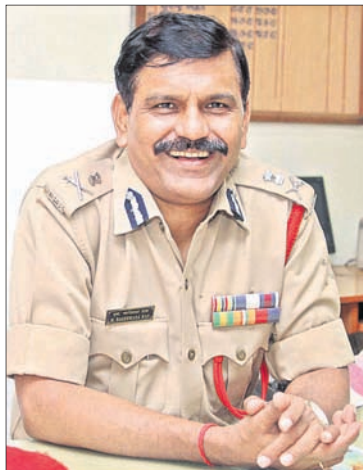
ଏମ୍. ନାଗେଶ୍ୱର ରାଓ

ବିନ ଥିଲା, ସିବିଆଇ ନିଁ ଶୁଣିଲେ ଭ୍ରଷ୍ଟାଚାରୀଙ୍କ ଲୋମ ଚାକୁରି ପଡ଼ୁଥିଲା। କିନ୍ତୁ ଏହାର କଡ଼ିତରରେ ଏବେ ଚାଲିଛି ଖୋଲାମୁକ୍ତ। ସିବିଆଇ ନିର୍ଦ୍ଦେଶକ ବର୍ମା ଏବଂ ପ୍ରଧାନମନ୍ତ୍ରୀ ମୋଦିଙ୍କ ପସନ୍ଦର ଅଧିକାରୀ ଅସ୍ଥାନା ପରସ୍ପର ବିରୋଧରେ ଦୁର୍ଗତି ଅଭିଯୋଗ ଆଣିବା ପରେ ଏବେ ତଥାକଥିତ ବିଶ୍ୱସନୀୟ ତଦନ୍ତକାରୀ ସଂସ୍ଥା ଉପରେ ଲୋକଙ୍କ ସନ୍ଦେହ