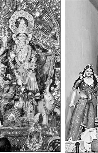
କୁଜଙ୍ଗ ସନାପାଳ ପୂଜା ମଞ୍ଚପ।