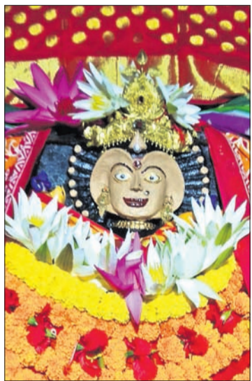
ଗ୍ରୀଷ୍ମା ପୂଜା ପାଇଁ ବିରଜାଙ୍କୁ ସଜ୍ଜିତ କରାଯାଇଛି।

ଯଜପୁରର ଅଧିକାରୀଙ୍କ ଦ୍ୱାରା ୧୧ଟି ଗ୍ରାକୃରକୁ ଜବତ କରାଯାଇଛି। ଯଜପୁର ମହାସମାବେଶରେ ପାଳିତ ହୋଇଯାଇଛି। ଯଜପୁର ପ୍ରାନ୍ତର ପାଳିଆ ସେବାୟତମାନେ ମା' ବିରଜାଙ୍କୁ ସ୍ନାନ କରି ଚନ୍ଦନ ଓ ସୁନାବେଶ ସହ ବଡ଼ସିଂହାର ବେଶରେ ସଜ୍ଜିତ କରାଇ ରାତିନାତି ଅନୁଯାୟୀ ପୂଜାର୍ଚ୍ଚନା କରୁଥିଲେ।