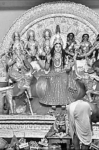
ତିର୍ତ୍ତୋଲ ନେହେରୁ ବଜାର ପୂଜା ମଞ୍ଚପ।