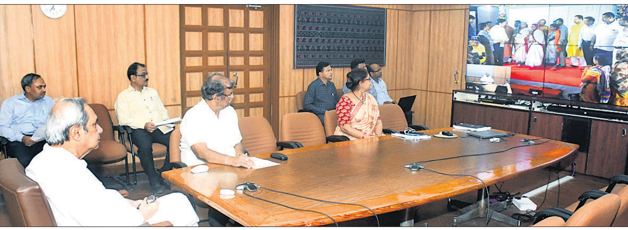
ମୁଖ୍ୟମନ୍ତ୍ରୀ ନବୀନ ପଟ୍ଟନାୟକ ସରିବାକନ୍ଦରୁ ଭିଡିଓ କନଫରେନ୍ସ ମାଧ୍ୟମରେ ହରିଷିଆଳି ଆଶ୍ରୟସ୍ଥଳ ଲୋକାର୍ପଣ କରୁଛନ୍ତି ।

ପୁରୀ ଅଧିକାରୀ/ଭୁବନେଶ୍ୱର (ସ୍ୱରୋ), ୨୫.୧୦ ଗୁରୁବାରଠାରୁ ଆରମ୍ଭ ହୋଇଛି କାର୍ଯ୍ୟକ୍ରମ । ହରିଷିଆଳିମାନେ ଆରମ୍ଭ କରିଛନ୍ତି କାର୍ଯ୍ୟକ୍ରମ । ରାଜ୍ୟ ସରକାରଙ୍କ ହରିଷିଆଳି ଯୋଜନାରେ ଶ୍ରୀକ୍ଷେତ୍ରକୁ ହରିଷିଆଳି ଆସିଥିବା ବୃତ୍ତଧାରୀଙ୍କ ପାଇଁ ଧର୍ମ ଆଶ୍ରୟସ୍ଥଳ କରାଯାଇଛି । ଏହି ଆଶ୍ରୟସ୍ଥଳରେ ହରିଷିଆଳିଙ୍କ ଲାଗି ମାଗଣା ରହଣି, ମହାପ୍ରସାଦ ସେବନର ବ୍ୟବସ୍ଥା ସହିତ ଅନ୍ୟାନ୍ୟ ଆନୁଷ୍ଠାନିକ ବ୍ୟବସ୍ଥା କରାଯାଇଛି । ମୁଖ୍ୟମନ୍ତ୍ରୀ ନବୀନ ପଟ୍ଟନାୟକ ସରିବାକନ୍ଦରୁ ଭିଡିଓ କନଫରେନ୍ସ ମାଧ୍ୟମରେ ଏହି ଆଶ୍ରୟସ୍ଥଳକୁ ଲୋକାର୍ପଣ କରିଛନ୍ତି ।