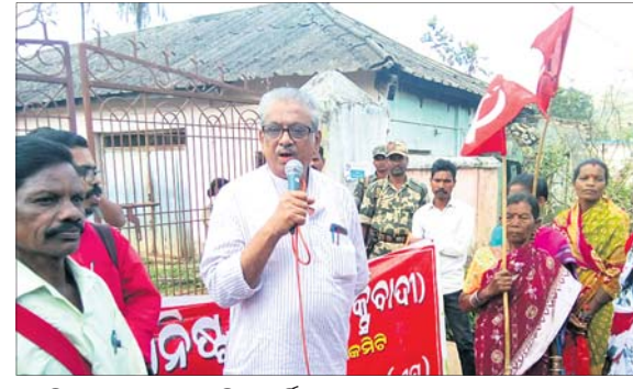
ଚାଷୀ ସଙ୍ଗଠନର ଦାବି... ଚାଷୀ ସଙ୍ଗଠନର ଦାବି... ଚାଷୀ ସଙ୍ଗଠନର ଦାବି...