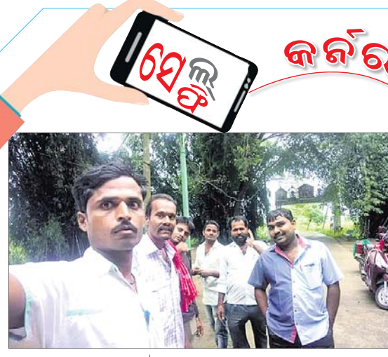
ଚାଷୀ ସଙ୍ଗଠନର ଦାବି... ଚାଷୀ ସଙ୍ଗଠନର ଦାବି... ଚାଷୀ ସଙ୍ଗଠନର ଦାବି...