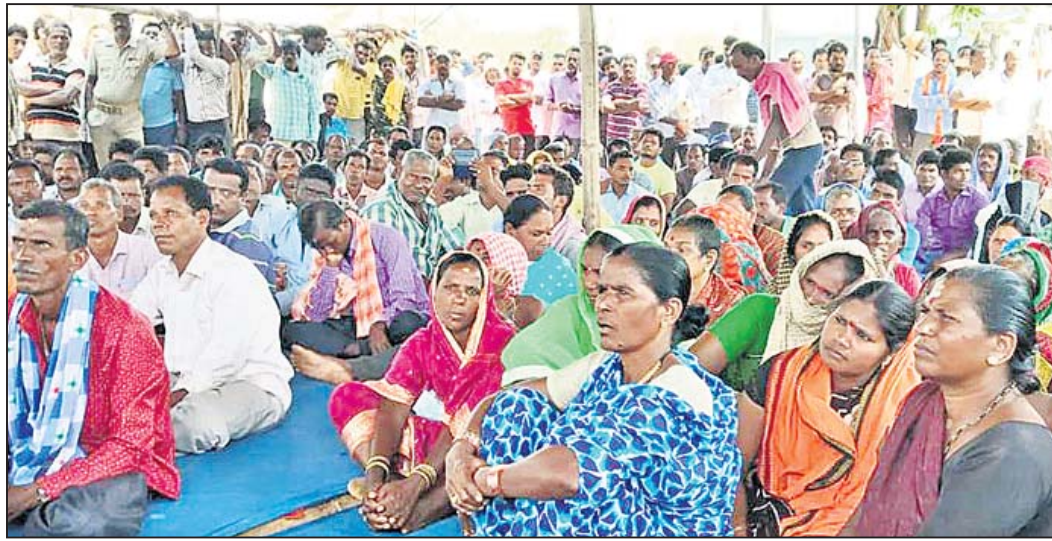
ପୋର୍ଟ ଫାଟକ ଆଗରେ ଧାରଣା ଦିଆଯାଇଛି ।