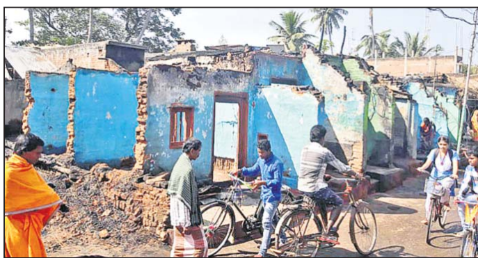
ଅଗ୍ନିକାଣ୍ଡରେ ପୋଡ଼ି ଯାଇଥିବା ଘର ।