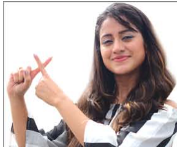
Elina Samantray Actress