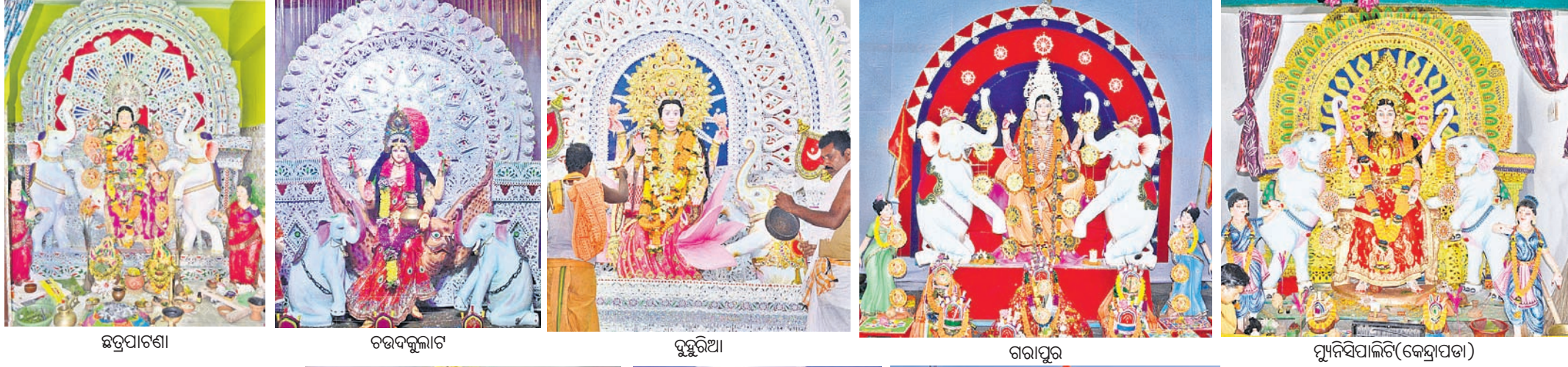
ଉତ୍ସବପାଟଣା, ଚରଦକୂଳାଟ, ବୁଝୁରିଆ, ଗରାପୁର, ପୁନିସିପାଳିତି(କେନ୍ଦ୍ରାପଡ଼ା)

କେନ୍ଦ୍ରାପଡ଼ା ଅଫିସ୍, ୨୬/୧୦: କେନ୍ଦ୍ରାପଡ଼ା ଜିଲାର ଗଣପର୍ବ ଗଜଲକ୍ଷ୍ମୀ ପୂଜା ଚରଦକୂଳାଠାରେ ମହାସମାରୋହରେ ପାଳିତ ହେଉଛି। ଚରଦକୂଳ ଗଜଲକ୍ଷ୍ମୀ ପୂଜା ମଣ୍ଡପ ସହ ହାଲସ୍କୁଲ ନିକଟସ୍ଥ ଅନନ୍ତ ଶ୍ୟାମ ମଣ୍ଡପ, ବଜାରର ମଧ୍ୟଭାଗରେ ଥିବା ପଦ୍ମାଳୟା ପୂଜା କମିଟି, ବସଷ୍ଟାଣ୍ଡରେ ଗାନ୍ଧୀ କଳ୍ପ, ଆନପତି ପୂଜା କମିଟି ଓ ହାଟପଡ଼ିଆଠାରେ ଗ୍ରାଣ୍ଡ ପୂଜା କମିଟି ପକ୍ଷରୁ ମା' ଲକ୍ଷ୍ମୀଙ୍କ ମୂର୍ତ୍ତି ଖୋଡ଼ଣ ଉପଚାରରେ ପୂଜା ହେଉଛି। କୁମାର ପୂର୍ଣ୍ଣିମାଠାରୁ ଜିଲାର ବିଭିନ୍ନ ସ୍ଥାନରେ ଗଜଲକ୍ଷ୍ମୀ ପୂଜା ଆରମ୍ଭ ହୋଇଥିବା ବେଳେ ଚରଦକୂଳର ବଜାର ଆଖପାଖ ଅଞ୍ଚଳରେ ବିଭିନ୍ନ ତୋରଣ ଓ ସାଜସଜ୍ଜା ଶ୍ରଦ୍ଧାଳୁଙ୍କ ଆକର୍ଷଣ କେନ୍ଦ୍ରବିନ୍ଦୁ ସାଜିଛି। ଆଲୋକମାଳାରେ ସମ୍ପୂର୍ଣ୍ଣ ବଜାର ଆଲୋକିତ କରାଯାଇଛି। ଏଥିସହ ପ୍ରତ୍ୟେକ ସନ୍ଧ୍ୟାରେ ପୂଜା ମଣ୍ଡପ ନିକଟରେ ସାଂସ୍କୃତିକ କାର୍ଯ୍ୟକ୍ରମ ଅନୁଷ୍ଠିତ ହେଉଥିବାବୁ ବଜାରରେ ଶ୍ରଦ୍ଧାଳୁଙ୍କ ଭିଡ଼ ଜମୁଛି।