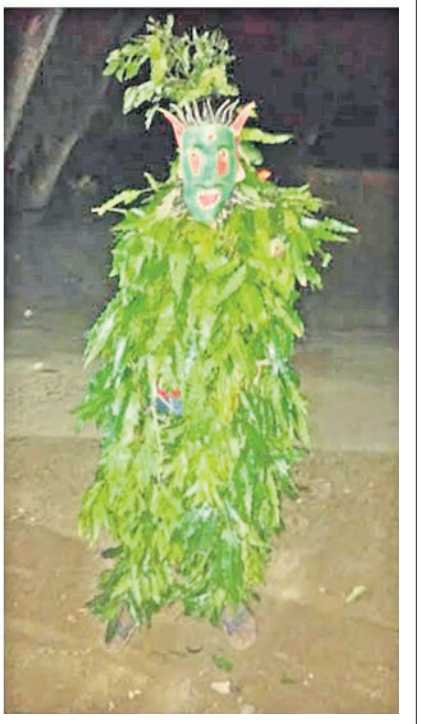
ଗାଁ ଦାଣ୍ଡରେ ପାଳଭୂତ।

ଡେରାବିଶ, ୨୬/୧୦ (ସ୍ୱ.ପ୍ର): ଉତ୍କଳୀୟ ପ୍ରାଚୀନ ପରମ୍ପରା ଓ ସଂସ୍କୃତିର ବହୁ ନିଦର୍ଶନ ରହିଛି। ପାର୍ବଣ ଋତୁରେ ଏହି ପରମ୍ପରାର ଝଲକ ବିଭିନ୍ନ ସ୍ଥାନରେ ଦେଖାଯାଉଛି। ଯୁବପିଢ଼ିଙ୍କ ମଧ୍ୟରେ ନୂତନତ୍ୱ ପ୍ରତି ଆଗ୍ରହ ରହିଥିଲେ ମଧ୍ୟ ଡେରାବିଶ ବ୍ଲକ୍ ଅଞ୍ଚଳରେ ପ୍ରାଚୀନ ପରମ୍ପରା ପ୍ରତି ଯୁବପିଢ଼ିଙ୍କ ମନରେ ଆଦର ରହିଥିବା ଦେଖିବାକୁ ମିଳୁଛି। କୁମାର ପୂର୍ଣ୍ଣିମା କୁମାରୀଙ୍କ ପର୍ବ ଭାବେ ଜଣାଶୁଣା ଥିବା ବେଳେ ଏହି ଉପଲକ୍ଷେ ଗାଁ ଦାଣ୍ଡରେ ପାଳଭୂତ ବୁଲିବା ପରମ୍ପରା ବିଭିନ୍ନ ସ୍ଥାନରେ ଖୁବ୍ ଉପହାସ ସହ ପାଳନ କରାଯାଏ। ଡେରାବିଶ ବ୍ଲକ୍ ବିଭିନ୍ନ ଗ୍ରାମରେ ପୂର୍ଣ୍ଣିମା ପରଠାରୁ ୭ଦିନ ପର୍ଯ୍ୟନ୍ତ ଗ୍ରାମର କେତେଜଣ ଯୁବକ ନିଜକୁ ସମ୍ପୂର୍ଣ୍ଣ ଭାବେ ପତ୍ରରେ ଘୋଡ଼େଇବା ସହ ପୂର୍ଣ୍ଣିମା ପୂର୍ଣ୍ଣା ଲଗାଇ ଦାଣ୍ଡରେ ବୁଲନ୍ତି। ପାଳଭୂତ ଦେଖିବା ପାଇଁ ଗାଁ ଦାଣ୍ଡରେ ପିଲାଠୁ