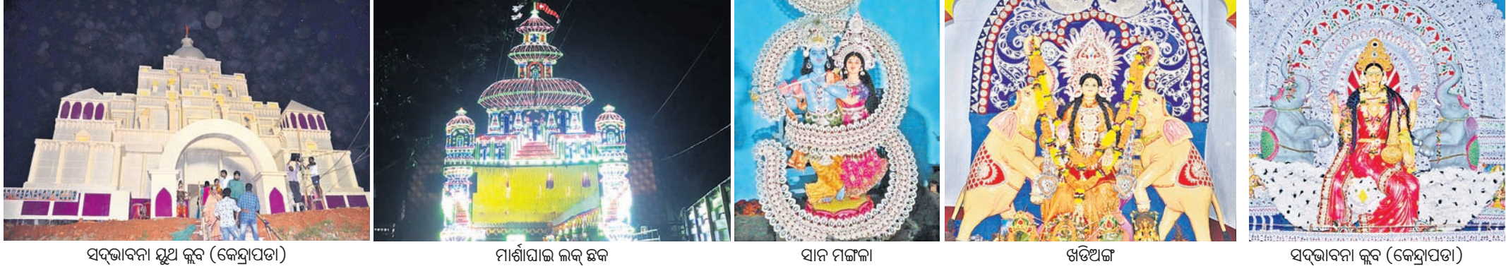
ସଦ୍‌ଭାବନା ଘୁଅ କୁର (କେନ୍ଦ୍ରାପଡ଼ା), ମାଣିଆପାଲ ଲକ୍ଷ୍ ଛକ, ସାନ ମଙ୍ଗଳା, ଖଡ଼ିଅଙ୍ଗ, ସଦ୍‌ଭାବନା କୁର (କେନ୍ଦ୍ରାପଡ଼ା)