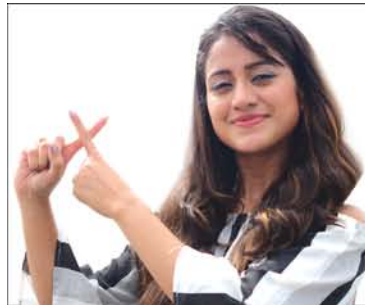
Elina Samantray Actress