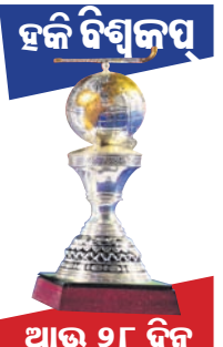
ଆଉ ୨୮ ଦିନ