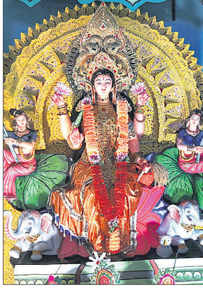
କୁସୁମର ସାହି ଥାନପତି, ମାର୍ଗଦର୍ଶୀ