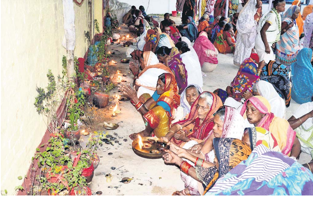
ହବିଷିଆଳିମାନେ ଆଶ୍ରୟସ୍ଥଳୀରେ ପୂଜା କରୁଛନ୍ତି।

ଶ୍ରୀକ୍ଷେତ୍ରରେ ରହି କାର୍ତ୍ତିକ ବ୍ରତ ପାଳନ କଲେ ଅଶେଷ ପୂଣ୍ୟ ମିଳିଥାଏ ବୋଲି ବିଶ୍ୱାସ ରହିଛି। ହେଲେ ପୁରୀକୁ ଆସି ବ୍ରତ ପାଳିବାକୁ ଆର୍ଥିକ ଛୁଟି ଅନେକଙ୍କୁ ପଛକୁ ଟାଳେ। ଶ୍ରୀକ୍ଷେତ୍ରରେ ରହିବା ସେମାନଙ୍କ ପାଇଁ ସ୍ୱପ୍ନପାଳୟୀ। ପରିଣତ ବୟସରେ ଏମିତି ଲକ୍ଷ୍ମୀ ରଖିଥିବା ବ୍ରତଧାରୀଙ୍କ ଏହି ସ୍ୱପ୍ନ ସାକାର ଲାଗି ସରକାର ଆରମ୍ଭ କରିଛନ୍ତି ହବିଷିଆଳି ଯୋଜନା। ହେଲେ ଏହାର ପ୍ରୟୋଗ ନେତୃତ୍ୱରେ ଅନେକ ସକଳ ବର୍ଗର ବ୍ୟକ୍ତି। ପୁଣି ଏମିତି କିଛି ମା' ରହୁଛି ଏଠାରେ ଯେଉଁମାନେ ନିଜର ପଦାକୁ ଆଶ୍ରୟସ୍ଥଳକୁ ଆସି ନପା ପରେ କରୁଛନ୍ତି। ଘର, ସଂସାର ପ୍ରତି ସେମାନଙ୍କର ବିପ୍ଳାବ ଆସିଯାଇଛି। ଆଉ କେହି ପୁଅପୋତୁଳ ନିର୍ଯ୍ୟାତନାକୁ ମନେ ପକାଇ ରୁମୁରି ବି ହେଉଛନ୍ତି, ପୁଣି କିଛି ହବିଷିଆଳିଙ୍କ ଆଚରଣ ପାଇଁ ପ୍ରଶ୍ନାସନିକ ଅଧିକାରୀ ବି ମାନସିକ ଚାପରେ ରହୁଛନ୍ତି। ଆଶ୍ରୟସ୍ଥଳକୁ ଏମିତି କେତେଜଣ ନିରାଶ୍ରୟଙ୍କ କରୁଛନ୍ତି କାହାଣୀକୁ ନେଇ ସ୍ୱତନ୍ତ୍ର ଉପସ୍ଥାପନା।