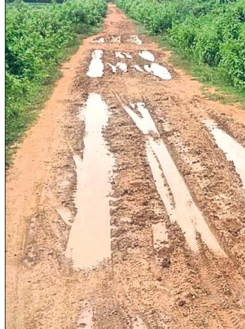
କର୍ମମାତ୍ର ହୋଇଥିବା ରାସ୍ତା।

ତେବେ ବିପର୍ଯ୍ୟୟ ଅବସ୍ଥାରେ ଥିବା ଏହି ରାସ୍ତା ନିର୍ମାଣ ପାଇଁ ପଞ୍ଚାୟତ, ବ୍ଲକ୍ କିମ୍ବା କୌଣସି ରାଜନେତାଙ୍କ ଅନୁଦାନ ପହଞ୍ଚିଯାଇ ନାହିଁ। ଅସରାସ ବର୍ଷ ହେଲେ ବେହାଲ ହୋଇପଡ଼େ ଏହି ରାସ୍ତା। ୧୯୮୪ ମସିହାରୁ କାର୍ଯ୍ୟକାରୀ ହୋଇଥିବା ଏହି ଜଳସେଚନ ପ୍ରକଳ୍ପର ଦଶପନ୍ଦରାସାଳକ ଜୀବନକାଳ ପାଲଟିଥିବା ବେଳେ ଏହି ପାର୍ଶ୍ୱ ରାସ୍ତା କର୍ମଣ୍ୟ ଅବସ୍ଥା ସାଧାରଣ ଲୋକଙ୍କ ମଧ୍ୟରେ ଅବହେଳା ଦୃଷ୍ଟି କରିଛି। ରାଜ୍ୟର ଜଳସମ୍ପଦ ବିଭାଗ ଅଧୀନ ବିଭିନ୍ନ ଜଳସେଚନ ପ୍ରକଳ୍ପକୁ ଗୋଟିକୋଟି ଚଳା ଅନୁଦାନ ଆସୁଥିବା ବେଳେ ଏହି ପ୍ରକଳ୍ପ