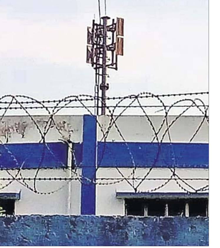
ପାରାଦୀପରେ ଲାଗିଥିବା ସୁନାମି ସତର୍କତା ଯନ୍ତ୍ର ।