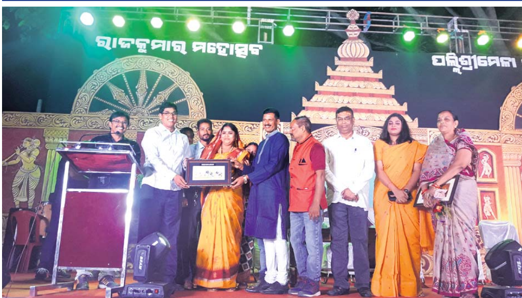
ବିଧାୟକ ଜଣେ ଅତିଥିଙ୍କୁ ସମର୍ପିତ କରୁଛନ୍ତି।

ରାଜକୁମାର ମହୋତ୍ସବ, ପଲ୍ଲିଶ୍ରୀ ମେଳା ୨୦୧୮ ଉଦ୍‌ଯାପିତ