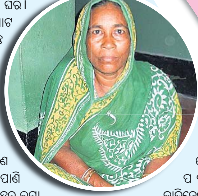
ଲେ।କ ପ ବ ନ ରେ କାଜିନେଇ ପିନ୍ଧିଲେ ।