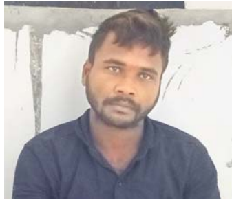
ନୂଆଗାଁ, ୨୮୧୦ (ଡି.ଏନ.ଏ.): ନୟାଗଡ଼ ଜିଲ୍ଲା ନୂଆଗାଁ ଥାନା ଅଞ୍ଚଳର ଜଣେ ଯୁବକ କଲିକତା ଛାତ୍ରୀଙ୍କୁ ଅଶାଳୀନ ବ୍ୟବହାର କରିବା ଅଭିଯୋଗରେ ଗିରଫ ହୋଇ ରବିବାର ଜେଲ ଯାଇଛନ୍ତି। ସେ ହେଲେ

କଲିକତା ଛାତ୍ରୀଙ୍କୁ ଅଶାଳୀନ ବ୍ୟବହାର କରି ଜେଲ ଗଲେ ଯୁବକ