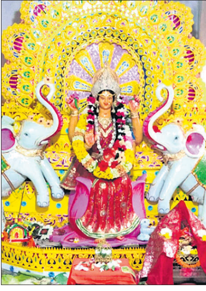
ଠାକୁରପାଟଣା ପୂଜା ମଣ୍ଡପ, ଡେବୀବିଶ୍ଣୁ