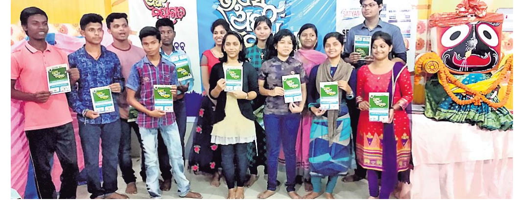
ମନୋନୀତ ହୋଇଥିବା ପ୍ରତିଭାମାନେ।

ଓଡ଼ିଶା, ୨୮।୧୦(ସ.ପ୍ର.): ନୟାଗଡ଼ ଜିଲ୍ଲାରେ ପ୍ରଥମ କରି ନୟାଗଡ଼ କ୍ଲବ ମଙ୍ଗଳା ସେମାନଙ୍କ ମଧ୍ୟରୁ ପ୍ରଫୁଲ୍ଲାରାଣୀ ନୟାଗଡ଼ କାର୍ଯ୍ୟକ୍ରମରେ ଓଡ଼ିଶା କ୍ଲବକୁ ସର୍ବାଧିକ ୧୩ ଜଣ ଛାତ୍ରଛାତ୍ରୀ ମନୋନୀତ ହୋଇଛନ୍ତି। ସ୍ଥାନୀୟ ଇନ୍ଦ୍ରୋର ସ୍ୱାଧିକାରରେ ରବିବାର ଅନୁଷ୍ଠିତ କ୍ଲବସଭାରେ ଚୟନ ପ୍ରକ୍ରିୟାରେ