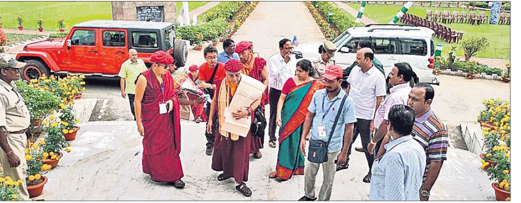
ବୌଦ୍ଧଭିକ୍ଷୁମାନଙ୍କୁ ଜିଲ୍ଲାପାଳ ସ୍ୱାଗତ କରୁଛନ୍ତି ।

ପ୍ରାୟ ୬ଟି ଦେଶର ୩୫୦ ଜଣ ବୌଦ୍ଧ ଧର୍ମାବଲମ୍ବୀ ପଦଯାତ୍ରାରେ ଆସି ରବିବାର ପାରାଦୀପରେ ପହଞ୍ଚିଛନ୍ତି । ସେମାନେ ବନ୍ଦର ସହର ବୁଲି ଦେଖିବା ସହ ବେଳାକୁମିତ୍ର ପ୍ରାର୍ଥନା ଓ ପଲିଥିନ ସଫା କରିଥିଲେ । ମାନବିକତା, କରୁଣା, ମୈତ୍ରୀ ଓ ଶାନ୍ତି ପ୍ରତିଷ୍ଠାର ପ୍ରଚାର ଉଦ୍‌ଦେଶ୍ୟରେ ସେମାନେ ପଦଯାତ୍ରା