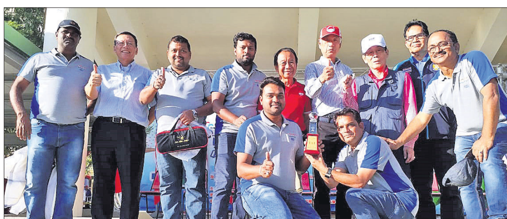
ଚାଇଫ୍‌ମାନ୍ ମିଠିଲିଆରେ ଅନୁଷ୍ଠିତ ଅନ୍ତର୍ଜାତୀୟ ଟେବୁଲ୍ ଟେନିସ୍ ଚାମିୟନ ଭାରତୀୟ ଦଳ ।

ଆସୀୟ ରଗ୍‌ଟାରେ ଚାଲିଥିବା ୨୨ତମ ଚାଇଫ୍‌ମାନ୍ ଚାମିୟନ ଟେବୁଲ୍ ଟେନିସ୍ ଚାମିୟନ ଚାମିୟନ ହୋଇଛି । ଫାଇନାଲରେ ଦଳ ୧-୨ ସେଟ୍‌ରେ ନାଗାଲାଣ୍ଡଠାରୁ ପରାସ୍ତ ହୋଇଥିଲା । ସେମିରେ ଦଳ ଉତ୍ତରପ୍ରଦେଶକୁ ହରାଇ ଫାଇନାଲରେ ପ୍ରବେଶ କରିଥିଲା ।