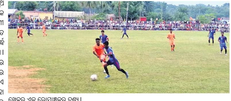
ଖେଳର ଏକ ରୋମାଞ୍ଚକର ଦୃଶ୍ୟ।