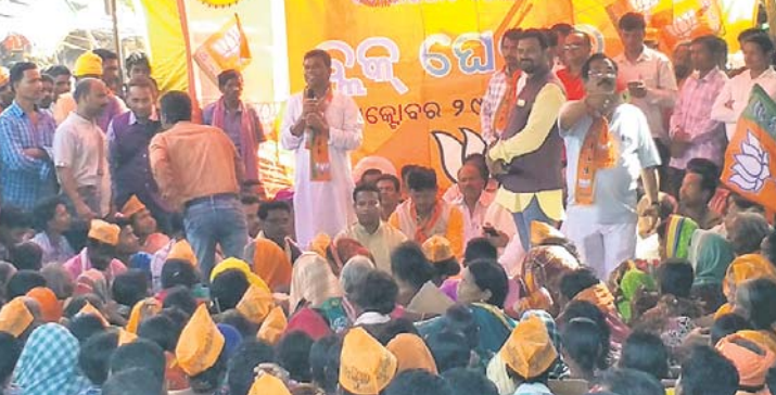
ବୈପାରାଗୁଡ଼ାରେ ଭାଜପା ପକ୍ଷରୁ ଆୟୋଜିତ ସଭା ।