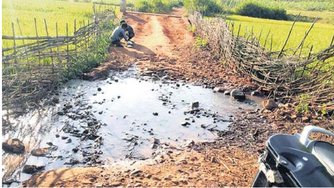
ରାସ୍ତା ମଝିରେ ସୃଷ୍ଟି ହୋଇଥିବା ଖାଲରେ ପାଣି ଜମି ରହିଛି ।

କୋରାପୁଟ ଜିଲ୍ଲା ଦଶମନ୍ତପୁର ବ୍ଲକ ଅନ୍ତର୍ଗତ ଭୂୟାଗୁଡ଼ା ପଞ୍ଚାୟତରେ ଯାତାୟତ ପାଇଁ ପଞ୍ଜା ରାସ୍ତା ସ୍ୱାପ୍ନ । ଏହି ବ୍ଲକରେ ରାମନାଗମନ ପାଇଁ ଲୋକେ ହାଲୁକା ଭୋଗୁଛନ୍ତି ।