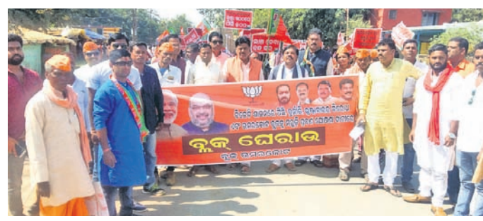
ଭାଜପା ନେତା ଓ କର୍ମକର୍ତ୍ତାମାନେ ଶୋଭାଯାତ୍ରାରେ ଯାଉଛନ୍ତି ।

ଭାରତ ଯୋଜନାରେ ସମଗ୍ର ପାଳଖାନା ଯୋଗାଇ ଦେବା, ଅଣଜଳପ୍ରତିଷ୍ଠା କରାଯାଇ ନାହିଁ, ଭମରକୋଟ ସବିଭିକ୍ଷକର ମାନ୍ୟତାକୁ ଶୀଘ୍ର କାର୍ଯ୍ୟକାରୀ କରିବାକୁ ଦାବିପତ୍ରରେ ଦର୍ଶାଯାଇଛି । ଦାବିକୁ ନିରାକରଣ କରିବାକୁ ଆଗାମୀ ଦିନରେ ଯେଉଁ ଆୟୋଜନ ହେବ ସେଥିପାଇଁ ପ୍ରଶାସନ ଦାୟି ରହିବ ବୋଲି ଚେତାବନୀ ଦେଇଛନ୍ତି ।