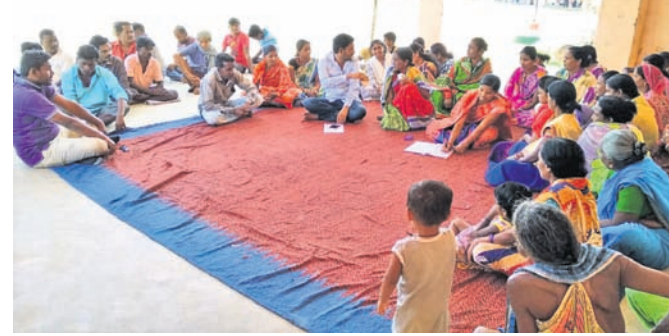
ପକ୍ଷାଦ୍ୱାରା ଉପସ୍ଥିତ ଗ୍ରାମବାସୀ ।

ମାଲକାନଗିରି ଜିଲ୍ଲା ମାୟାଲି ବ୍ଲକ ସଦର ସହକାରୀ ସଂସ୍ଥାରେ ଏମଜିଏନଆରଇଜିଏସ୍ କାମ ଉପରେ ଗୁରୁତ୍ୱ ଦେବାକୁ ନିର୍ଦ୍ଦେଶ ଦିଆଯାଇଛି । ଏହାକୁ ଚିତ୍ତ ଉପାସନା ସମ୍ପାଦକ ଦଳର ମୁଖ୍ୟ ଅତିଥି ଭାବେ ଯୋଗ ଦେଇ ଉଦ୍‌ଘାଟନ କରିଥିଲେ ।