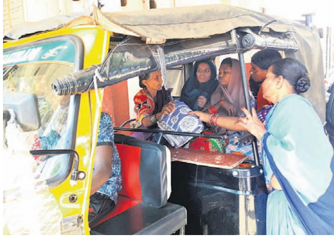
ଅସ୍ତ୍ରୋପଚାର ପରେ ୨ ଜଣ ମହିଳା ନିଜ ଖର୍ଚ୍ଚରେ ଅଟୋ ଭଡା କରି ଘରକୁ ଯାଇଛନ୍ତି ।

ନବରଙ୍ଗପୁର ଜିଲ୍ଲା ସଦର ମହକୁମା ଡାକ୍ତରଖାନାରେ ସୋମବାର ପରିବାର ମଙ୍ଗଳ ଅସ୍ତ୍ରୋପଚାର ଶିବିର ଅବ୍ୟବସ୍ଥା ମଧ୍ୟରେ ହୋଇଛି । ଅସ୍ତ୍ରୋପଚାର ପରେ ମହିଳାମାନଙ୍କୁ ଧୂଳିଧୂସର ଦରିରେ ଶୋଇବାକୁ ପଡ଼ିଥିଲା । ଏପରିକି ସେମାନଙ୍କୁ ଘରକୁ ଛାଡ଼ିବା ପାଇଁ ଜଣକ ପିଛା ୨୫୦ ଟଙ୍କା ସରକାର ଯୋଗାଉଥିବା ବେଳେ ମହିଳାମାନେ ନିଜ ବ୍ୟବସ୍ଥାରେ ବହୁ କଷ୍ଟରେ ଅଟୋ ଭଡା କରି ଘରକୁ ଯାଇଥିଲେ । ସରକାରୀ ନିୟମକୁ ସାମ୍ବ୍ୟ ବିଭାଗ ଅଣଦେଖା କରିଛି । ଖୋଦ ସଦର ମହକୁମା ଡାକ୍ତରଖାନାରେ ଏପରି ଅବ୍ୟବସ୍ଥାକୁ ଲୋକେ ନାପସନ୍ଦ କରିଛନ୍ତି ।