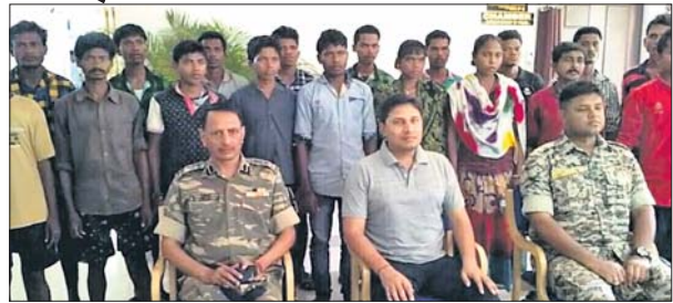
ଆୟତ୍ତମର୍ଯ୍ୟାଦା କରିଥିବା ମାଓବାଦୀ ।

ମାଲକାନଗିରି ଜିଲ୍ଲା ପୋଡ଼ଶା ଛତିଶଗଡ଼ ରାଜ୍ୟ ଆରକ୍ଷୀ ଅଧୀକାରୀଙ୍କ ଅଧିକାରୀଙ୍କ ନିକଟରେ ଯୋଗଦାନ କଲେ ୨୦ ଜଣ ମାଓବାଦୀ ଆୟତ୍ତମର୍ଯ୍ୟାଦା କରିଛନ୍ତି ।