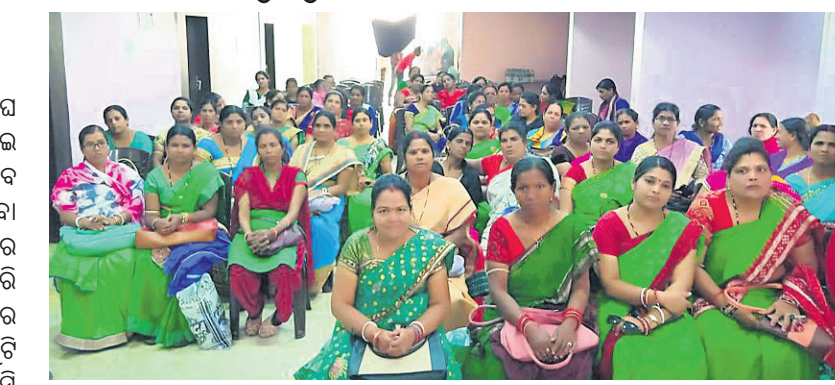
ବୈଠକରେ ବହୁମୁଖୀ ମହିଳା ସ୍ୱାସ୍ଥ୍ୟକର୍ମୀ ସଂଘର ସଭ୍ୟମାନେ ।

ଓଡ଼ିଶା ବହୁମୁଖୀ ମହିଳା ସ୍ୱାସ୍ଥ୍ୟକର୍ମୀ ସଂଘ ପକ୍ଷରୁ ମଙ୍ଗଳବାର ଠାକୁ ବିଭିନ୍ନ ଦାବୀ ନେଇ ସାମ୍ବ୍ୟ ସଚିବଙ୍କୁ ଦାବିପତ୍ର ପ୍ରଦାନ କରାଯିବ ବୋଲି ସ୍ଥାନୀୟ ଏକ ଲବ୍ ଠାରେ ହୋଇଥିବା ବୈଠକରେ ନିଶ୍ଚିତ ନିଆଯାଇଛି । କ୍ୟାଡର ବୁକ୍ସରେ ସଂଶୋଧନ, ପଦୋନତି ଓ ଚାକିରି ସଂକ୍ରାନ୍ତ ଅନ୍ୟାନ୍ୟ ଆନୁସାଙ୍ଗିକ ବ୍ୟବସ୍ଥାରେ ପରିବର୍ତ୍ତନ ନେଇ ଦାବୀ କରିବେ । ତିନିଟି କରିବେ କିନ୍ତୁ ସରକାରଙ୍କୁ କୌଣସି ରିପୋର୍ଟ ପ୍ରଦାନ କରିବେ ନାହିଁ ବୋଲି ସଂଘ ବୈଠକରେ ନିଶ୍ଚିତ ନେଇଛି । ବହୁମୁଖୀ ସାମ୍ବ୍ୟ କର୍ମୀ ପଦବୀ ପରିବର୍ତ୍ତନ କରି ଏବନଏମ ନାମରେ ନାମିତ କରିବା, ଏବନଏମନାମେ ପାଇଥିବା ଭଳି ସମସ୍ତ ସୁବିଧା ସୁଯୋଗ ଯୋଗାଇ ଦିଆଯାଉ । କେନ୍ଦ୍ର ସରକାରଙ୍କ ଅଧିକାର କାର୍ଯ୍ୟରେ ଏବନଏମନାମକ ଗ୍ରେଡ଼ପେ ୨୮ଶହ ଟଙ୍କା ଓ ପଦୋନତି ରହିଛି ସେହିଭଳି ବ୍ୟବସ୍ଥା ଗ୍ରହଣ କରାଯାଉ