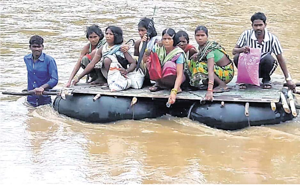
ଡୁଙ୍ଗରୀଆମାନେ ଭେଳା ସାହାଯ୍ୟରେ ନଦୀ ପାର ହେଉଛନ୍ତି ।

ରାୟଗଡ଼ା ଅଫିସ୍, ୨୯ ଅକ୍ଟୋବର ରାଜ୍ୟବାସୀଙ୍କୁ ମୌଳିକ ସୁବିଧା ସୁଯୋଗ ଯୋଗାଇବା ନିମନ୍ତେ ରାଜ୍ୟ ସରକାର ଯୋଜନା ଉପରେ ଯୋଜନା କରି କୋଟି କୋଟିଟଙ୍କା ଖର୍ଚ୍ଚକରୁଛି । ହେଲେ ରାୟଗଡ଼ା ଜିଲ୍ଲାରେ କିଛି ଅଧିକାରୀଙ୍କ ଦାୟାଦୃଢ଼ିତା ଓ ଅପାରଗତା ଯୋଗୁଁ ବହୁ ଅଞ୍ଚଳରେ ଯୋଜନାଗୁଡ଼ିକ ଯୋଗୁଁ ମାଟିରେ ବେଶ୍‌ବାବୁ ପିଲିଛି । ଯାହାର ଦୁର୍ଭିକ୍ଷା ଦୁର୍ଗତ ଅଞ୍ଚଳରେ ବ୍ୟବସାୟ କରୁଥିବା ଲୋକେ ଭୋଗୁଛନ୍ତି । ସମସ୍ୟାର ସମାଧାନ ନିମନ୍ତେ ବୌଦ୍ଧି ନୟତା ହେଲେ ମଧ୍ୟ କେହି ସେମାନଙ୍କ କଥାକୁ ଚାଲିବ ବୋଲି ନାହାନ୍ତି । ନିରାଶ ହୋଇ ଭଗବାନଙ୍କ ଭରସାରେ ବଞ୍ଚୁଛନ୍ତି । ଏହାର କ୍ଳମ୍ଭ ଉଦ୍‌ଘାଟଣା ଦେଖିବାକୁ ମିଳିଛି ରାୟଗଡ଼ା ଜିଲ୍ଲା କଲ୍ୟାଣସିଂହପୁର ବ୍ଲକ୍‌ରେ । କଲ୍ୟାଣସିଂହପୁର ବ୍ଲକ୍‌ ଦେଇ ପ୍ରବାହିତ ହୋଇଛି କଲ୍ୟାଣ ନଦୀ । ନଦୀର ଆରପଟେ ରହୁଥିବା ପାଣି, ସୁନାଖଣ୍ଡି, ପୁରୀଗାଡ଼ିଆ, ଯୋଗମା, କନ୍ଧକାଟିପାଡ଼ି, ମାଝାଗୁଡ଼ା ପଞ୍ଚାୟତର ଲୋକଙ୍କ ସୁବିଧା ନିମନ୍ତେ ଏଥିରେ ଏକ ଯୋଜନା ନିର୍ଦ୍ଦିଷ୍ଟ କରାଯାଇଥିଲା । ହେଲେ ୨୦୧୭ ଜୁଲାଇ ୧୨ ତାରିଖରେ କଲ୍ୟାଣନଦୀରେ ଆସିଥିବା ପ୍ରକଳ୍ପକାରୀ ବନ୍ୟାରେ ଭକ୍ତ ଯୋଗ ଯୋଗ ହୋଇଯାଇଥିଲା । ଫଳରେ ଯୋଗାଯୋଗ ବିଚ୍ଛିନ୍ନ ହୋଇଯିବାକୁ ଲୋକେ ବହୁ ଅସୁବିଧାର ସମ୍ମୁଖୀନ ହୋଇଛନ୍ତି । ଏ ନେଇ ବାରମ୍ବାର ଜଣାଇବା ପରେ ପ୍ରଶାସନ ପକ୍ଷରୁ ଉକ୍ତ ନଦୀରେ ଧୁଆଁ ପାଇଁ ପକାଇ ଏକ ଅସ୍ଥାୟୀ ଯୋଜନା ନିର୍ଦ୍ଦିଷ୍ଟ କରାଗଲା । ଲୋକେ ଏହା ଦେଇ ଯାତାୟତ କଲେ । ହେଲେ ଚଳିତ ବର୍ଷ ଜୁଲାଇ ୧୨ ତାରିଖରେ ଲଗାଣ ବର୍ଷା ଯୋଗୁଁ ଅସ୍ଥାୟୀ ଯୋଜନା ଧୋଳିଗଲା । ନଦୀ ଆର ପଟେ ରହୁଥିବା ଉକ୍ତ ୬ଟି ପଞ୍ଚାୟତରେ ଲୋକେ ପୁଣି ଅସୁବିଧା ଭୋଗିଲେ । ଲୋକେ ବ୍ୟାକ, ସ୍ୱାସ୍ଥ୍ୟସେବା, ପ୍ରାକୃତିକ ବିପର୍ଯ୍ୟୟ ପରିଚାଳନା କମିଟି ବୈଠକ