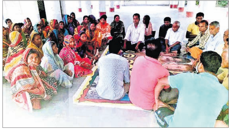
ମଦ ବିକ୍ରି ବନ୍ଦ କରିବାକୁ ଗ୍ରାମବାସୀ ଆଲୋଚନା କରୁଛନ୍ତି।

ମଦପୂର୍ଣ୍ଣ ପଞ୍ଚାୟତ ଗଠନ କରିବାକୁ ଉପସ୍ଥିତ ବ୍ୟକ୍ତିମାନେ ମହିଳାଙ୍କୁ ଆହ୍ୱାନ ଦେଇଥିଲେ। ଏଥିରେ ଗ୍ରାମର ପ୍ରତ୍ୟେକ ବ୍ୟକ୍ତି, ମୁତକ ଓ ଛାତ୍ରାଛାତ୍ରୀ ମହିଳାମାନଙ୍କୁ ସହଯୋଗ କରିବେ ବୋଲି ପ୍ରତିଶ୍ରୁତି ଦେଇଥିଲେ।