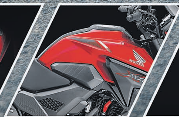
AGGRESSIVE-SCULPTED TANK DESIGN