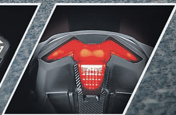
RAZOR EDGED LED TAIL LAMP