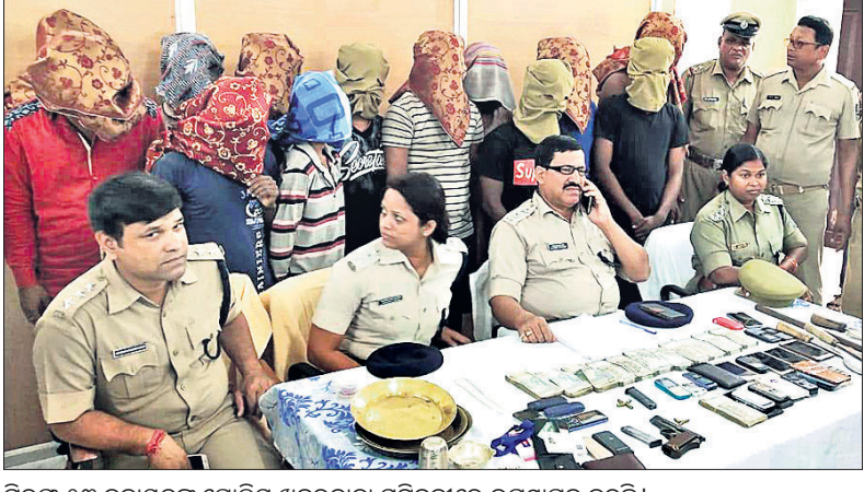
ରିପର୍ଟ ୧୩ ତଦାରଖତ ଗ୍ୟାଙ୍ଗର ସମ୍ପତ୍ତିର ସମୀକ୍ଷା କରାଯାଇଛି।