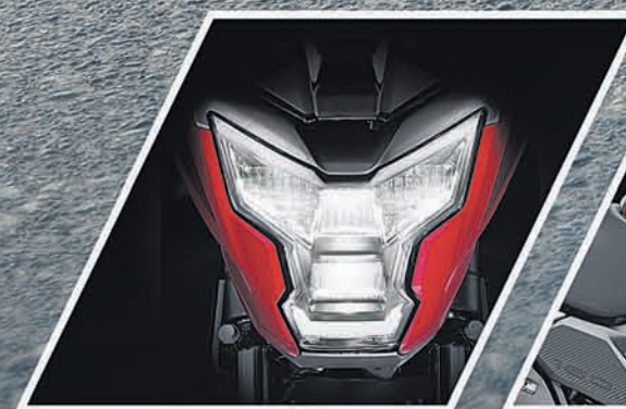
ROBO-FACE LED HEADLAMP