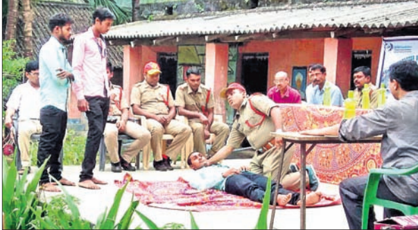
ଅଗ୍ନିଶମ ବିଭାଗ ପକ୍ଷରୁ ବିଭିନ୍ନ କୌଶଳ ପ୍ରଦର୍ଶନ କରାଯାଇଛି।

ଓଡ଼ିଆ ଜଗତମାଳି ଓ ଗୁଡ଼ି ପ୍ରୟୋଗ -ଏ.ବି. ମିଶ୍ର ପଢ଼ିଶ୍ରୀ ପ୍ରା.ଲି.