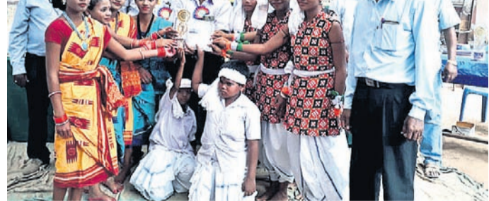
ରାୟଗଡ଼ାରେ କୃତା ପ୍ରତିଯୋଗାତମକ ପୁରସ୍କାର ପ୍ରଦାନ କରାଯାଇଛି ।

ରାୟଗଡ଼ା (ଗଜପତି)/କାଶୀନଗର, ୧୧୧୧(ଡି.ଏନ.ଏ.) ଗଜପତି ଜିଲ୍ଲା ରାୟଗଡ଼ା ବ୍ଲକ୍ ସଦରସ୍ଥ ଗୋଷ୍ଠୀ ଶିକ୍ଷାଧିକାରୀଙ୍କ କାର୍ଯ୍ୟକ୍ରମ ପରିସରରେ ଗୁରୁବାର ବ୍ଲକ୍ସ୍ତରୀୟ ଶିଶୁ ମହୋତ୍ସବ 'ସୁରଭି' ଆୟୋଜିତ ହୋଇଯାଇଛି ।