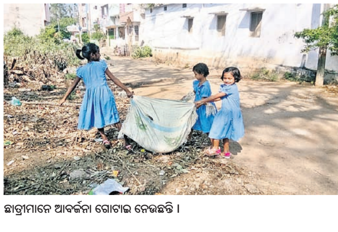
ଛାତ୍ରମାନେ ଆବର୍ତ୍ତନା ଗୋଟାଇ ନେଇଛନ୍ତି ।

ପ୍ରତି ପିଲାଙ୍କୁ ପ୍ରାଥମିକ ଶିକ୍ଷା ଦେବା ପାଇଁ ସରକାର ବିଭିନ୍ନ ଯୋଜନା ପ୍ରଣୟନ କରିବା ସହ ନାନା ପଦକ୍ଷେପ ନେଇଛନ୍ତି ।