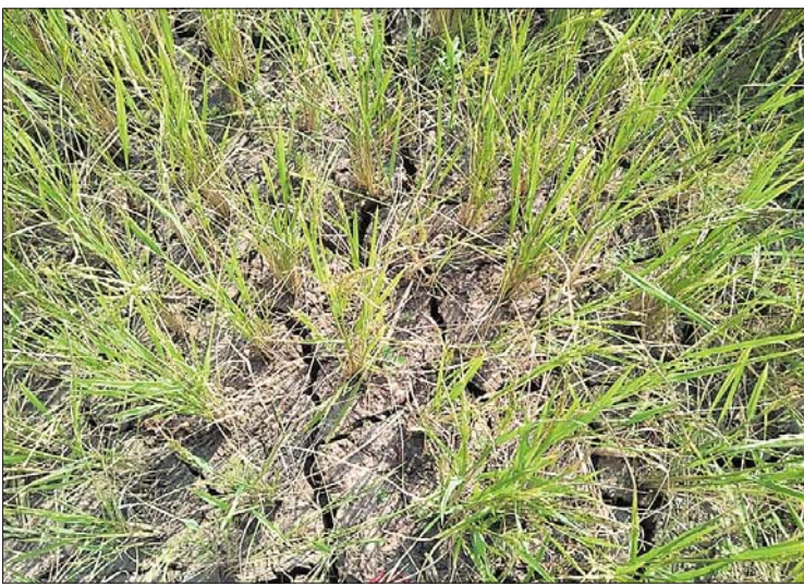
କଳାହାଣ୍ଡି ଜିଲ୍ଲା ରୋଲାପୁଣ୍ଡା ଅଞ୍ଚଳରେ ମରୁଡ଼ି ।

ଭୁବନେଶ୍ୱର, ୧୧୧୧ (ଭୁବନେ): ରାଜ୍ୟ କ୍ୟାବିନେଟର ଏକ ଗୁରୁତ୍ୱପୂର୍ଣ୍ଣ ବୈଠକ ଶୁକ୍ରବାର ଅନୁଷ୍ଠିତ ହେବ । ସଚିବାଳୟରେ ଅନୁଷ୍ଠିତ ହେବ । ୪୫ ମିନିଟରେ ମୁଖ୍ୟମନ୍ତ୍ରୀ ନବୀନ ପଟ୍ଟନାୟକଙ୍କ ଅଧିକାରରେ ଅନୁଷ୍ଠିତ ହେବ । ଏହି ବୈଠକରେ କୃଷି ଏବଂ ଖେଳାଳୟରେ ଅର୍ଥସମାପନକର କ୍ୟାବିନେଟର ପ୍ରସ୍ତାବକୁ କ୍ୟାବିନେଟ ମଞ୍ଜୁରୀ ମିଳିବା ସମ୍ଭାବନା ରହିଛି । ଏଥିସହିତ ସ୍ୱାସ୍ଥ୍ୟ, ରାଜସ୍ୱ ଓ ଖାଦ୍ୟ ଯୋଗାଣ ବିଭାଗର କେତୋଟି ପ୍ରସ୍ତାବ ଉପରେ ମୋହର ଲାଗିବ । କ୍ୟାବିନେଟରେ ମୋଟ ୫ଟି ପ୍ରସ୍ତାବକୁ ଅନୁମୋଦନ ମିଳିବ ବୋଲି ଏକ ବିଶ୍ୱସ୍ତ ସୂତ୍ରରୁ ଜଣାପଡ଼ିଛି । ତେବେ ବୈଠକରେ କେତୋଟି ପ୍ରସ୍ତାବ ଉପରେ ମୋହର ଲାଗି ସେ ନେଇ ବୈଠକ ଏବେଯାଏଁ ଗୁପ୍ତ ରଖାଯାଇଛି ।