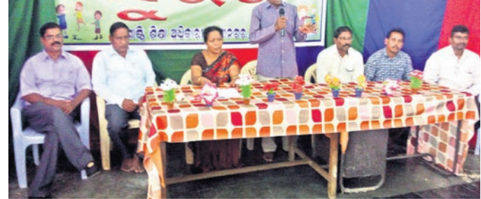
କାଶୀନଗରରେ ଆୟୋଜିତ କାର୍ଯ୍ୟକ୍ରମରେ ମଞ୍ଚାସୀନ ଅତିଥି ।

ରାୟଗଡ଼ା (ଗଜପତି)/କାଶୀନଗର, ୧୧୧୧(ଡି.ଏନ.ଏ.) ଗଜପତି ଜିଲ୍ଲା ରାୟଗଡ଼ା ବ୍ଲକ୍ ସଦରସ୍ଥ ଗୋଷ୍ଠୀ ଶିକ୍ଷାଧିକାରୀଙ୍କ କାର୍ଯ୍ୟକ୍ରମ ପରିସରରେ ଗୁରୁବାର ବ୍ଲକ୍ସ୍ତରୀୟ ଶିଶୁ ମହୋତ୍ସବ 'ସୁରଭି' ଆୟୋଜିତ ହୋଇଯାଇଛି ।