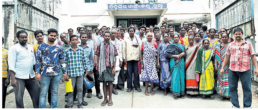
ତହସିଲଦାରଙ୍କୁ ଅଭିଯୋଗ ଜଣାଇବା ପାଇଁ ଆସିଥିବା କୁଜାସିଂ ପଞ୍ଚାୟତବାସୀ ।

ଲୋକେ ଅଭିଯୋଗ କରିଛନ୍ତି ଯେ, ବାତ୍ୟା ବିପଦମାନଙ୍କୁ ଏପର୍ଯ୍ୟନ୍ତ ରିଲିଫ ମିଳିନାହିଁ । ଯଦି କେଉଁଠି କାହାକୁ ମିଳୁଛି ତେବେ ତାକୁ ଏଥିଲାଗି ହାତକୁଞ୍ଚା ଦେବାକୁ ପଡୁଛି ।