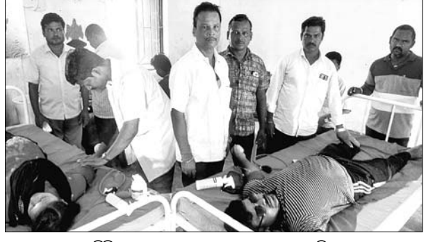
ଶିବିରରେ ରକ୍ତଦାତାମାନେ ରକ୍ତଦାନ କରୁଛନ୍ତି।

୪୩ ଯୁନିଟ୍ ରକ୍ତ ସଂଗ୍ରହ... ୪୩ ଯୁନିଟ୍ ରକ୍ତ ସଂଗ୍ରହ