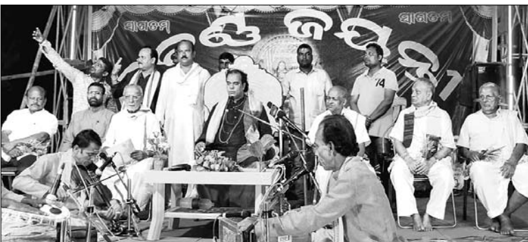
ଗଜଲକ୍ଷ୍ମୀ ପୂଜା ସୁବର୍ଣ୍ଣ ଜୟନ୍ତୀ ଉତ୍ସବରେ ଉପସ୍ଥିତ ଅଟନ୍ତି ଓ ପ୍ରବକ୍ତା।

ଗଜଲକ୍ଷ୍ମୀ ପୂଜା ସୁବର୍ଣ୍ଣ ଜୟନ୍ତୀ ଉତ୍ସବ... ଗଜଲକ୍ଷ୍ମୀ ପୂଜା ସୁବର୍ଣ୍ଣ ଜୟନ୍ତୀ ଉତ୍ସବ