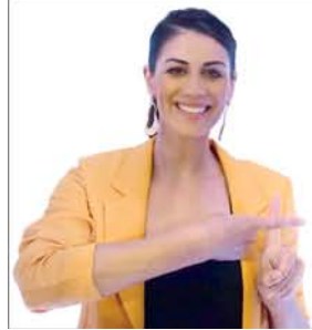
STEPHANIE RICE Swimmer - Olympic Medallist