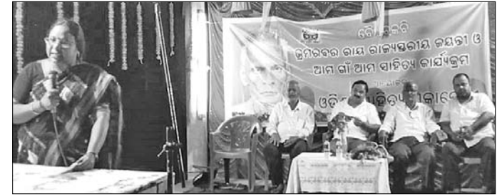
ବୈଷ୍ଣବ କବିଙ୍କ ଜୟନ୍ତୀ ଉତ୍ସବରେ ଉପସ୍ଥିତ ଅଟନ୍ତି।

ଧାନ ଥୋଡ଼ ବେଳକୁ ପାଣି ନାହିଁ... ଧାନ ଥୋଡ଼ ବେଳକୁ ପାଣି ନାହିଁ