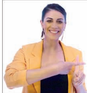
STEPHANIE RICE Swimmer - Olympic Medallist