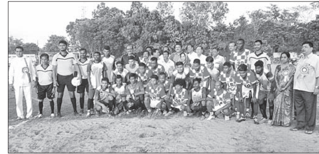
ଉତ୍ତମ ବଳର ଖେଳାଳି