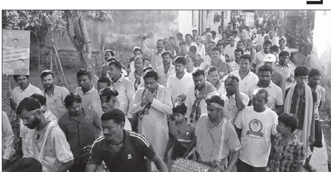
ପଦଯାତ୍ରାରେ ବିଧାୟକଙ୍କ ସହ ଦଳୀୟ କର୍ମୀମାନେ ।