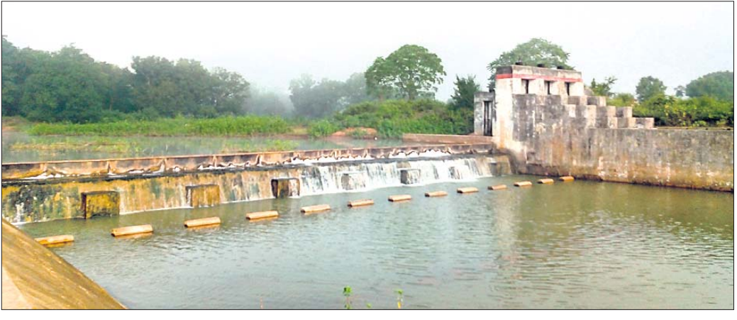
ଡାହୁକା ଡ୍ୟାମ୍ ।

ନୟାଗଡ଼ ବ୍ଲକ୍ ଲକ୍ଷ୍ମୀପ୍ରସାଦ ପଞ୍ଚାୟତରେ ଥିବା ଡାହୁକା ଡ୍ୟାମ୍ (ଜଳ ବିଭାଜନା ପ୍ରକଳ୍ପ) ବର୍ତ୍ତମାନ ଅବ୍ୟବସ୍ଥା ମଧ୍ୟରେ ଥିବା ଦେଖିବାକୁ ମିଳୁଛି।