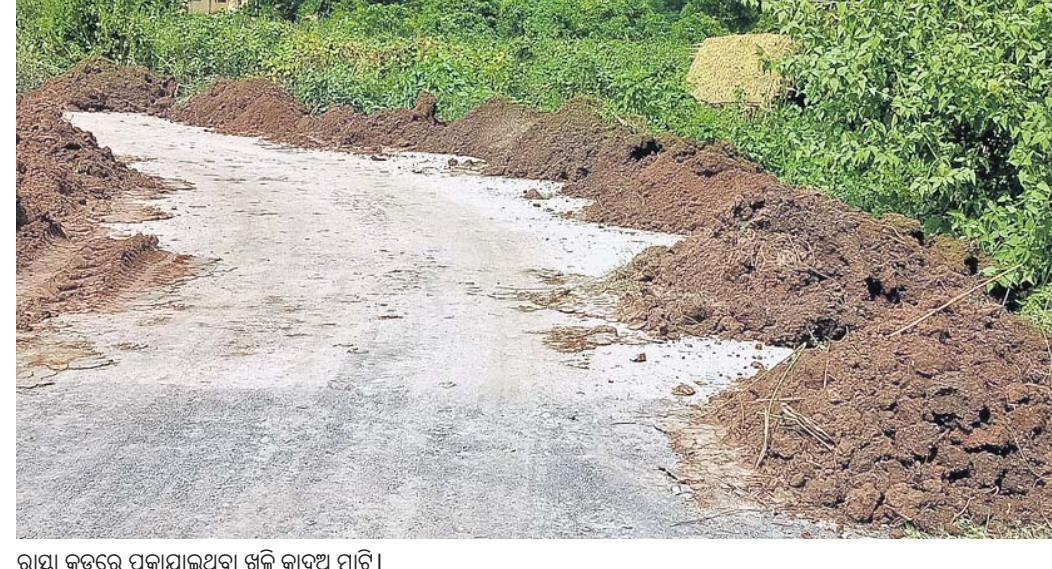
ରାସ୍ତା କଟରେ ପକାଯାଇଥିବା ଖଲି କାବୁଅ ମାଟି।

ନୟାଗଡ଼ ଜିଲ୍ଲା ନୂଆଗାଁ ବ୍ଲକ୍ରେ ଗ୍ରାମ୍ୟ ଉନ୍ନୟନ ବିଭାଗ ଦ୍ୱାରା କରାଯାଇଥିବା ରାସ୍ତାକାର୍ଯ୍ୟ ନିମ୍ନମାନର ନେଇ ବାରମ୍ବାର ଅଭିଯୋଗ ହେଉଥିଲେ ମଧ୍ୟ ବିଭାଗୀୟ ଉଚ୍ଚ କର୍ମଚାରୀ ଏଥିପ୍ରତି ଦୃଷ୍ଟି ଦେଉ ନ ଥିବାରୁ ଜନଅସନ୍ତୋଷ ବଢ଼ିବାରେ ଲାଗିଛି।