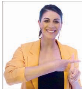
STEPHANIE RICE Swimmer - Olympic Medallist