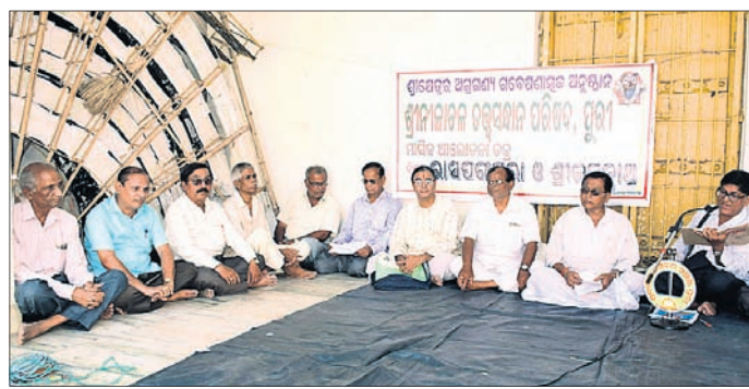
ବୈଠକରେ ଉପସ୍ଥିତ ପରିଷଦ କର୍ମକର୍ମୀ।

ପୁରୀ ଅଫିସ, ୪।୧୧ ଶ୍ରୀନୀଳାଚଳ ତତ୍ତ୍ୱ ସନ୍ଧାନ ପରିଷଦର ନଭେମ୍ବର ମାସ ଆଲୋଚନାଚକ୍ର ରବିବାର ଶ୍ରୀଜଗନ୍ନାଥ ବଜ୍ର ମଠ ପରିସରରେ ଅନୁଷ୍ଠିତ ହୋଇଯାଇଛି।