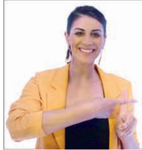
STEPHANIE RICE Swimmer - Olympic Medallist

ମାଓବାଦୀଙ୍କୁ ବିପ୍ଳବ କହି କଂଗ୍ରେସର ବରିଷ୍ଠ ନେତା ହରହରୀଶାରେ ପଡ଼ିଛନ୍ତି। ଏକ ବୈଠକରେ ରବିବାର ଉତ୍ତରପ୍ରଦେଶ କଂଗ୍ରେସ କମିଟି ସଭାପତି ରାଜ ବବର ନିଜ ଅଧିକାର ପାଇଁ ହରିହରୀରେ ମାଓବାଦୀମାନେ ଲଢ଼େଇ କରୁଥିବା କହିଛନ୍ତି। ନିଜ ଅଧିକାର ପାଇଁ ଲଢ଼ୁଥିବା ବ୍ୟକ୍ତିଙ୍କୁ ବିପ୍ଳବୀ କୁହାଯାଇଥାଏ ବୋଲି ସେ କହିଛନ୍ତି। ରାଜ ବବରଙ୍କ ଏଭଳି ମତବ୍ୟ କଂଗ୍ରେସ ପାଇଁ ଏକ ସମସ୍ୟା ସୃଷ୍ଟି କରିଥିବା ରାଜନୈତିକ ମହଲରେ ଚର୍ଚ୍ଚା ହେଉଛି।