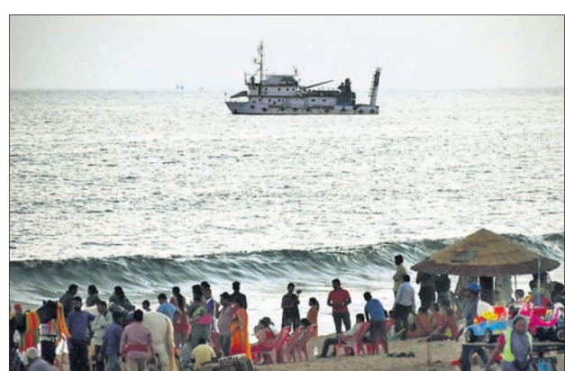
ପୁରୀ ସମୁଦ୍ରରେ ବେଆଇନ ଭାବେ ଏକ ଗ୍ରାମର ଯାତାୟାତ କରୁଛି।

ନଭେମ୍ବର ପହିଲାରେ ମେ ୩୧ ପର୍ଯ୍ୟନ୍ତ ସମୁଦ୍ର କୁଳଠାରୁ ଉତ୍ତରକୁ ୫ କିମି ମଧ୍ୟରେ ଗ୍ରାମର ଓ ଯନ୍ତ୍ରଚାଳିତ ବୋଟ ଚଳାଚଳକୁ ବାରଣ କରାଯାଇଛି। ବର୍ତ୍ତମାନ ଅଲିଭରିଭେଲେ କର୍ତ୍ତୃକ ପ୍ରକଳନ ରାଜ୍ୟ ଆରମ୍ଭ ହୋଇଥିବା ବନ ବିଭାଗ ପକ୍ଷରୁ ଏହି କଟକଣା ଲାଗାଯାଇଛି। ହେଲେ କଟକଣା ଲାଗାଇ ରୁଦ୍ଧ ବସି ବନ ବିଭାଗ। ରବିବାର ଅପରାହ୍ଣ ୫ଟାରେ ପୁରୀ ସମୁଦ୍ର ବେଳାଭୂମିଠାରୁ ମାତ୍ର ୫୦୦ ମିଟର ମଧ୍ୟରେ ନିଷିଦ୍ଧାଞ୍ଚଳରେ ଏକ ବଡ଼ ଗ୍ରାମର ଚଢ଼କ କାଟିଲା। ଛୋଟ କାହାଳ ଭଳି ଦେଖାଯାଉଥିବା ଉକ୍ତ ଗ୍ରାମର ଲଙ୍ଗର ପକାଇ ରହିବା ଭଳି ଏକ ନିର୍ଦ୍ଦିଷ୍ଟ ଗ୍ରାମରେ କିଛି ସମୟ ରହିଥିଲା। ଏହାକୁ ଦେଖିବାକୁ ବେଳାଭୂମିରେ ପର୍ଯ୍ୟଟକଙ୍କ ଭିଡ଼ ଜମିଥିଲା। କିଛି ଲୋକ ଫଟୋ ମଧ୍ୟ ଉଠାଇଥିଲେ। ଏହା ଜାଣିବା ପରେ ଗ୍ରାମରୁ ଯେଉଁଠି ସେଠାକୁ ଉତ୍ତରକୁ ପକାଇ ଯାଇଥିଲା। ଅନେକ ସମୟରେ ଏହି କଟକଣାକୁ ବେଶାତିର କରି ନିଷିଦ୍ଧାଞ୍ଚଳରେ ମାଛ ମରାଯାଇଛି। ପୁରୀ ବେଳାଭୂମିର ଅତି ନିକଟରେ ଏକାଧିକ ଗ୍ରାମର ଯାତାୟାତ କରୁଛନ୍ତି। ଅନ୍ୟପକ୍ଷରେ ଜଙ୍ଗଲ ବିଭାଗ ପକ୍ଷରୁ ଏ ପର୍ଯ୍ୟନ୍ତ ସାମୁଦ୍ରିକ ପାଟ୍ରୋଲିଂ ଆରମ୍ଭ ହୋଇ ନ ଥିବା ଜଣାପଡ଼ିଛି।