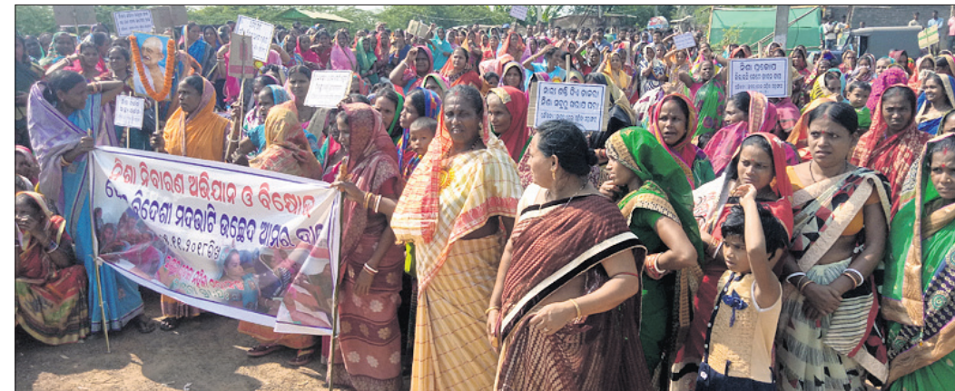
କାରୁଳା ପଞ୍ଚାୟତର ମହିଳାଙ୍କ ମଦବିରୋଧୀ ଶୋଭାଯାତ୍ରା।