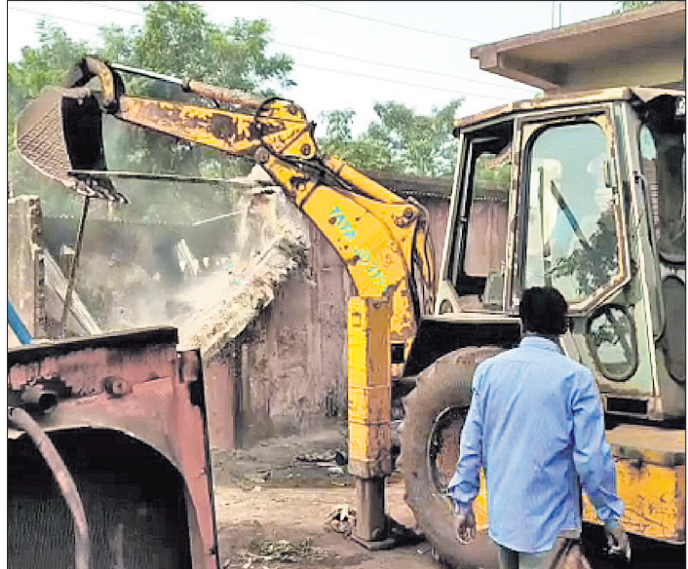
ମେଶିନ ସାହାଯ୍ୟରେ ଉଚ୍ଛେଦ କରାଯାଉଛି।

ଗାଡି ମରାମତି ହୋଇଥିଲା। ଭାରାଯାନ ଚଳାଚଳ ଯୋଗୁଁ ଶବ୍ଦ ପ୍ରଦୂଷଣ ହେଉଥିଲା। କୋର୍ଟ କାର୍ଯ୍ୟକାରୀ ହେବା ପୂର୍ବରୁ ବେଆଇନ ଜବରଦଖଲରେ ଥିବା ଗ୍ୟାରେଜ ଗୁଡିକୁ ହଟାଇବା ଲାଗି ନୋଟିସ୍ ଜାରି ହୋଇଥିଲେ ହେଁ ସେମାନେ ହଟି ନ ଥିଲେ। ସୋମବାର ଗ୍ରାମୀୟ ପ୍ରଶାସନିକ ଅଧିକାରୀ ଓ ପୋଲିସ୍ ପ୍ରଶାସନ ଉପସ୍ଥିତ ରହି ଉଚ୍ଚ ଜବରଦଖଲକୁ ହଟାଇଥିବା ଜଣାପଡିଛି।