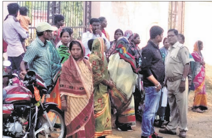
ଜେଲ ସମ୍ମୁଖରେ ଆଇନଜୀବୀ ଓ ସାଧାରଣ ଲୋକେ ମୁକ୍ତିଚର୍ଚ୍ଚା କରୁଛନ୍ତି।

ନୀଳଗିରି ଜେଲରେ କ୍ୟାମ୍ପ କୋର୍ଟ ବିରୋଧକୁ ନେଇ ଯୋମବାର ଉତ୍ତେଜନା ଦେଖାଦେଇଛି। ଫଳରେ ଆଇନଜୀବୀ ଓ ସାଧାରଣ ଲୋକଙ୍କ ଭିତରେ ଉତ୍ତେଜନା ଚରମସୀମାରେ ପହଞ୍ଚି ଉତ୍ତରୁପ ଧାରଣ କରିଥିଲା। ଘଟଣାସ୍ଥଳରେ ପୋଲିସ୍ ପହଞ୍ଚି ବୁଝାଶୁଝା କରିବାରେ ଉତ୍ତେଜନା ଅଧିକାୟିତା। ଦୀର୍ଘ ଏକମାସ ହେଲା ଚୋରା ମଦ ଚାଲାଣ ମାମଲାରେ ଜେଲରେ ଥିବା ୨ଜଣ ଅଭିଯୁକ୍ତଙ୍କ ଜାମିନ ଶୁଣାଣି ପାଇଁ ତାଙ୍କ ସମ୍ପର୍କୀୟଙ୍କଠାରୁ ସହକାରୀ ସେସବୁ ଜବ୍ ସତ୍ୟକୃତ ମିଶ୍ର ଦରଖାସ୍ତ ଗ୍ରହଣ କରିଛନ୍ତି। ଚେତବ ଉତ୍ତେଜନା ଜାମିନ ଶୁଣାଣି ହୋଇ ନ ଥିବା ଜଣାଯାଇଛି। ଗତ ଅକ୍ଟୋବର