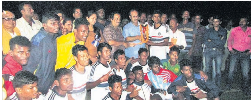
ଅତିଥିକ ରହଣରେ ବିଜୟୀ ବାରିପଦା ଟିମର ଖେଳାଳି ଖରା, ୫।୧୧(ଡି.ଏନ.ଏ.)

ନେତାଜୀ କ୍ଲବ ଆନୁକୁଲ୍ୟରେ ଖରା ଲୁକ ଅଧୀନ ଆଇ.ଏ.ଏ.ସି. ପି.ଏ.ସି. ଟୁର୍ନାମେଣ୍ଟରେ ଚାମ୍ପିୟନ ହୋଇଥିବା ନେତାଜୀ ଆନ୍ତଃଜିଲ୍ଲା ଟ୍ରୋଫି ଟୁର୍ନାମେଣ୍ଟରେ ବିଜୟୀ ହୋଇଥିବା ବାରିପଦା ଟିମର ଖେଳାଳି ଖରା, ୫।୧୧(ଡି.ଏନ.ଏ.)