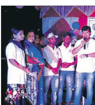
କୃତ୍ରିଗାଁ ଠାରେ ଆୟୋଜିତ କାର୍ଯ୍ୟକ୍ରମରେ ଯୁବବାହିନୀ କର୍ମକର୍ମୀ।