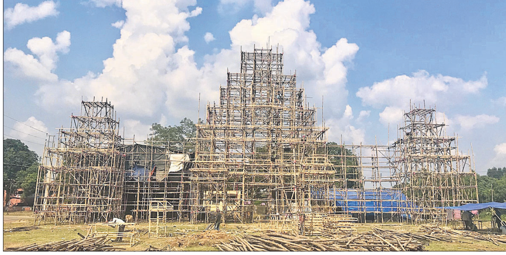
ତୋରଣରେ ମାହିସ୍ମୃତି ଦରବାର ନିର୍ମାଣ କରାଯାଉଛି ।

ଜଗତର ଶାନ୍ତି ଓ ମଙ୍ଗଳ ଉଦ୍ଦେଶ୍ୟରେ ପ୍ରତିବର୍ଷ ବାରିପଦା ସହରରେ ଭଞ୍ଜପୁର ମା' ଜଗନ୍ନାଥଙ୍କ ପୂଜା କରାଯାଏ ।