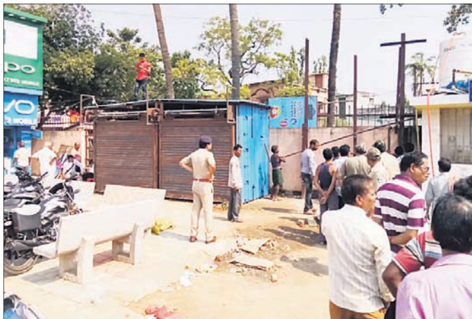
ଜବରଦଖଲ ଉଚ୍ଛେଦ କରାଯାଇଛି। ପ୍ରକାଶ ଆଉ କି, ଉଚ୍ଚ ସ୍ଥାନ ରାଜନୈତିକ ଦଳ ଏବଂ ସାମାଜିକ ବିଭିନ୍ନ ସମୟରେ ସହରର ମଧ୍ୟସ୍ଥଳ ହୋଇଥିବା ବେଳେ ସଙ୍ଗଠନ ପକ୍ଷରୁ ବିଭିନ୍ନ ସମୟରେ

କରାଯାଇଥାଏ। ଆଇନଶୁଖିଲା ପରିସ୍ଥିତି ସମୟରେ ଆନାର ଯାନବାହାନ ରଖାଯିବା ସହ ପର୍ଯ୍ୟବେକ୍ଷଣ ବହୁ ଉଠାବୋକାଳୀ ଉଚ୍ଚ ସ୍ଥାନରେ ନିଜର ବ୍ୟବସାୟ କରିଥାନ୍ତି। ମଣ୍ଡପର ମୁଖ୍ୟ ଉଚ୍ଚ ସ୍ଥାନରେ ଉଠାବୋକାଳୀକାରୀ ବେଆଇନ ଭାବରେ ପ୍ରତିଦିନ ଚାନ୍ଦା ଆଦାୟ କରିବା ମଧ୍ୟ ଅଭିଯୋଗ ହୋଇଛି। ତୁରୀ ପୂଜା ସମୟରେ ଅସ୍ଥାୟୀ ଚୋରଣ ତିଆରି ହୋଇଥିବା ବେଳେ ସେଠାରେ ମଣ୍ଡପର ଜାଗା ବୋଲି ଦାବି କରି ଚଞ୍ଚଳତା ପୂର୍ବକ ୨/୩ଟି ସତର ଲାଗାଇ ସ୍ଥାୟୀ ବୋକାଳ ନିର୍ମାଣ କରାଯାଇଥିଲା। ଏହାପରେ ବିଭିନ୍ନ ସଙ୍ଗଠନ, ବୁଦ୍ଧିଜୀବୀଙ୍କ ତରଫରୁ ଜିଲାପାଳଙ୍କ ନିକଟରେ ଅଭିଯୋଗ ହୋଇଥିଲା।