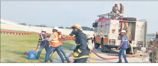
ମକ୍ତୂଲ୍ ପ୍ରଦର୍ଶନ କରାଯାଇଛି।