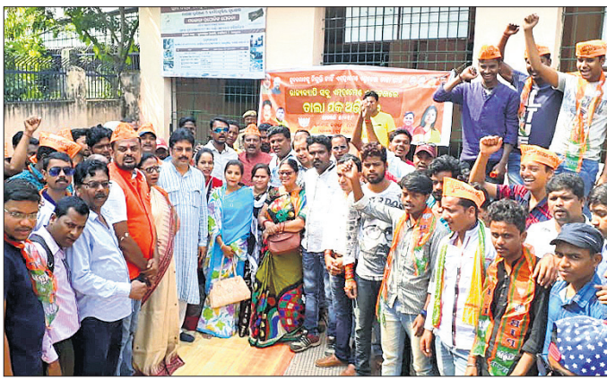
କାର୍ଯ୍ୟକ୍ରମରେ ଉପସ୍ଥିତ ଭାଗ୍ୟା କର୍ମୀ।

ଦ୍ଵାରା ରିଟ୍ ଗ୍ରାମୀୟ ଜେଲରେ ରହିଛନ୍ତି। ଆଇନଜୀବୀଙ୍କ ଆନ୍ଦୋଳନ ପାଇଁ ସେମାନେ ଜାମିନରେ ମୁକ୍ତି ପାଇ ନାହାନ୍ତି। ଜେଲରେ କ୍ୟାମ୍ପକୋର୍ଟ କରି ଅଭିଯୁକ୍ତଙ୍କ ଜାମିନ ଶୁଣାଣି କରି ବ୍ୟକ୍ତିଗତ ପୂର୍ତ୍ତାଲିକାରେ ଯିବା ପାଇଁ ଉଚ୍ଚ ନ୍ୟାୟାଳୟ ବିଚାରପତିଙ୍କୁ ନିର୍ଦ୍ଦେଶ ଦେଇଛନ୍ତି। ତାହା ଗ୍ରାମୀୟ କୋର୍ଟରେ କାର୍ଯ୍ୟକାରୀ ହୋଇ ନ ଥିବାରୁ ଜେଲରେ ଥିବା ଅଭିଯୁକ୍ତଙ୍କ ପରିବାର ଲୋକଙ୍କ ନେତୃତ୍ଵରେ ଶତାଧିକ ପୁରୁଷ ମହିଳା ଜେଲ ସମ୍ମୁଖରେ ପହଞ୍ଚିଥିଲେ। ହେଲେ ସେଠାରେ ଉପସ୍ଥିତ ଥିବା କେତେକ ଆଇନଜୀବୀ ଅଜାମତା କରିବା ସହ ଜଳ୍ପ କ୍ୟାମ୍ପ କୋର୍ଟକୁ ବିରୋଧ କରିଥିଲେ। ପରେ କୋର୍ଟ ଆଗରେ ଆଇନଜୀବୀ ଓ ଲୋକଙ୍କ ଭିତରେ ଉତ୍ତେଜନା ଦେଖାଦେଇଥିଲା।