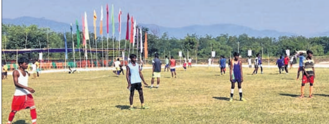
ଝୋଳା କୁରୁଳି (ଫୁଟି) ଖେଳ ଲାଗି ବହୁଳ ଆଗ୍ରହ

ଝୋଳା କୁରୁଳି (ଫୁଟି) ଖେଳ ଲାଗି ବହୁଳ ଆଗ୍ରହ ଝୋଳା କୁରୁଳି (ଫୁଟି) ଖେଳ ଲାଗି ବହୁଳ ଆଗ୍ରହ ଝୋଳା କୁରୁଳି (ଫୁଟି) ଖେଳ ଲାଗି ବହୁଳ ଆଗ୍ରହ ଝୋଳା କୁରୁଳି (ଫୁଟି) ଖେଳ ଲାଗି ବହୁଳ ଆଗ୍ରହ