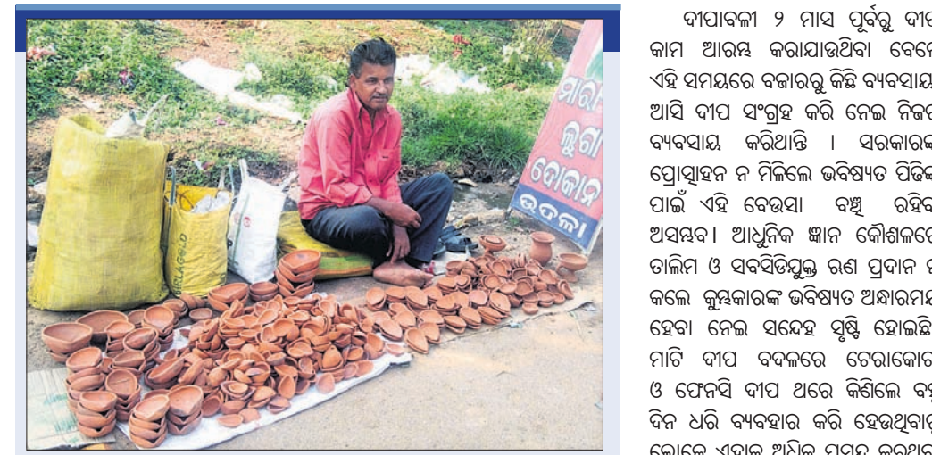
ଉଦ୍ୟାନ ବଜାରରେ ଜଣେ କୁମ୍ଭକାର ମାଟି ଦୀପ ବନ୍ଧି କରିବା ପାଇଁ ବସିଛନ୍ତି ।