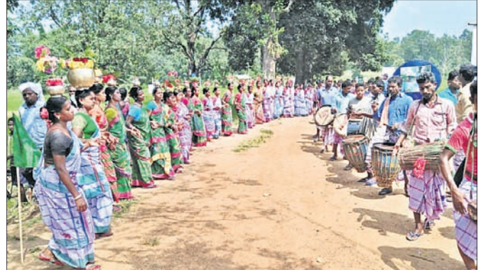
ଆଦିବାସୀ ମହିଳାମାନେ ମାଦଳା ଟାକେ ଟାକେ ନୃତ୍ୟ କରୁଛନ୍ତି।