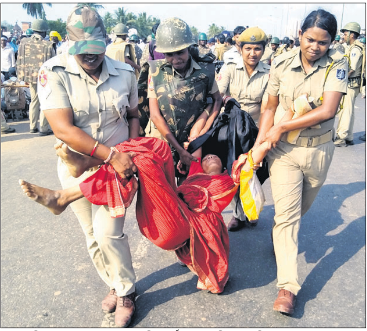
କଟକ ମହିଳା ଆନ୍ଦୋଳନକାରୀଙ୍କୁ ପୋଲିସ୍ କର୍ମଚାରୀ ତଳେ ନେଇଛନ୍ତି