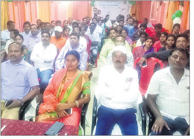
ଭିଡିଓ କନଫରେନ୍ସ୍ କାର୍ଯ୍ୟକ୍ରମରେ ଉପସ୍ଥିତ ଲୋକେ ।

ବଡ଼ସାହି, ୫.୧୧ (ସ.ପ୍ର.): ବଡ଼ସାହି ବ୍ଲକ୍ ସୋରିଷକୋଠା ବ୍ଲକ୍‌ବଳଙ୍କ ସରକାରୀ ଉଚ୍ଚ ବିଦ୍ୟାଳୟର ୧୯୭୫ ମସିହା ବ୍ୟାଚର ଛାତ୍ରଛାତ୍ରୀଙ୍କ ବନ୍ଧୁମିଳନ ଉତ୍ସବ ଅନୁଷ୍ଠିତ ହୋଇଯାଇଛି ।