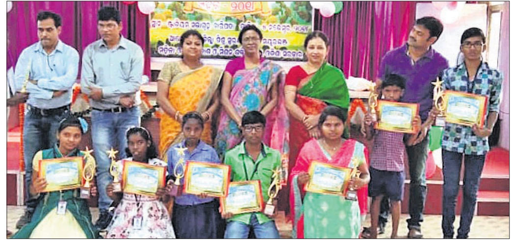
କୃତୀ ପ୍ରତିଯୋଗୀଙ୍କ ସହିତ ଅତିଥି ଓ ଅନ୍ୟମାନେ ।

ଦୀପାବଳୀରେ ମହାଲକ୍ଷ୍ମୀଙ୍କୁ ଆବାହନ ସହ ମାଟି ଦୀପ ଲାଗିବାର ନିଆରା ପରମ୍ପରା ରହିଛି ।