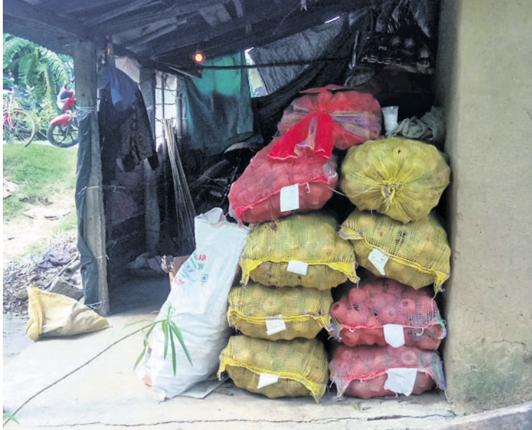
ବାସୁଦେବପୁର-ଭଦ୍ରକ ରାସ୍ତାରେ କିଆପଡ଼ା ଛକରେ ଏକ ଘରେ ବାଣ ରଖାଯାଇଛି। କୁହାଯାଇଛି। ଏ ସମ୍ପର୍କରେ ବାସୁଦେବପୁର ପଚାରିବାକୁ ତଦନ୍ତ କରି କାର୍ଯ୍ୟାନୁଷ୍ଠାନ ଥାନାଧିକାରୀ ଉପାଖିକର ନାୟକଙ୍କୁ ଗ୍ରହଣ କରାଯିବ ବୋଲି କହିଛନ୍ତି।

ଭକ୍ତ ନ୍ୟାୟାଳୟଙ୍କ କଟକଣା ସତ୍ତ୍ୱେ ବେଆଇନ ଭାବେ ରାସ୍ତାକଡ଼ରେ ଚାଲିଛି ବାଣ କାରଖାନା। ସ୍ଵଳ୍ପ ଦିବାଲୋକରେ ବାସୁଦେବପୁର-ଭଦ୍ରକ ରାସ୍ତାରେ କିଆପଡ଼ା ଛକରେ ବାଣ ତିଆରି ହେଉଛି। ଏଥିପାଇଁ କୌଣସି ସରକାରୀ ଲାଲସେବୁ ନାହିଁ କି ଅନୁମତିପାତ୍ର ଯନ୍ତ୍ର ମଧ୍ୟ ରଖାଯାଇ ନାହିଁ। କଞ୍ଚାମାଲ ଆଣି ବିପଜ୍ଜନକ ଭାବେ ଏଠାରେ ବାଣ ତିଆରି କରାଯାଉଛି। ଏହା ପାଖରେ ଦେବାଇୟ ଓ ଜନସଂସ୍କୃତି ରହିଥିଲେ ମଧ୍ୟ ଏଥିପ୍ରତି ନିନ୍ଦା ନାହିଁ। ସୂଚନା ଅନୁଯାୟୀ ତଥ୍ୟାଧିକାରୀ ଗ୍ରାମରେ ଜଣେ ବ୍ୟକ୍ତି ଦାୟିତ୍ୱ ଧରି ନିଜ ଘରେ ବାଣ ତିଆରି କରିଆସୁଛନ୍ତି। ଏଥିସହ କୋଲକାତା ଅଞ୍ଚଳକୁ ଲାଖିଆଳି ଟଙ୍କାର ବିକ୍ଷୋଭକ ପ୍ରଦାନ ଓ ବାଣ କିଣି ଆଣି ଘରେ ରଖି କାରବାର କରୁଛନ୍ତି। ଏ ନେଇ ସ୍ଥାନୀୟ ଅଞ୍ଚଳବାସୀ ବାରମ୍ବାର ଅଭିଯୋଗ କରିଆସୁଥିଲେ ମଧ୍ୟ ପ୍ରଶାସନ ପକ୍ଷରୁ କୌଣସି କାର୍ଯ୍ୟାନୁଷ୍ଠାନ ଗ୍ରହଣ କରାଯାଇ ନାହିଁ ବୋଲି