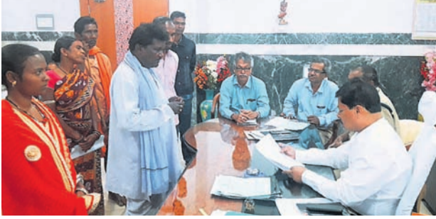
ଜିଲ୍ଲାପାଳଙ୍କୁ ମାଝିଗୁଡ଼ା ଗ୍ରାମବାସୀ ଅଭିଯୋଗ ଜଣାଇଛନ୍ତି।