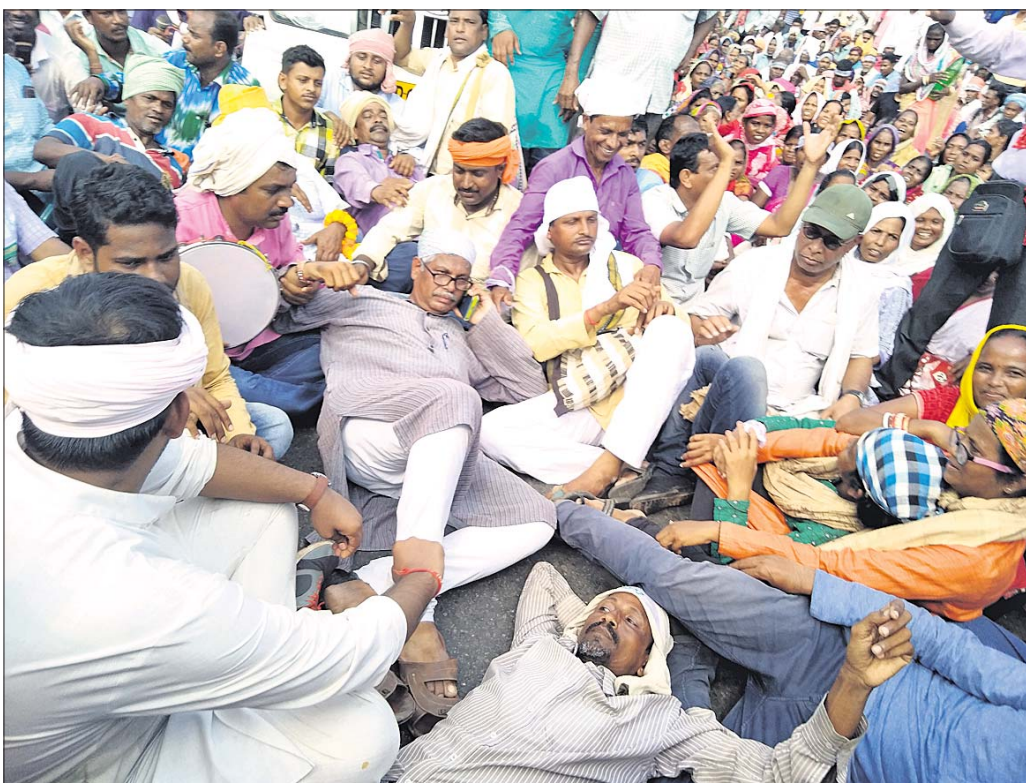
ହଂସପାଳଠାରେ ରାସ୍ତା ଉପରେ ଚାଷୀମାନେ ବିଶୋଭ କରୁଛନ୍ତି।

ପୋଲିସ୍ ଲଗାଇ ଦମନ କରିଥିବା ବେଳେ ଅନ୍ୟପଟେ ଚାଷୀମାନେ ମଧ୍ୟ ସରକାରଙ୍କୁ ଏହାର କଡ଼ା ଜବାବ ଦେବାକୁ ତେଡ଼ାବନ୍ଦୀ ଦେଇଛନ୍ତି। ଚାଷୀଙ୍କୁ ରାଜଧାନୀକୁ ପୁରାଇ ଦିଆଯାଇ ନ ଥିବାରୁ ମନ୍ତ୍ରୀ, ବିଧାୟକ ଏବଂ ରାଜନେତାଙ୍କୁ ଗାଁକୁ ପୁରାଇ ଦିଆଯିବ ନାହିଁ। ଗ୍ରାମାଞ୍ଚଳରେ ଏହି ଆନ୍ଦୋଳନକୁ ପୃଷ୍ଠା-୪