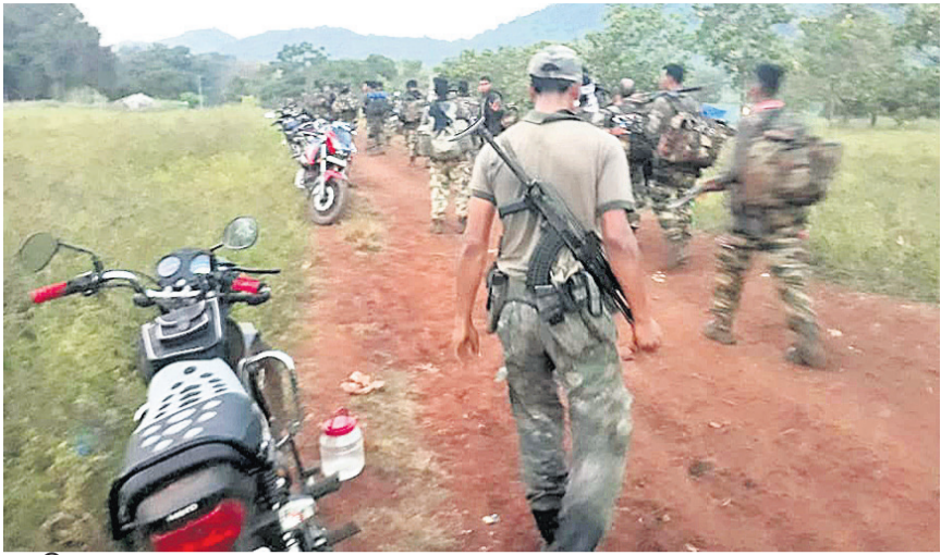
କୋହି ଅପରେଶନରେ ଚଳାଯାଉଥିବା ଯାନବାହାନମାନେ ।