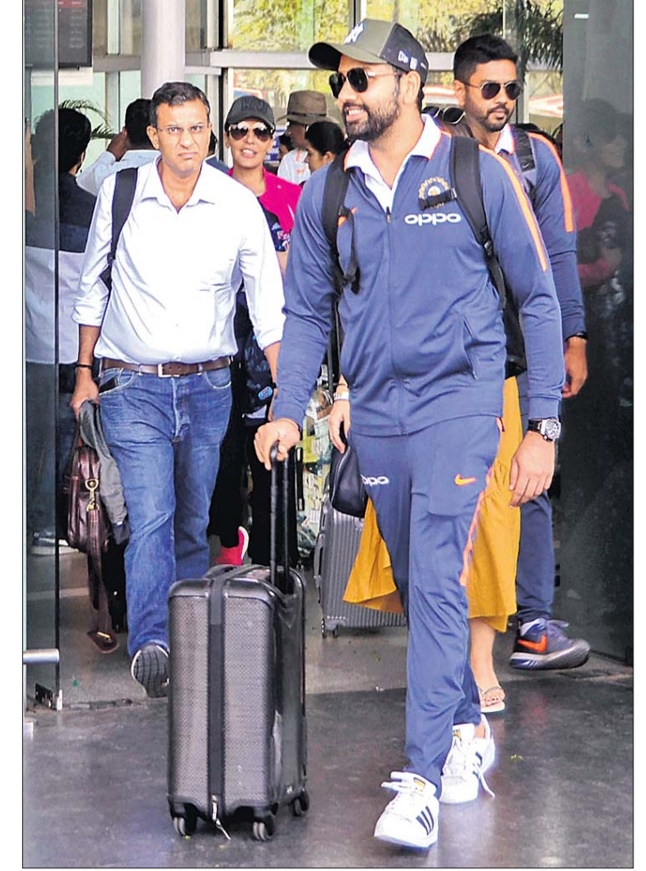
ଲକ୍ଷ୍ମୀରେ ପହଞ୍ଚିବା ପରେ ଅଧିନାୟକ ରୋହିତ ଶର୍ମା।

ଫ୍ରେଷ୍ଟଲାଇଭ ବିପକ୍ଷ ଫ୍ରେସ୍, ଦିନିକିଆ ସିରିଜରେ ବିଜୟ ହାସଲ କରିବା ପରେ ଭାରତ ଟି୨୦ ସିରିଜରେ ମଧ୍ୟ ବାକି ମାଟିର ଲକ୍ଷ୍ୟରେ ରହିଛି। ନବନିର୍ମିତ ସ୍ଥାନୀୟ ଏକନା ଆନ୍ତର୍ଜାତୀୟ ଷ୍ଟାଡିୟମରେ ଭାରତ ଓ ଭ୍ରମଣକାରୀ ଫ୍ରେଷ୍ଟଲାଇଭ ମଙ୍ଗଳବାର ଦିୱାନ୍ ୧୨୦ରେ ପୂର୍ଣ୍ଣପୂର୍ଣ୍ଣ ହେବେ। ପ୍ରଥମଥର ପାଇଁ ଆନ୍ତର୍ଜାତୀୟ କ୍ରିକେଟ ମ୍ୟାଚ୍ ଖେଳାଯିବ। ପ୍ରଥମ ଟି୨୦କୁ ଭାରତ ୫ ଉଇକେଟରେ ଅତି ସହଜରେ ବିଜୟ ହାସଲ କରିଥିଲା। ମଙ୍ଗଳବାର ମ୍ୟାଚ୍ ଜରିତେ ଭାରତ ୨-୦ରେ ଅଗ୍ରଣୀ ହେବା ସହ ଆଗ୍ରା ସିରିଜ ହାତେଇବ। ଭାରତ ଏପର୍ଯ୍ୟନ୍ତ ୩ଟି ଯାକ ଫର୍ମାଟରେ ଆଧିପତ୍ୟ ବିସ୍ତାର କରି ଖେଳିଛି। ପ୍ରଥମ ମ୍ୟାଚ୍ ବିଜୟ ପୂର୍ବରୁ ଭାରତ ଫ୍ରେଷ୍ଟଲାଇଭଠାରୁ କ୍ରମାଗତ ୪ଟି ଟି୨୦ରେ ପରାସ୍ତ ହୋଇଥିଲା। ତେବେ ଏହି ପରାଜୟ ଧାରାକୁ ଭାରତ ରୋକିବାରେ ସକ୍ଷମ ହୋଇଛି। ଏହାପୂର୍ବରୁ ୨୦୧୪ ମାର୍ଚ୍ଚ ୧୩ ତାରିଖରେ ବାଂଲାଦେଶରେ ଅନୁଷ୍ଠିତ ଟି୨୦ ବିଶ୍ୱକପରେ ଭାରତ ଫ୍ରେଷ୍ଟଲାଇଭକୁ ହରାଇ ଥିଲା। ୨୦୦୯ରୁ ୨୦୧୭ ମଧ୍ୟରେ