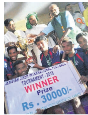
ବିଜୟୀ ବକ୍ ଅତିଥିଙ୍କ ଠାରୁ ଟ୍ରଫି ଓ ଚେକ୍ ଗ୍ରହଣ କରୁଛନ୍ତି।