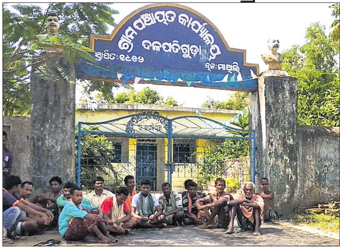
ପାଟକରେ ତାଲାପକାଇ ଧାରଣାରେ ବସିଛନ୍ତି ଗ୍ରାମବାସୀ ।

ଧାନମଣ୍ଡିର ପୁରୁଣା ପାଇଁ ମଞ୍ଜୁର ହୋଇଛି ଆରମ୍ଭପର୍ଯ୍ୟନ୍ତ ଗୋଦାମ ଗୃହ । ପଞ୍ଚାୟତ ସଦସ୍ୟେ ନିର୍ମାଣ କରିବାକୁ ପ୍ରସ୍ତାବ ଆସିଛି । ମାତ୍ର ଏହି ଗୋଦାମ ଗୃହକୁ ଅନ୍ୟତ୍ର କରିବାକୁ ଯୋଜନା କରାଯାଇଛି । ଜାଗା ମଧ୍ୟ ଚିହ୍ନଟ ହୋଇଛି । ଅନ୍ୟତ୍ର ନିର୍ମାଣ କରାଯାଉଥିବାବେଳେ ଏହାର ପ୍ରତିବାଦ କରି ମାଲକାନଗିରି ଜିଲ୍ଲା ମାଥିଲି ବ୍ଲକ୍ ଅନ୍ତର୍ଗତ ଦକ୍ଷିଣପଡ଼ିଆ ପଞ୍ଚାୟତ କାର୍ଯ୍ୟାଳୟରେ ସୋମବାର ଗ୍ରାମବାସୀ ତାଲା ପକାଇଛନ୍ତି । ସମାଧାନ ନ ହେବା ପର୍ଯ୍ୟନ୍ତ ପଞ୍ଚାୟତ କାର୍ଯ୍ୟାଳୟରୁ ତାଲା ନ ଖୋଲିବେନି ବୋଲି ସେମାନେ ନିଷ୍ପତ୍ତି ନେଇଛନ୍ତି । ସୋମବାର ୪ ଘଣ୍ଟା ପର୍ଯ୍ୟନ୍ତ ପଞ୍ଚାୟତ ଫାଟକକୁ ତାଲା ପକାଇବା ସହିତ ଫାଟକ ସମ୍ମୁଖରେ ଗ୍ରାମବାସୀ ଧାରଣାରେ ବସିଥିଲେ । ଗୋଦାମ ଗୃହକୁ ଅନ୍ୟତ୍ର ନିର୍ମାଣ ନେଇ ହେଉଥିବା ମତ୍ତୁଆକୁ ପ୍ରତିବାଦ କରିଥିଲେ । ଦକ୍ଷିଣପଡ଼ିଆ ପଞ୍ଚାୟତ ସଦସ୍ୟେ ପ୍ରତିବର୍ଷ ଧାନମଣ୍ଡି ଆରମ୍ଭ କରାଯାଇଛି । ମାତ୍ର ଗୋଦାମ ନିର୍ମାଣ ପାଇଁ ଆବଶ୍ୟକ ଧାନ ରଖିବା ପାଇଁ ଆବଶ୍ୟକ ଗୋଦାମ ଗୃହ ନାହିଁ । ଶୀତ କାଳରେ ଧାନ ରଖି ଗୋଦାମରେ ରାତି ଉତ୍ତାପରେ କରି ରଖିବାକୁ । ଦକ୍ଷିଣପଡ଼ିଆ ଧାନମଣ୍ଡିରେ ପଞ୍ଚାୟତ ଅଧୀନରେ ଥିବା ସମସ୍ତ ଗୋଦାମ ସାମିଲ କରାଯାଇଛି । ପ୍ରତିବର୍ଷ ପଞ୍ଚାୟତ