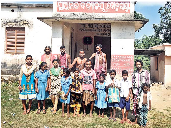
ବିଦ୍ୟାଳୟ ପରିସରରେ ଅପେକ୍ଷାରତ ଛାତ୍ରାଛାତ୍ରୀ ଓ ଗ୍ରାମବାସୀ ।

ପ୍ରଧାନ ଶିକ୍ଷକ ନିୟମିତ ଆସୁ ନ ଥିବାରୁ ଚନ୍ଦ୍ରପୁର ବ୍ଲକର ଡାକ୍ତରଖୋରଡ଼ା ପଞ୍ଚାୟତ ଅଧୀନ ବୋଡ଼ଗଣା ପ୍ରାଥମିକ ବିଦ୍ୟାଳୟରେ ଯୋଗଦାନ ତାଲା ଝୁଲୁଛି ।