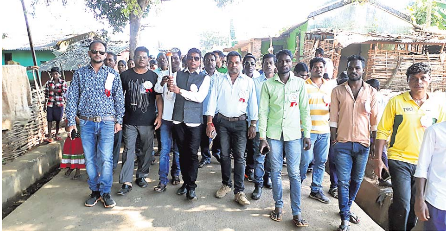
ଦଶମହସ୍ତରୁ ରୁକ୍ମ ନିଶାଣୀ ମୁଖ୍ୟତଃ ମଙ୍ଗଳ ଶୋଭାଯାତ୍ରା ।