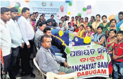
ଉଦ୍ଘାଟନ ଅଧିକାରୀ, ଲୋକ ପ୍ରତିନିଧି ଓ ଅନ୍ୟମାନେ ।