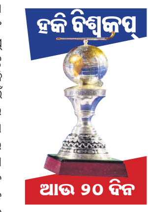
ଆଉ ୨୦ ଦିନ