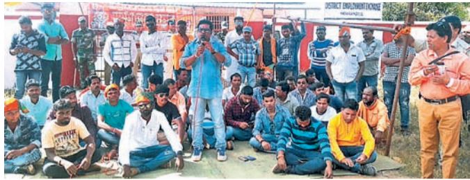
ଭାଜପା ଜିଲ୍ଲା ଯୁବମୋର୍ଚ୍ଚାର କର୍ମକର୍ମୀମାନେ ଧାରଣାରେ ବସିଛନ୍ତି।

ମଧ୍ୟ ବିଭାଗ ପକ୍ଷରୁ କରାଯାଇ ଯୁବମୋର୍ଚ୍ଚା ଦାବନ ଖଟିବାକୁ ବାହାର ପାରିଲେ ନାହିଁ । ଚଳିତ ବର୍ଷ ୧୮ ଶହ ଜଣ ନାମ ପଞ୍ଜିକରଣ କରିଛନ୍ତି । ସେମାନଙ୍କ ମଧ୍ୟରୁ ୧୦ ଜଣ ମଧ୍ୟ ଚାକିରି ପାଇ ପାରିଲେ ନାହିଁ । ଜିଲ୍ଲା ଭିତ୍ତିକ ନିୟୁକ୍ତି ସୁଯୋଗ ମିଳୁନାହିଁ । ଜିଲ୍ଲାରୁ ୧୩ ହଜାର ବେକାର ଯୁବକ