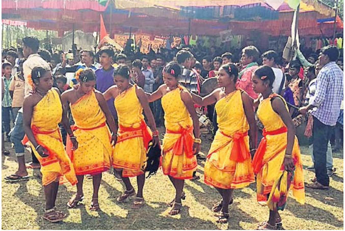
ପରବ ମହୋତ୍ସବ: ସେମିଲିଗୁଡ଼ାରେ ଡେମଫା ନୃତ୍ୟ ।