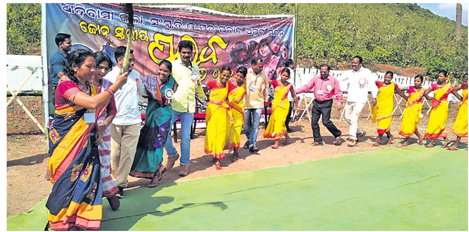
ନନ୍ଦପୁରରେ ଅନୁଷ୍ଠିତ ଆଦିବାସୀ ନୃତ୍ୟ ।