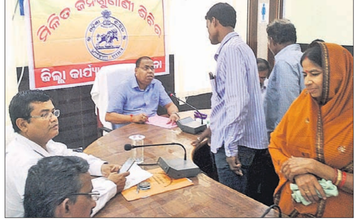
ମିଳିତ ଜନଶୁଣାଣି ଶିବିରରେ ଜିଲ୍ଲାପାଳ ଅଭିଯୋଗଗୁଡ଼ିକର ଶୁଣାଣି କରୁଛନ୍ତି ।

ଜିଲ୍ଲାପାଳଙ୍କ କାର୍ଯ୍ୟାଳୟରେ ସୋମବାର ମିଳିତ ଜନଶୁଣାଣି ଶିବିର ଅନୁଷ୍ଠିତ ହୋଇଯାଇଛି । ଏଥିରେ ମୋଟ ୪୩୦ ଅଭିଯୋଗର ଶୁଣାଣି ହୋଇଥିଲା ।