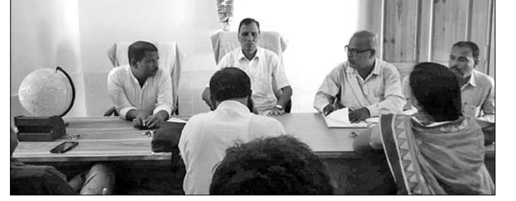
ବୈଠକରେ ଭେଦରେ ଲୋକ ପ୍ରତିନିଧି ଓ ଅନ୍ୟମାନେ।

ରାଜନଗର ବ୍ଲକ୍ ରାଜନଗର ଗ୍ରାମକୁ ପ୍ରଧାନମନ୍ତ୍ରୀ ଆଦର୍ଶ ଗ୍ରାମ ଭାବେ ଘୋଷଣା କରାଯିବା ପରେ ୪୦ ଲକ୍ଷ ଟଙ୍କା ବ୍ୟୟ ବରାଦ୍ଦରେ ୭ଟି ପ୍ରକଳ୍ପ ନିର୍ମାଣ କରାଯିବା ପାଇଁ ନିଷ୍ପତ୍ତି ଦିଆଯାଇଛି।