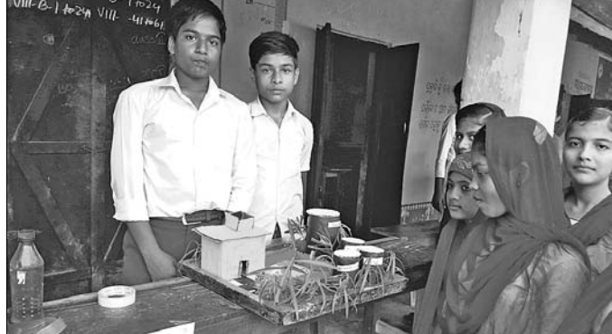
ବିଜ୍ଞାନମେଳାରେ ଛାତ୍ରଛାତ୍ରୀମାନେ ପ୍ରକଳ୍ପ ପ୍ରଦର୍ଶନ କରୁଛନ୍ତି।

ରାଜନଗର ବ୍ଲକ୍ ରାଜନଗର ଗ୍ରାମକୁ ପ୍ରଧାନମନ୍ତ୍ରୀ ଆଦର୍ଶ ଗ୍ରାମ ଭାବେ ଘୋଷଣା କରାଯିବା ପରେ ୪୦ ଲକ୍ଷ ଟଙ୍କା ବ୍ୟୟ ବରାଦ୍ଦରେ ୭ଟି ପ୍ରକଳ୍ପ ନିର୍ମାଣ କରାଯିବା ପାଇଁ ନିଷ୍ପତ୍ତି ଦିଆଯାଇଥିଲା। ରାଜନଗର ଦୁର୍ଗା ମଠପଠାକୁ ଜଗନ୍ନାଥ ଅନୁଷ୍ଠିତ କାର୍ଯ୍ୟାଳୟରେ ସାମାଜିକ ଅନୁଷ୍ଠିତ କାର୍ଯ୍ୟାଳୟରେ ଏହି ନିଷ୍ପତ୍ତି ଗ୍ରହଣ କରାଯାଇଛି।