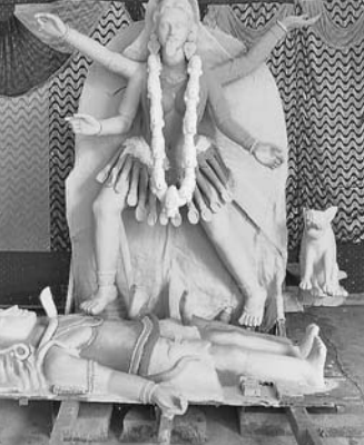
ଅକାବାଳ ମଣ୍ଡପରେ ଶ୍ୟାମାକାଳୀଙ୍କ ମୂର୍ତ୍ତୀ ପୂଜା।