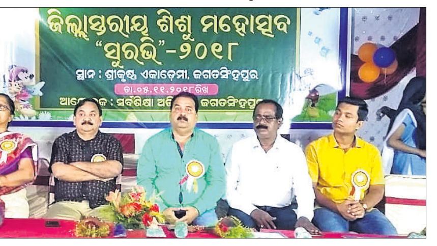
ଜିଲାସ୍ତରୀୟ ଶିଶୁ ମହୋତ୍ସବ ସୁରଭିରେ ମହାସଭା ଅତିଥି ।