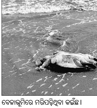
ବେକାଭୁମିରେ ମରିପଡ଼ିଥିବା କଳିଙ୍ଗ।

ମହାନାକପଡ଼ା ବ୍ଲକ୍ ଗଞ୍ଜାଠିକୀ ଆକ୍ରମଣ ଅଭିଯୋଗକୁ ଅଭିଭବିତ କରି କଳିଙ୍ଗମାନେ ଅଣାଦାନ ଲାଗି ସୁରକ୍ଷିତ ମନେକରନ୍ତି। ପ୍ରତିବର୍ଷ ଅକ୍ଟୋବର ଓ ନଭେମ୍ବର ଏଠାକାର ଜଳବାୟୁ ସେମାନଙ୍କ ପ୍ରକୃତ ଲାଗି ସୁରକ୍ଷିତ ଥିବାରୁ ଲକ୍ଷ ଲକ୍ଷ ଅଭିଭବିତ ହେଉଛି।