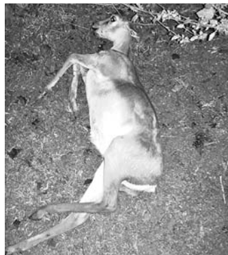
କୃଷ୍ଣସାର ମୃଗଦେହ ।

ବୁଢ଼ୁଡ଼ା ଥାନା କଳମ ଛକକୁ ଅନ୍ତରାପଦା ରାସ୍ତାର ଦୁର୍ଘଟଣାରେ ମୃତ୍ୟୁର ଚରଣ ଉପରେ ରହିଥିବା କୃଷ୍ଣସାର ମୃଗର ମୃତ୍ୟୁ ହୋଇଛି ।