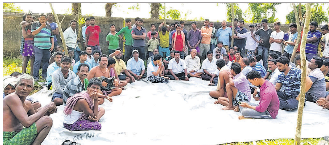
ଡିଷ୍ଟରୀ ପ୍ରାଥମିକ ସ୍ୱାସ୍ଥ୍ୟକେନ୍ଦ୍ରରେ ଗ୍ଲାମାୟ ଲୋକେ ଧାରଣା ଦେଇଛନ୍ତି ।

ମହାକାଳପଡ଼ା, ୫୧୧୧(ଡି.ଏନ୍.ଏ.): ରାଜ୍ୟ ସରକାର ରୋଗୀଙ୍କୁ ସ୍ୱାସ୍ଥ୍ୟସେବା ଯୋଗାଇ ଦେବା ପାଇଁ ନିରାମୟ ଯୋଜନାରେ ବିଭିନ୍ନ ସ୍ୱାସ୍ଥ୍ୟକେନ୍ଦ୍ରଗୁଡ଼ିକରେ ଔଷଧ ଯୋଗାଇ ଦେଉଥିବା ବେଳେ ଅନେକ ଚିକିତ୍ସାଳୟରେ ଏସବୁ ଔଷଧ ନ ଲାଭି ରୋଗୀମାନେ ଉଠେଇ ପାରୁନାହାନ୍ତି।