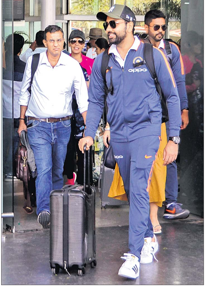
ଲକ୍ଷ୍ଣୋରେ ପହଞ୍ଚିବା ପରେ ଅଧିନାୟକ ବିରାଟ ଶର୍ମା ।

ଫ୍ରେଣ୍ଡ୍‌ସ୍‌ ଷ୍ଟାଡ଼ିୟମ ପ୍ରଥମ ଟେଷ୍ଟ, ଦିନିଆଁ ସିରିଜରେ ବିଜୟ ହାସଲ କରିବା ପରେ ଭାରତ ଟି-୨୦ ସିରିଜରେ ମଧ୍ୟ ବାଜି ମାରିବା ଲକ୍ଷ୍ୟରେ ରହିଛି ।