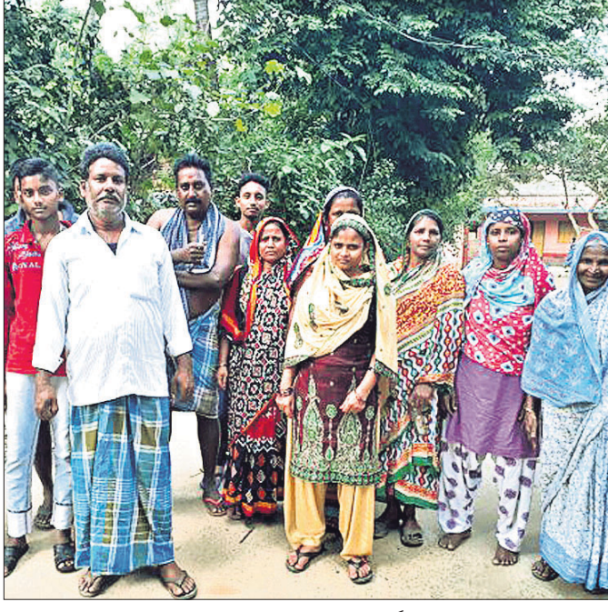
ସୁସ୍ଥିତ ବସ୍ତିର ମହକ ଓ ପୁରୁଷମାନେ ପାନୀୟ ଜଳ ସମ୍ପର୍କରେ ପ୍ରତିବାଦ ଜଣାଇଛନ୍ତି ।

ବିଚିତ୍ର କ୍ଷତିକାରୀ ପଞ୍ଚାୟତ ଅଧୀନ ୯୯୩ ଓଡିଶା ଉପସଭା ସାହିରେ ୨ ମାସ ହେଲା ପାନୀୟଜଳ ସମସ୍ୟା ଦେଖାଦେଇଛି । ଏ ସମ୍ପର୍କରେ ଗ୍ରାମୀୟ ଲୋକେ ବିଭାଗୀୟ ଅଧିକାରୀ ଓ ସରପଞ୍ଚଙ୍କୁ ଅଗତ କରାଇଥିଲେ ମଧ୍ୟ କୌଣସି ସୁଚଳ ନିଲିନାହିଁ । ସୂଚନା ଅନୁଯାୟୀ ଏହି ବସ୍ତୁରେ ୨୦୦ଟି ଖଣ୍ଡ ଲୋକ ବସବାସ କରୁଛନ୍ତି । ଏହି ବସ୍ତୁରୁ ପାନୀୟଜଳ ଯୋଗାଣ ପାଇଁ ହାଜିପୁର ପଞ୍ଚାୟତ କାର୍ଯ୍ୟାଳୟଠାରେ ଥିବା ଉତ୍ତରହେଡ଼ିପାଣିଶାଳକୁ ପାଇପ ସଂଯୋଗ କରାଯାଇଛି । ନିୟମିତ ଭାବେ ଲୋକଙ୍କୁ ପାନୀୟଜଳ ଯୋଗାଇଦେବା ପାଇଁ ଜଣେ କର୍ମଚାରୀଙ୍କୁ ନିଯୁକ୍ତ କରାଯାଇଛି । ସେ ପ୍ରତି ମାସରେ ଦରମା ନେଉଛନ୍ତି । ଜଳଯୋଗାଣ କ୍ଷେତ୍ରରେ ଯେଉଁ କୌଣସି ସଂହାର ଦ୍ରୁତି ଦେଖା ନ ଦିଏ ସେଥିପାଇଁ ଚୁରକ ଗଣମତ ଓ ଆବେଦନ କାର୍ଯ୍ୟକ୍ରମ ଗ୍ରହଣ କରିବାକୁ ସେମାନେ ଦାବି କରିଛନ୍ତି ।