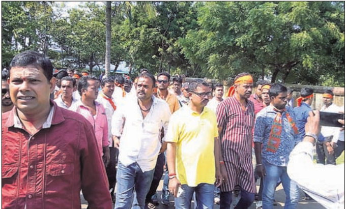
ସମ୍ପଦକ ନେତୃତ୍ୱରେ ଭାଙ୍ଗପାର କର୍ମୀମାନେ ବିକ୍ଷୋଭ ପ୍ରଦର୍ଶନ କରୁଛନ୍ତି ।