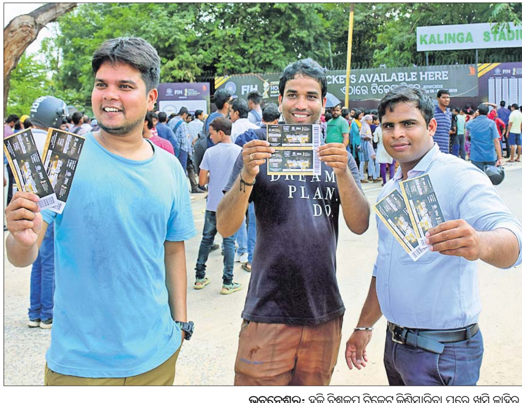
ଭୁବନେଶ୍ୱର: ହକି ବିଶ୍ୱକପ ଟିକେଟ୍ କିଣିପାରିବା ପରେ ଖୁସି ହାସିଲ କରୁଛନ୍ତି ଟିକେଟ୍ ଖେଳପ୍ରେମୀ । କାରଖାନା ଆଗରେ ଖେଳପ୍ରେମୀଙ୍କ ଭିଡ଼ ।

ହେବ । ଏହାର ସମ୍ପର୍କ ଉପାଦାନରେ ହେଉଛି ମହିଳା ବିଶ୍ୱକପ ଓ ଯୁବକ ବିଶ୍ୱକପ । ମହିଳା ବିଶ୍ୱକପରେ ଆୟନାଓ ଫାଇନାଲକୁ ଉପସ୍ଥାପନ କରିଥିଲେ ।