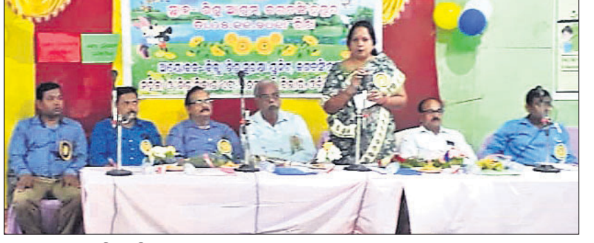
ମହୋତ୍ସବରେ ଉପସ୍ଥିତ ଅତିଥି ।