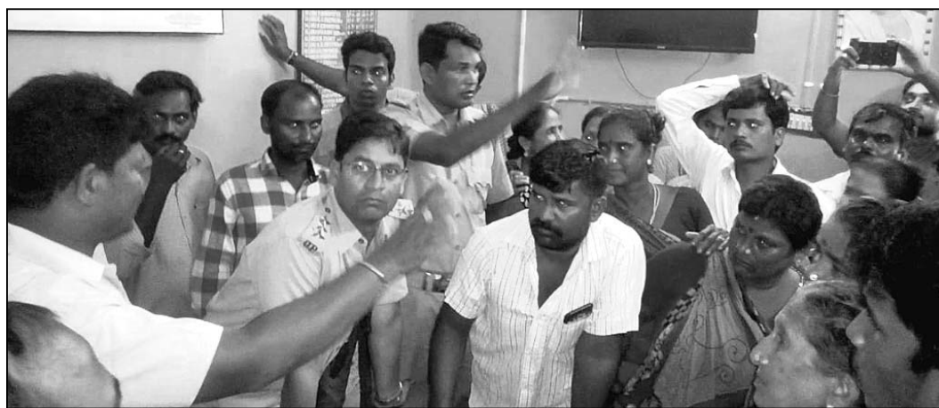
ରାଶନକାର୍ଡରୁ ବଞ୍ଚିତ ହିତାଧିକାରୀଙ୍କ ଏନ୍ଏସି ଘେରାଉ କରୁଛନ୍ତି ।

ରାଜ୍ୟ ଖାଦ୍ୟ ସୁରକ୍ଷା ଯୋଜନାରେ ରାଶନକାର୍ଡ ପାଇବାକୁ ବଞ୍ଚିତ ହୋଇଥିବା ଲୋକେ ଯୋଗଦାନ କରିବାକୁ ଘେରାଉ କରିଥିଲେ ।