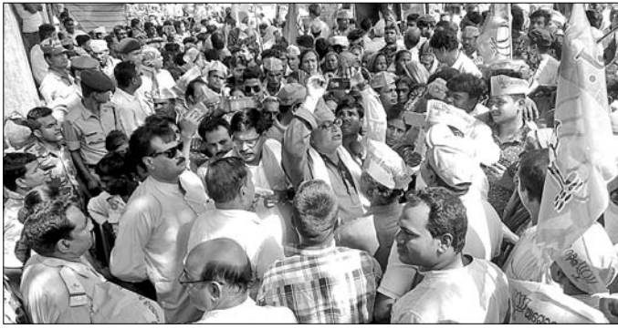
ବ୍ଲକ୍ ଯେରାଭରେ ସାମିଲ ଥିବା ଭାଜପା ନେତା ଓ କର୍ମୀମାନେ।

ଆକର୍ଷଣ ମଧ୍ୟ କରିଥିଲେ। ଏ ସମ୍ପର୍କରେ ଛଡ଼ା ସେକ୍ଟର ଅଧିକାରୀ ସାଙ୍ଗରେ ଖୋଜିବାର ମହାପାତ୍ରଙ୍କୁ ପଚାରିବାରେ ଉକ୍ତ ଅଞ୍ଚଳରେ ସୌଭାଗ୍ୟ ଯୋଜନାରେ ବିଦ୍ୟୁତ୍ କଲିବା ନିମନ୍ତେ ଭୁବନେଶ୍ୱରସ୍ଥିତ ଏକ ଠିକା ସଂସ୍ଥାକୁ ଦାୟିତ୍ୱ ଦିଆଯାଇଛି। ଉପକୋଣାକୁ ବିଦ୍ୟୁତ୍ ଉପକରଣ ଓ ଖୁଷ୍ଟ ଯୋଗାଇବା ପରେ ବିଦ୍ୟୁତ୍ ବିଭାଗକୁ ଦାୟିତ୍ୱ ହସ୍ତାନ୍ତର କରିବାକୁ ଠିକା ସଂସ୍ଥା ସହ ରୁଚିନୀ ଯୋଗାଇଛି। ଯଦି ଏହା ସତ୍ୟ ହୁଏ ତେବେ ଫାର୍ମ ହାଉସ୍‌କୁ ଯୋଗାଇ ଦିଆଯାଇଥିବା ଖୁଷ୍ଟ ସମ୍ପର୍କରେ ଅଭିଯୋଗ ମିଳିଛି।