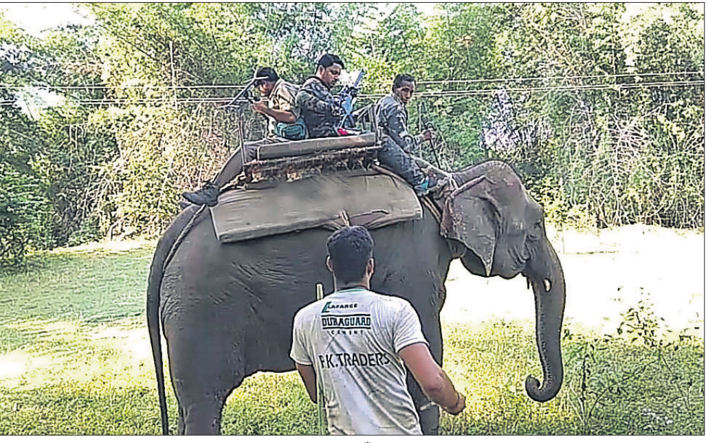
ହାତୀ ଯୋଗାଣ ପିଠିରେ ବସି ବିଶେଷଜ୍ଞମାନେ ସୁନ୍ଦରୀକୁ ଗ୍ରାହଣକରି ପାଇଁ ଯାଉଛନ୍ତି ।