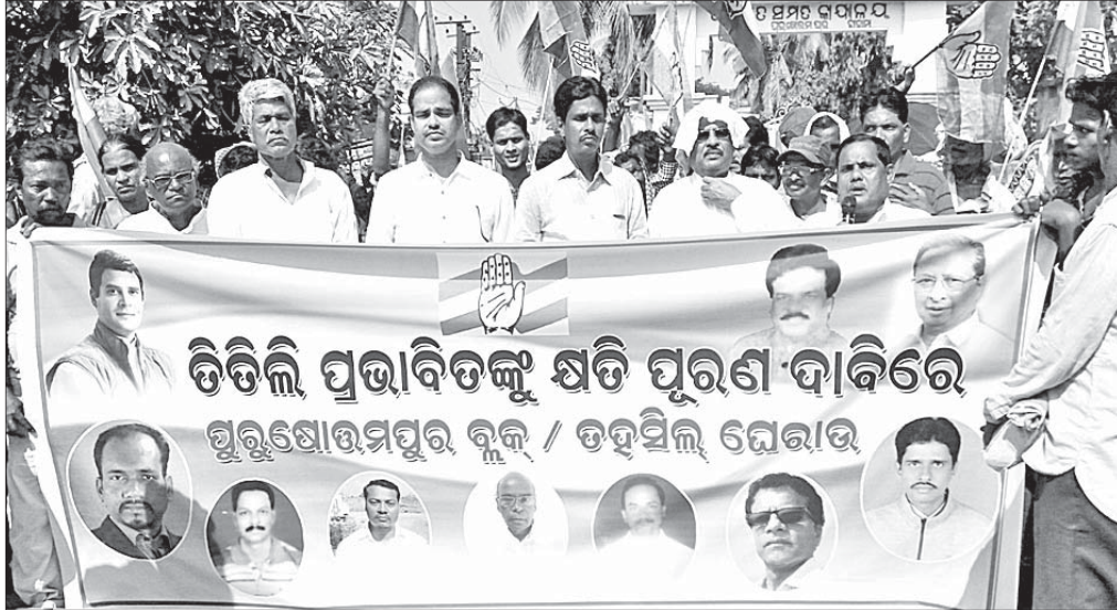
ବୁଦ୍ଧ ସମ୍ମୁଖରେ ପ୍ରତିବାଦ ସଭା କରାଯାଇଛି।

ପୁରୁଷୋତ୍ତମପୁର ବୁଦ୍ଧ ଏସଂସଦରେ ତିତିଲି ଓ ପରବର୍ତ୍ତୀ ବନ୍ୟାରେ କ୍ଷତିଗ୍ରସ୍ତଙ୍କୁ ସହାୟତା ପ୍ରଦାନ ଦାବି ନେଇ ମଙ୍ଗଳବାର କଂଗ୍ରେସ ପକ୍ଷରୁ ବୁଦ୍ଧ ଘେରାଉ କରାଯାଇଥିଲା। ଏଥିରେ ବୁଦ୍ଧ ପ୍ରଶାସନ କର୍ତ୍ତାପକ୍ଷରେ ରାଜ୍ୟପାଳଙ୍କ ଉଦ୍ଦେଶ୍ୟରେ ଏକ ସ୍ମାରକପତ୍ର ପ୍ରଦାନ କରାଯାଇଛି।