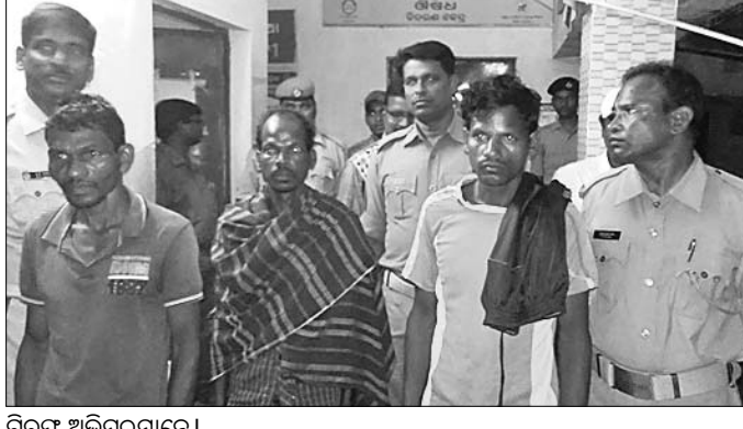
ଗିରଫ ଅଭିଯୁକ୍ତମାନେ ।

ପୂର୍ବରୁ ଜଣ ହୋଇଥିବା ବେଳେ ପାଖ ଗ୍ରାମରେ ଜଣେ ଚୂର୍ଣ୍ଣିଆଙ୍କ ପାଖକୁ ଯାଇଥିଲେ । ଘରେ ଚୂର୍ଣ୍ଣିଆ ପରେ ମଧ୍ୟ ଜଣେ ପୋଲିସ୍ ଯାଇବା ସାମାଜିକ ଓ ଖାତାକୁ ଗିରଫ କରିଛି ।