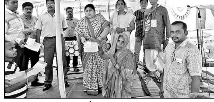
ବିଧାୟିକା ହିତାଧିକାରୀଙ୍କୁ ରାଶନ କାର୍ଡ ପ୍ରଦାନ କରୁଛନ୍ତି ।