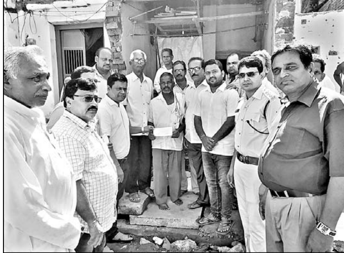
୨ ଲକ୍ଷ ଟଙ୍କାର ସହାୟତା ବଂଶଧରକୁ ପ୍ରଦାନ କରାଯାଇଛି ।

ହିଞ୍ଜିଳିକାନ୍ତ ଜଗନ୍ନାଥପାର୍ବତୀ ଜଣେ ଏମ୍.ଏସ୍.ଇ. ସ୍ତ୍ରୀ ଉଦ୍ଦିଷ୍ଟ ରେଳ ଭୁବନେଶ୍ୱରରେ ମୃତ୍ୟୁ ହୋଇଥିଲା ।