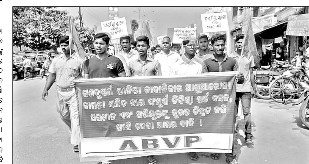
ଏକିଭିପି ପକ୍ଷରୁ ଶୋଭାଯାତ୍ରା ।

ପୋଲସରା ଥାନା ଅଞ୍ଚଳରେ ଘଟିଥିବା ନାବାଳିକା ଗଣବଳାକ୍ରାନ୍ତ ଘଟଣାକୁ ୬ ଦିନ ବିତିଛି । ବର୍ତ୍ତମାନ ସୁଦ୍ଧା ଅଭିଯୁକ୍ତଙ୍କୁ ଗିରଫ କରାଯାଇ ନ ଥିବା ପ୍ରତିବାଦରେ ଅଭିଯୁକ୍ତଙ୍କୁ ଗିରଫ ଦାବିରେ ଏକିଭିପିର ବିକ୍ଷୋଭ କରାଯାଇଛି ।