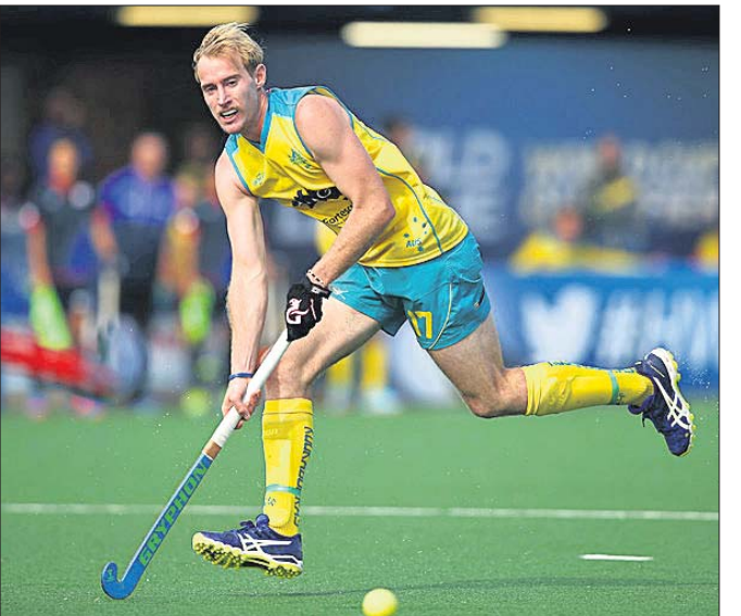
ଅଧିନାୟକ ଆରନ ଜେଲିସ୍ ।

ଅଧର୍ମାଣ୍ଡ, ଲଂଲଣ ଏବଂ ଗାଜନୀ ଲଘୁଆ ଦଳ । ତେଣୁ କାହାକୁ ହେଉ ମନେ କରାଯାଇ ପାରିବ ନାହିଁ । ଆଗାମୀ ବିଶ୍ଵକପ ସବୁ ଦଳ ପାଇଁ କଷ୍ଟସାଧ ହେବ ।