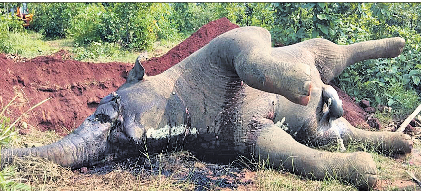
ମୃତ ଦନ୍ତା ହାତୀ ।

ପାଲଲହଡ଼ା, ୯।୧୧(ଡି.ଏନ.ଏ.) ■ ହାତୀର ଗଳିତ ମୃତଦେହ ଉଦ୍ଧାର ■ ବିଦ୍ୟୁତ୍ ଫାଶରେ ମୃତ୍ୟୁ ସନ୍ଦେହ ■ ୨୫ ଦିନରେ ମଲେଣି ୨ ହାତୀ ଦେବଗଡ଼ ବନଖଣ୍ଡ ଅନ୍ତର୍ଗତ ଖମାର ବନାଞ୍ଚଳ ପାଉଁଶିଆ ବତରୁଣ ଜଙ୍ଗଲରୁ ଶୁକ୍ରବାର ଏକ ଦନ୍ତା ହାତୀର ଅର୍ଦ୍ଧଗଳିତ ମୃତଦେହ ଉଦ୍ଧାର କରାଯାଇଛି । କେହି ଦୁର୍ଭର ହାତୀ ଶିକାର କରି ଦୁଇଟି ଯାକ ଦାନ୍ତ କାଟି ନେଇଛନ୍ତି । ଖବରପାଇ ପାଲଲହଡ଼ା ଓ ଖମାର ବନଖଣ୍ଡ ଅଧିକାରୀ ଘଟଣାସ୍ଥଳରେ ପହଞ୍ଚି ତଦତ୍ତ ଆରମ୍ଭ କରିଛନ୍ତି । ବିଦ୍ୟୁତ୍ ଫାଶରେ ପଡି ହାତୀଟିର ମୃତ୍ୟୁ ଘଟିଥିବା ବିଭାଗ ପ୍ରାଥମିକ ତଦନ୍ତରୁ ଜାଣିବାକୁ ପାରିଲେ । ବିଭାଗର ସୂଚନା ମୁତାବକ, ଉକ୍ତ ଜଙ୍ଗଲରେ ଦନ୍ତାର ମୃତଦେହ ପଡିଥିବା ଖବର ମିଳିବା ପରେ ଦେବଗଡ଼ ଡିଏଫ୍ଓ କାରିକ ସାମନ୍ତରାୟ ଓ ଆଞ୍ଚଳିକ ବନ ସଂରକ୍ଷକ ଲିଙ୍ଗରାଜ ହୋତା ସେଠାରେ ପହଞ୍ଚିଥିଲେ । ହାତୀଟିର ଦାନ୍ତ ଦୁଇଟି କେହି କାଟି ନେଇଥିବା ଦେଖିବାକୁ ମିଳିଥିଲା । ଦନ୍ତାର ବୟସ ୨୦ରୁ ୨୫ ବର୍ଷ ହେବ ବୋଲି ଜଣାପଡିଛି । ଡିଏଫ୍ଓ ସାମନ୍ତରାୟ