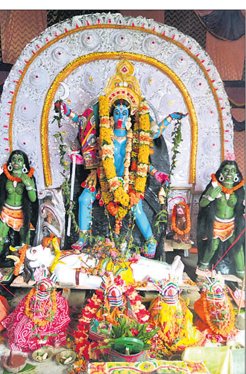
ଶ୍ୟାମାକାଳୀଙ୍କ ମୁଖ୍ୟ ମୂର୍ତ୍ତି ମଣ୍ଡପରେ ପୂଜା ପାଉଛି ।