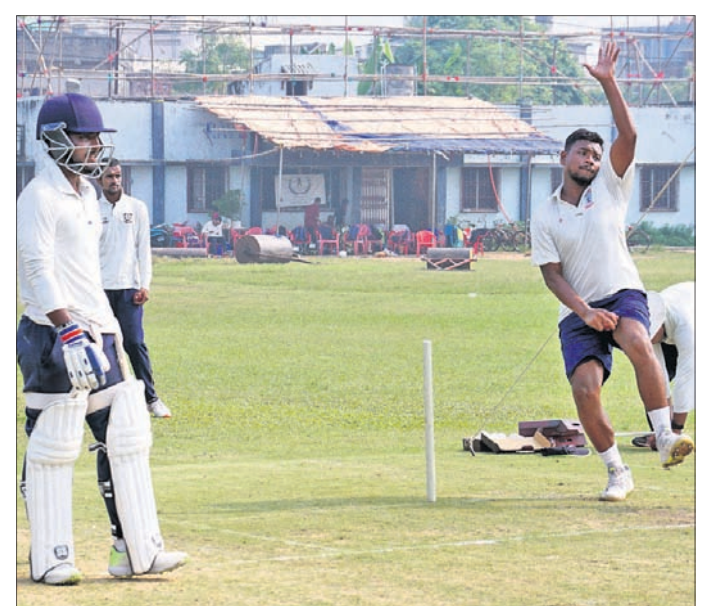
ଅଭ୍ୟାସ ଅବସରରେ ଓଡ଼ିଶା ଦଳର ଖେଳାଳିମାନେ।