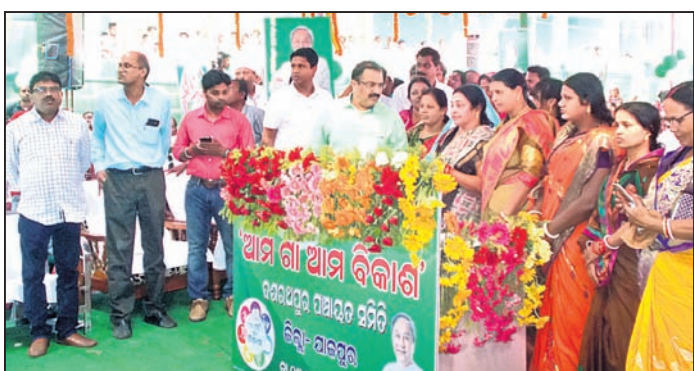
ସାଇ ପ୍ୟାଲେସ୍‌ଠାରେ ଆୟୋଜିତ ଆମ ଗାଁ ଆମ ବିକାଶ କାର୍ଯ୍ୟକ୍ରମ ।