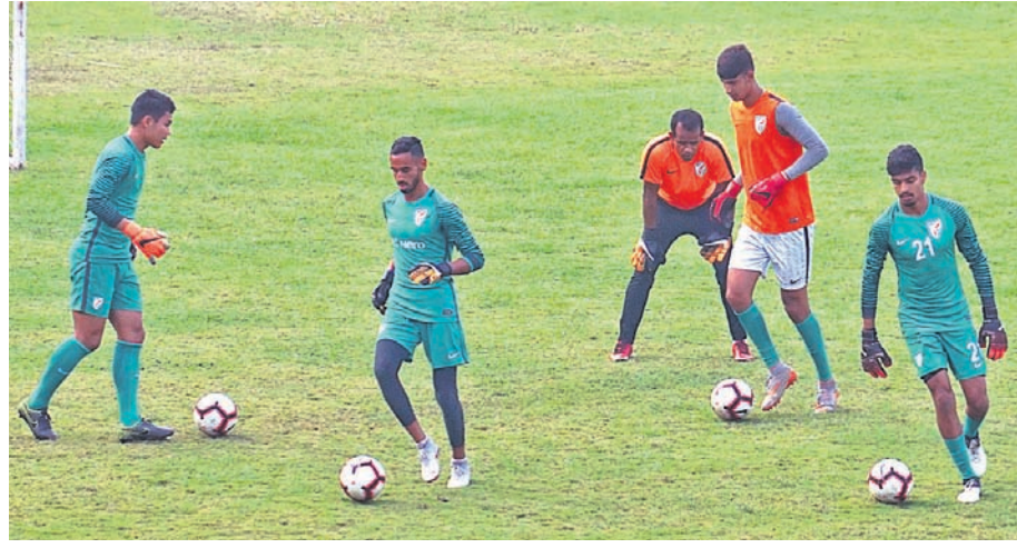
ଆଇ-ଲିଗ୍ ଫୁଟ୍‌ବଲ ମ୍ୟାଚ ପାଇଁ ଶୁଭକ୍ଷର କଟକର ବାରବାଟୀ ଷ୍ଟାଡିୟମରେ ମୋହନ ବାଗାନ ଓ ଇଣ୍ଡିଆନ ଆରୋଜ ଦଳର ଅଭ୍ୟାସ ।