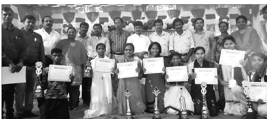
ଅତିଥିକ ଗହଣରେ କୃତୀ ପ୍ରତିଯୋଗୀମାନେ ।