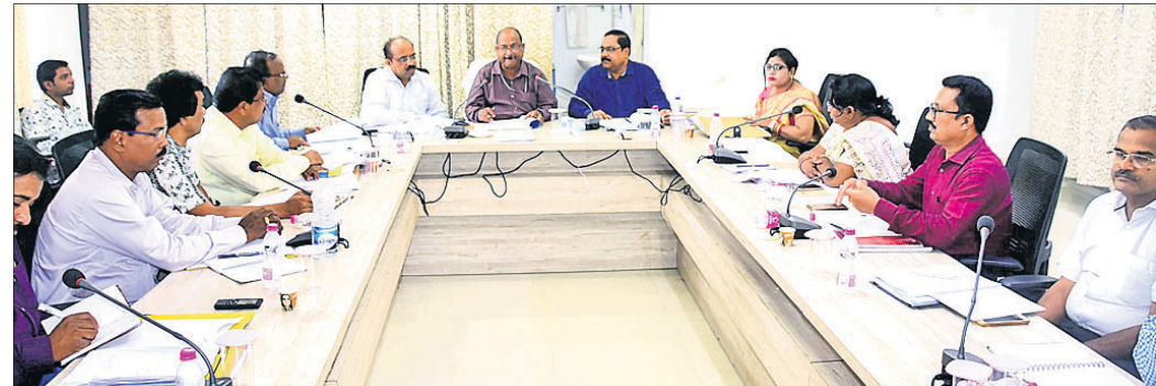
ପୁରୀ ସର୍କର ହାଉସରେ ଭୋଟର ତାଲିକା ସଂଶୋଧନ କାର୍ଯ୍ୟକ୍ରମ।