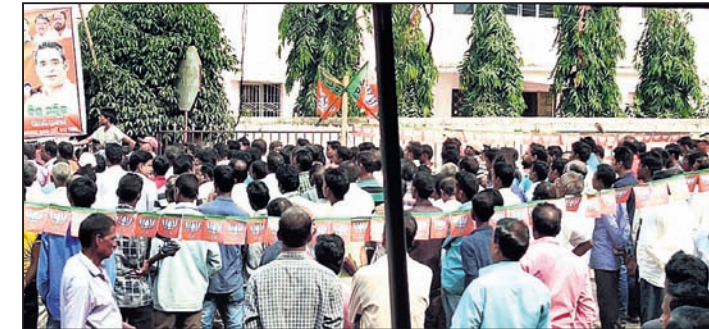
ତହସିଲ ଘେରାଉରେ ଶତାଧିକ ଭାଜପା କର୍ମୀ ସାମିଲ ହୋଇଛନ୍ତି ।