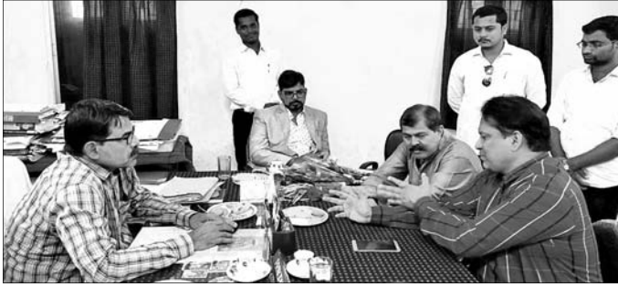
ଲିଙ୍ଗରାଜ ଆଇନ ମହାବିଦ୍ୟାଳୟରେ ଅଧ୍ୟକ୍ଷ ସହିତ ଓଏସବିର ଫ୍ୟାକ୍ ଫାଇଣ୍ଡିଂ ଟିମ୍ ଆଲୋଚନା କରୁଛନ୍ତି ।