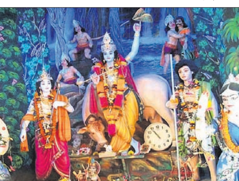
ଗୌଡ଼ବିଶି ମଣ୍ଡପ ।

ତେରାବିଶ କୁଳ ବେଶାପୁର ପଞ୍ଚାୟତର ସଦାନନ୍ଦପୁର ଓ ଚାନ୍ଦୋଳ ପଞ୍ଚାୟତ ଗିରିଗୋବର୍ଦ୍ଧନ ପୂଜା ଶୁକ୍ରବାର ବୃତ୍ତାୟ ଦିନରେ ପହଞ୍ଚିଛି । କାର୍ତ୍ତିକେଶ୍ୱର ଅମଳକୁ ୧୦ରେ ଅନୁଷ୍ଠିତ ହୋଇ ଆସୁଥିବା ଏହି ପୂଜା ବେଶ୍ୱାଳୁ ଆଖପାଖ ଅଞ୍ଚଳର ବହୁ ଲୋକ ଆସିଛି । ସଦାନନ୍ଦପୁର ଗ୍ରାମର ୨୦ରୁ ଉର୍ଦ୍ଧ୍ୱ ବୁଝାକାର ପରିବାର ପକ୍ଷରୁ ଏହି ପୂଜା ଅନୁଷ୍ଠିତ ହେଉଥିବା ବେଳେ ଏହା ୭ଦିନ ଧରି ଚାଲେ । ଶୁକ୍ରବାର ପୂଜାର ବୃତ୍ତାୟ ଦିନରେ ପୂଜା ମଣ୍ଡପ ପାର୍ଶ୍ୱରେ ପାଲ ଓ ଭଜନ ପରିବେଷଣ ହୋଇଥିଲା । ଏହି ପୂଜା ବାବା ଗାଁ ଆର୍ଥିକ