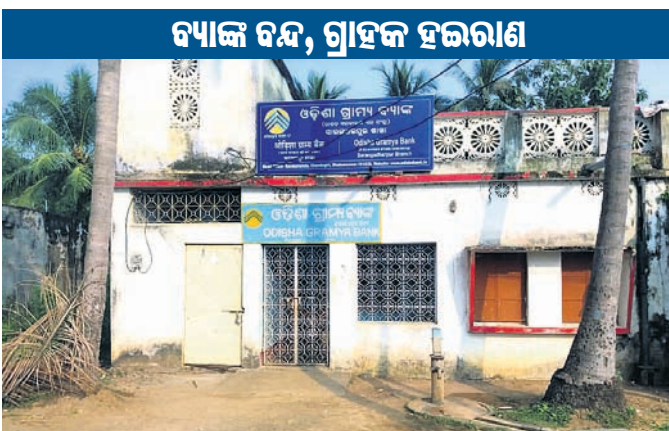
ଶାରଙ୍ଗଧରପୁର ଓଡ଼ିଶା ଗ୍ରାମ୍ୟ ବ୍ୟାଙ୍କର ତାଲା ପଡ଼ିଛି।

ଏପ୍ରିଲ ୬ ତାରିଖରେ ରଣପୁର ଥାନା ଶାରଙ୍ଗଧରପୁର ଓଡ଼ିଶା ଗ୍ରାମ୍ୟବ୍ୟାଙ୍କ ଶାଖାରୁ ଚୁର୍ଣ୍ଣମାନେ ୧କୋଟିରୁ ଅଧିକ ଟଙ୍କାର ୨୫୬ ପ୍ୟାକେଟ୍ ବନ୍ଧକ ସୁନା ଲୁଚିନିଆଥିଲେ। ଘଟଣାର ୭ମାସ ବିତିଯାଇଛି। ସ୍ଥାନୀୟ ପୋଲିସ୍ ଟକ୍ସା ଡକ୍ଟରୀକୁ ଗିରଫ କରିଥିଲା ବେଳେ ସେମାନଙ୍କଠାରୁ ନକଲି ସୁନା ଓ ଟଙ୍କା ଜବତ କରିଥିଲା। ହେଲେ ଜମାକାରୀମାନେ ଏପର୍ଯ୍ୟନ୍ତ ସେମାନଙ୍କ ବନ୍ଧକ ସୁନା ଫେରିପାଇ ନାହାନ୍ତି। ଏଥିପାଇଁ ସେମାନେ ବାରମ୍ବାର ବ୍ୟାଙ୍କ କର୍ତ୍ତୃପକ୍ଷଙ୍କ ନିକଟରେ ଦାବି କରୁଥିଲେ ମଧ୍ୟ ସୁଫଳ ପାଇନାହାନ୍ତି। ଏହାକୁ ନେଇ ଗୁରୁବାର ସକାଳ ୧୦ଟାରେ ଜମାକାରୀମାନେ ବ୍ୟାଙ୍କରେ ପଶି ହଇଗୋଳ କରିଥିଲେ। ଖବର ପାଇ ସ୍ଥାନୀୟ ପୋଲିସ୍ ସହିତ ବ୍ୟାଙ୍କ ମ୍ୟାନେଜର ଲୋକଙ୍କୁ ଟ୍ରଷ୍ଟାଣ୍ଡିଆ କରି ଶାନ୍ତ କରାଯାଇଥିଲା। ହେଲେ ଶୁକ୍ରବାର ପୁଣି ଜମାକାରୀମାନେ ବନ୍ଧକ ସୁନା କିମ୍ବା ଟଙ୍କା ଫେରାଇବା ଦାବିରେ ବ୍ୟାଙ୍କକୁ