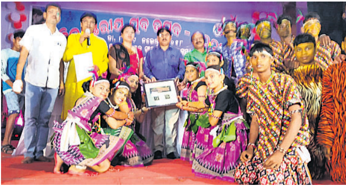
ଲୋକନୃତ୍ୟରେ ପ୍ରଥମ ହୋଇ ପୁରୀର ଗ୍ରହଣ କରିଥିବା ତିଏଲି ସ୍କୁଲର ଛାତ୍ରୀଛାତ୍ର।