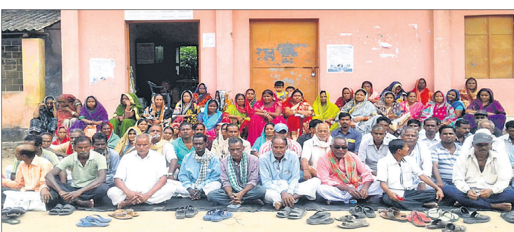
ପଞ୍ଚାୟତବାସୀ କୁଳ କାର୍ଯ୍ୟାଳୟ ଆଗରେ ଧାରଣା ଦେଇଛନ୍ତି ।