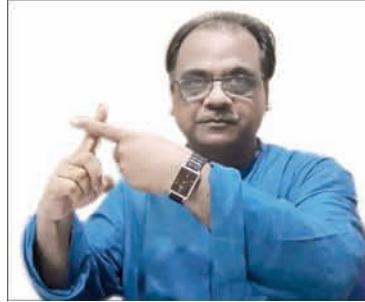
Ratikant Mohapatra Odissi Artiste