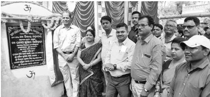
ଗୋପାଳପୁର ଚିତ୍ତିରେ ଉଦ୍ଘାଟନ କରୁଛନ୍ତି ବିଧାୟକ ।