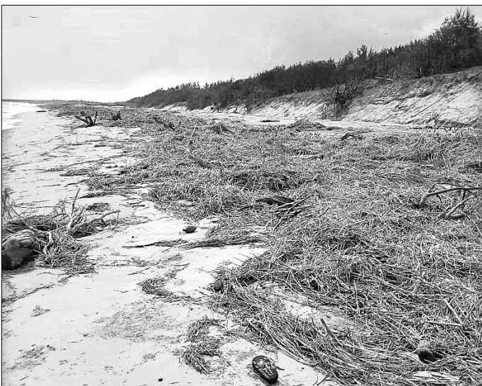
ସମୁଦ୍ର କୂଳ ଲଂଘୁଥିବା ଏବଂ ବେଳାଭୂମି ଅବକ୍ଷୟ ଦୃଶ୍ୟ ।

ନଭେମ୍ବର ଶେଷ ଆଡ଼କୁ ଗଞ୍ଜାମ ନିକଟସ୍ଥ ରଷିକୂଳା ଯାଏଁ ପ୍ରାୟ ୨୦ ମିଟର ଧରଣର କଇଁଛଙ୍କ ନିକଟରେ ଥିବା ଅଣ୍ଡାଦାନ ପ୍ରକ୍ରିୟା ପ୍ରଭାବିତ ହେବା ଆଶଙ୍କା ରହିଛି ।