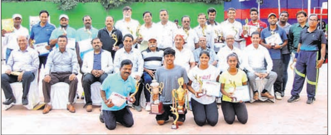
ଅତିଥିକ ଗଣଗଣେ କୃତା ଖେଳାଳି ।