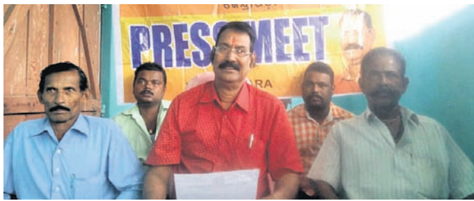
ଖବରଦାତା ସମ୍ବଲପୁରରେ ଶ୍ରମିକ ନେତାମାନେ । ତେରାବିଶ, ୧୧୧୧୧ (ସ.ପ୍ର.)

ନିର୍ମାଣ ଶ୍ରମିକଙ୍କ ବିଭିନ୍ନ ସମସ୍ୟା ନେଇ ଆସନ୍ତା ୧୪ତାରିଖ ରୁପସର ଜିଲ୍ଲାପାଳଙ୍କ କାର୍ଯ୍ୟାଳୟ ସମ୍ମୁଖରେ ଗଣଧାରଣା ଦେବ ଶକ୍ତି ଉତ୍ସାହୀ ନିର୍ମାଣ ଶ୍ରମିକ ସଂଘ । ଏ ନେଇ ଜିଲ୍ଲା ଶାଖା ପକ୍ଷରୁ ରିବିଭାର ତେରାବିଶ ରୁକ ଅଧୀନ ଚାଲେପତ୍ତୀ ନିଖୁଳ ଉତ୍ସାହୀ ନିର୍ମାଣ ଶ୍ରମିକ ସଂଘ ।