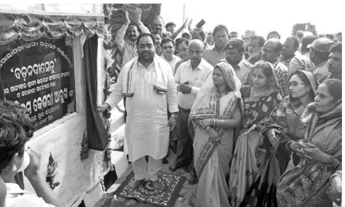
ଗୋଲାପଡ଼ା ସେତୁ ଉଦ୍ଘାଟନ କରୁଛନ୍ତି ମନ୍ତ୍ରୀ ।

କୋଟି ଟଙ୍କା ଖର୍ଚ୍ଚ ହେବା ପରେ ଗୋଲାପଡ଼ା ସେତୁ ଉଦ୍ଘାଟନ କରାଯାଇଛି । ଏହା ପରେ ଖୁବ୍‌ଶୀଘ୍ର ଆରମ୍ଭ ହେବ ନୂଆଗାଁ କେନାଲ କାମ ।