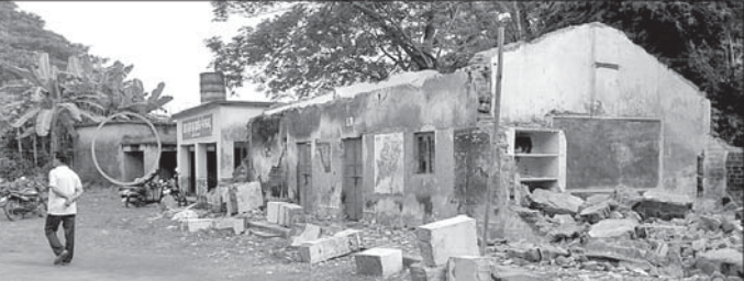
ବୃତ୍ତ ଚିହ୍ନିତ ଗୃହ ଭାଙ୍ଗିବାକୁ ନିର୍ଦ୍ଦେଶ ଥିବା ବେଳେ ଅନ୍ୟ ଶ୍ରେଣୀଗୁହ ଉଦ୍ଧାରଣ।

ପ୍ରାଥମିକ ଶିକ୍ଷା ଉପରେ କେନ୍ଦ୍ର ଓ ରାଜ୍ୟ ସରକାରଙ୍କୁ ପ୍ରଦାନ କରୁଥିବା ବେଳେ ପଟ୍ଟାମୁଣ୍ଡାଲ ପ୍ରାଥମିକ ଶିକ୍ଷା ବ୍ୟବସ୍ଥା ସମ୍ପୂର୍ଣ୍ଣ ବିପର୍ଯ୍ୟୟ ହୋଇପଡ଼ିଛି। ଗତ ୬ ମାସ ହେବ ସ୍କୁଲର ସ୍ଥାୟୀ ପ୍ରଧାନଶିକ୍ଷକ ମନମୁଖୀ ଭାବେ କାର୍ଯ୍ୟ କରୁଛନ୍ତି।