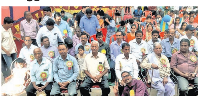
ବନ୍ଧୁମିଳନ ଭଣ୍ଡାର ଅବସରରେ ଅତିଥିକ ଗଣଶରେ ପୁରାତନ ଛାତ୍ରାଛାତ୍ରୀ । ଆଇ, ୧୧୧୧୧ (ଡି.ଏନ୍.ଏ.)

ବନ୍ଧୁଦ୍ୱୟ ହିଁ ଶ୍ରେଷ୍ଠ ସମ୍ପଦ, ଏହାର କୌଣସି ବିକଳ ନାହିଁ ବୋଲି ଆଇ ବ୍ଲକସ୍ଥିତ ଚକ୍ଷୁଆଗତି ନୋଡାଲ ଉପଦେଶାଳୟ ପରିସରରେ ଆୟୋଜିତ ବନ୍ଧୁମିଳନ ଭଣ୍ଡାରରେ ଅତିଥିମାନେ ପ୍ରକାଶ କରିଛନ୍ତି ।