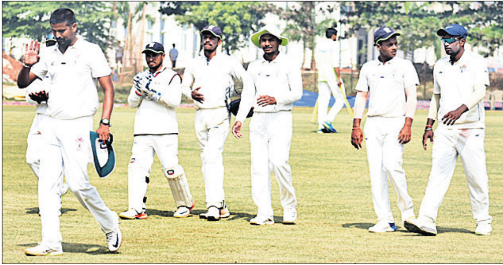
ଉତ୍ତରପ୍ରଦେଶ ଦଳର ଖେଳାଳିମାନେ ଓଡ଼ିଶା ଦଳର ସମ୍ମୁଖରେ (ବାମ) ଓ ସାଥୀ ଖେଳାଳି ।

ଘରୋଇ ଓଡ଼ିଶା ବିପକ୍ଷରେ ଗୁଆଁଜି କିଙ୍ଗ୍ସ୍ କ୍ରିକେଟ୍ ଷ୍ଟାଡ଼ିୟମରେ ଚାଲିଥିବା ରଣଜୀ ଟ୍ରଫି ମ୍ୟାଚ୍ ଉତ୍ତରପ୍ରଦେଶ (ୟୁପି) ନିୟନ୍ତ୍ରଣରେ ରହିଛି । ପ୍ରଥମ ଇନିଂସରେ ୧୮୧ ରନ୍ରେ ପଛୁଆ ରହିଥିବା ବିପକ୍ଷ ସାମଗ୍ରୀକର ଲକ୍ଷ୍ୟରେ ଓଡ଼ିଶା ୨ୟ ଇନିଂସ ଆରମ୍ଭ କରି ବୁଧବାର ଷ୍ଟୁ ଅପସାରଣ ସୁଦ୍ଧା ୬ ଉଇକେଟ୍ ହରାଇ ୧୮୦ ରନ୍ ସଂଗ୍ରହ କରିଛି । ହାତରେ ଆଉ ମାତ୍ର ୩ଟି ଉଇକେଟ୍ ରହିଥିବାରୁ ଓଡ଼ିଶା ଏବେ ପରାଜୟ ଦ୍ୱାରରେ ପହଞ୍ଚିଛି । ବୁଧବାର ମ୍ୟାଚ୍ରେ ଅତିମ ଦିବସ ହୋଇଥିବାରୁ ଉତ୍ତରପ୍ରଦେଶ ଘରୋଇ ଓଡ଼ିଶାକୁ ଶ୍ରୀମୁଖ ଅଳ୍ପାଧିକ କରି ମ୍ୟାଚ୍ ଜିତିବା ଲକ୍ଷ୍ୟରେ ରହିଛି ।