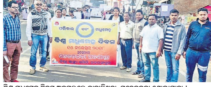
ବିଶ୍ୱ ମଧୁମେହ ଦିବସ ଅବସରରେ ବାହାରିଥିବା ସଚେତନତା ଶୋଭାଯାତ୍ରା।

ପାପଡ଼ାହାଣ୍ଡି, ୧୪।୧୧ (ଡି.ଏନ.ଏ.)- ପାପଡ଼ାହାଣ୍ଡି ବ୍ଲକ୍ ସଦର ମହକୁମା ଭବାନୀ ଛକରେ ବୁଧବାର ଦୁର୍ଘଟଣାରେ ୨ ଜଣ ବାଳକ ଆରୋହୀ ଆହତ ହୋଇଛନ୍ତି। ସେମାନେ ହେଲେ ସନସାଲ ହରିଜନ ଓ ଶତ୍ରୁଘ୍ନ। ସେମାନେ ବାଳକରେ ପାପଡ଼ାହାଣ୍ଡିରୁ ନିଜ ଗାଁ ରକାମାସୁ