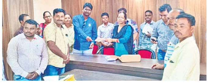
ଜିଆର୍ଏସ୍‌ମାନେ ବିତିଠକୁ ଦାବିପତ୍ର ଦେଉଛନ୍ତି।