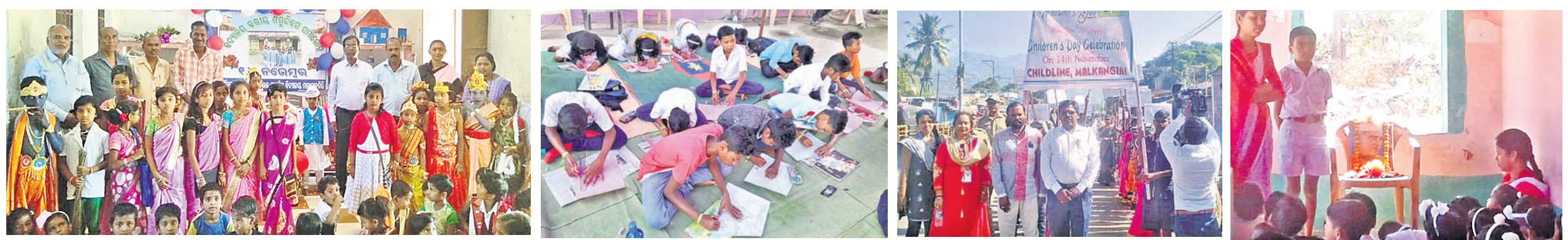
ଏକବୋର୍ଡ ବିଦ୍ୟାଳୟରେ ଅତିଥିଙ୍କ ଗହଣରେ ବିଭିନ୍ନ ବେଶରେ ଛାତ୍ରଛାତ୍ରୀ। ଶିଶୁଦିବସ ଅବସରରେ ପ୍ରତିଯୋଗିତା। ଶିଶୁଗୃହର ପିଲାମାନଙ୍କୁ ବାହାରିଥିବା ଶୋଭାଯାତ୍ରା। ପାଣ୍ଡିପାଣି ସରସ୍ୱତୀ ଶିଶୁ ମନ୍ଦିରରେ ଶିଶୁଦିବସ।