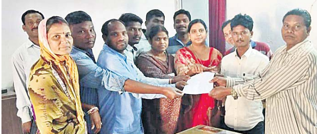
ବିଡ଼ିଓକୁ ଜିଆର୍‌ଏସ୍‌ମାନେ ଦାବିପତ୍ର ଦେଉଛନ୍ତି ।