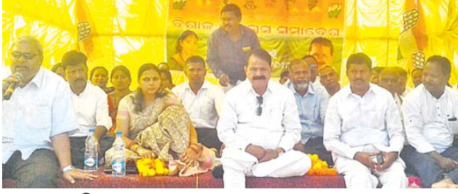
ସମାବେଶରେ ବିଧାୟକଙ୍କ ସହ ଅନ୍ୟ ନେତୃତ୍ୱ ।