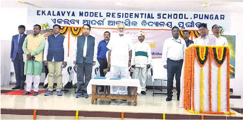
ପୁଞ୍ଜାର ଏକଲବ୍ୟ ଆଦର୍ଶ ଆବାସିକ ବିଦ୍ୟାଳୟ କାର୍ଯ୍ୟକ୍ରମରେ ରାଜ୍ୟପାଳଙ୍କ ସହ ଅନ୍ୟମାନେ ।