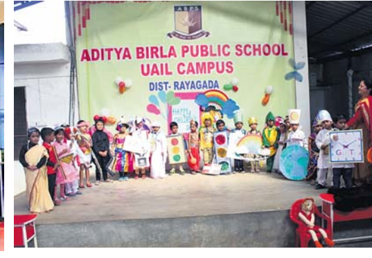
ଚିକିଟି ଆଦିତ୍ୟ ବିଲ୍ଲୀ ପବ୍ଲିକ୍ ସ୍କୁଲରେ କୌତୁକ ପୋଷାକରେ ଛାତ୍ରାଛାତ୍ରୀ।

ରାୟଗଡ଼ା ଅପ୍ରିଲ/ଗୁଣପୁର/ମୁନିଗୁଡ଼ା/ଚିକିଟି/ପଦ୍ମପୁର/ଗୁଣପୁର, ୧୪।୧୧(ଡି.ଏନ୍.ଏ.)