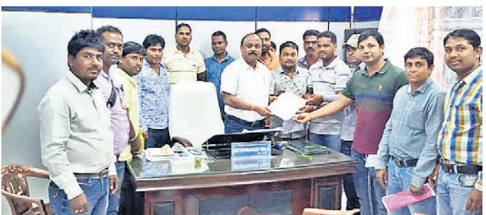
ବିତ୍ତକୁ ଜିଆରଏସମାନେ ଦାବିପତ୍ର ପ୍ରଦାନ କରୁଛନ୍ତି।

ମକରେ ମଙ୍ଗଳ ଥିଲେ ରେ ପୁତା, ଦାସୀ ପୁଅ ହେଲେ ଧରଣ ଛତା। ମକର ରାଶିରେ ମଙ୍ଗଳ ଗ୍ରହ ଅତ୍ୟନ୍ତ ଶୁଭକାରକ ହୋଇଥିବା ଜ୍ୟୋତିଷ ଶାସ୍ତ୍ରଜ୍ଞାୟାହା ଏପରି ଯୋଗରେ ଜନ୍ମଲାଭ କରିଥିବା ବ୍ୟକ୍ତି ଯେତେ ଦରିଦ୍ର ହୋଇଥିଲେ ମଧ୍ୟ ଭବିଷ୍ୟତରେ ଉଚ୍ଚ ପଦପଦବୀ ଲାଭ କରିବାକୁ ସମର୍ଥ ହୋଇଥାନ୍ତି। ସେହିପରି କ୍ଷମତାଶାଳୀ ହେବା ସହ ରାଜଭୋଗ କରିବାର ମଧ୍ୟ ଅନେକ ସମ୍ଭାବନା ରହୁଥିବା ଅର୍ଥରେ ଏଭଳି ଭକ୍ତି ଉଲ୍ଲେଖ କରାଯାଇଛି। ନିର୍ବାଚିତ ଭଗତମାଲି, ପ୍ରବାଦ, ପ୍ରବଚନ ଓ ଅନ୍ୟାନ୍ୟ -ପ୍ରାଣ ସାହିତ୍ୟ ପ୍ରତିଷ୍ଠାନ