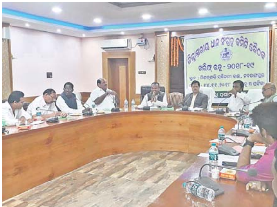
ବୈଠକରେ ଜିଲାପାଳଙ୍କ ସହ ଅନ୍ୟମାନେ।