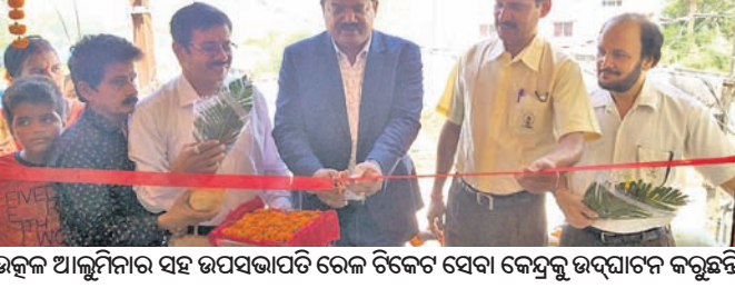
ଉକ୍ତ ଆୟତ୍ତନୀୟ ସହ ଉପସଭାପତି ରେଳ ଟିକେଟ ସେବା କେନ୍ଦ୍ରକୁ ଉଦ୍ଘାଟନ କରୁଛନ୍ତି।

କରିଥିଲେ। ଭାରତୀୟ ରେଳ ସେବା ପକ୍ଷରୁ ରାୟଗଡ଼ା ସମେତ ଜିଲ୍ଲାର ରୁଣ୍ଡାପୁର, ଗଜପତି ଜିଲ୍ଲାର ପାରଳାଖେମୁଣ୍ଡି ଓ କୋରାପୁଟ ଜିଲ୍ଲାର ଜୟପୁର ସହରରେ ମଧ୍ୟ ଏହି ସେବା ଗ୍ରାହକମାନଙ୍କ ପୂର୍ବିକା ପାଇଁ ଉପଲବ୍ଧ କରାଯିବ ବୋଲି କୁହାଯାଇଛି।