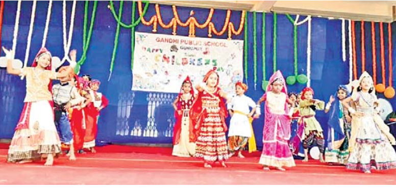
ଗୁଣପୁର ଗାନ୍ଧୀ ପବ୍ଲିକ୍ ସ୍କୁଲର ପିଲାମାନେ ନୃତ୍ୟ ପରିବେଷଣ କରୁଛନ୍ତି।