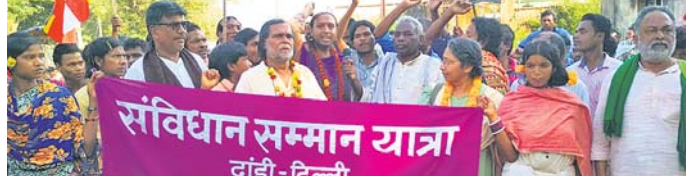
ସମ୍ବିଧାନ ସମ୍ମାନ ଯାତ୍ରାକୁ ମୁନିଖୋଲାଇରେ ସ୍ୱାଗତ କରାଯାଇଛି।