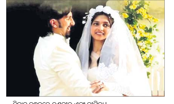
ବିବାହ ବନ୍ଧନରେ ରଣବୀର ଏବଂ ଦୀପ୍‌ଦୀ।

ରୋମ୍/ନୂଆଦିଲ୍ଲୀ, ୧୪।୧୧ (ଆଇଏଏନଏସ୍) ଇଟାଲୀର ପ୍ରାକୃତିକ ଦୃଶ୍ୟଭରା କୋମୋ ଲେକ୍ କୂଳରେ ବଲିଉଡ୍ ଅଭିନେତ୍ରୀ ଦୀପ୍‌ଦୀ ପାଟୁକୋନ୍ ଏବଂ ଅଭିନେତା ରଣବୀରଙ୍କ ମଧ୍ୟରେ ରୁଧିରୀ ଶୁଭ ପରିଣୟ ଅନୁଷ୍ଠିତ ହୋଇଛି। କଥା ସୁରକ୍ଷା ବ୍ୟବସ୍ଥା ମଧ୍ୟରେ ପରିବାର ସଦସ୍ୟ ଓ ବନ୍ଧୁବାନ୍ଧବଙ୍କ ଉପସ୍ଥିତିରେ ଶୁଭ ସାହାଯ୍ୟ ବାଜି ହାତଗଣ୍ଠି ପଡ଼ିଥିଲା। ରୁଧିରୀ ବ୍ୟାଞ୍ଜ, ବାଜା, ବାରାଡ୍ ପରେ ଦୀର୍ଘ ୬ ବର୍ଷ ଧରି ଚାଲିଥିବା ଏହି ପ୍ରେମ କାହାଣୀ ଲୁଚିଯାଇଛି। ପହଞ୍ଚି ନୂଆ ମୋଡ୍ ନେଇଛି। ଏଥିସହ ଏହି ଯୋଡ଼ି ସବୁଦିନ ପାଇଁ ପରସ୍ପରର ଜୀବନସାଥୀ ହୋଇଯାଇଛନ୍ତି। ଦୁହେଁଙ୍କ ନିକଟକୁ ଏବେ ଅଭିନୟନର ସୁଅ ଛୁଟିବାରେ ଲାଗିଛି। ଦୀପ୍‌ଦୀ ଏବଂ ରଣବୀର 'ଗଲିଓ କି ରାସଲୀଲା ରାମ-ଲୀଲା' ଏବଂ 'ବାଜିରାଓ ମସ୍ତାନ' ଭଳି ଚଳଚ୍ଚିତ୍ରରେ କାମକରିବା ପରଠାରୁ ଉଭୟଙ୍କ ମଧ୍ୟରେ ଅନ-ସ୍ଥିର କେମିଷ୍ଟ୍ରି ସୃଷ୍ଟି ହୋଇଥିଲା। ସେମାନେ ବିବାହ ଲାଗି ଉଭୟ ପରିବାର ସଦସ୍ୟଙ୍କ ସହିତ ପୃଷ୍ଠା-୪