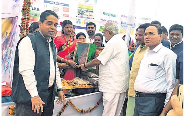
କୁମାରଖତି ଶିଶୁମାନଙ୍କଠାରୁ ଗଣେଶ ମୂର୍ତ୍ତି ଗ୍ରହଣ କରୁଛନ୍ତି ରାଜ୍ୟପାଳ ।