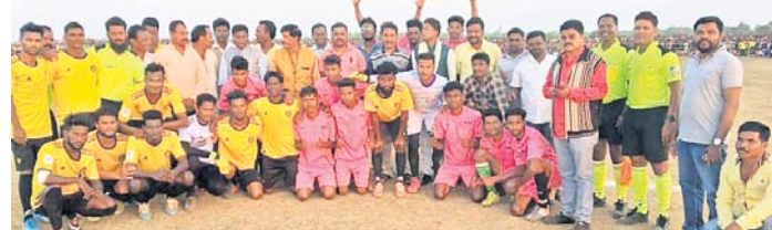
ଅତିଥିମାନଙ୍କ ସହ ଖେଳାଳିମାନେ ।