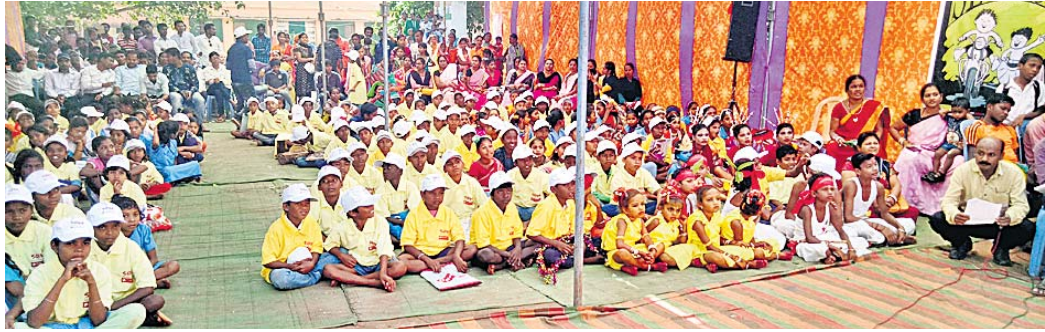
କୋଟପାଟ ରୁକ୍ କାର୍ଯ୍ୟକ୍ରମରେ ଶୋଭା ଅନୁଷ୍ଠାନ ପକ୍ଷରୁ ଶିଶୁ ଦିବସରେ ଉପସ୍ଥିତ ଥିବା ଛାତ୍ରାଛାତ୍ରୀ, ଶିକ୍ଷୟିତ୍ରୀ ଏବଂ ଶିକ୍ଷକମାନେ ।

କରପୁର/ସେମିଲିଗୁଡ଼ା, ୧୫୧୧ (ନି.ପ୍ର./ଡି.ଏନ୍.ଏ./ସ.ପ୍ର.)