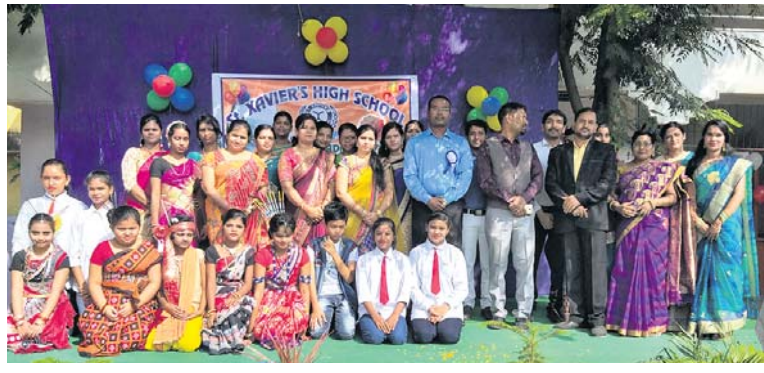
ସେଷକାଳିୟର ସ୍କୁଲରେ ଅନୁଷ୍ଠିତ ଶିଶୁ ଦିବସ କାର୍ଯ୍ୟକ୍ରମରେ ଛାତ୍ରାଛାତ୍ରୀ ଓ ଅନ୍ୟମାନେ।