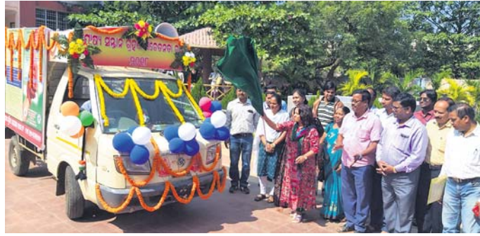
ଜିଲ୍ଲାପାଳ ପତାକା ଦେଖାଇ ସଚେତନତା ରଥର ଶୁଭାରମ୍ଭ କରୁଛନ୍ତି।

ଶିଶୁ ଦିବସ ପାଳନ ଅବସରରେ ଯୋଷ୍ୟ ସନ୍ତାନ ଗ୍ରହଣ ପାଇଁ ସାରା ଦେଶରେ ନଭେମ୍ବର ୧୪ରୁ ୨୦ତାରିଖ ପର୍ଯ୍ୟନ୍ତ ସମସ୍ତ ବ୍ୟାପୀ ଏକ ସଚେତନତା କାର୍ଯ୍ୟକ୍ରମ ଆରମ୍ଭ କରାଯାଇଛି। ଏହି କ୍ରମରେ ଜିଲ୍ଲା ପ୍ରଶାସନ ଓ ଜିଲ୍ଲା ଶିଶୁ ସୁରକ୍ଷା ଯୁକ୍ତ ପକ୍ଷରୁ ଯୋଷ୍ୟ ସନ୍ତାନ ଗ୍ରହଣ ସଂକ୍ରାନ୍ତରେ ଜିଲ୍ଲାରେ ସଚେତନତା ସୃଷ୍ଟି କରିବା ପାଇଁ ବିଭିନ୍ନ ତଥ୍ୟଭିତ୍ତିକ ସୂଚନା ଫଳକରେ ସୁସଜ୍ଜିତ ଏକ ରଥର ଶୁଭାରମ୍ଭ କରାଯାଇଛି। ଜିଲ୍ଲାପାଳ ଗୁହା ପୁନମ ଚାପ ସକୁମାର ଦେବତା ପତାକା ଦେଖାଇ ଜିଲ୍ଲା ସଂସ୍କୃତି ଭବନ ପରିସରରୁ ଏହାର ଶୁଭାରମ୍ଭ କରିଥିଲେ। ଯୋଷ୍ୟ ସନ୍ତାନ ଗ୍ରହଣ ସ୍ନେହ ଓ ବନ୍ଧନର ପ୍ରତୀକ ବୋଲି ସେ କହିଥିଲେ। ଏହି ରଥ ଜିଲ୍ଲାର ସମସ୍ତ ୧୧ଟି ବ୍ଲକ୍ ସଦର ମହକୁମା ସହ