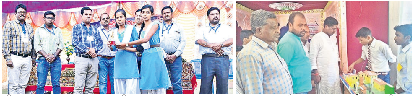
ଅତିଥିମାନେ କୃତୀ ଛାତ୍ରାଙ୍କୁ ପୁରସ୍କାର ପ୍ରଦାନ କରୁଛନ୍ତି।