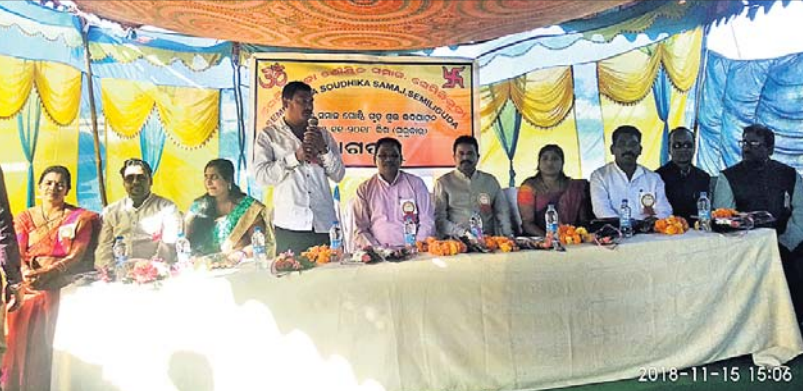
ସେମିଲିଗୁଡ଼ା ପୌରସଂଘ ୨୨ ନଭର ଓଡ଼ିଶା ଗାନ୍ଧୀ ସାହିରେ ଶୈଳିକ ସମାଜ ପକ୍ଷରୁ ଗୋଷ୍ଠୀକେନ୍ଦ୍ର ଶୁଭାଚରଣ ବେଳେ ଉପସ୍ଥିତ ଅତିଥିମାନେ ।