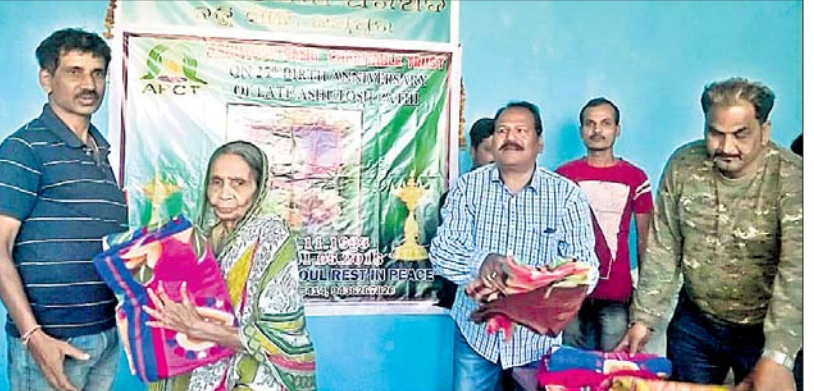
କରପୁର ବକ୍ସିସାହି ସ୍ଥିତ ଗ୍ରାମାଧିକାରୀ ପରିଷଦରେ ଆଶୁଗୋଷ୍ଠୀ ପାଠୀ ଚାରିବେଳୁକ ଗ୍ରନ୍ଥ ଚରଫରୁ ସହରର ୧୩୩୩ ଜଣ ଗରିବ ବୃଦ୍ଧଙ୍କୁ ଶୀତ ବସ୍ତ୍ର ବଣ୍ଟନ କରାଯାଇଛି ।