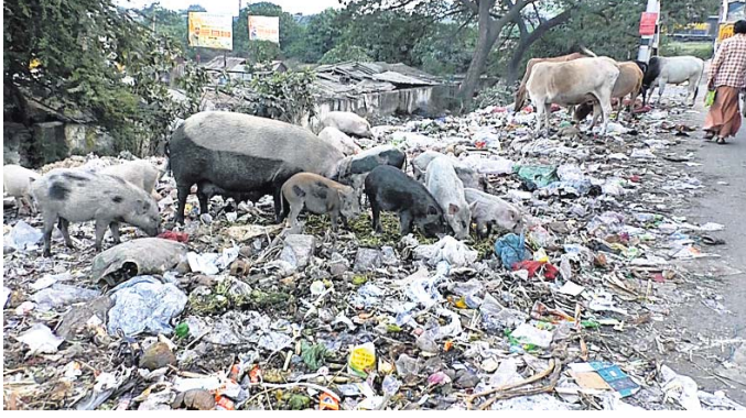
ଅଳିଆ ଆବଜନ ଜମା ହୋଇ ରହିଛି ।

ରାୟଗଡ଼ା ଜିଲ୍ଲା ପୁନିଗୁଡ଼ା ସଦର ମହକୁମାରେ ସରକାରଙ୍କ ସ୍ଵଳ୍ପ ଭାରତ ମିଶନ ସମ୍ପୂର୍ଣ୍ଣ ଭାବେ ଫେଲ୍ ମାରିଥିବା ଦେଖାଯାଇଛି । ପୁନିଗୁଡ଼ା ତିନିକୋଣିଆ ଛକ, ରାସ୍ତା କଡ଼ରେ ଓ ରାସ୍ତା ମଧ୍ୟ ଭାଗରେ ପଡ଼ି ରହିଛି କୁଡ଼କୁ ଅଳିଆ ଆବଜନ । ଫଳରେ ଦିନ ତମାମ ଗୁରୁତର ଓ ଗୋରୁଗାଈଙ୍କ ଏହା ଚରାଭୁଲି ପାଇଛନ୍ତି । ଛକସ୍ଥଳୀ ହୋଇଥିବାରୁ ଦିନ ତମାମ ଏଠାରେ ପରିବା ବ୍ୟବସାୟ, ହୋଟେଲ ଓ ଅନ୍ୟ ବ୍ୟବସାୟମାନେ ଜିନିଷପତ୍ର ବିକ୍ରି କରନ୍ତି । କିନ୍ତୁ ସକ୍ଷୟ ସମୟରେ ଏଠାରେ ପରିବା ଚୋପା ସହ ଅନ୍ୟ ଅବରକାରୀ ଜିନିଷ ସବୁ ପକାଇ ରାଳି ଯାଆନ୍ତି । ଏହାଦ୍ଵାରା ସେଠାରେ ପୂର୍ଣ୍ଣଗଣମୟ ପରିବେଶ ସୃଷ୍ଟି ହୁଏ । ପୁନିଗୁଡ଼ା ପଞ୍ଚାୟତ କାର୍ଯ୍ୟାଳୟ ପକ୍ଷରୁ ସହରର ବିଭିନ୍ନ ସ୍ଥାନରେ ଡଷ୍ଟବିନ୍ ରଖାଯାଇଛି । ଡଷ୍ଟବିନ୍ ପୂର୍ଣ୍ଣ ଥିବା ସ୍ଥାନରେ ପଡ଼ୁଛି । ଏ ନେଇ ବାରମ୍ବାର ପଞ୍ଚାୟତକୁ ଜଣାଇଲେ ମଧ୍ୟ କୌଣସି ସୁଫଳ ମିଳୁନି । ଏଣେ ପବନ ଯୋଗୁ ଡଷ୍ଟବିନ୍ ବାହାରେ ପଡ଼ିଥିବା ଅଳିଆ ଉଡ଼ି ଏଣେ ତେଣେ ପଡ଼ୁଛି । ଏହା