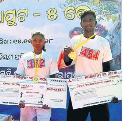
କୋରାପୁଟ, ୧୫।୧୧ (ସ୍ୱ.ପ୍ର.): ପରବ-୨୦୧୮ ଉପଲକ୍ଷେ କୋରାପୁଟରେ କରପୁର ମିନି ମାରାଥନ ଅନୁଷ୍ଠିତ ହୋଇଛି ।