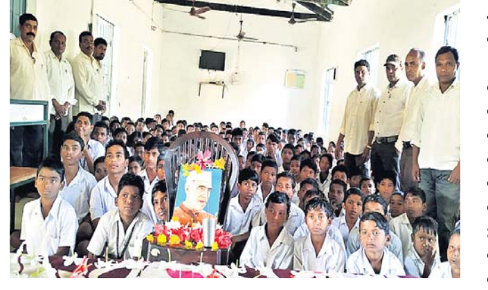
କାର୍ଯ୍ୟକ୍ରମରେ ଛାତ୍ର ଓ ଶିକ୍ଷକମାନେ ।