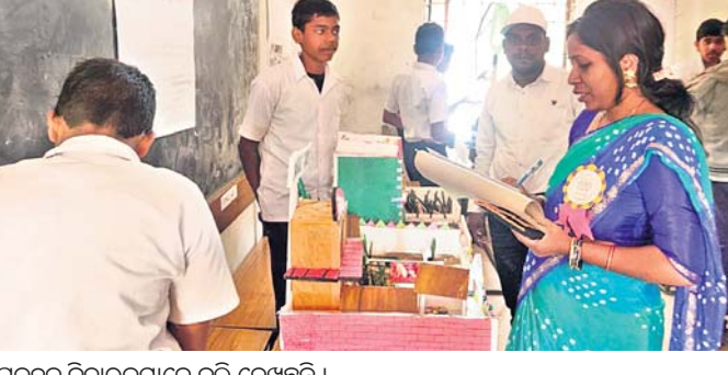
ପ୍ରକଳ୍ପକୁ ବିଚାରକମାନେ ଭୁଲି ଦେଖୁଛନ୍ତି ।