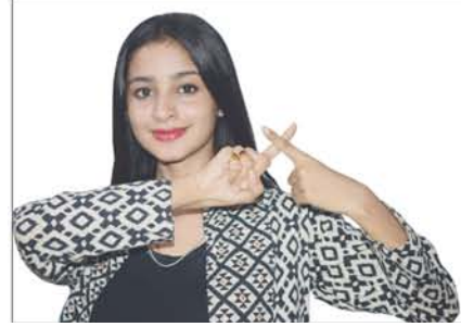
Bhoomika Dash Actress