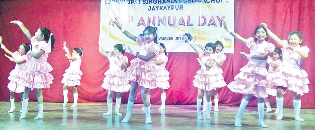
ଛାତ୍ରାମାନେ ନୃତ୍ୟ ପରିବେଷଣ କରୁଛନ୍ତି ।