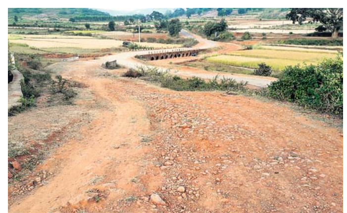
ବାଉଁଶଗୁଡ଼ାକୁ ଯାଇଥିବା ରାସ୍ତା ଶୋଚନୀୟ ହୋଇପଡ଼ିଛି ।

ରାଜ୍ୟ ସରକାର ଗ୍ରାମାଞ୍ଚଳ ଉନ୍ନତି ପାଇଁ ଯୋଜନା ପରେ ଯୋଜନା କରିଗାଲିଛନ୍ତି । କିନ୍ତୁ ଅଧିକାରୀ ଏବଂ ଲୋକ ପ୍ରତିନିଧିଙ୍କ ଲକ୍ଷ୍ୟଗୁଡ଼ିକ ଅଭାବ ଯୋଗୁ ଯୋଜନା ଗାଁରେ ପହଞ୍ଚିବାରେ ବାଧକ ସାଜିଛି । ପଟାଳି ରୁକ୍ମିନୀ ଦେଓପଟାଳି ପଞ୍ଚାୟତ ବାଉଁଶଗୁଡ଼ା ହେଉଛି ଏଭଳି ଏକ ଉଦାହରଣ । ଗାଁକୁ ଆରତି ଛକକୁ ଯାଇଥିବା ମାଟି ରାସ୍ତା ରୁକ୍ମିନୀ ଓ ପଞ୍ଚାୟତ କାର୍ଯ୍ୟାଳୟ ପକ୍ଷରୁ ଏମ୍ପି ଡିଡ଼ି ହିକ୍କାଙ୍କୁ ଏସ୍ପିଏମ୍ ମରାମତି ହୋଇଥିଲେ ମଧ୍ୟ ଉକ୍ତ ରାସ୍ତାରେ ଯାତାୟତ ସମସ୍ୟା ସୃଷ୍ଟି କରିଛି । ଉକ୍ତ ରାସ୍ତା ବେଳ ସମୟଗୁଡ଼ା ଏବଂ ମାଳିପୁଟ ପଞ୍ଚାୟତ ଖୁରାଖୋଲ ଗ୍ରାମବାସୀ ଯାତାୟତ ପାଇଁ ନିର୍ଭର କରନ୍ତି । ସେହି ଛକକୁ ଖୁରାଖୋଲ ୬ କିଲୋମିଟର ଦୂର । ଉପରୋକ୍ତ ତିନୋଟି ଗ୍ରାମର