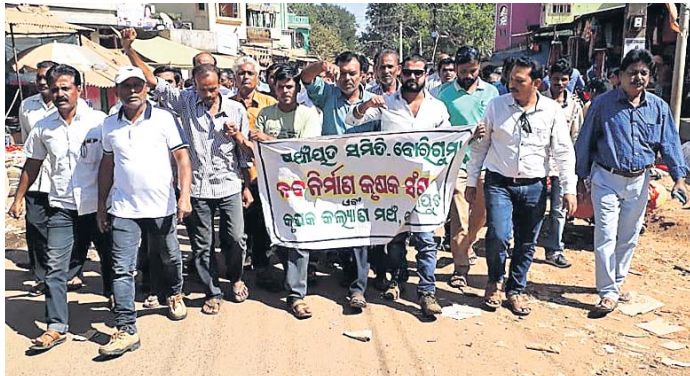
ବୋରିଗୁମ୍ମାରେ ନବ ନିର୍ମାଣ କୃଷକ ସଂଗଠନ ପକ୍ଷରୁ ବାହାରିଥିବା ଶୋଭାଯାତ୍ରା ।