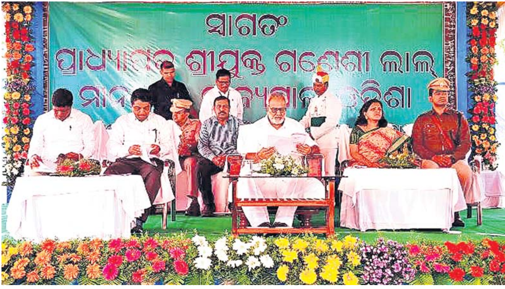
କାର୍ଯ୍ୟକ୍ରମରେ ରାଜ୍ୟପାଳ, ବିଜ୍ଞାପକ ସହ ଅନ୍ୟମାନେ ।