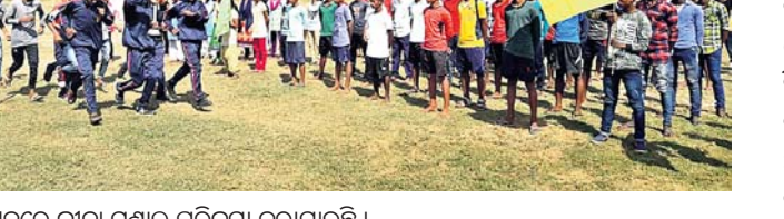
ଉତ୍ସବରେ କ୍ରୀଡ଼ା ମଣ୍ଡଳ ପରିକ୍ରମା କରାଯାଇଛି ।

ଉଚ୍ଚବିଦ୍ୟାଳୟର ଛାତ୍ରାଛାତ୍ରୀ ଯୋଗ ଦେଇଥିଲେ । ୧୦୦, ୨୦୦ ମିଟର ବୌଦ୍ଧ ସହ ଉଚ୍ଚ ଡିଆଁ, ଲମ୍ବ ଡିଆଁ, କବାଡି, ଭଲିବଲ, କାଉଲିନ ଥ୍ରୋ ଆଦି ଖେଳ ପାଇଁ ଯୋଗ ଦେଇଥିଲେ । ୪୦ ଜଣ କୃତୀ ଛାତ୍ରାଛାତ୍ରୀ ଆସନ୍ତା ୧୭ ତାରିଖରେ ହେବାକୁ ଥିବା ଜିଲ୍ଲାପ୍ରଧାନ କ୍ରୀଡ଼ା ପ୍ରତିଯୋଗିତାରେ