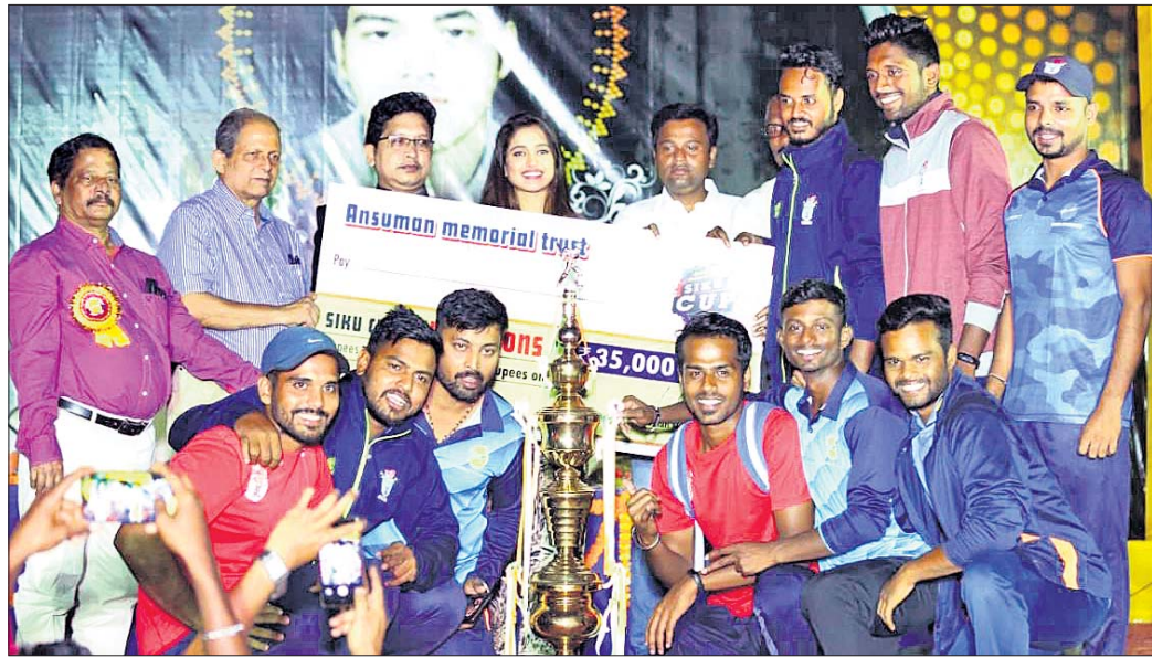
ଚାମ୍ପିୟନ ରାଜନୀତି ସ୍ତୂତେଷୁ ଦଳର ଖେଳାଳିମାନେ ଟ୍ରଫି ସହ ଅତିଥିଙ୍କ ସମ୍ମାନଣ କରିଛନ୍ତି ।