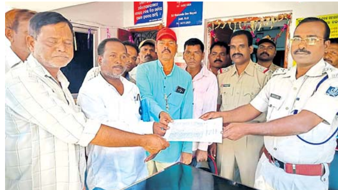
କରପୁର ସଦର ପୋଲିସକୁ ଦାବିପତ୍ର ଦେଇ କୃଷକ କଲ୍ୟାଣ ମଞ୍ଚ ।