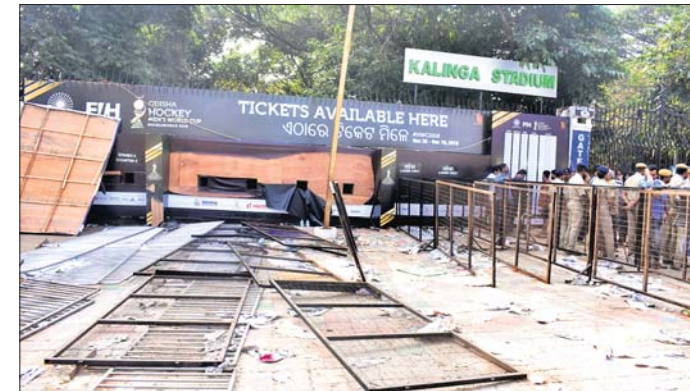
ଟିକେଟ ନ ପାଇବାରୁ ହକିପ୍ରେମୀଙ୍କ ଭଙ୍ଗାଠୁଟା।

ପୁରୁଷ ହକି ବିଶ୍ୱକପ୍ ଆରମ୍ଭ ହେବା ପୂର୍ବରୁ ଅବ୍ୟବସ୍ଥା ଦେଖାଦେଇଛି। ଟିକେଟ ବିକ୍ରିକୁ ନେଇ ଗୁରୁବାର କଳିଙ୍ଗ ସ୍ଥାଡିୟମ ପରିସରରେ ଉତ୍ତେଜନା ପ୍ରକାଶ ପାଇଛି। ଟିକେଟ କିଣିବାକୁ ଆସିଥିବା ହକିପ୍ରେମୀମାନେ ଟିକେଟ ନ ପାଇବାରୁ ସେଠାରେ ଭଙ୍ଗାଠୁଟା କରିଛନ୍ତି। ସୂଚନା ମୁତାବକ, ନଭେମ୍ବର ୧୫ରୁ ହକି ବିଶ୍ୱକପ୍ ଉଦ୍‌ଘାଟନା ଉତ୍ସବର ଟିକେଟ ବିକ୍ରି ହେବ ବୋଲି କ୍ରୀଡ଼ା ସଚିବ ପୂର୍ବରୁ ଘୋଷଣା କରିଥିଲେ। ସେହି ଅନୁଯାୟୀ ହକିପ୍ରେମୀମାନେ ଗୁରୁବାର କଳିଙ୍ଗ ସ୍ଥାଡିୟମକୁ ଟିକେଟ କିଣିବାକୁ ଆସିଥିଲେ। ୧୪ ତାରିଖ ରାତି ପ୍ରାୟ ୨ଟାକୁ ଅନେକ ହକିପ୍ରେମୀ ସ୍ଥାଡିୟମର ଏନେକ ଗେଟରେ ଧାଡ଼ି ବାସିଥିଲେ। ସକାଳରେ ଦେଖିବାକୁ ବହୁ ସଂଖ୍ୟକ ହକି ପ୍ରେମୀ ଟିକେଟ ପାଇଁ ଭିଡ଼ ଜମାଇଥିଲେ। ଦୀର୍ଘ ସମୟ ଛିଡ଼ା ହେବା ପରେ ସକାଳ ୮ଟା ବେଳକୁ ଜଣେ କର୍ମଚାରୀ ଏଠାରେ ଟିକେଟ ଉପଲବ୍ଧ ନ ଥିବା ସମ୍ପର୍କରେ ଏକ ନୋଟିସ୍ ମାରି ଚାଲିଯାଇଥିଲେ।