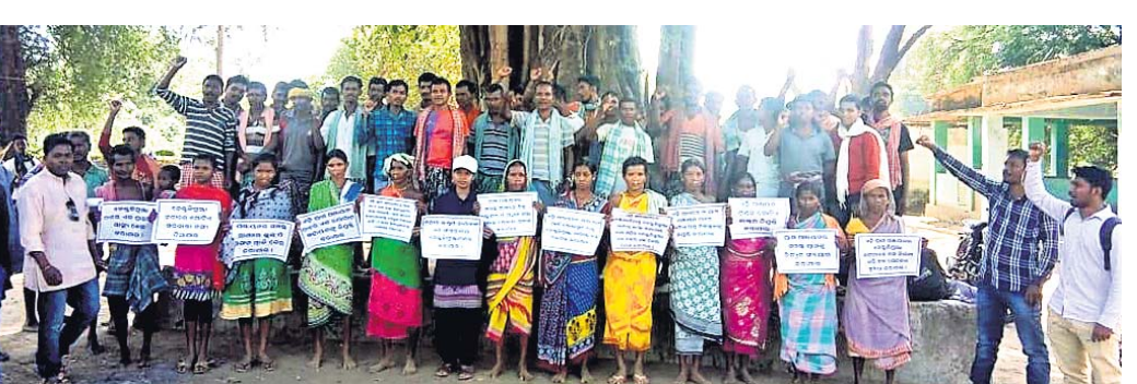
ଡେକ୍ଲିଗୁମ୍ମା ଗ୍ରାମବାସୀ ଯୁ କାର୍ତ୍ତ ଧରି ପ୍ରଶାସନ ଉଦ୍ଦେଶ୍ୟରେ ବିଭିନ୍ନ ଦାବି ଜଣାଇଛନ୍ତି ।