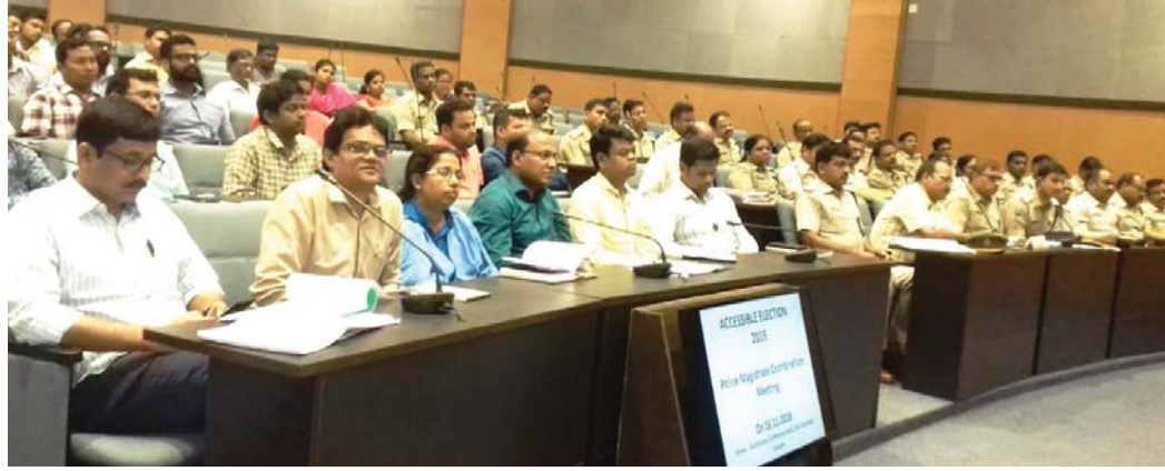
ବୈଠକରେ ଉପସ୍ଥିତ ବିଜିଓ, ତହସିଲଦାର, ଥାନା ଅଧିକାରୀମାନେ।