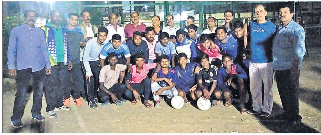
କ୍ରୀଡ଼ା ସଂସଦ କର୍ମକର୍ତ୍ତାଙ୍କ ସହ ଗଞ୍ଜାମ ଜିଲାର ଖେଳାଳମାନେ ।