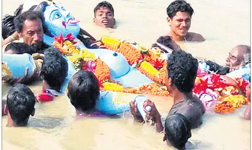
ଉତ୍ସବରେ ଏକ ଅସ୍ଥାୟୀ ପୋଖରୀରେ ମା' ବାଳାଙ୍କ ବିସର୍ଜନ କରାଯାଇଛି।

କଟକ ଅଫିସ, ୧୬।୧୧: ବିଜୁପତ୍ତନାୟକ ଛକ ନିକଟ ଖ୍ରୀଷ୍ଟିୟାନ ପଡ଼ିଆରେ ଶୁକ୍ରବାର ଆୟୋଜିତ ହୋଇ ଭାଜପାର ମିଶ୍ରଣ ପର୍ବ। ଏଥିରେ ବିଜେଡି ଏବଂ ଗ୍ରେସ୍ କର୍ମୀ ଭାଜପାରେ ଯୋଗଦେଇଛନ୍ତି।