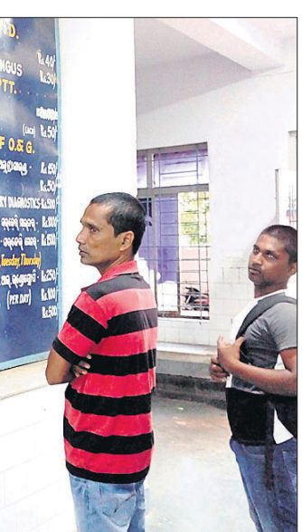
ଧୂଳିଆ ଫି ଫଳକକୁ ରୋଗୀଙ୍କ ସମ୍ପର୍କୀୟମାନେ ପଢୁଛନ୍ତି ।

ପାରଳାଖେମୁଣ୍ଡି/ରାମଗିରି, ୧୬/୧୧ (ସ୍ୱ.ପ୍ର./ଡି.ଏନ୍.ଏ.): ଗଜପତି ଜିଲ୍ଲା ଆର୍.ଉଦୟଗିରି ବ୍ଲକ୍ ରାମଗିରିସ୍ଥିତ ପ୍ରାଣାଧିନ ନିରାକ୍ଷକ କାର୍ଯ୍ୟାଳୟ ମରାମତି ନିମନ୍ତେ ଅଞ୍ଚଳବାସୀ ଦାବି କରିଛନ୍ତି । ଚିକିତ୍ସା ବ୍ୟାପାରୀ ଏହା ଶ୍ରେଷ୍ଠତ୍ର ହୋଇଥିଲା । କାର୍ଯ୍ୟାଳୟ ଛାଡ଼ି ଆଜବେଶ୍ୟ ରହିଯାଇଥିଲା । ଏପର୍ଯ୍ୟନ୍ତ ତାହାକୁ ମରାମତି କରାଯାଇନାହିଁ । ଉକ୍ତ ଭଙ୍ଗାଘରେ ବର୍ତ୍ତମାନ କାର୍ଯ୍ୟାଳୟ ଚାଲିଛି । ୧୯୫୬ ମସିହାରେ ରାମଗିରିଠାରେ ପ୍ରାଣାଧିନ ନିରାକ୍ଷକ କାର୍ଯ୍ୟାଳୟ ନିର୍ମାଣ ହୋଇଥିଲା । ଏହା ଉପରେ ୮ଟି ପଞ୍ଚାୟତର ଲୋକେ ନିର୍ଭର କରିଛନ୍ତି । ତେବେ ଏଠାରେ ଅନେକ ସମସ୍ୟା ଲାଗିରହିଛି । ଷ୍ଟାଫ୍ କ୍ୟାଟିଂ ନ ଥିବାରୁ ପ୍ରାଣାଧିନ ନିରାକ୍ଷକ ବାହାରେ ଭଡ଼ା ରହୁଛନ୍ତି । ରାତି ସମୟରେ କୌଣସି ବ୍ୟକ୍ତି ଗୁରୁପାଳିତ ପଶୁକୁ ବିକିଣା ପାଇଁ ଆଶିଲେ ହଇରାଣ ହେଉଛନ୍ତି ।