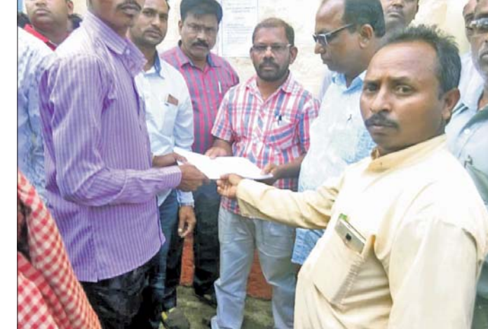
ମାଛକୁସ ପ୍ରକଳ୍ପ ଅଧିକାରୀଙ୍କୁ ଦାବିପତ୍ର ଦିଆଯାଇଛି।

ମାଓବାଦୀ ପ୍ରବଣ ତଥା ଅଧିବାସୀ ବହୁଳ କୋରାପୁଟ ଜିଲ୍ଲାର ଲମତାପୁଟ ବ୍ଲକ ଅନକାଡେଲି ଛାଡି ପ୍ରୋଜେକ୍ଟ ପ୍ରାଥମିକ ସ୍ୱାସ୍ଥ୍ୟକେନ୍ଦ୍ରରେ ଶୁକ୍ରବାର ତାଲା ପକାଇଛନ୍ତି ଗ୍ରାମବାସୀ।