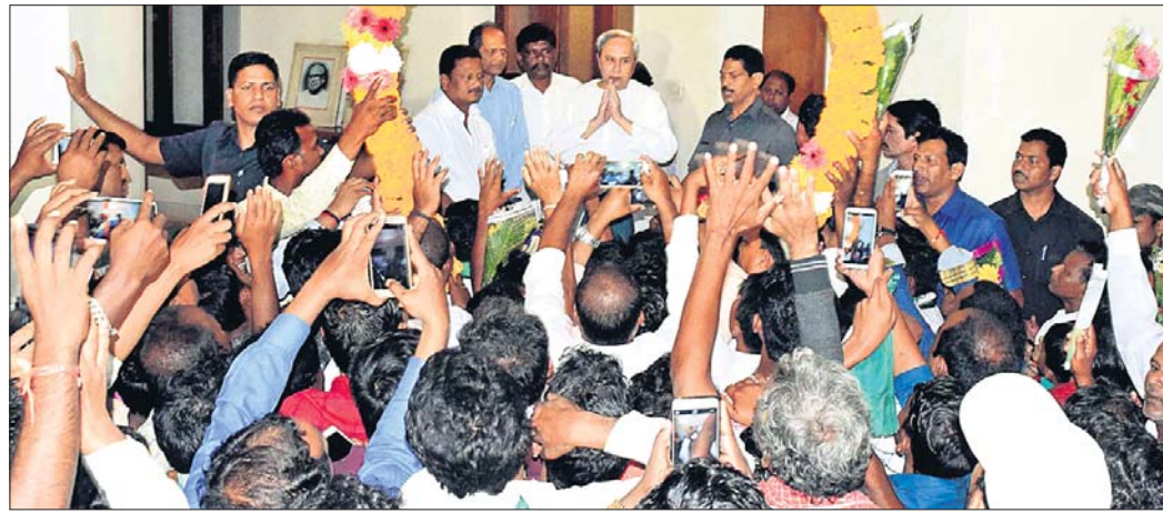
ନବୀନ ନିବାସରେ ମାଲକାନଗିରି, ପୋଲସରା ନିର୍ବାଚନ ମଣ୍ଡଳୀର ବହୁକର୍ମୀ ବିଜେଡିରେ ସାମିଲ ହୋଇଛନ୍ତି।