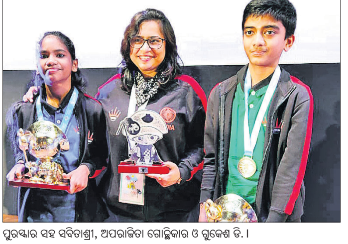
ପୁରସ୍କାର ସହ ସର୍ବତୀର୍ଣ୍ଣା, ଅପରାଜିତା ଗୋଲ୍ଲିକାର ଓ ଗୁଜରାଟି ଡି.।

୧୧ ରାଉଣ୍ଡରୁ ୧୦ ପଦକ ହାସଲ କରି ସ୍ୱର୍ଣ୍ଣ ପଦକ ପାଇଛନ୍ତି। ୨ଟି ସ୍ୱର୍ଣ୍ଣ ପଦକ ମିଳିଥିବାରୁ ଭାରତୀୟ ଫେଡେରେଶନ ୧୦, ୧୨ ବର୍ଷରୁ କମ୍ ବାଳିକା-ବାଳକ) ଉଦ୍‌ଘାଟିତ ହୋଇଛି। ଏହା ଚଳିତ ମାସ ୧୫ ତାରିଖ ପର୍ଯ୍ୟନ୍ତ ଚାଲିଥିଲା। ଏହାର ୬ଟି କାଟେଗୋରିରେ ମୋଟ ୨୧ ଭାରତୀୟ ଖେଳାଳି ଅଂଶଗ୍ରହଣ କରିଥିଲେ। ସେମାନଙ୍କ ମଧ୍ୟରୁ ୧୨ ବର୍ଷରୁ କମ୍ ଓପନରେ ଆଇଏମ୍ ଗୁଜରାଟି, ୧୧ ରାଉଣ୍ଡରୁ ୧୦ ପଦକ ଏବଂ ବାଳିକା କାଟେଗୋରିରେ ସର୍ବତୀର୍ଣ୍ଣା