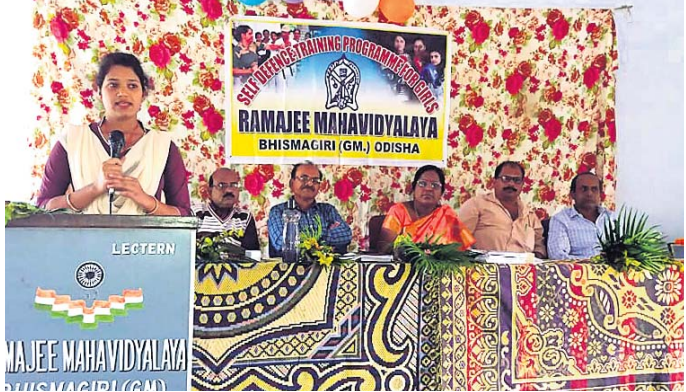
ସଭାରେ ମାଷ୍ଟର ଟ୍ରେନର ଉଦ୍ଘୋଷଣା ଦେଉଛନ୍ତି।