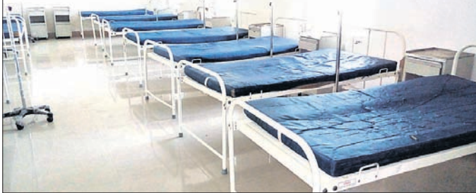
ବଡ଼ ମେଡିକାଲର ସ୍ୱତନ୍ତ୍ର ଡେଲୁ ଖାତ ଶୁକ୍ରବାର ଖାଲି ପଡିଛି ।