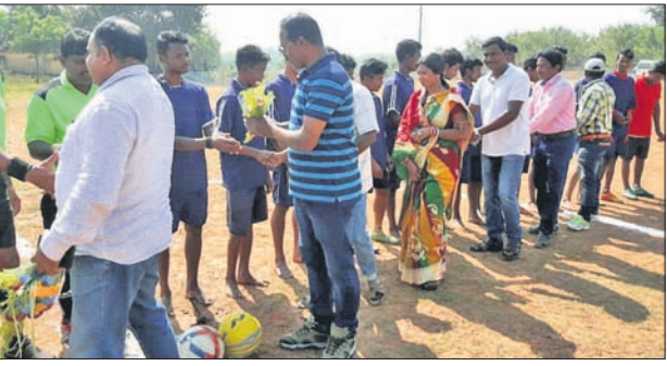
ଅତିଥିକ ରହଣରେ ଖେଳାଳି ।