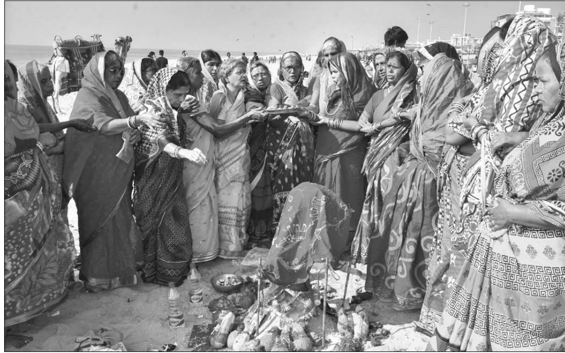
ପୁରୀ ବେଳାକୁମ୍ଭରେ ହରିଷିଆଳିମାନେ ରାଜସ୍ୱାଧିକାରୀଙ୍କ ପୂଜା କରୁଛନ୍ତି।