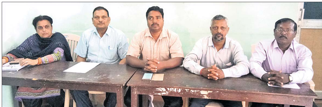
ଖବରଦାତା ସମ୍ମିଳନୀରେ ସିଭିଲ ସୋସାଇଟିର ପ୍ରତିନିଧିମାନେ।

ହୋଇଛି। ଦାରୁ ଫିକ୍ସିରେ ସମ୍ପୂର୍ଣ୍ଣ ଥିବା ବ୍ୟକ୍ତିମାନଙ୍କୁ ରିପୋର୍ଟ କରିବା ସହ ଘଟଣାର ସିବିଆଇ ତଦନ୍ତ କରିବାକୁ ସୋସାଇଟି ପକ୍ଷରୁ ପ୍ରତ୍ୟେକ ସ୍ତରରୁ ଦାବି କରାଯାଇଛି। ଏହାସହ ବ୍ରହ୍ମ ବିଭ୍ରାଟ ତଦନ୍ତ ରିପୋର୍ଟକୁ ସର୍ବସାଧାରଣରେ ପ୍ରକାଶ କରିବା ପାଇଁ ସୋସାଇଟି ଦାବି କରିଛି।