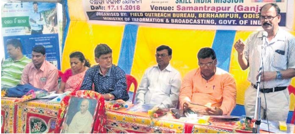
କାର୍ଯ୍ୟକ୍ରମରେ ଉପସ୍ଥିତ ଅତିଥିମାନେ ।