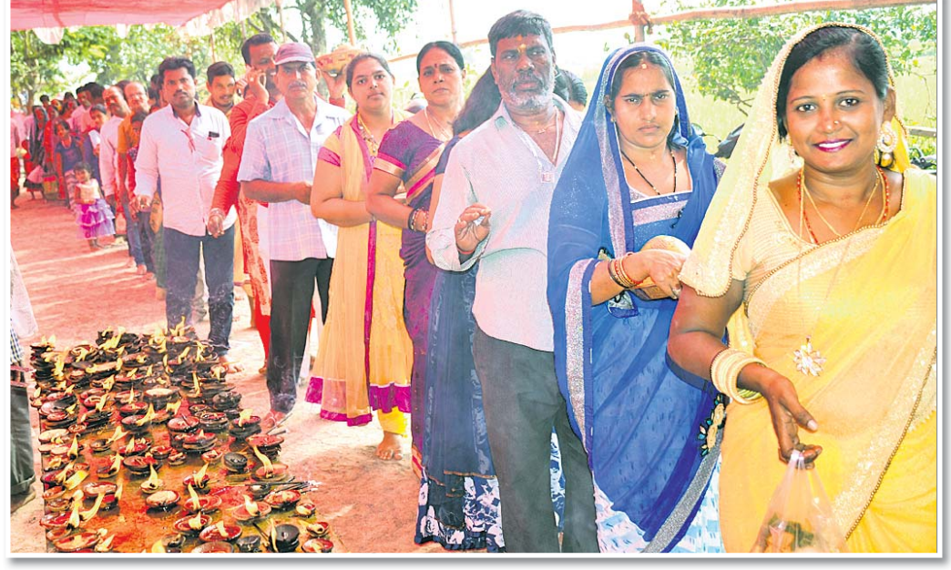
ଗଞ୍ଜାଧରେଶ୍ୱର ମନ୍ଦିରରେ ଭକ୍ତଙ୍କ ଲମ୍ବା ଧାଡ଼ି ।

ବ୍ରହ୍ମପୁର ଅଫିସ୍, ୧୯୧୧-କାର୍ତ୍ତିକ ଶେଷ ସୋମବାର । ବ୍ରହ୍ମପୁର ସମେତ ପାଣ୍ଡି ଅଞ୍ଚଳର ଶୈବପୀଠରେ ହଜାର ହଜାର ଭକ୍ତ ଭିଡ଼ ଜମିଥିଲା । ଦର୍ଶନ ପାଇଁ ଭୋରରୁ ମନ୍ଦିର ମାନଙ୍କରେ ଲମ୍ବାଧାଡ଼ି ଲାଗିଥିଲା ।