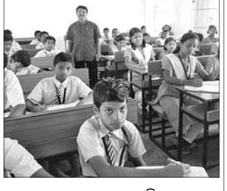
ଛାତ୍ରଛାତ୍ରୀ ପରୀକ୍ଷା ଦେଉଛନ୍ତି।

ପରୀକ୍ଷା ଦେଇଥିଲେ। ୧୭ଶାସ୍ତ୍ର ଶ୍ରେଣୀ ପରୀକ୍ଷାର୍ଥୀଙ୍କ ମଧ୍ୟରୁ ୧୬୪ ଜଣ ପରୀକ୍ଷା ଦେଇଥିଲେ। ସେହିପରି ନବମ ଶ୍ରେଣୀର ୨୦୪ ପରୀକ୍ଷାର୍ଥୀଙ୍କ ମଧ୍ୟରୁ ୧୯୩ଜଣ ପରୀକ୍ଷାରେ ଅଂଶ ଗ୍ରହଣ କରିଥିଲେ।