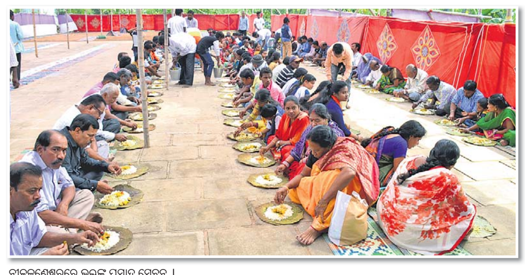
ମାନଙ୍କଶ୍ରେଣୀରେ ଭକ୍ତଙ୍କ ପ୍ରସାଦ ସେବନ ।