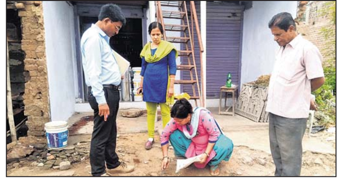
ସାଇଣ୍ଟିଫିକ ଟିମ୍ ନମୁନା ସଂଗ୍ରହ କରୁଛନ୍ତି।