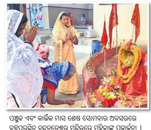
ପଞ୍ଚୁକ ଏବଂ କାର୍ତ୍ତିକ ମାସ ଶେଷ ସୋମବାର ଅବସରରେ ବ୍ରହ୍ମପୁରସ୍ଥିତ ଚନ୍ଦ୍ରବୃତ୍ତେଶ୍ୱର ମନ୍ଦିରରେ ମହିଳାଙ୍କ ପୂଜାର୍ଚ୍ଚନା ।