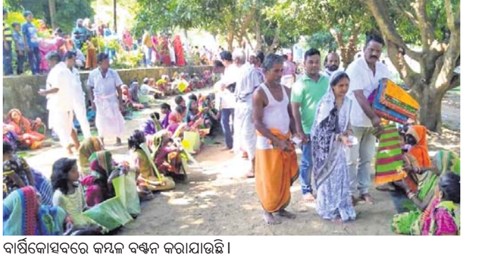
ବାର୍ଷିକୋତ୍ସବରେ କର୍ମକ୍ରମର ସମାପ୍ତି ।

ଆସିକା କଳ୍ପକର୍ତ୍ତୃକ୍ରମ ନିଗମାନନ୍ଦ ଯୋଗାଣ୍ଡମର ବାର୍ଷିକୋତ୍ସବ ଆରମ୍ଭ ହୋଇଛି । ଆସିକା କଳ୍ପକର୍ତ୍ତୃକ୍ରମ ନିଗମାନନ୍ଦ ଯୋଗାଣ୍ଡମର ବାର୍ଷିକୋତ୍ସବ ଆରମ୍ଭ ହୋଇଛି ।