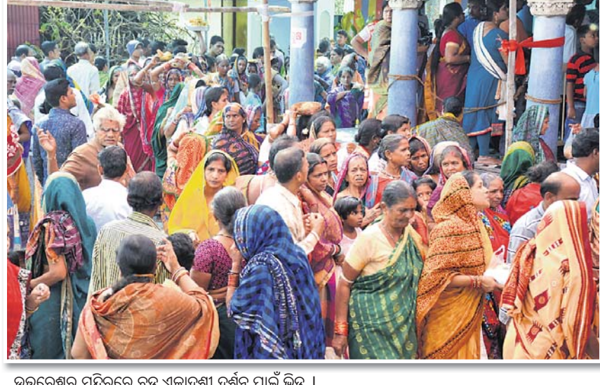
ଭକ୍ତରେଶ୍ୱର ମନ୍ଦିରରେ ବଡ଼ ଏକାଦଶୀ ଦର୍ଶନ ପାଇଁ ଭିଡ଼ ।