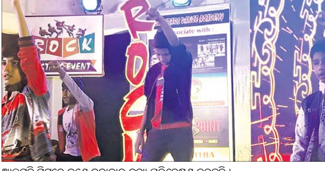
ଆଲୁମ୍ନି ମିଳରେ ଜଣେ କଳାକାର ନୃତ୍ୟ ପରିବେଷଣ କରୁଛନ୍ତି ।

ବ୍ରହ୍ମପୁର ଅଫିସ୍, ୧୯୧୧: ସ୍ଥାନୀୟ ବିକ୍ରମ ପଟ୍ଟନାୟକ ସଂସ୍କୃତି ଭବନରେ ରକ୍ ଷ୍ଟାର୍ ଡ୍ୟାନ୍ସ ଏକାଡେମୀ ପକ୍ଷରୁ ରବିବାର ସନ୍ଧ୍ୟାରେ ଆଲୁମ୍ନି ମିଳ-୨୦୧୮ ଅନୁଷ୍ଠିତ ହୋଇଯାଇଛି । ଏଥିରେ ଡିଏସି ସ୍କୁଲ ଅଧ୍ୟକ୍ଷ ଡା. ଗମ୍ଭୀର ମୁଖ୍ୟ ଅତିଥି ଭାବେ ଯୋଗଦେଇଥିବା ବେଳେ ବିଏଏ ଅଧ୍ୟକ୍ଷ ସୁବାସ ମହାରଣା, ବିକେଟି ଜଗତ କରିଥିବା ବେଳେ ବିଭିନ୍ନ ଦିଗକୁ ଦୃଷ୍ଟିରେ ରଖି ତଦନ୍ତ କରାଯାଇଛି, ଖୁବ୍ ଶୀଘ୍ର ରିପୋର୍ଟ କରାଯିବ ବୋଲି ଡିଆଇଜି ଜଣାଇଛନ୍ତି ।