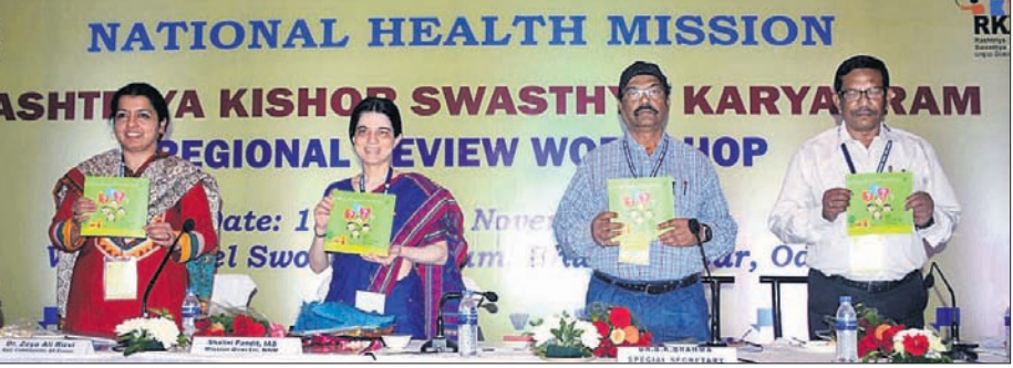
ରାଷ୍ଟ୍ରୀୟ କିଶୋର ସ୍ୱାସ୍ଥ୍ୟମିଶନର ଦୁଇ ଦିନିଆ କର୍ମଶାଳାରେ ଉପସ୍ଥିତ ଅତିଥି