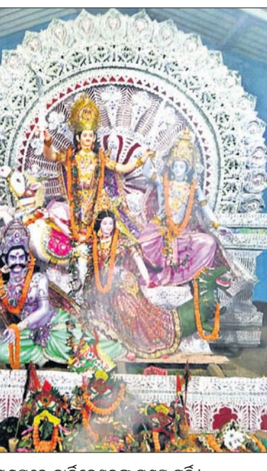
ପଞ୍ଚୁପାଣ୍ଡବ ମଣ୍ଡପରେ କାର୍ତ୍ତିକେଶ୍ୱରଙ୍କ ମୁଖ୍ୟ ମୂର୍ତ୍ତି।

ଡେଭାବିଶ ଜିଲ୍ଲା ପଞ୍ଚାୟତ ସମିତିର ପ୍ରତିନିଧିମଣ୍ଡଳୀ-କରାଣ୍ଡିଆ ଗ୍ରାମାଞ୍ଚଳର ୪୪୧ ନମ୍ବର ମହୋତ୍ସବ ପ୍ରସ୍ତୁତି ବୈଠକ ଉଦ୍ଦେଶ୍ୟରେ ସମାବେଶ ଅନୁଷ୍ଠିତ ହୋଇଯାଇଛି।