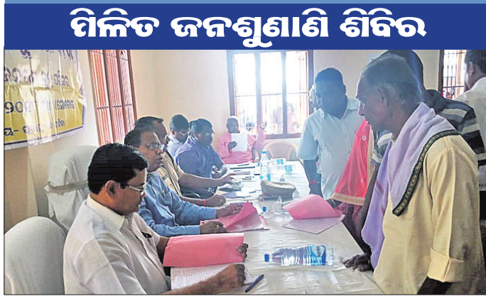
ଶିବିରରେ ପ୍ରଶାସନିକ ଅଧିକାରୀମାନେ ଅଭିଯୋଗ ଶୁଣାଣି କରୁଛନ୍ତି।

ରାଜନଗର ଜିଲ୍ଲା ପଞ୍ଚାୟତ ସମିତିର ପ୍ରତିନିଧିମଣ୍ଡଳୀ-କରାଣ୍ଡିଆ ଗ୍ରାମାଞ୍ଚଳର ୪୪୧ ନମ୍ବର ମହୋତ୍ସବ ପ୍ରସ୍ତୁତି ବୈଠକ ଉଦ୍ଦେଶ୍ୟରେ ସମାବେଶ ଅନୁଷ୍ଠିତ ହୋଇଯାଇଛି।