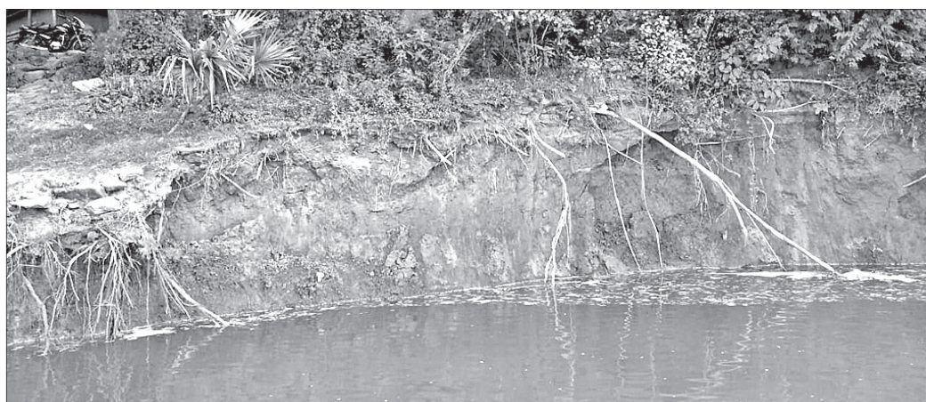
ଲୁଣା ନଦୀବନ୍ଧରେ ଭାଙ୍ଗିଯାଇଥିବା ମାଟି ଅତଡ଼ା।