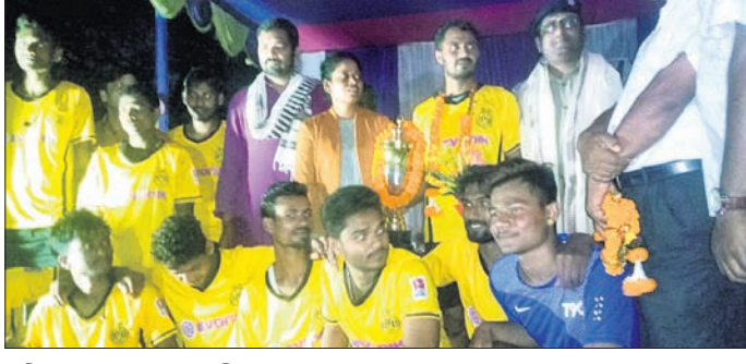
ଅତିଥିଙ୍କୁ ରହଣିରେ ଖେଳାଳିମାନେ।

ଡେଭାବିଶ ଜିଲ୍ଲା ପଞ୍ଚାୟତ ସମିତିର ପ୍ରତିନିଧିମଣ୍ଡଳୀ-କରାଣ୍ଡିଆ ଗ୍ରାମାଞ୍ଚଳର ୪୪୧ ନମ୍ବର ମହୋତ୍ସବ ପ୍ରସ୍ତୁତି ବୈଠକ ଉଦ୍ଦେଶ୍ୟରେ ସମାବେଶ ଅନୁଷ୍ଠିତ ହୋଇଯାଇଛି।