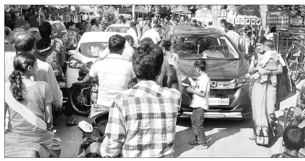
ଗୋରେଖନାଥ ପ୍ରବେଶ ପଥରେ ରାସ୍ତା କାମ ।

କାର୍ତ୍ତିକ ମାସ ଦଶମୀ ତିଥି ରବିବାରରେ ରଘୁନାଥପୁର ବ୍ଲକ୍ ଛପଡା ପଞ୍ଚାୟତ କେରେକୋରାସ୍ଥିତ ପ୍ରଭୁ ଗୋରେଖନାଥ ପୀଠ ହୋଇ ଉପୁଥିଲା ଚଳତଃଆମ ପ୍ରାୟ ୧୦ ହଜାର ଶ୍ରଦ୍ଧାଳୁଙ୍କ ଆଗମନ ପୀଠ ମଧ୍ୟକୁ ହୋଇଥିଲା। ବିଶେଷକରି