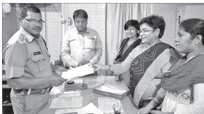
ଆଇଏଚ୍ଆର୍ସିର ପକ୍ଷରୁ ପଟ୍ଟାପୁର ଆନାରେ ଅଭିଯୋଗ କରାଯାଇଛି।