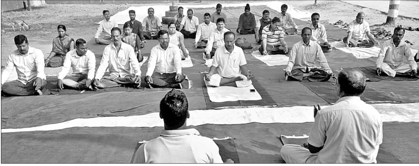
ବିରିଡ଼ି ଗୋଷ୍ଠୀ ସ୍ୱାସ୍ଥ୍ୟକେନ୍ଦ୍ର ପକ୍ଷରୁ ଆୟୋଜିତ ଯୋଗ ଶିକ୍ଷା ଶିବିରରେ ଉପସ୍ଥିତ ଯୋଗଶିଳ୍ପକ ଓ ଶିବିରୀୟା ।

ବାଲି, କ୍ରୋମ ପଥର, କୋଇଲା, ଲୁହା ପଥର ଆଦି ପରିବହନ କରୁଥିବା ଟ୍ରକ୍, ଟିସ୍ପର ଓ ୬ ଚଳିଆ ଯାନ ଚଳାଚଳ କରୁଛି।