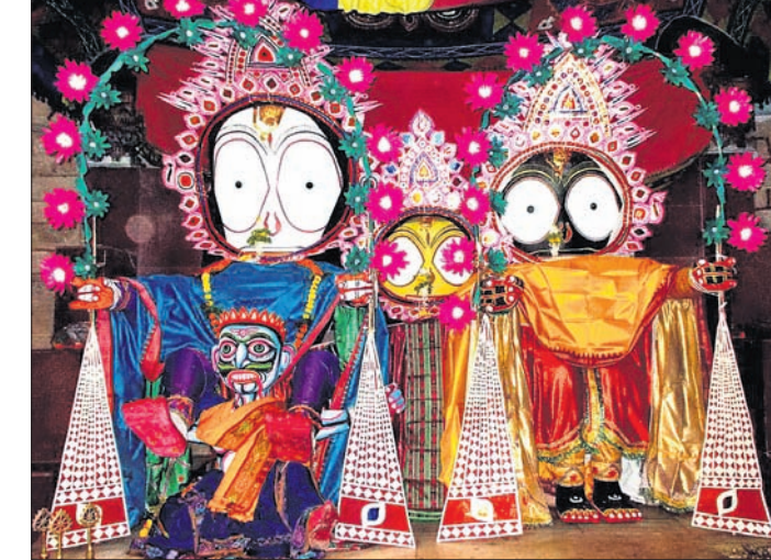
ପ୍ରଳୟାସୁର ବଧ ବେଶରେ ଦର୍ଶନ ଦେଲେ ଶ୍ରୀଚାରୀ।