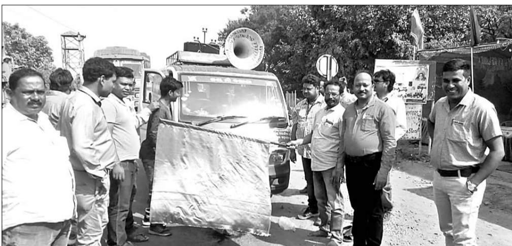
ଡାକବାଜି ଯନ୍ତ୍ର ସାହାଯ୍ୟରେ ସଚେତନତା ସୃଷ୍ଟି କରାଯାଇଛି।

ବଡ଼ଗାଁ, ୧୯।୧୧ (ଡି.ଏନ.ଏ)- ସୁନ୍ଦରଗଡ଼ ଜିଲ୍ଲା ବଡ଼ଗାଁ ଚଳାଚଳ ପଡ଼ାରେ ନିରନ ତନସନା (୪୫)ଙ୍କୁ ଗୁଳିମାଡ଼ ଘଟଣାରେ ବାମନା ବୁକ ଅନ୍ତର୍ଗତ ଏକ ଗ୍ରାମର ଜଣେ ଦୁର୍ଘାତ ଅପରାଧୀ ସମ୍ପୂର୍ଣ୍ଣ ଥିବା ବିଶେଷ ସୂଚନା ମିଳିଛି।