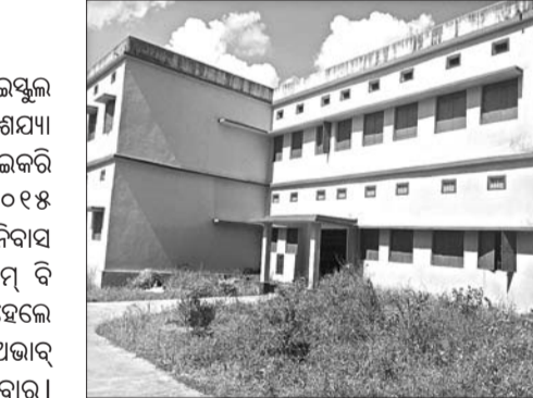
ଡ଼ିପ୍ଲୋମା ସରକାରୀ ବାଳିକା ହାଇସ୍କୁଲ ପରିସରରେ ତିଆରି ହେଇଥିବା ଛାତ୍ରୀ ନିବାସ।

ବଲାଙ୍ଗୀର ଜିଲ୍ଲା ଉନ୍ନତ ସରକାରୀ ବାଳିକା ହାଇସ୍କୁଲ ପରିସରରେ ତିଆରି ହେଇଥିବା ଛାତ୍ରୀ ନିବାସ ଉଦଘାଟନ କରାଯାଇଛି।