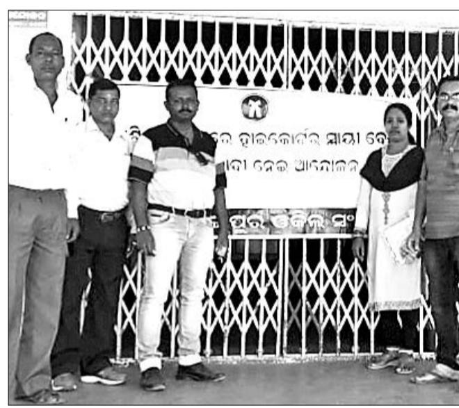
ବଡ଼ଗାଁର ଅଫିସ ବନ୍ଦ କରାଯାଇଛି।

ବଡ଼ଗାଁ, ୧୯।୧୧ (ଡି.ଏନ.ଏ) ଘଣ୍ଟା ପର୍ଯ୍ୟନ୍ତ ସମସ୍ତ ଦୋକାନ ବନ୍ଦ ହୋଇଥିଲା। ତେବେ ୧୯ ରୁ ୨୮ ତାରିଖ ପର୍ଯ୍ୟନ୍ତ ଶିକ୍ଷାବ୍ୟବସ୍ଥାକୁ ଆନ୍ଦୋଳନରୁ ମୁକ୍ତ ରଖିବେ ଓ ସ୍ୱାଭାବିକ ଭାବେ ଚାଲିବ।