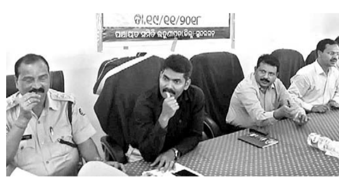
ଜନଶୁଣାଣି କାର୍ଯ୍ୟକ୍ରମରେ ମଞ୍ଚାଧୀନ ଅଧିକାରୀ।