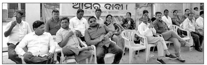
ଜିଲ୍ଲା କୋର୍ଟ ସମ୍ମୁଖରେ ଓକିଲମାନେ ଧାରଣାରେ ବସିଛନ୍ତି।