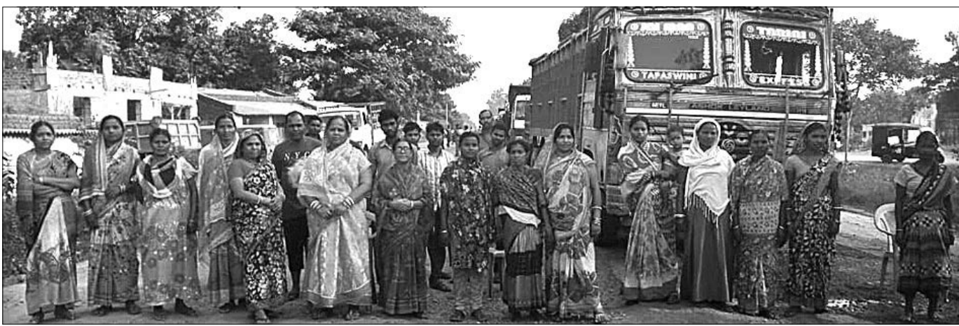
ରୁଡ଼ିଆଳି ଗ୍ରାମର ମହିଳାମାନେ ରାସ୍ତାରେକୋ ଆନ୍ଦୋଳନ କରିଛନ୍ତି।

ରାଜଗାଙ୍ଗପୁର, ୧୯।୧୧ (ଡି.ଏନ.ଏ)- ସୁନ୍ଦରଗଡ଼ ଜିଲ୍ଲା ରାଜଗାଙ୍ଗପୁର ଅବକାରୀ ବିଭାଗ ପକ୍ଷରୁ କୁଡ଼ା ଓ ରାଜଗାଙ୍ଗପୁର ଅଞ୍ଚଳରେ ଚଢ଼ାଉ କରାଯାଇଥିଲା।