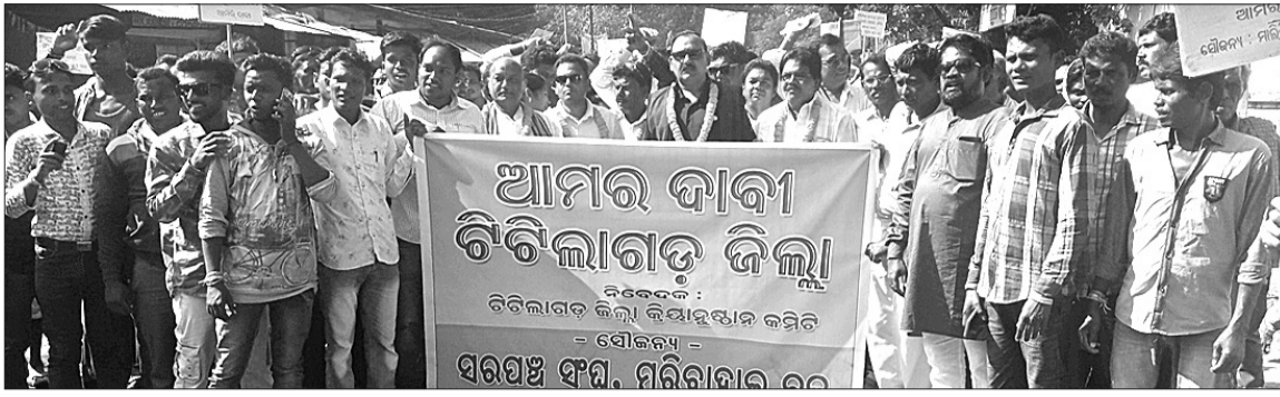
ଚିତିଲାଗଡ଼ ଜିଲ୍ଲା ଗଠନ ଦାବିରେ ଧାରଣାରେ ବସିଥିବା କମିଟି କର୍ମକର୍ତ୍ତାଙ୍କ ସହ ପୁରୀବାହାଳବାସୀ।

ବୁର୍ଥାରେ ନାଳିଆ ଯାତ୍ରା ସମ୍ପନ୍ନ: ପୀଠରେ ଶ୍ରୀକାଳୁଙ୍କ ଭିଡ଼