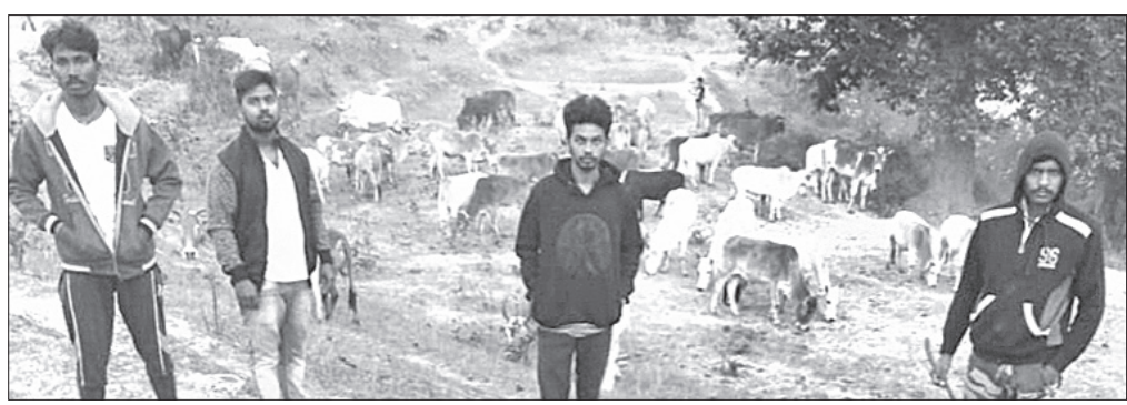
ସାହାଜବାହାଲ- ଜିଞ୍ଜିରକେଲା ରାସ୍ତାରେ ବଜରଙ୍ଗ ଦଳ କର୍ମୀ ଗାଈ ବଳଦ ଅଟକାଇଛନ୍ତି ।

ବଡ଼ଗାଁ ବିଲଡିଂ ନାମରେ ସ୍କୁଲକୁ ଚିଠି କରାଯାଇଥିବା ଜଣାପଡ଼ିଛି। ସୁନ୍ଦରଗଡ଼, ଜିଲ୍ଲାର ୧୦ଟି ଗ୍ରାମ, ସହରରେ ସ୍କୁଲ ଓ ବିଲଡିଂ ତାଲିମ କେନ୍ଦ୍ର ଖୋଲି ଅଧ୍ୟକ୍ଷ ଶହେରୁ ଉର୍ଦ୍ଧ୍ୱ ଦିନ ପରେ ଜିଲ୍ଲାପାଳଙ୍କ ନିର୍ଦ୍ଦେଶକ୍ରମେ ଆସନ୍ତା ମାସ ୬ ତାରିଖ ଡବଡ଼ ପାଇଁ