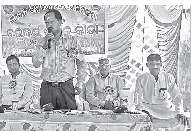
ସରସ୍ୱତୀ ଶିଶୁ ମନ୍ଦିର ବାର୍ଷିକ କ୍ରୀଡ଼ା ସମାରୋହରେ ମଞ୍ଚାସୀନ ଅତିଥି ।

ବଡ଼ଗାଁ, ୨୦୧୧ (ଡି.ଏନ୍.ଏ) - ସୁନ୍ଦରଗଡ଼ ଜିଲ୍ଲା ବଡ଼ଗାଁ ଥାନା ଅନ୍ତର୍ଗତ ଭୁଟାଳଗା ବସଷ୍ଟାନ୍ଡ ନିକଟରୁ ପ୍ରାୟ ଅଧ ବି.ମି ଦୂର ରଙ୍ଗବତୀ ଡ୍ରାବା ପାଖ ରାଜ୍ୟ ରାଜପଥ-୧୦ରେ ମଙ୍ଗଳବାର ସନ୍ଧ୍ୟା ୬ଟାରେ ଦୁର୍ଘଟଣା ଘଟିଛି। ଏଥିରେ ଜଣେ ଯୁବକଙ୍କ ମୃତ୍ୟୁ ଘଟିଛି।