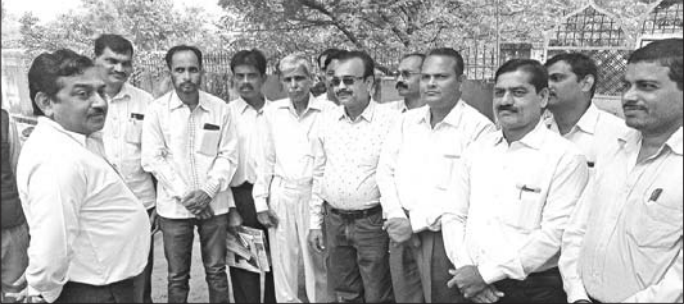
ସୁବର୍ଣ୍ଣପୁର ସିଲିକ୍ କୋର୍ଟ ସମ୍ମୁଖରେ ଆଇନଜୀବୀମାନେ ବିଚାରପତିଙ୍କ ବାଟ ବରାକୁଛନ୍ତି।

ସର୍ବୋଚ୍ଚ ନ୍ୟାୟାଳୟର ପ୍ରକାଶନ କେଶ୍‌ବର ଉଦ୍‌ଘାଟନ ହେଉଛି ଆଇନଜୀବୀମାନେ ବିଚାରପତିଙ୍କ ବାଟ ବରାକୁଛନ୍ତି।