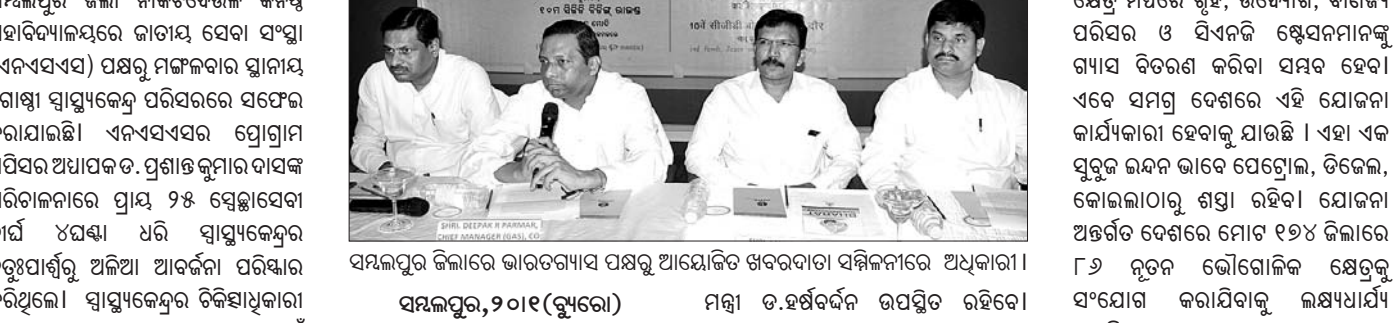
ସମ୍ବଲପୁର ଜିଲ୍ଲାରେ ଭାରତଗାଧୀ ପକ୍ଷରୁ ଆୟୋଜିତ ଖବରଦାତା ସମ୍ମିଳନୀରେ ଅଧିକାରୀ ।

- ଭିତ୍ତି ଓ କନ୍ଦର୍ପରେଷ୍ଟି କରିଆରେ ପ୍ରଧାନମନ୍ତ୍ରୀ କରିବେ ଉଦଘାଟନ