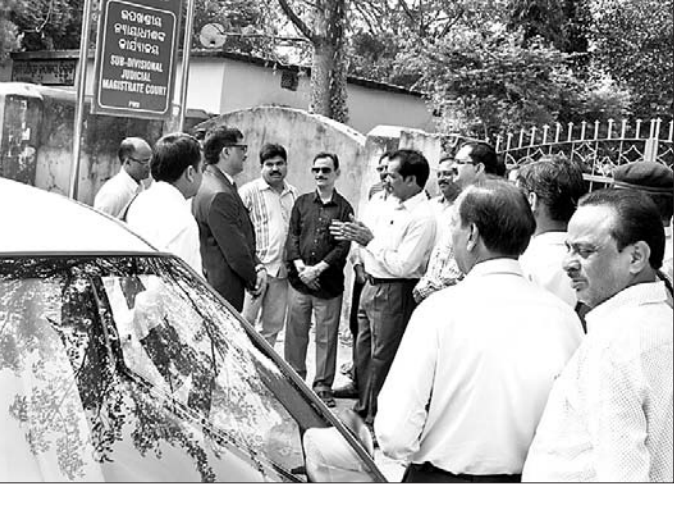
ବିଚାର ବିଭାଗୀୟ ଅବାଳିତ ଫାଟକରେ ତାଲିକା ପକାଇବା ସହ ଜିଲ୍ଲା ଦୌରାଜନ୍ତୁଙ୍କ ତଥା ଅନ୍ୟାନ୍ୟ ବିଚାରପତିମାନଙ୍କୁ ଫେରିଯିବା ପାଇଁ ନିବେଦନ କରାଗଲା ବାରମହାରାଜପୁର ସଦର ମହକୁମାରେ।

ପଶ୍ଚିମ ଓଡ଼ିଶା ଓକିଲ ସଂଘ ସମୂହ ଓ କେନ୍ଦ୍ରୀୟ କ୍ରିୟାଶୀଳ କମିଟି (ସିଏସ୍‌ସି)ର ଆହ୍ୱାନକ୍ରମେ ହାଇକୋର୍ଟର ସ୍ଥାୟୀ ବେଞ୍ଚ ପ୍ରତିଷ୍ଠା ଦାବି ନେଇ ବିଭିନ୍ନ ସ୍ଥାନରେ ଜାରି ରହିଥିବା ଆଇନଜୀବୀମାନଙ୍କ ପିକେଟିଂ ଆନ୍ଦୋଳନ ମଙ୍ଗଳବାର ବିଚାର ବିଭାଗୀୟ ଦିନରେ ପହଞ୍ଚିଛି।