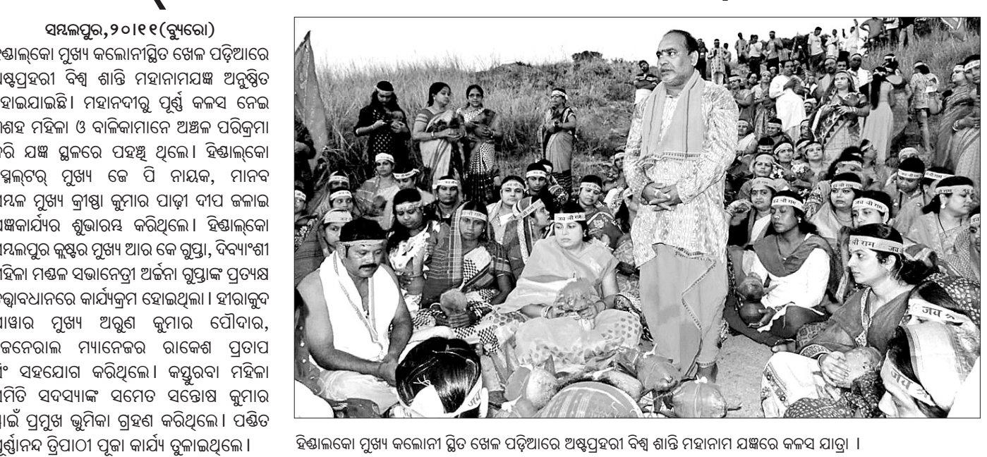
ହିନ୍ଦୁଲକ୍ଷେ କଲୋନୀର ଗେଳ ପଡ଼ିଆରେ ଅଷ୍ଟପ୍ରହରା ବିଶ୍ୱଶାନ୍ତି ଯଜ୍ଞରେ କନ୍ୟା ଯାତ୍ରା ।