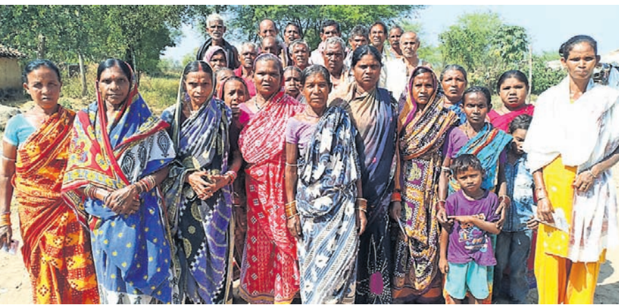
ଭତା ପାଏବାରୁ ବର୍ତ୍ତତ୍ ହେଇଥିବାର ଚିଲିଚିଲି ଗାଁର ହଜ୍ଜିଆର ହିତାଧିକାରୀମାନେ।

ସରକାର ରୁକ୍ଷରୁଟା, ବିଧବା, ଭିକ୍ଷାମୀମାନଙ୍କର ଲାଗି ଭିନ୍ନ ଭିନ୍ନ ଉପକ୍ରମ ତିଆରି କରି କୋଟି କୋଟି ଟଙ୍କା ଖର୍ଚ୍ଚ କରୁଛନ୍ତି। ହେଲେ କଳାହାଣ୍ଡି ଜିଲ୍ଲାରେ ଆଏକ୍ ବି ଏନ୍‌ଡ଼ା ବହୁରଫ ଗାଁ ଅଞ୍ଚଳ ଯେଉଁଠି ଲ ଏକ ସରକାରୀ ଯୋଜନାମାନ ଅପହର୍ତ୍ତ ହେଇ ରହିଛି। ଏନ୍‌ଡ଼ା ଗୁଡ଼େ ଉଦାହରଣ ଦେଖାଯାଉଛି ଯେଉଁଠି ମିଲିଛେ କଳାହାଣ୍ଡି ଜିଲ୍ଲା ଧର୍ମଗତ ରୁକ୍ଷ ଚିଲିଚିଲି ଗାଁରେ। ଇ ଗାଁରେ ଆଏକ୍ ବି ୩୦୦ ଅଧିକ ହଜ୍ଜିଆର ହିତାଧିକାରୀ ଯୋଜନାର ଗୁଫଳ ପାଏବାରୁ ବର୍ତ୍ତତ୍ ହେଇଛି।