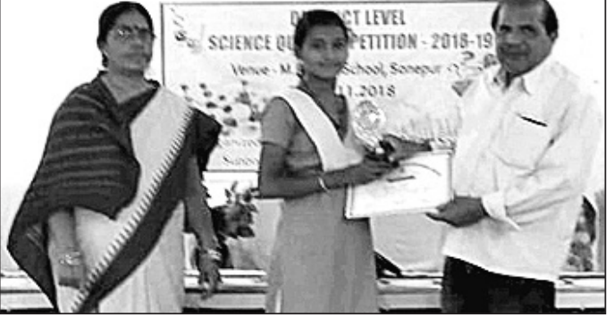
ଜିଲ୍ଲାସ୍ତରୀୟ ବିଜ୍ଞାନ କୁଳଜ୍ ପ୍ରତିଯୋଗିତାରେ ଶ୍ରେଷ୍ଠ ବିବେଚିତ ଛାତ୍ରଙ୍କୁ ପୁରସ୍କୃତ କରାଯାଇଛି।

ସୁବର୍ଣ୍ଣପୁର ଜିଲ୍ଲା ସ୍କୁଲ ଓ ଗଣଶିକ୍ଷା ବିଭାଗ ପକ୍ଷରୁ ମଙ୍ଗଳବାର ଆୟୋଜିତ ଜିଲ୍ଲାସ୍ତରୀୟ ବିଜ୍ଞାନ କୁଳଜ୍ ପ୍ରତିଯୋଗିତାରେ ବାରମହାରାଜପୁର ବ୍ଲକ୍ ୨ଟି ସଫଳତା ମିଳିଛି।