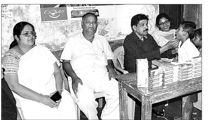
ସମ୍ବଲପୁର ଦୁଇପଡ଼ା ସ୍କୁଲରେ ଦକ୍ଷ ଚିକିତ୍ସା ଶିବିର ।