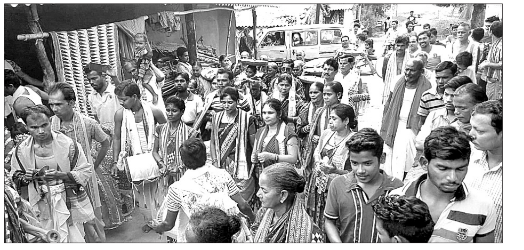
ବାରମହାରାଜପୁର ବ୍ଲକ୍ ବୁରୋପାଟ ଗ୍ରାମବାସୀ ନାମ ସଂକୀର୍ତ୍ତନ ଭିତରେ ଗ୍ରାମ ପରିକ୍ରମା କରୁଛନ୍ତି।

ସୁବିଧା ସୁଯୋଗରୁ ବଞ୍ଚିତ ହେଉଥିବା ଅଭିଯୋଗ ହେଉଛି। ଅଧିକାରୀମାନେ ଜୁଟିରେ ରହିଲେ ଶିକ୍ଷକମାନେ ବରମା ପାଇବାରୁ ବଞ୍ଚିତ ହେବା ସହ ଛାତ୍ରଛାତ୍ରୀମାନେ ଅସୁବିଧା ଭୋଗିବେ।