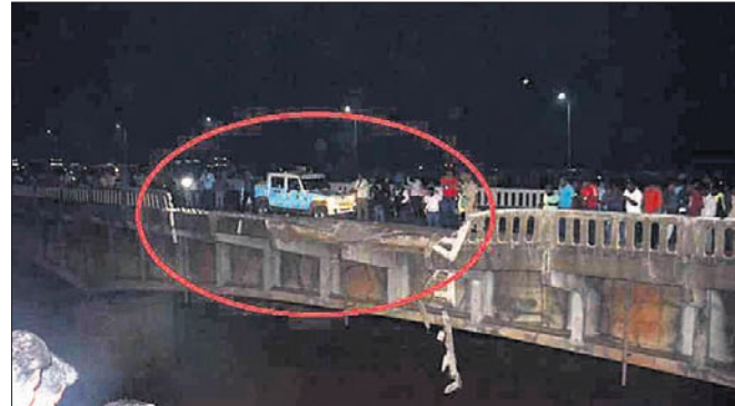
ବସ୍ ଖସିଥିବା ପୋଲର ଅଂଶ ।

କଟକ ଅପ୍ରେଲ, ୨୦୧୧ କଟକ-କଟକପୁର ମହାନଦୀ ପୋଲ ଉପରେ ମଙ୍ଗଳବାର ସନ୍ଧ୍ୟାରେ ଘଟିଛି ଏକ ମର୍ମହୀନ ସଡ଼କ ଦୁର୍ଘଟଣା । ଜଗନ୍ନାଥ ନାମକ ଏକ ଯାତ୍ରାବାହୀ ବସ୍ ନଦୀକୁ ଖସି ପଡ଼ିବାରୁ ୧୨ଜଣଙ୍କ ମୃତ୍ୟୁ ଘଟିଥିବାବେଳେ ୪୦ରୁ ଊର୍ଦ୍ଧ୍ଵ ଆହତ ହୋଇଛନ୍ତି । ଦୁର୍ଘଟଣାଗ୍ରସ୍ତ ବସ୍ (ଓଡ଼ିଶା-୧-୦୨୧୧)ଟି ଡାକ୍ତରଖାନାକୁ ଭୁବନେଶ୍ଵର ଅଭିମୁଖେ ଆସୁଥିଲା । ପୋଲ ଉପରେ ଏକ ମଲ୍ଟିଷ୍ଟକ୍ସ ଧକ୍କା ଦେବାପରେ ବସ୍ଟି ଭାରସାମ୍ୟ ହରାଇ ପୋଲର ବାହାର ଭାଙ୍ଗି ମହାନଦୀକୁ ଖସି ପଡ଼ିଥିଲା । ଆହତଙ୍କ ମଧ୍ୟରେ ଜଣେ ଶିଶୁ ଥିବାବେଳେ ୧୦ରୁ ଊର୍ଦ୍ଧ୍ଵ ଗୁରୁତର ଅଛନ୍ତି । ସେମାନଙ୍କୁ ଚିକିତ୍ସା