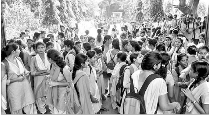
ସତ୍ୟବାଇ ମହିଳା ମହାବିଦ୍ୟାଳୟରେ ବେଶାଦେଇଥିବା ଉତ୍ତରଜନ।