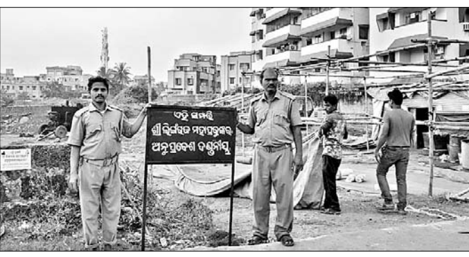
ଯୁକ୍ତିତର୍କ ହୋଇଥିଲା। ପରେ ଉତ୍ତରଜନ ଆଲୋଚନା ହୋଇଥିଲା। ଗତାଦିନ ପୋଲିସ୍ ଜରିମାନା ଦେଖାଦେଇଥିଲା।

ଭୁବନେଶ୍ୱର ଏୟାରପୋର୍ଟ ଆସିଥିଲେ। ବିମାନ ଆସିବାକୁ ବିଳମ୍ବ ଥିବାରୁ ପରିବାର ଲୋକେ ଏୟାରପୋର୍ଟ ଛକରେ ଥିବା ସାଇକେଲ ଟ୍ରାକ୍ ଉପରେ କାର ପାର୍ଟି କରି ଭିତରେ ବସିଥିଲେ। ଏହି ସମୟରେ ୪ ଜଣ ଟ୍ରାଫିକ୍ ପୋଲିସ୍ କର୍ମଚାରୀ ଆସି ସେମାନଙ୍କୁ ଉଠାଇବା ସହ ନୋ ପାର୍ଟି କରିବାକୁ ଆଦାୟ କରାଯିବ ବୋଲି ପୋଲିସ୍ କହିଥିଲେ। ହେଲେ ପୋଲିସ୍ ଏହି ନିୟମକୁ କଡ଼ାକଡ଼ି କରିନାହିଁ। କୌଣସି ଗୋଟିଏ ଏକେ ଲୋକଙ୍କୁ ସର୍ବକ୍ଷମା କରାଇ ସୂଚନାଫଳକ ଲାଗା ନାହିଁ। ଏଭଳି କ୍ଷେତ୍ରରେ ମଙ୍ଗଳବାର ମଧ୍ୟାହ୍ନ ୧୨ଟାରେ ଏକ ପରିବାର ପାରାଦୀପକୁ ନିଜ ସମ୍ପର୍କୀୟଙ୍କୁ ନେବା ଲାଗି