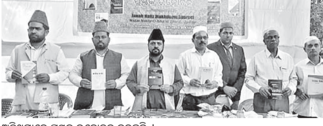
ଅତିଥିମାନେ ପୁସ୍ତକ ଉନ୍ମୋଚନ କରୁଛନ୍ତି ।