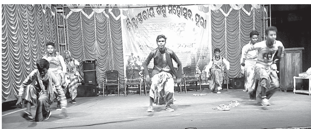
ଜିଲ୍ଲାସ୍ତରୀୟ ସର୍ବଗଫୁଲ ମହୋତ୍ସବର ଉଦ୍‌ଘାଟନ ଦିନରେ କୁନି କୁନି ଛାତ୍ରମାନେ ନୃତ୍ୟ ପରିବେଷଣ କରୁଛନ୍ତି।