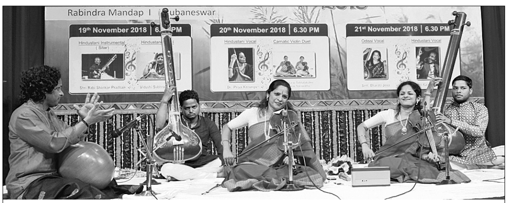
ରବୀନ୍ଦ୍ର ମଣ୍ଡପଠାରେ ମଙ୍ଗଳବାର ଆୟୋଜିତ ଭୁବନେଶ୍ୱର ମ୍ୟୁଜିକ୍ ସର୍କଲର ବାର୍ଷିକ ସଙ୍ଗୀତ ମହୋତ୍ସବରେ ଶିଳ୍ପୀଙ୍କ ବାଦ୍ୟ ପରିବେଷଣ।