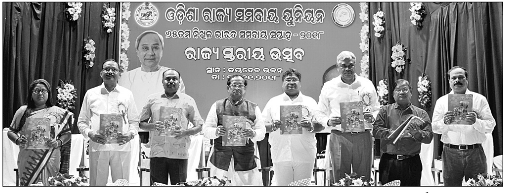
ସୂଚନା ଭବନଠାରେ ଆୟୋଜିତ ୬୫ତମ ସମବାୟ ସମ୍ବନ୍ଧରେ ରାଜ୍ୟସ୍ତରୀୟ ଉତ୍ସବରେ ଅତିଥିମାନେ ପୁସ୍ତକ ଲୋକାର୍ପଣ କରୁଛନ୍ତି।

ଗଣପୁଣ୍ୟ ନିକଟ ସତ୍ୟବାଇ ମହିଳା ମହାବିଦ୍ୟାଳୟରେ ବିଭିନ୍ନ ସମସ୍ୟା ନେଇ ମଙ୍ଗଳବାର ଉତ୍ତରଜନା ଦେଖାଦେଇଥିଲା। ଶତାଧିକ ଛାତ୍ରୀ ମହାବିଦ୍ୟାଳୟ ମୁଖ୍ୟ ଗେଟ୍ ଆଗରେ ଧାରଣା ଦେବା ସହ ଗଣପୁଣ୍ୟ-ପୋଖରୀପୁଟ୍ ଗାୟାରୋକୋ କରିଥିଲେ। କଲେଜ କର୍ତ୍ତୃପକ୍ଷ ଓ ଏୟାରଫିଲ୍ଡ ଥାନା ପୋଲିସ୍ ଛାତ୍ରୀମାନଙ୍କ ସହ ଆଲୋଚନା କରିବା ପରେ ଅପରାହ୍ନରେ ଛାତ୍ରୀମାନେ ଧାରଣାକୁ ହଟି ଥିଲେ।