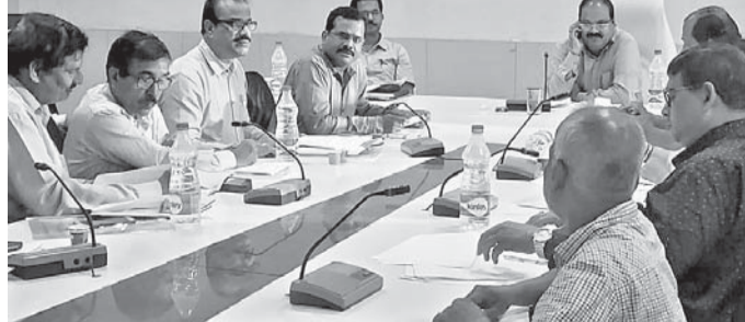
ବୈଠକରେ ଜିଲାପାଳଙ୍କ ସହ ଅନ୍ୟମାନେ ।

ରାଜ୍ୟ ସରକାରଙ୍କ ନିର୍ଦ୍ଦେଶ ମୁତାବକ ଖୋର୍ଦ୍ଧା ଜିଲ୍ଲାରେ କୃଷକ ସମ୍ପର୍କ ଅଭିଯାନ ନଭେମ୍ବର ମାସରୁ ଫେବୃୟାରୀ ପର୍ଯ୍ୟନ୍ତ ଆରମ୍ଭ ହେବାକୁ ଯାଉଛି ।