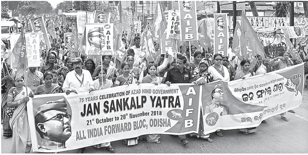
ଜନସମ୍ପର୍କ ଯାତ୍ରାରେ ଯୋଗ ଦେଇଥିବା ଅଲ୍ ଇଣ୍ଡିଆ ଫରୱାଦି ବ୍ଲକ୍ କର୍ମୀମାନେ।