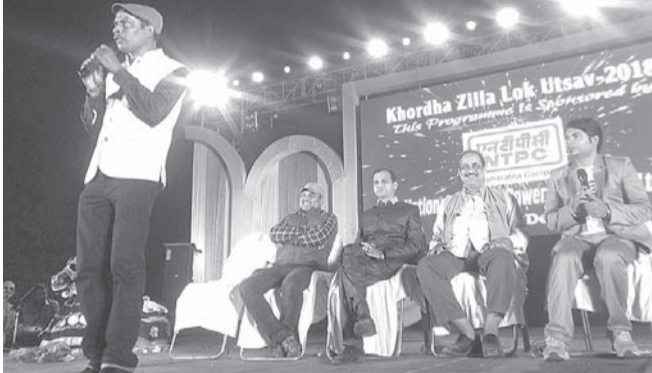
ବ୍ୟଙ୍ଗକବି ବ୍ରଜ ସୁବ୍ରହ୍ମଣ୍ୟ କବିତା ଆବୃତ୍ତି କରୁଛନ୍ତି ।

ଆଶ୍ୱାସନ ପକ୍ଷରୁ ଖୋର୍ଦ୍ଧା ସହରର ଗୁରୁକଳ୍ପ ପଡ଼ିଆରେ ଚାଲିଛି ଖୋର୍ଦ୍ଧା ଜିଲ୍ଲା ଲୋକ ଉତ୍ସବ ।