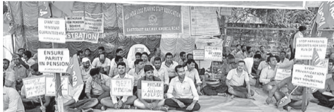
ରେଳସେର ଲୋକୋ ପାଇଲଟ୍ ଓ ଆସିଷ୍ଟାଣ୍ଟ ପାଇଲଟମାନେ ବିସ୍ତୋଭ କରୁଛନ୍ତି ।

କଟକ ୨୦୧୧ (ଡି.ଏନ.ଏ.) ବିଭିନ୍ନ ଦାବି ନେଇ ଅଲ୍ ଇଣ୍ଡିଆ ରେଲୱେ ଲୋକୋ ରନିଂ ଷ୍ଟାଫ୍ ଆସୋସିଏଶନ୍ ଖୋର୍ଦ୍ଧାରେ ଶାଖା ପାଖରୁ ମଙ୍ଗଳବାର ଏଠାରେ ବିସ୍ତୋଭ ପ୍ରଦର୍ଶନ କରାଯାଇଥିଲା ।