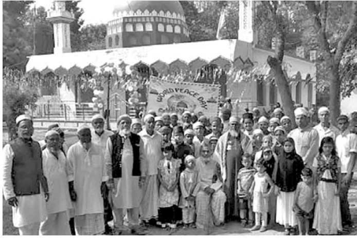
ମହମ୍ମଦ ଜୟନ୍ତୀ ଉପଲକ୍ଷେ ବାହାରିଥିବା ଶୋଭାଯାତ୍ରା।