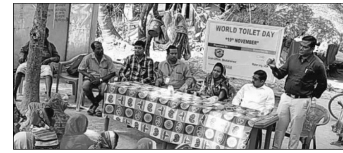
କେରଡାଗଡ଼ଠାରେ ଅନୁଷ୍ଠିତ ସଭା।

ସେକ୍ସାସେବା ଅନୁଷ୍ଠାନ ଗ୍ରାମ ଉଦ୍‌ଥାନ ପକ୍ଷରୁ କେରଡାଗଡ଼ଠାରେ ଯୋଜନାରେ ବିଶ୍ୱ ଶୌଚାଳୟ ଦିବସ ପାଳିତ ହୋଇଯାଇଛି।