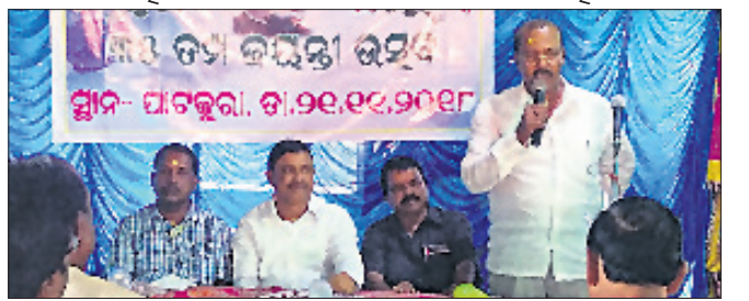
ସ୍ମୃତିଚାରଣ ସଭାରେ ମାଆଧ୍ୟାନ ଅତିଥିମାନେ।