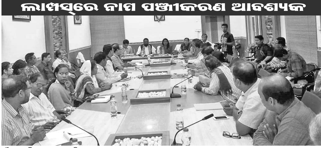
ଲାଖିସ୍ୱରେ ନାମ ସଞ୍ଚାୟନ ଆବଶ୍ୟକ

କନ୍ଧମାଳ ଜିଲ୍ଲାରେ ଚଳିତ ଖରିଫ ଋତୁରେ ଜିଲାପ୍ରମାଣ ଧାର ସଂଗ୍ରହ କର୍ମରେ ଏକ ପ୍ରସ୍ତୁତି ବୈଠକ ରୁପରେ ଜିଲାପାଳଙ୍କ ସହାୟକତା ସଭା ବୃତ୍ତରେ ଅନୁଷ୍ଠିତ ହୋଇଥିଲା ।