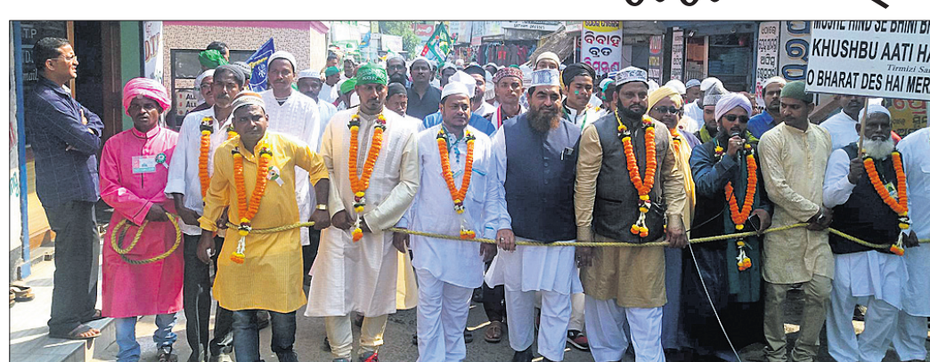
ମହାନଦୀ ଉତ୍ସବରେ ସହର ମଧ୍ୟରେ ପୁସ୍ତକମାନ ସମ୍ପ୍ରଦାନ ପକ୍ଷରୁ ଶୋଭାଯାତ୍ରା।

କେନ୍ଦ୍ରାପଡ଼ା କୋଅପରେଟିଭ ସୋସାଇଟିକୁ ରାଜ୍ୟସ୍ତରୀୟ ସମ୍ମାନ ପ୍ରଦାନ କରାଯାଇଛି।