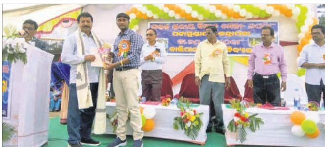
ମଣ୍ଡଳସ୍ତରୀୟ ବିଜ୍ଞାନ ମେଳାରେ ଅତିଥିମାନେ।