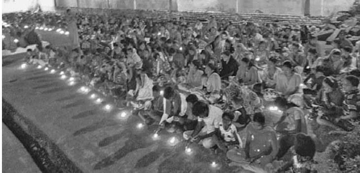
ରାଉତପଡ଼ା ମନ୍ଦିରରେ ଭକ୍ତମାନଙ୍କ ଉପସାଧନ ।

ଗହଳି ଲାଗି ରୁହୁଥିବା ଦେଖାଯାଇଛି । ରାଉତପଡ଼ାରେ ଭୋକେଶ୍ୱର ପୀଠରେ ବାର୍ଦ୍ଧକ ମାସ୍ୱାପୀ ୧୨ ଲକ୍ଷ ୮ ହାସପାଦ ପାଇଁ ଜିଲା ତଥା ଜିଲା ବାହାରି ବନ୍ଧୁ ଶ୍ରଦ୍ଧାଳୁ ଯୋଗଦେଇ ବାପାଦାନ କରୁଛନ୍ତି । ରାଉତପଡ଼ା ଗ୍ରାମବାସୀ ଓ ମନ୍ଦିର ପରିଚାଳନା କମିଟି ତରଫରୁ ଏହି କାର୍ଯ୍ୟକ୍ରମକୁ ଶାନ୍ତିଶୃଙ୍ଖଳାରେ ସହ କରାଯିବା ପାଇଁ ବିଭିନ୍ନ ପଦକ୍ଷେପ ନିଆଯାଇଥିବା ଆୟୋଜକ କମିଟି ତରଫରୁ ସୂଚନା ମିଳିଛି । ସେହିପରି ବାର୍ଦ୍ଧକ ବ୍ରତଧାରୀମାନେ ବଡ଼ଓଷା ଅବସରରେ ମନ୍ଦିରକୁ ଯାଇ ପୂଜାର୍ଚ୍ଚନା କରିଥିଲେ ।