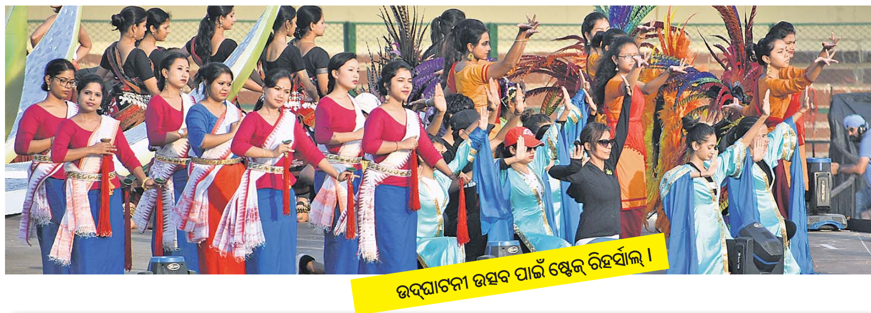
ଉଦ୍‌ଘାଟନା ଉତ୍ସବ ପାଇଁ ଶ୍ରେଣୀ ରହିର୍ଯ୍ୟାଳ ।

ବିଶ୍ୱକପ ପାଇଁ ଭୁବନେଶ୍ୱର ଓ କଳିଙ୍ଗ ଷ୍ଟାଡିୟମ ନବବଧୂ ପରି ସଜେଇ ହୋଇଛି। ବର୍ଷତ ଦର୍ଶକ କ୍ଷମତା ଓ ନୂଆକରି ସ୍ଥାପନ ହୋଇଥିବା ଚର୍ଚ୍ଚା ସହ ଷ୍ଟାଡିୟମର ହକି କମ୍ପ୍ଲେକ୍ସ ସମ୍ପୂର୍ଣ୍ଣ ରୂପେ ସଜେଇ ହୋଇଛି। କେବଳ ମୁଖ୍ୟ ଭେଲ୍ୟୁ ରୁହେଁ, ଅଭ୍ୟାସ ପାଇଁ ପ୍ରସ୍ତୁତ କରାଯାଇଥିବା ଗ୍ରାଉଣ୍ଡରେ ମଧ୍ୟ ନୂଆ ଚର୍ଚ୍ଚା ବିଛାଯାଇଛି। ଆନ୍ତର୍ଜାତିକ ହକି ଫେଡେରେଶନ ନିୟମ ଅନୁସାରେ, ପ୍ରସ୍ତୁତ ହୋଇଥିବା ଏହି ଚର୍ଚ୍ଚା ଉପରେ ଏବେ ସମସ୍ତଙ୍କ ନଜର। ବିଶ୍ୱସ୍ତରୀୟ ଭିଡିଓମ୍ ସହ ଏହି ମେଡା ଇଭେଣ୍ଟ ଆୟୋଜନ କରିବାକୁ କଳିଙ୍ଗ ଷ୍ଟାଡିୟମ ଏକଦମ ପ୍ରସ୍ତୁତ। ମୁଖ୍ୟ ଷ୍ଟାଡିୟମର ସିଏ ସଂଖ୍ୟା ୧୫ ହଜାରକୁ ବୃଦ୍ଧି କରାଯାଇଛି। ଷ୍ଟାଡିୟମର ଉତ୍ତର ଓ ଦକ୍ଷିଣ ପଟେ ଦୁଇଟି ନୂଆ ଷ୍ଟାଣ୍ଡ ବା ଗ୍ୟାଲେରିର ନିର୍ମାଣ କରାଯାଇଛି। ଫଳରେ ଷ୍ଟାଡିୟମରେ ମୋଟ ଉପରେ ୪ଟି ସୁନ୍ଦର ଷ୍ଟାଣ୍ଡ ନୂଆରୂପରେ ଠିଆ ହୋଇଛି। ଷ୍ଟାଡିୟମରେ ଖେଳାଳିମାନଙ୍କ ପାଇଁ ୪ଟି ରେଞ୍ଜିଂରୁମ୍ ରହିଛି। ବିଭିନ୍ନ ଉଚ୍ଚକୋଟୀର ଆନ୍ତର୍ଜାତିକ ଷ୍ଟାଡିୟମ/କ୍ଲବ୍ ହୋର୍ଟ୍ସ୍ ଗ୍ରାଉଣ୍ଡକୁ ନେଇ ରାତିମତେ ରିସର୍ଭ କରିବା ପରେ ହକି ଇଣ୍ଡିଆର କମ୍ପିଟିଶନ ଡିପାର୍ଟମେଣ୍ଟ ଏହାକୁ ଡିଜାଇନ୍ କରିଛି। ଏଥିସହିତ ୩ଟି ଉଚ୍ଚକୋଟୀର ଗୋଲକିପର ଇକ୍ସପ୍ରେସ୍ ରୁମ୍ ମଧ୍ୟ ନିର୍ମାଣ କରାଯାଇଛି। ଆଧୁନିକ ହକି ଓ ଗୋଲକିପର କିଟ୍‌କୁ ଦୃଷ୍ଟିରେ ରଖି ଏହାର ନିର୍ମାଣ କରାଯାଇଛି। ସେହିପରି ଏକ ଉଚ୍ଚକୋଟୀର ଅଣ୍ଡରଗ୍ରାଉଣ୍ଡ ରେଞ୍ଜିଂରୁମ୍ ମଧ୍ୟ ନିର୍ମାଣ କରାଯାଇଛି। ସେହିପରି ଗଣମାଧ୍ୟମ ପ୍ରତିନିଧିତ୍ୱ ପାଇଁ ଏକ ବିଶ୍ୱସ୍ତରୀୟ ମିଡିଆ ସେଣ୍ଟର ନିର୍ମାଣ କରାଯାଇଛି। ଭିଆଇପି ଓ ଅର୍ଥସାଧାରଣଙ୍କ ପାଇଁ ସ୍ୱତନ୍ତ୍ର ବସ୍ ନିର୍ମାଣ କରାଯାଇଛି। ଏଥିସହିତ ଏକ ଡ୍ରାକ୍ ଅଫ୍ ଚାମ୍ପିୟନ୍‌ସ୍ ମଧ୍ୟ ନିର୍ମାଣ ହୋଇଛି। ୧୯୭୧ରୁ ୨୦୧୪ ପର୍ଯ୍ୟନ୍ତ ହକି ବିଶ୍ୱକପ୍ ଟାଇଟଲ ହାସଲ କରିଥିବା