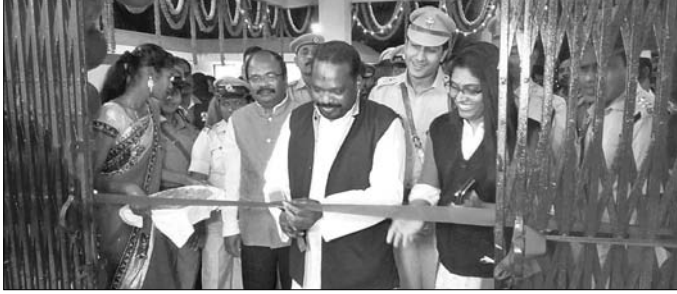
ବିଧାୟକ ଥାନାକୁ ଉଦ୍ଘାଟନ କରୁଛନ୍ତି।

ପୁଲବାଣୀ ଅଫିସ, ୨୬।୧୧ ପୁଲବାଣୀ ଚାନ୍ଦନ ଥାନା ଆଦର୍ଶ ଥାନାରେ ପରିଣତ ହୋଇଛି।