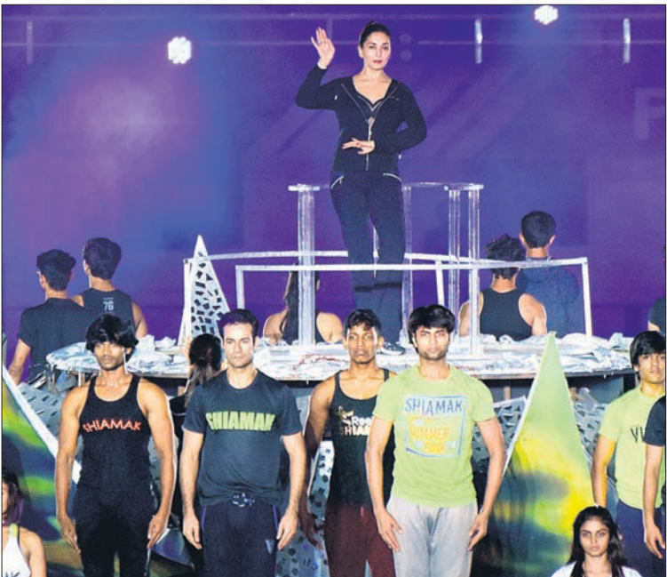
କଳାକାର ମାଧୁରୀ ଦାକ୍ଷିଣୀଙ୍କୁ ଦର୍ଶକଙ୍କ ମଧ୍ୟରେ ପ୍ରବଳ ଭାବନା ରହିଥିବା ବେଳେ ଯୋଗଦାନ କରୁଥିବା ବ୍ୟକ୍ତିଙ୍କୁ ଭୁବନେଶ୍ୱରରେ ତାଙ୍କୁ ସ୍ୱାଗତ କରାଯାଇଛି।

ହକି ବିଶ୍ୱକପର ଉଦ୍‌ଘାଟନା ମହାକୁମ୍ଭରେ ନିଜର ଜଳଖି ଦେଖାଇବାକୁ ଯୋଗଦାନ କରି ଭୁବନେଶ୍ୱରରେ ପହଞ୍ଚିଛନ୍ତି ବଲିଉଡ୍‌ର ଏକଜଣାତମ କଳାକାର ମାଧୁରୀ ଦାକ୍ଷିଣୀ।