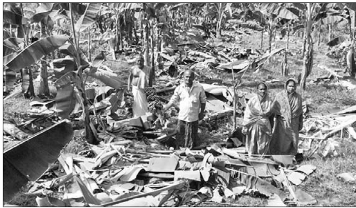
ଚାଷୀମାନେ ନଷ୍ଟ ହୋଇଥିବା କଦଳୀ ଫସଲ ଦେଖାଉଛନ୍ତି।