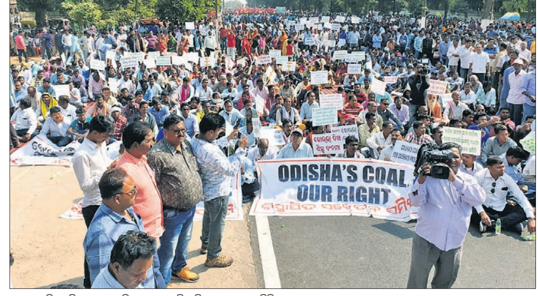
ଲୋକସଭାରେ ବିଜୁବାହୁଙ୍କ ନିମନ୍ତେ ଅଗ୍ରାଧିକାର ମିଳୁଥିବାର ଘୋଷଣା କରିଛନ୍ତି...