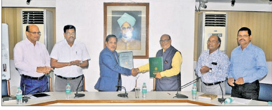
ଭୁବନେଶ୍ୱର, ୨୭.୧୧.୧୮ (କ୍ରମେ): ଚଳିତ ମାସ ୨୮ରେ କେନ୍ଦ୍ର ସଂସ୍କୃତି ମନ୍ତ୍ରାଳୟ ତରଫରୁ...