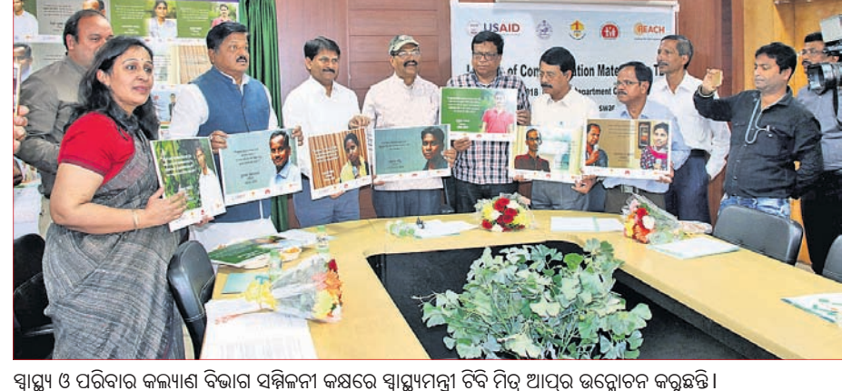
ସାମ୍ବଲ ଓ ପରିବାର କଲ୍ୟାଣ ବିଭାଗ ସମ୍ମିଳନୀ କକ୍ଷରେ ସାମ୍ବଲମିତ୍ରା ଟିଡି ମିତ୍ର ଆଫ ଉନ୍ନୋତିତ କରୁଛନ୍ତି।