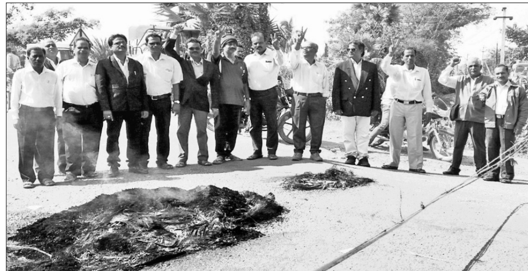
ଓକିଲମାନେ ପୁଖ୍ୟ ରାସ୍ତା ଅବରୋଧ କରିଛନ୍ତି। ବନ୍ଦ ରହିଥିଲା। ବନ୍ଦକୁ ସହରବାସୀ ସହର ଶୁଣାଇବା ପାଇଁ ଆଇଆଇସି ଅଧିକାରୀଙ୍କୁ ସ୍ୱତନ୍ତ୍ର ଭାବରେ ସମସ୍ତ ଯୋଗାଯୋଗ କର୍ମଚାରୀ ବିଚ୍ଛିନ୍ନ ସ୍ଥାନରେ ପୂରଣ ରହିଥିଲେ।

ପୁରୁଷୋତ୍ତମପୁରରେ ସବୁଜନ୍ କୋର୍ଟ ପ୍ରତିଷ୍ଠା ଦାବି ସହ ସହରର ପୁଖ୍ୟ ରାସ୍ତା ନିର୍ମାଣରେ ବିଳମ୍ବକୁ ନେଇ ଯୋଗଦାନ ବନ୍ଦ ପାଳନ କରାଯାଇଛି।