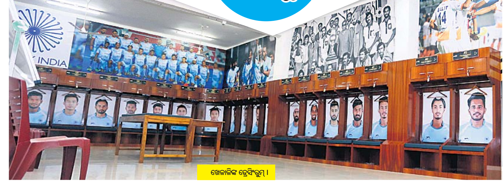
ଖେଳାଳିଙ୍କ ହେସ୍‌ରୁମ୍ ।