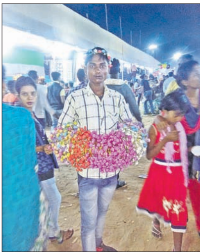
ବାଲିଯାତ୍ରାରେ ଜଣେ ବୁଲି ବ୍ୟବସାୟ ।