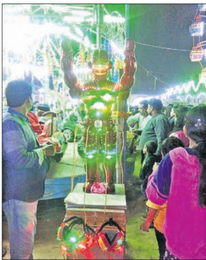
ଦର୍ଶକଙ୍କ ମନୋରଞ୍ଜନ ପାଇଁ ହୋଇଥିବା ପୁଁ କୃଷକ ମହେଲ ।