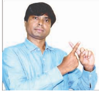
Dilip Tirkey Sports Personality