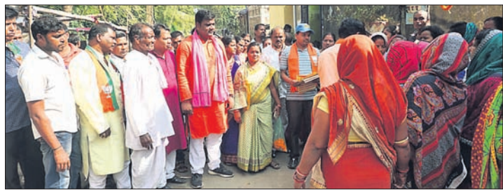
ପଦଯାତ୍ରାରେ ସାମିଲ ହୋଇଥିବା ଭାଜପା ନେତା ଓ କର୍ମୀ ।