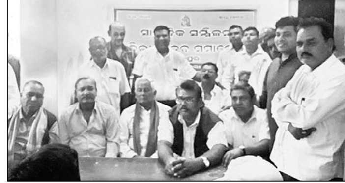
ଜିଲା ଯାଦବ ମହାସଂଘ ପକ୍ଷରୁ ଆୟୋଜିତ ଖବରଦାତା ସମ୍ମିଳନୀ ।

ଯାଜପୁର ଜିଲା ଯାଦବ ମହାସଂଘ ପକ୍ଷରୁ ଯାଜପୁର ସଦର ଆନା ଅଜର୍ଣ୍ଣତ ବରୁଆ ଦଶହରା ପଡ଼ିଆରେ ଡିସେମ୍ବର ୨ ତାରିଖରେ ଜିଲାସ୍ତରୀୟ ମହାସମାବେଶରେ ଅନୁଷ୍ଠିତ ହେବ।