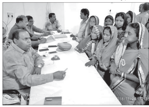
ଶିବିରରେ ଜିଲାପାଳ ଓ ଅନ୍ୟମାନେ ।

ମହାକାଳପଡା ରୁକ୍ମ କାର୍ଯ୍ୟାଳୟ ସଭାଗୃହରେ ଯୋଗଦାନ ଜିଲାପାଳଙ୍କ ନିଜ କର୍ମଶୁଣାଣି ଶିବିର ଅନୁଷ୍ଠିତ ହୋଇପାରିଛି ।