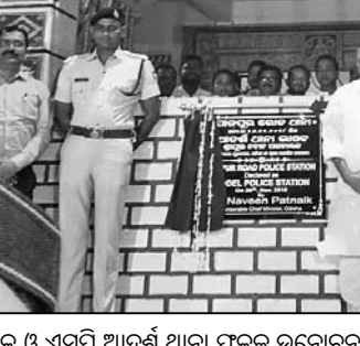
ଜିଲାପାଳ ଏସ୍‌ପି ଆବର୍ଷ ଆନା ଫଳକ ଉନ୍ମୋଚନ କରୁଛନ୍ତି ।

ବରା ବୁକ ଅଜର୍ଣ୍ଣତ ଧାରପୁର ପଞ୍ଚାୟତର ବିଜୁ ମୁରବୀନା ପକ୍ଷରୁ ସୋମବାର ହଳି ବିଶ୍ୱକର୍ମ ପାଇଁ ଗଣଦୈଠି ଅନୁଷ୍ଠିତ ହୋଇଯାଇଛି ।