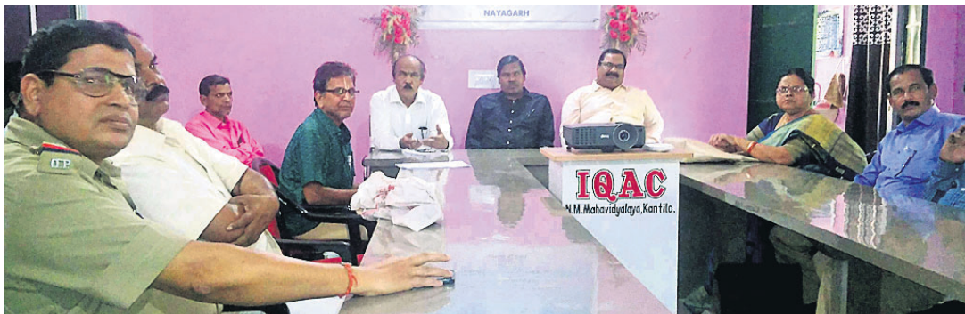
ମିଳିତ ବୈଠକରେ କଲେଜ ଷ୍ଟାଫ୍ କମିଟି, ଫାଣ୍ଡି ଅଧିକାରୀ ଓ ଅନ୍ୟମାନେ।

ଖଣ୍ଡପଡା ବ୍ଲକ୍ କଣ୍ଠିଲୋ ନୀଳମାଧବ ମହାବିଦ୍ୟାଳୟରେ ଆର୍ଥିକ ଅନିୟମିତତା ଅଭିଯୋଗ କରି ଯୋଗଦାନ କେତେକ ଛାତ୍ର କଲେଜ ବନ୍ଦ କରି ଆନ୍ଦୋଳନ କରିଥିଲେ।