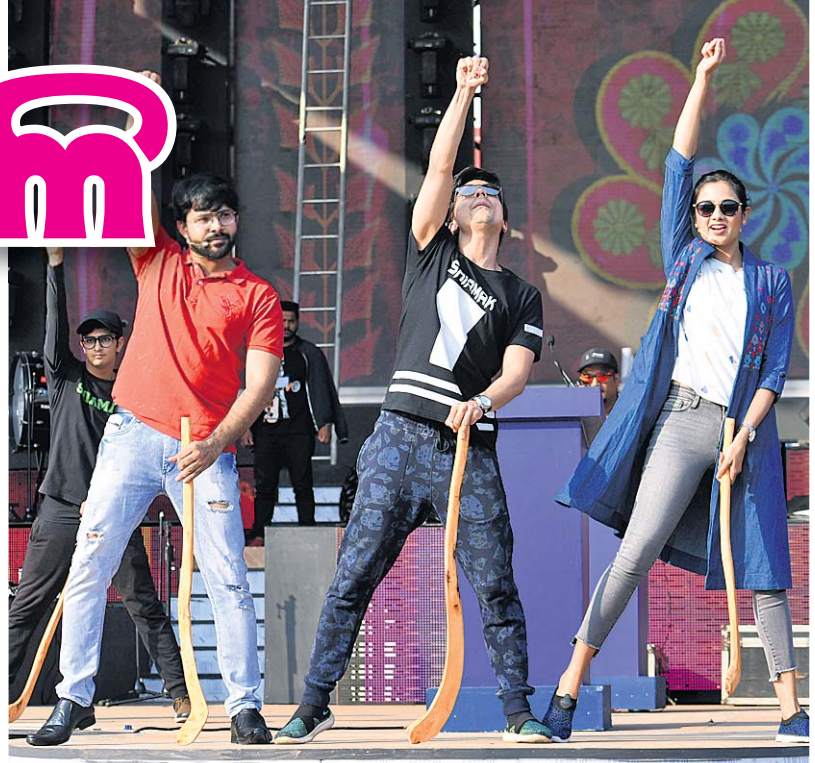
ବ୍ୟସାଗା, ଅର୍ଚ୍ଚିତାଙ୍କ ରିହସ୍ୟାଳ।