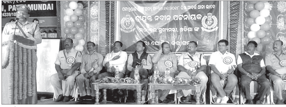
କାର୍ଯ୍ୟକ୍ରମରେ ଯୋଗଦେଇଥିବା ଅତିଥିମାନେ ।

ରାଜ୍ୟର ୩୫ ଆଦର୍ଶ ଧାନା ମଧ୍ୟରେ ପଞ୍ଜାମୁଖାଇ ଧାନା ଘାମି ପାଇଛି ।