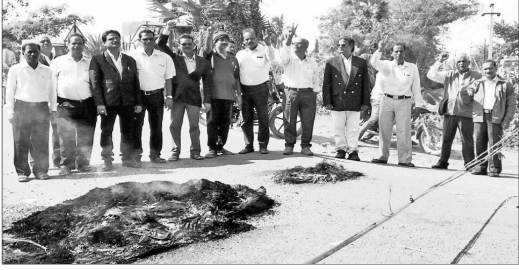
ଓକିଲମାନେ ପୁଖ୍ୟ ରାସ୍ତା ଅବରୋଧ କରିଛନ୍ତି। ବନ୍ଦ ରହିଥିଲା। ବନ୍ଦକୁ ସହରବାସୀ ସମର୍ଥନ କରିଥିଲେ।

ପୁରୁଷୋତ୍ତମପୁରରେ ସବୁଜ ଲୋଟ ପ୍ରତିଷ୍ଠା ଦାବି ସହ ସହରର ପୁଖ୍ୟ ରାସ୍ତା ନିର୍ମାଣରେ ବନ୍ଦ ପାଳନ କରାଯାଇଛି।