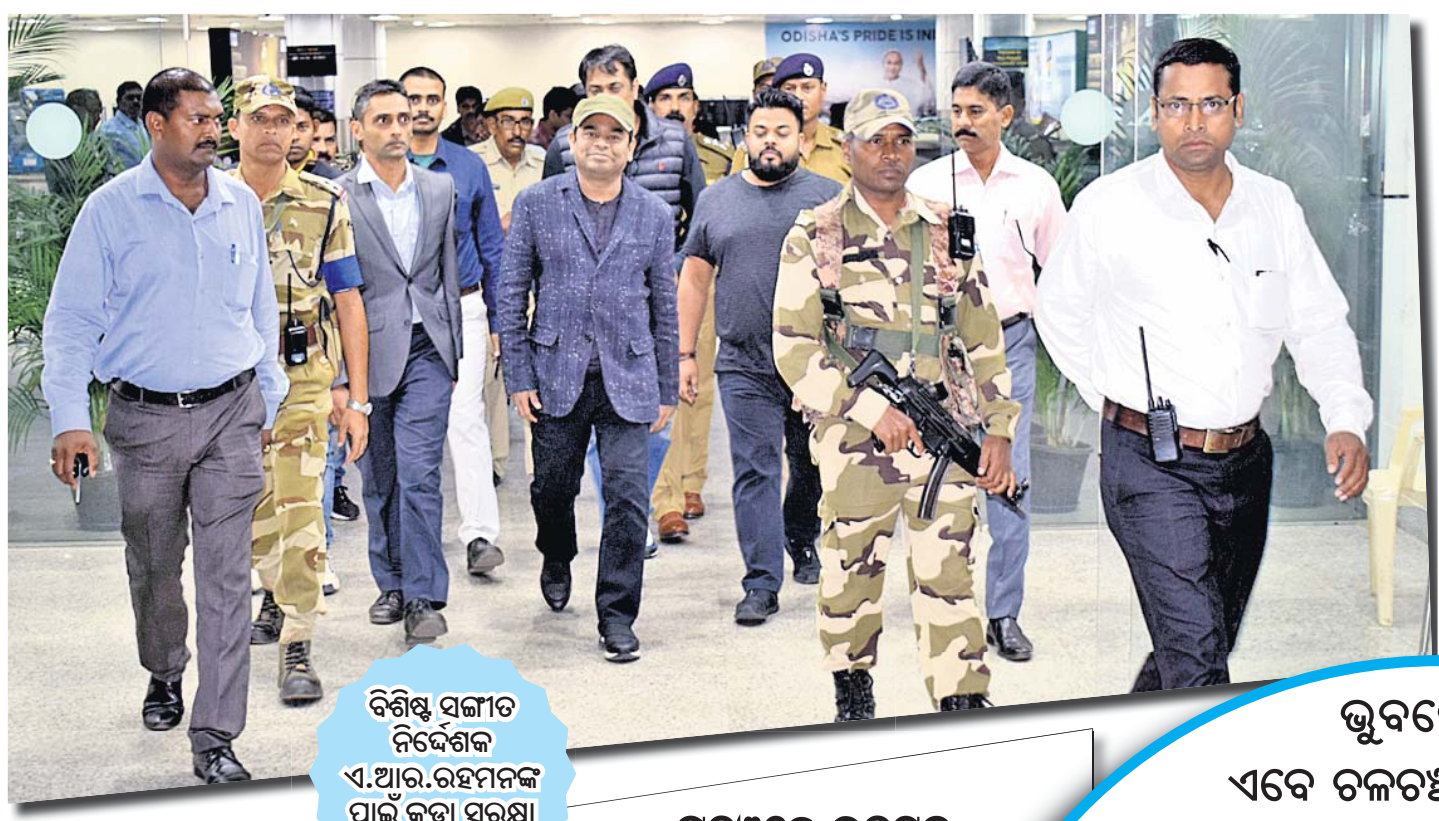
ବିଶିଷ୍ଟ ସଙ୍ଗୀତ ନିର୍ଦ୍ଦେଶକ ଏ.ଆର୍.ରଘୁମନଙ୍କ ପାଇଁ କଡ଼ା ସୁରକ୍ଷା ବ୍ୟବସ୍ଥା।