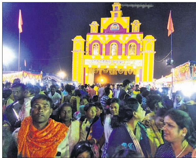
ବାଲିଯାତ୍ରା ପଡ଼ିଆରେ ହୋଇଥିବା ଜନଗହଳ ।

ଉଲ୍ଲାସ ହତ୍ୟା ଘଟଣାର ସିବିଆଇ ତଦନ୍ତ ଦାସି ଜିଲ୍ଲାପାଳଙ୍କ ନିକଟକୁ ପଦଯାତ୍ରା