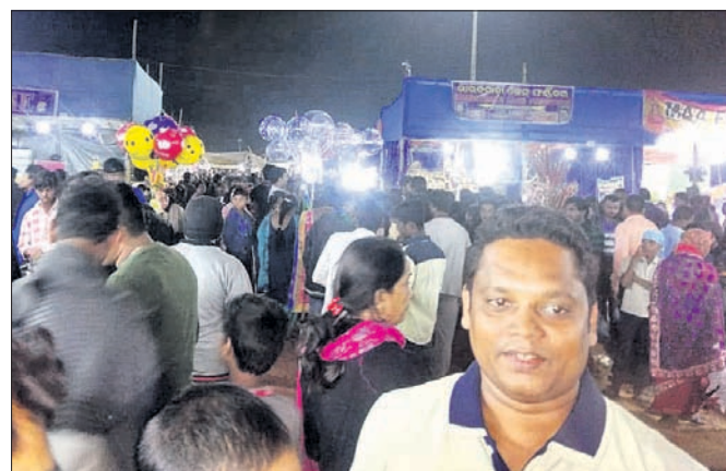
ବାଲିଯାତ୍ରା ପଡ଼ିଆରେ ଜନଗହଳି।

ଉଦ୍‌ଘାଟିତ ହେବ। ଅଧିକାଂଶ ଖୁଲରେ ସାମଗ୍ରୀ ଶେଷ ବାଲିଯାତ୍ରା ଶେଷ ହେବା ପୂର୍ବରୁ କେତେକ ଖୁଲରେ ସାମଗ୍ରୀ ଶେଷ ହୋଇଗଲାଣି। ବିଶେଷକରି ଘରକରଣା ସାମଗ୍ରୀ ଓ ହଳଦି ମସଲା ଖୁଲରେ ଆଉ ସାମଗ୍ରୀ ନାହିଁ। ନୟାଗଡ଼ରୁ ଆସିଥିବା ଗୌରାଙ୍ଗ ମନ୍ତ୍ରୀ କୁହନ୍ତି ସେ ପ୍ରାୟ ୪୦ ହଜାର ଟଙ୍କାର ହଳଦୀ ଓ ସୋରିଷ, ଜିରା ଆଦି ଆଣିଥିଲେ। ମଙ୍ଗଳଦୀନ ରାତ୍ରୀ ଶେଷ ହୋଇଯାଇଛି। ବୁଧବାର ଶେଷ ଦିନ ବେଶ୍ ଆକର୍ଷିତ କରିଥିଲା। ଏହାବାଦ୍ ଆଧୁନିକ ନୃତ୍ୟ, ସଙ୍ଗୀତ, ଭଜନ ଆଦି ପରିବେଷଣ ହୋଇଥିଲା। ବୁଧବାର ଏହା