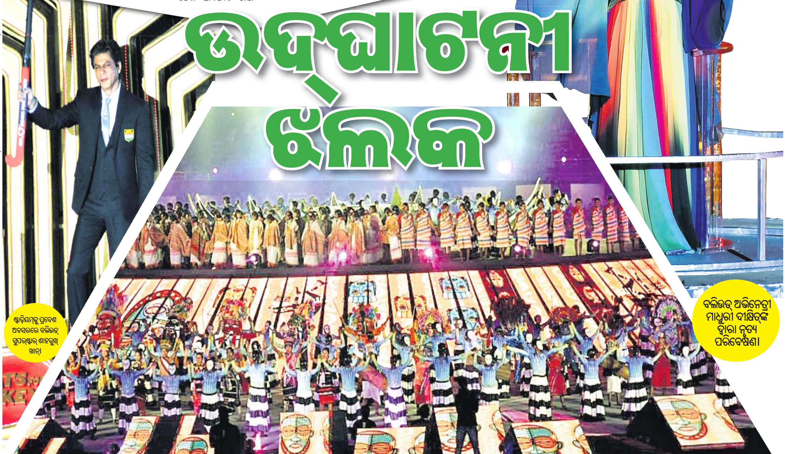
ଷ୍ଟାଡ଼ିୟମକୁ ପ୍ରବେଶ ଅବସରରେ ବଲିଉଡ୍ ସୁପରଷ୍ଟାର୍ ଶାହରୁଖ୍ ଖାନ