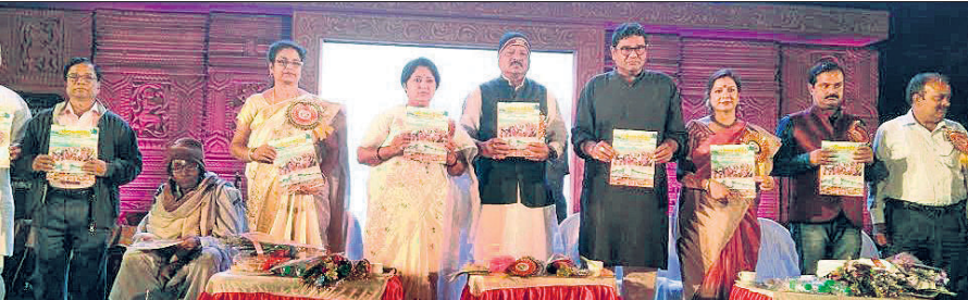
ଚେଳିତୋଳ ବାଲିଯାତ୍ରା ମହୋତ୍ସବରେ ଅତିଥି ସ୍ମରଣିକା ଉନ୍ମୋଚନ କରୁଛନ୍ତି।