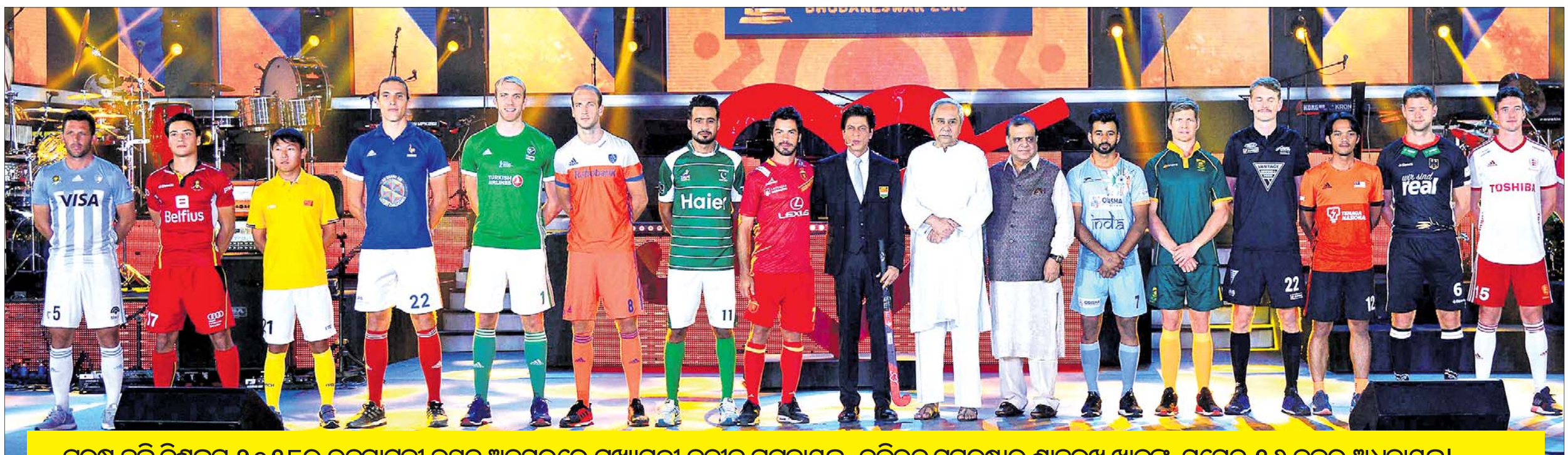
ପୁରୁଷ ହକି ବିଶ୍ୱକପ ୨୦୧୮ର ଉଦ୍‌ଘାଟନୀ ଉତ୍ସବ ଅବସରରେ ମୁଖ୍ୟମନ୍ତ୍ରୀ ନବୀନ ପଟ୍ଟନାୟକ, ବଲିଉଡ୍ ସୁପରଷ୍ଟାର୍ ଶାହରୁଖ୍ ଖାନଙ୍କ ସମେତ ୧୬ ଦଳର ଅଧିନାୟକ।

ଭୁବନେଶ୍ୱର, ୨୭।୧୧(କ୍ରୀଡ଼ା ପ୍ରତିନିଧି): ‘ହକି ବିଶ୍ୱକପ ଇତିହାସରେ ଯାହା ପୂର୍ବରୁ କେବେ ହୋଇ ନ ଥିଲା ତାହା ଓଡ଼ିଶା କରି ଦେଖାଇଲା। ପୂର୍ବ ୧୩ଟି ସଂସ୍କରଣଠାରୁ ଏଥର ନିଆରା ଭାବରେ ବିଶ୍ୱକପ ଆରମ୍ଭ କରି ଓଡ଼ିଶା ଉଦ୍‌ଘାଟନା ପୂର୍ଣ୍ଣ କଲା। ଏଥିପାଇଁ ଓଡ଼ିଶା ମୁଖ୍ୟମନ୍ତ୍ରୀ ନବୀନ ପଟ୍ଟନାୟକଙ୍କ ଯେତେ ପ୍ରଶଂସା କଲେ କମ୍ ହେବ’ ବୋଲି ମଙ୍ଗଳବାର କଳିଙ୍ଗ ଷ୍ଟାଡ଼ିୟମରେ ହକି ବିଶ୍ୱକପ ଉଦ୍‌ଘାଟନ ଅବସରରେ ପ୍ରକାଶ କରିଛନ୍ତି ଅନ୍ତର୍ଜାତୀୟ ହକି ଫେଡେରେଶନ(ଏଫଆଇଏଚ୍) ସଭାପତି ନରିନ୍ଦର ବାଗ୍ରା। ଓଡ଼ିଶାବାସୀ ହେଉଛନ୍ତି ହକିର ସର୍ବଶ୍ରେଷ୍ଠ ପ୍ରଶଂସକ। ୨୦୧୩ରେ ଆମକୁ ହକି ବିଶ୍ୱକପ ଆୟୋଜନ ଅଧିକାର ମିଳିଥିଲା। ୨୦୧୮ରେ ଓଡ଼ିଶାରେ ଏବେ ତାହା ଆୟୋଜନ ହେବାକୁ ଯାଉଛି। ଖାଲି ଆୟୋଜନ ହୋଇନାହିଁ, ଯେପରି ଜଙ୍ଗରେ