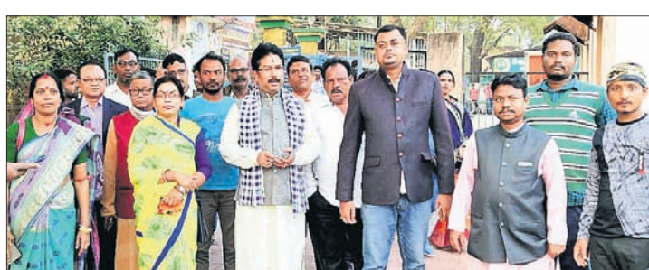
ଭାଜପା ନେତା ଓ କର୍ମୀମାନେ ବିରୋଧ ପ୍ରଦର୍ଶନ କରୁଛନ୍ତି।