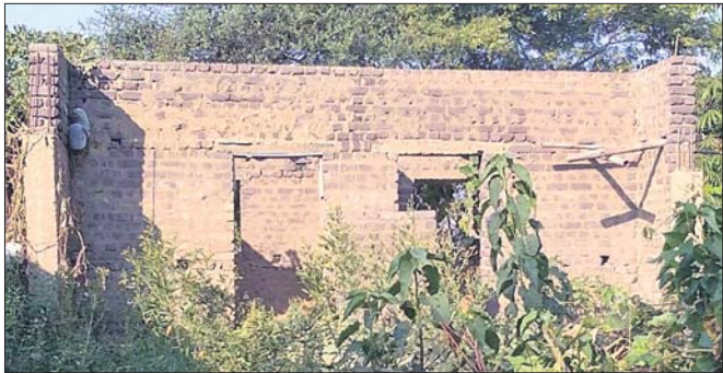
ଅଧ୍ୟାପକ୍ତରିଆ ଭାବେ ରହିଥିବା ପ୍ରଧାନମନ୍ତ୍ରୀ ଆବାସ।