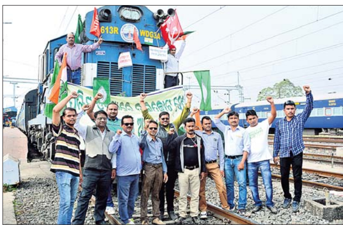
ସମ୍ବଲପୁରରେ ଆନ୍ଦୋଳନକାରୀ ରେଳରୋକୋ କରିଛନ୍ତି।

ପଶ୍ଚିମ ଓଡ଼ିଶାରେ ହାଇକୋର୍ଟ ସ୍ଥାୟୀ ବେଞ୍ଚ ପ୍ରତିଷ୍ଠା ଦାବିରେ ଗୁରୁତ୍ୱପୂର୍ଣ୍ଣ ସମ୍ମାନ ଓଟାକୁ ଆରମ୍ଭ ହୋଇଥିବା ମହାବନ୍ଦ ଶନିବାର ସକାଳ ୭ଟା ଅର୍ଥାତ୍ ୪୮ ଘଣ୍ଟାରେ ଶେଷ ହୋଇଛି। ପଶ୍ଚିମ ଓଡ଼ିଶା ଓକିଲ ସଂଘ ସମ୍ପୂର୍ଣ୍ଣ କେନ୍ଦ୍ରୀୟ କ୍ରିୟାମୁଖ୍ୟାନ କମିଟି (ସିଏସି)ର କେନ୍ଦ୍ରରେ ଆରମ୍ଭ ହୋଇଥିବା ଏହି ମହାବନ୍ଦ ଯୋଗୁ ଗତ ୨ ଦିନ ଧରି ସାଧାରଣ ଜୀବନଯାତ୍ରା ପ୍ରଭାବିତ ହୋଇଥିଲା। ଅଖଟକ ବନ୍ଦ ରହିଥିଲା। ସହରର ରାଜରାସ୍ତା ଜନଶୃଙ୍ଖଳା ହୋଇପଡ଼ିଥିଲା। ବିଭିନ୍ନ ଅନୁଷ୍ଠାନର କର୍ମଚାରୀ ପିକେଟିଂ କରି ବନ୍ଦପାଳନକୁ ସମର୍ଥନ କରିଥିଲେ। ଦୋକାନବନ୍ଦର, ରାତିମୋଟର ବନ୍ଦ ରହିଥିଲା। ଏହାର ପ୍ରଭାବ ଗ୍ରାମାଞ୍ଚଳରେ ପଡ଼ିଥିଲା। ଚିଲି କୃଷକ ସଙ୍ଗଠନ ସଦସ୍ୟମାନେ ଅଭିଯୋଗ ଛକରେ ବିକ୍ଷୋଭ ପ୍ରଦର୍ଶନ କରିଥିଲେ। ସମ୍ବଲପୁର ରେଳ ମଞ୍ଚରେ ରେଳସେବା ବନ୍ଦ ହୋଇଯାଇଥିଲା। ଶୁକ୍ରବାର ସମୁଦାୟ ୨୧ଟି ଟ୍ରେନ ବାଟିଲ ସହ ୫ଟି ଟ୍ରେନର ଗତିପଥ ପରିବର୍ତ୍ତନ କରାଯାଇଥିବା ରେଳ ବିଭାଗ ପକ୍ଷରୁ ସୂଚନା ମିଳିଛି।