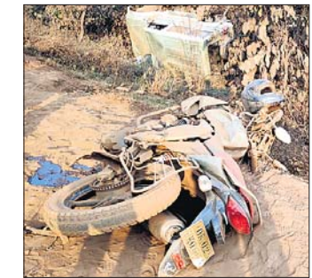
ଦୁର୍ଘଟଣାଗ୍ରସ୍ତ ବାଇକ୍ ଓ ବୋଲେରୋ।

ବଡ଼ବିଲ-ନାଲଦା ରାଜ୍ୟ ରାଜପଥର ବେଳକୁଟି ନିକଟରେ ଶୁକ୍ରବାର ଅପରାହ୍ଣରେ ଏକ ମର୍ମହୀନ ସଡ଼କ ଦୁର୍ଘଟଣାରେ ଜଣେ ବାଇକ୍ ଚାଳକଙ୍କ ମୃତ୍ୟୁ ଘଟିଥିଲା ବେଳେ ଅନ୍ୟ ୩ ଗୁରୁତର ହୋଇଛନ୍ତି।