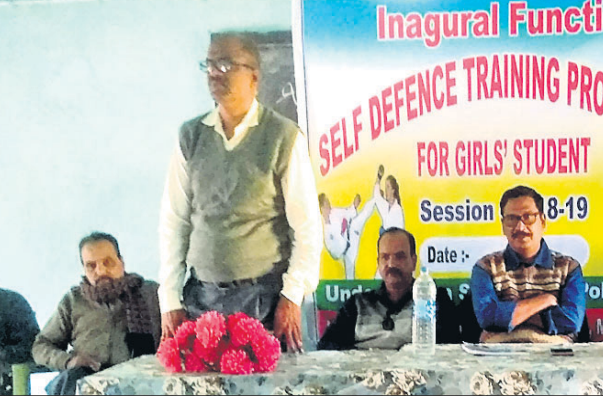
ଉଦଘାଟନା ଉତ୍ସବରେ ଉପସ୍ଥିତ ଅତିଥିମାନେ।