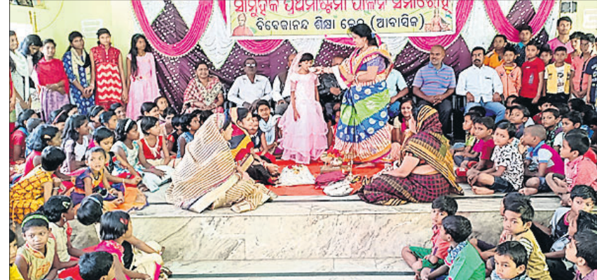
ବିବେକାନନ୍ଦ ଶିକ୍ଷାକେନ୍ଦ୍ର ଛାତ୍ରାବାସରେ ପ୍ରଥମାଷ୍ଟମୀ ପାଳନ କରାଯାଇଛି।

ଓଡ଼ିଆ ସଂସ୍କୃତିରେ ପଢୁଆଁମାନଙ୍କ ପର୍ବ ଭାବେ ପାଳିତ ହୁଏ ପ୍ରଥମାଷ୍ଟମୀ। ସେମାନେ ମାମୁରୁ ଆସିଥିବା ନୂତନ ବସ୍ତ୍ର ପିନ୍ଧିବା ଓ ହଳଦୀପତ୍ରରେ ପିଠା ଖାଇବା ପରମ୍ପରା କେଉଁ ଅନୁସାରେ ରହି ଆସିଛି।