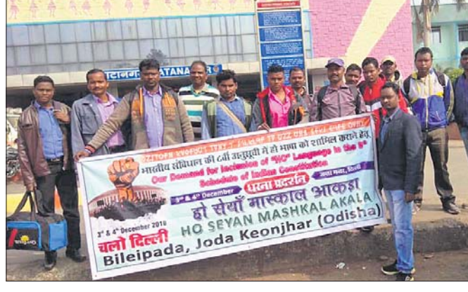
ହୋ ଭାଷାଭାଷୀ ସମ୍ପ୍ରଦାୟର ଲୋକେ।