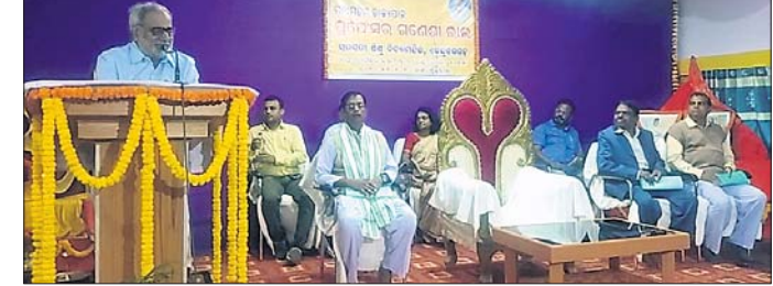
ଆୟୋଜିତ ସଭାରେ ରାଜ୍ୟପାଳ ମତବ୍ୟକ୍ତ କରୁଛନ୍ତି।