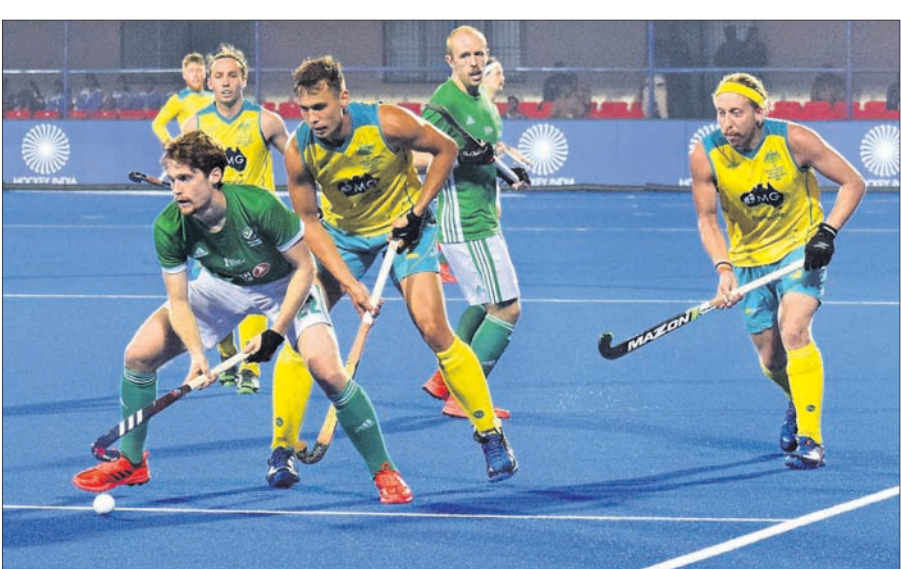
କଳିଙ୍ଗ ଷ୍ଟାଡ଼ିୟମରେ ଶୁକ୍ରବାର ଅଷ୍ଟ୍ରେଲିଆ ଓ ଆୟର୍ଲ୍ୟାଣ୍ଡ ମଧ୍ୟରେ ଅନୁଷ୍ଠିତ ହକି ବିଶ୍ୱକପ ମ୍ୟାଚର ଏକ ସଂଘର୍ଷପୂର୍ଣ୍ଣ ପୃଷ୍ଠା