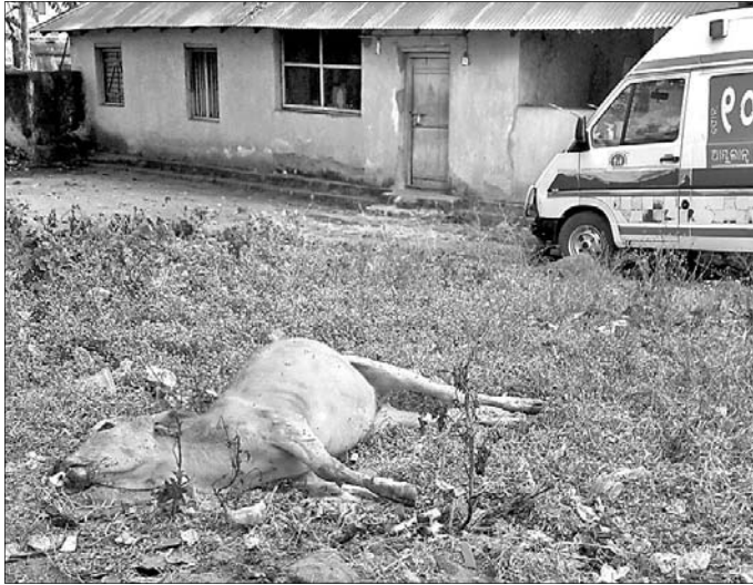
ସ୍ଵାସ୍ଥ୍ୟକେନ୍ଦ୍ର ପରିସରରେ ଗାଈ ମୃତ୍ୟୁଦେହ ପଡ଼ି ରହିଛି ।

ଦାରିଙ୍ଗବାଡ଼ି ଗୋଷ୍ଠୀ ସ୍ଵାସ୍ଥ୍ୟକେନ୍ଦ୍ର ବହୁ ଅବ୍ୟବସ୍ଥା ମଧ୍ୟରେ ଗତି କରୁଛି । ଏଠାରେ ନିୟମିତ ସମସ୍ତ ଡାକ୍ତର ରହୁ ନ ଥିବା ଓ ରୋଗୀଙ୍କ ନିମନ୍ତେ ମାଗଣା ପରିବର୍ତ୍ତେ ବାହାରୁ ଔଷଧ କିଣିବାକୁ ପଡୁଥିବା ଅଭିଯୋଗ ହୋଇ ଆସୁଛି । ଅନ୍ୟପକ୍ଷରେ କିଛି ଏକ୍ସପାଏରି ଔଷଧକୁ ସ୍ଵାସ୍ଥ୍ୟକେନ୍ଦ୍ର ପରିସରରେ ପୋଡ଼ି ନଷ୍ଟ କରାଯାଇଥିବା ଘଟଣା ଅଞ୍ଚଳରେ ଆଲୋଚନାର ବିଷୟ ହୋଇଛି । ଏକ୍ସପାଏରି ଔଷଧଗୁଡ଼ିକୁ ପ୍ରଥମେ ଯକ୍ଷ୍ମା ଖର୍ଚ୍ଚ ନିକଟରେ ଫିଙ୍ଗା ଯାଇଥିଲା । ଉକ୍ତ ଔଷଧ ଖାଇ ଏକ ଗାଈ ମୃତ୍ୟୁ ଘଟିଥିବା ଜଣେ ବ୍ୟକ୍ତି ନିଜ ନାମ ଗୋପନ ରଖି କହିଛନ୍ତି । ତେବେ କୌଣସି ମାଲିକ ତାଙ୍କ ଗାଈ ମୃତ୍ୟୁ ସମ୍ପର୍କରେ ଲିଖିତ ଭାବେ ଜଣାଇ ନ ଥିବା ସ୍ଵାସ୍ଥ୍ୟକେନ୍ଦ୍ର ପକ୍ଷରୁ କୁହାଯାଇଛି । ରିପୋର୍ଟ ଲେଖାଯିବା ପର୍ଯ୍ୟନ୍ତ ସ୍ଵାସ୍ଥ୍ୟକେନ୍ଦ୍ର ପରିସରରେ ଗାଈ ମୃତ୍ୟୁ ଦେହଟି ପଡ଼ି ରହିଥିଲା । ସେପଟେ ଯକ୍ଷ୍ମା ବିଭାଗ କେବେ ଦି ଖୋଲା ଯାଉ ନ