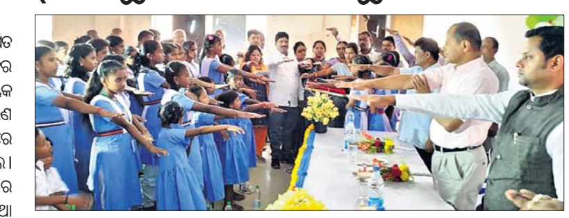
ବାହ୍ୟ ଶୈତମୁକ୍ତ ନେଇ ଶପଥ ପାଠ କରାଯାଇଛି ।