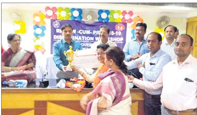
ବେଲଗାଁ ସ୍ୱାସ୍ଥ୍ୟକେନ୍ଦ୍ରକୁ ପୁରସ୍କୃତ କରାଯାଇଛି ।