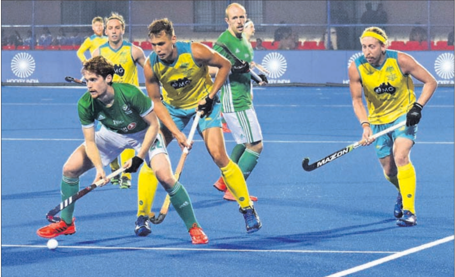
କଳିଙ୍ଗ ଷ୍ଟାଡିୟମରେ ଶୁକ୍ରବାର ଅଷ୍ଟ୍ରେଲିଆ ଓ ଆଉଲାଣ୍ଡ ମଧ୍ୟରେ ଅନୁଷ୍ଠିତ ହକି ବିଶ୍ୱକପ ମ୍ୟାଚର ଏକ ସଂଘର୍ଷପୂର୍ଣ୍ଣ ପୃଷ୍ଠା।