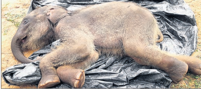
ମୃତ ହାତୀ ଛୁଆ।

କେଳାନାଳ ଅଧିକାରୀ, ୩୦.୧୧.୧୮ ମାସକୁ ଖର୍ଚ୍ଚ କରୁଥିଲେ ୬୫୫୫ରୁ ଟଙ୍କା। ଏସବୁ ସତ୍ୟ ଚିହ୍ନଟି ଆଭାବକୁ ହାତୀଛୁଆ ପ୍ରାଣ ହରାଇବା ଚିହ୍ନଟି ଆଖିରେ ପରିଚାଳନା ଉପରେ ପ୍ରଶ୍ନବାଜୀ ସୃଷ୍ଟି କରିଛି। ପାଳିଚିହ୍ନଟି ଅଭିଭାବ ହାତୀଛୁଆ 'ରାଜା'ର ଅଧିକାରୀଙ୍କ ଦ୍ୱାରା ଦିଆଯାଇଥିଲା।