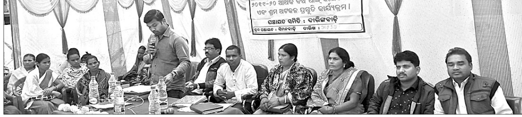
ଗ୍ରାମସଭାରେ ଉପସ୍ଥିତ ଅଧିକାରୀ ଏବଂ ଲୋକ ପ୍ରତିନିଧି ।