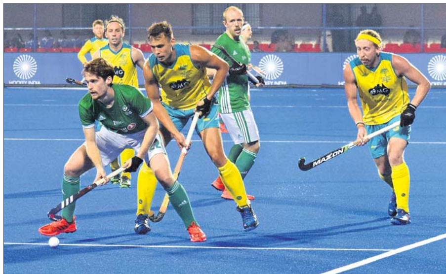
କଳିଙ୍ଗ ଷ୍ଟାଡ଼ିୟମରେ ଶୁକ୍ରବାର ଅଷ୍ଟ୍ରେଲିଆ ଓ ଆୟର୍ଲ୍ୟାଣ୍ଡ ମଧ୍ୟରେ ଅନୁଷ୍ଠିତ ହକି ବିଶ୍ୱକପ ମ୍ୟାଚର ଏକ ସଂଘର୍ଷପୂର୍ଣ୍ଣ ପୃଷ୍ଠା

ବରିଷ୍ଠ ନେତା ଦିଲୀପ ରାୟ ଏବଂ ବିଜୟ ମହାପାତ୍ର ଶୁକ୍ରବାର ଭାଜପାରୁ ଇସ୍ତଫା ଦେଇଛନ୍ତି । ଦୁଇ ନେତା ମିଳିତଭାବେ ଏ ସମ୍ପର୍କିତ ଏକ ଚିଠି ଭାଜପା ରାଷ୍ଟ୍ରୀୟ ଅଧ୍ୟକ୍ଷ ଅମିତ୍