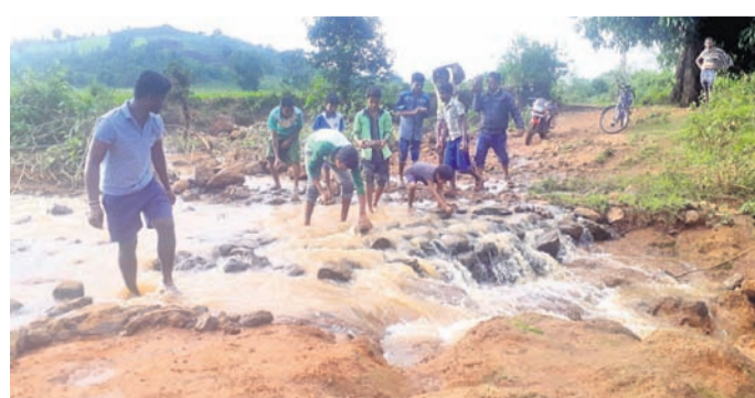
ଝୋଲା ରାସ୍ତାରେ ପଥର ପକାଇଛନ୍ତି ଗ୍ରାମବାସୀ।

ଜିଲ୍ଲା ଏବଂ ରୁକ୍ ପ୍ରଶାସନ ନିକଟରେ ଦାବି ଜଣାଇଲେ ମଧ୍ୟ କୌଣସି ସୁଫଳ ନ ମିଳିବାରୁ ନିର୍ଦ୍ଦେଶ ପଞ୍ଚାୟତର ବାଗ୍ରାବେଡ଼ା ଗ୍ରାମରେ ଏକ ଝୋଲା ଉପରେ ପଥର ପକାଇ ରାସ୍ତା ମରାମତି କରିଛନ୍ତି ବାସିନ୍ଦା।