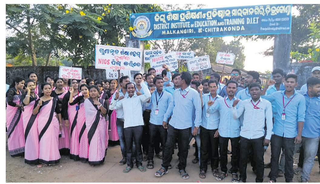
ବେସରକାରୀ ବିଦ୍ୟାଳୟର ଶିକ୍ଷକମାନଙ୍କୁ ଚାଲିଥିବା ଦେବା ନେଇ ସରକାର ନେଇଥିବା ନିଷ୍ପତ୍ତି ବିରୋଧରେ ବୁଧବାର ଶିକ୍ଷକମାନେ ମାଲକାନଗିରିସ୍ଥିତ ଡିଆଇଇଟି କାର୍ଯ୍ୟାଳୟ ସମ୍ମୁଖରେ ବିକ୍ଷୋଭ ପ୍ରଦର୍ଶନ କରୁଛନ୍ତି ।

ମାଲକାନଗିରି ଜିଲ୍ଲା ପାଠ୍ୟପାଠ୍ୟ ନିକଟ ଗୋଟିଯୋଡ଼ି ଗ୍ରାମରେ ଅଷ୍ଟପୁସ୍ତକ ନାମାୟକ ଗୁଡ଼ିକର ଆରମ୍ଭ ହୋଇଛି । ଗ୍ରାମୀଣ ପିଲାମାନଙ୍କୁ ପଢ଼ିବାକୁ ପ୍ରୋତ୍ସାହିତ କରିବା ପାଇଁ ଅଷ୍ଟପୁସ୍ତକ ଗ୍ରାମରେ ପଢ଼ିବାକୁ ପ୍ରୋତ୍ସାହିତ ହୋଇଥିବା ଏହି କାର୍ଯ୍ୟକ୍ରମରେ ଗ୍ରାମୀଣ ଶିକ୍ଷକମାନେ ଅଧିକ ସମାବେଶ ଦେଖାଦେଇଥିଲେ ।