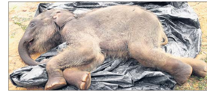
ମୃତ ହାତୀ ଛୁଆ।

କେନ୍ଦ୍ରୀୟ ଅଧ୍ୟବସ୍ଥା, ୩୦।୧୧ ମାସକୁ ଖର୍ଚ୍ଚ କରୁଥିଲେ ୬୫୫୦୦୦ ଟଙ୍କା। ଏସବୁ ସତ୍ୟ ଚିହ୍ନିତ ହେବାପରେ ହାତୀଛୁଆ ପ୍ରାଣ ହରାଇବା ବିଷୟରେ ପରିଚାଳନା ଉପରେ ପ୍ରଶ୍ନବାଜୀ ସୃଷ୍ଟି କରିଛି। ପାଲଟିଥିବା ଅଭିଯୋଗ ହାତୀଛୁଆ 'ରାଜା'ର ଅଧିକାରୀଙ୍କୁ ମୃତ୍ୟୁ ଘଟିଛି। ହାତୀ ଶାବକ ୩ ଦିନ ହେଲେ ଅଣ୍ଟା କ୍ଷୁବ୍ଧରେ ପଡ଼ିଥିଲା। ବିଷୟରେ କର୍ତ୍ତୃପକ୍ଷଙ୍କୁ ଏହାକୁ ଗୁରୁତ୍ୱ ଦେଇ ନ ଥିଲେ। ଫଳରେ ଆବଶ୍ୟକ ଚିକିତ୍ସା ଅଭାବରେ ରାଜାର ମୃତ୍ୟୁ ଘଟିଥିବା ଜଣାପଡ଼ିଛି।