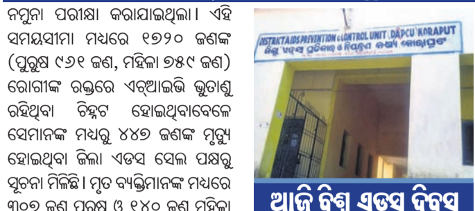
ଆଜି ବିଷ୍ଣୁ ଏଭିଏ ଡିବିସି

ନମୁନା ପରୀକ୍ଷା କରାଯାଇଥିଲା। ଏହି ସମୟଯାମା ମଧ୍ୟରେ ୧୭୨୦ ଜଣଙ୍କ (ପୁରୁଷ ୯୬୧ ଜଣ, ମହିଳା ୭୫୯ ଜଣ) ରୋଗୀଙ୍କ ରକ୍ତରେ ଏନ୍‌ଆଇଭି ଭୁତାଣୁ ରହିଥିବା ଚିହ୍ନଟ ହୋଇଥିବାବେଳେ ସେମାନଙ୍କ ମଧ୍ୟରୁ ୪୪୭ ଜଣଙ୍କ ମୃତ୍ୟୁ ହୋଇଥିବା ଜିଲ୍ଲା ଏଡିଏ ସେଲ ପକ୍ଷରୁ ପ୍ରକାଶ ପାଇଛି।