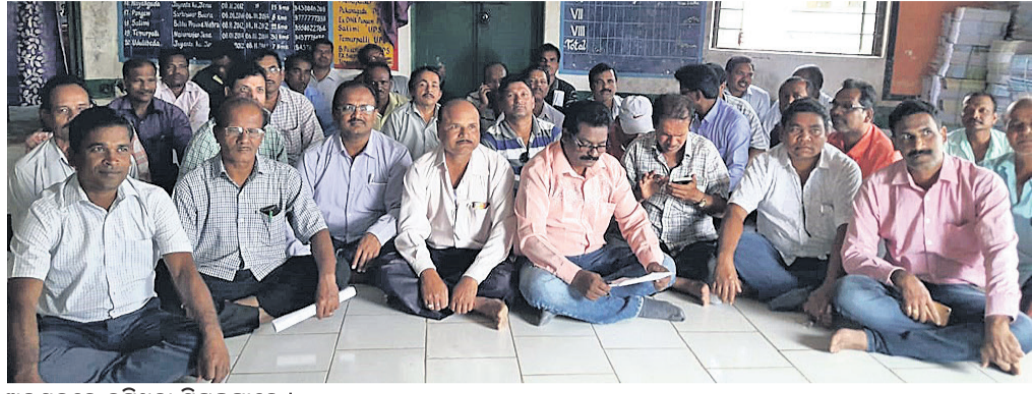
ଅନଗଣରେ ବସିଥିବା ଶିକ୍ଷକମାନେ ।

ମାଲକାନଗିରି ଜିଲ୍ଲା ମାୟାଲି ବ୍ଲକରେ ବିଲ୍ଡ଼ିଂ ଶିକ୍ଷକମାନଙ୍କ ବ୍ୟବହାର ନେଇ ଶୁକ୍ରବାର ଏହାର ପ୍ରତିବାଦରେ ଶିକ୍ଷକମାନେ ଧାରଣାରେ ବସିଥିଲେ ।