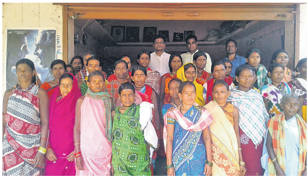
ବିଧାୟକଙ୍କୁ ଭେଟିବାକୁ ଆସିଥିବା ମହିଳାମାନେ।