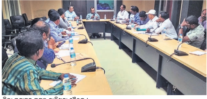
ଜିଲ୍ଲା ପ୍ରଶାସନ ପକ୍ଷରୁ ଚାଲିଥିବା ବୈଠକ ।

ସହ ୧୮ ବର୍ଷରୁ କମ୍ ବିଦ୍ୟାଳୟ ମାନେ ଏଥିରେ ଅଂଶଗ୍ରହଣ କରିବେ । ସେମାନଙ୍କ ମଧ୍ୟରେ ଗୀତ, ନାଟ, ଚିତ୍ରାଙ୍କନ, ବକ୍ତୃତା ଏବଂ କ୍ରୀଡା ପ୍ରତିଯୋଗିତା ହେବ । କ୍ରୀଡା ପ୍ରତିଯୋଗିତାକୁ ପୁରସ୍କୃତ କରାଯିବ । ମାଲକାନଗିରି ଜିଲ୍ଲା ପ୍ରଶାସନଙ୍କ ସହ ପୌର ପରିଷଦ ଏବଂ ମାଲକାନଗିରି ବ୍ଲକ ମିଳିତ ଭାବେ ଏହି କାର୍ଯ୍ୟକ୍ରମ କରିବେ ବୋଲି ବୈଠକରେ ନିଷ୍ପତ୍ତି ନିଆଯାଇଛି ।